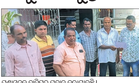
ପ୍ରଶାସନକୁ ଦାବିପତ୍ର ପ୍ରଦାନ କରାଯାଇଛି।