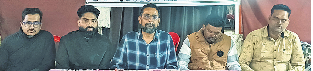
ପବିତ୍ରନଗର, ୨୮.୧୧ (ନିରୋଧ କୁମାର ପ୍ରଧାନ)

ଜାତୀୟ ଜନଜାତି ମହୋତ୍ସବ ଆୟୋଜନ ସମ୍ପର୍କରେ ଖବରଦାତା ସମ୍ମିଳନୀରେ କର୍ମକର୍ତ୍ତାମାନେ ସୂଚନା ଦେଇଛନ୍ତି। ଅନୁଗୋଳ, ୨୮.୧୧ (ମାନବ ବିଶ୍ୱାଳ)