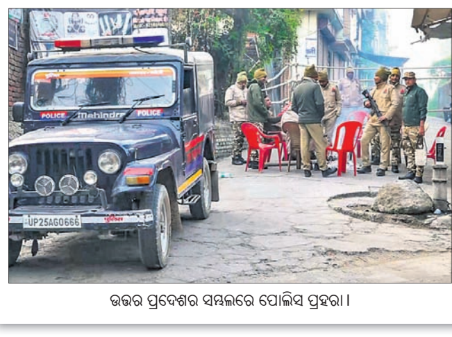
ଉତ୍ତର ପ୍ରଦେଶର ସମ୍ବଳରେ ପୋଲିସ୍ ପ୍ରହର।