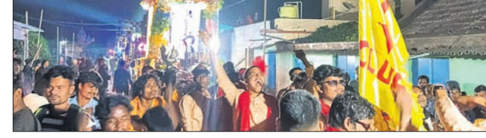
ଅନୁଗୋଳ, ୨୮.୧୧ (ମାନବ ବିଶ୍ୱାଳ)

ଦିନ ଧରି ପୂଜା ପାଠକ ପରେ ମହାପ୍ରଭୁ ଅନୁଗୋଳ ଜିଲାର ବିଜିନ ଗ୍ରାମରେ ମହାପ୍ରଭୁ କାର୍ତ୍ତିକେୟଙ୍କୁ ବିଦାୟ ଦିଆଯାଇଛି। ଭସାଣି ଶୋଭାଯାତ୍ରାରେ ଆକର୍ଷଣୀୟ ତିଳେ, ବେନେ ଗୁରୁବାର ଭସାଣି ଶୋଭାଯାତ୍ରା କରାଯାଇଛି।