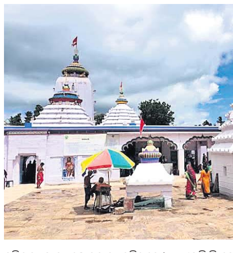
ମନ୍ଦିରକୁ ଯାଇ ଖୋଳତାଡ଼ କରିଥିଲେ । ଖୋଳତାଡ଼ ସମୟରେ ଏକ ଅଖା ଭିତରେ ମା' ବିରଜାଙ୍କ ପ୍ରକୃତ ବିଗ୍ରହ (ମୂର୍ତ୍ତି)କୁ ମନ୍ଦିର ପରିସରରେ ଥିବା ଏକ ସୁଡ଼ଙ୍ଗରୁ ଉଦ୍ଧାର କରାଯାଇଥିଲା । ଏହି ଘଟଣା ଆଖି ପିଛୁଳାରେ ପ୍ରଚାର ହୋଇଥିବା ପରେ ସହରରେ ପ୍ରକଳ୍ପ ଉଦ୍ଧେଷ୍ୟ ପ୍ରକାଶ ପାଇଥିଲା । ଉତ୍ତମ ଲୋକେ ରାସ୍ତାବନ୍ଧନେ ଓ ପୋଡ଼ାଜଳା କରିଥିଲେ ।