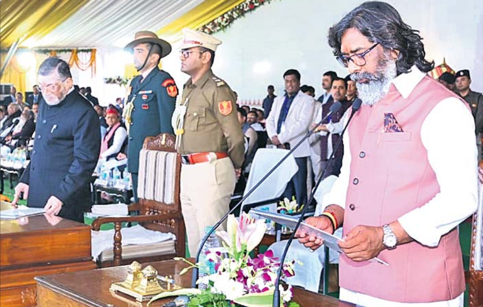
ଝାଡ଼ଖଣ୍ଡ ମୁକ୍ତି ମୋର୍ଚ୍ଚା (କେଏମ୍‌ଏମ୍) ନେତା ହେମନ୍ତ ସୋରେନ୍ ଗୁରୁବାର ରାଷ୍ଟ୍ର ମୋରାବାଦୀ ମଇଦାନରେ ଚତୁର୍ଥ ଥର ପାଇଁ ମୁଖ୍ୟମନ୍ତ୍ରୀ ଭାବେ ଶପଥ ନେଇଛନ୍ତି। (ରିପୋର୍ଟ: ପୃଷ୍ଠା-୧୨)