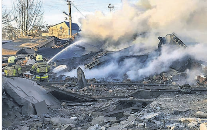
ରାଷ୍ଟ୍ରପତି ଭୋଲୋଡିମିର ଜେଲେନସ୍କି କହିଛନ୍ତି। ଶୀତଦିନେ ଅଧିକ ଆକ୍ରମଣ ପାଇଁ ମଧ୍ୟେ ବହୁସଂଖ୍ୟାରେ ଜୁର୍ ବାଲିଷ୍ଟିକ ମିଶାଇଲ ଗଢ଼ିତ କରି