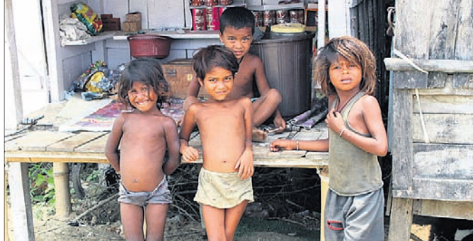
ଏବଂ ୫.୨ ପ୍ରତିଶତ କାର୍ଯ୍ୟଶୀଳ। ଉପଯୁକ୍ତ ପୋଷଣ ଅଭାବରୁ ଏଭଳି ସମସ୍ୟା ଦେଖାଦେଇଛି। ୨୦୨୧ରେ ୬ ବର୍ଷ ବୟସ

ଦେଶର ଅଜନପ୍ରିତିକୁ ନେଇ ନାମ ଲେଖାଯିବା ୫ ବର୍ଷରୁ କମ୍ ବୟସର ଶିଶୁମାନଙ୍କ ମଧ୍ୟରୁ ୩୮.୯ ପ୍ରତିଶତ ଉପଯୁକ୍ତ ବିକଶିତ ହୋଇ ନ ଥିବା କେନ୍ଦ୍ର ସରକାର ରାଜ୍ୟ ସଭାରେ କହିଛନ୍ତି। ଏକ ପ୍ରଶ୍ନର ଉତ୍ତରରେ ମହିଳା ଓ ଶିଶୁ ବିକାଶ ଡାକ୍ତରୀ ସାହିତ୍ୟ ଠାକୁର କହିଥିଲେ, ଅଜନପ୍ରିତିରେ ଭିତ୍ତି ହୋଇଥିବା ୬.୫୪ କୋଟି ପିଲାଙ୍କୁ ପୋଷଣ ଗ୍ରାହକରେ ରଖାଯାଇଛି। ସେମାନଙ୍କ ମଧ୍ୟରୁ ୬.୩୧ କୋଟିକୁ ଅଭିଭୂକ ପାରାମିଟରରେ ମାପ କରାଯାଇଥିବାବେଳେ ୩୮.୯ ପ୍ରତିଶତ ଅଭିଭୂକ, ୧୭ ପ୍ରତିଶତ କମ୍ ଓକ୍ତ ବିଶିଷ୍ଟ