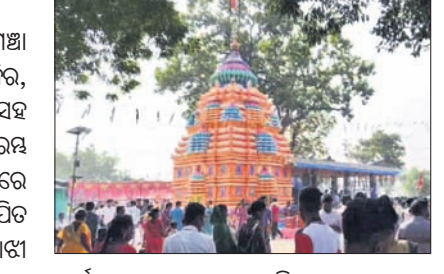
ସୂର୍ଯ୍ୟପୂଜା, ବାସୁ ପୂଜା, ଅଗ୍ନିସ୍ଥାପନ, ଯଜ୍ଞକମ ଆଦି କରାଯିବାପରେ ନୂତନ ମନ୍ଦିରରେ ପାର୍ଶ୍ୱ ଦେବଦେବୀଙ୍କ ସ୍ଥାପନା କରାଯାଇଥିଲା।

ଛେଡ଼ିପଦା, ୨୮.୧୧ (ଅଜିତ ଧଳ) ଛେଡ଼ିପଦା ବ୍ଲକ ଗାଁରେ ପଞ୍ଚାୟତ ବାରମାଞ୍ଚା ଗ୍ରାମରେ ମା' ଉମାଦେବୀଙ୍କ ନୂତନ ମନ୍ଦିର, ବିଗ୍ରହ ପ୍ରତିଷ୍ଠା ଓ ସ୍ତମ୍ଭ କାର୍ଯ୍ୟ ଶୁଭକାର ସହ ସମାପନ ହୋଇଛି।