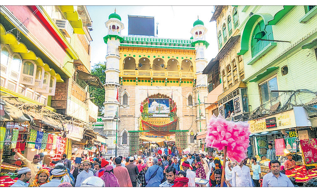
ରାଜସ୍ଥାନର ଅଜମେରସ୍ଥିତ ସୁଫି ସଭ୍ୟ ମୋଜୁଦ୍ଦିନ ତିପ୍ପୁକ ସମାଧି ବାହାରେ ଲୋକଙ୍କ ଭିଡ଼।