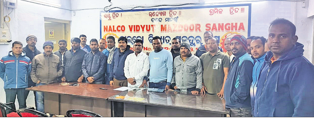
ବିଦ୍ୟୁତ୍ ମଜଦୁର ସଂଘର ଚୟନ ହୋଇଥିବା ନୂତନ କର୍ମକର୍ତ୍ତାମାନେ।

କର୍ମକର୍ତ୍ତାଙ୍କୁ ରେଳାଳି ପୋଲିସ୍ କାମରାଜପଥକୁ ଗୁରୁବାର ୮ ପେଟି ବିବେଶୀ ମଦ ଜବତ କରିବା ସହ ଜଣକୁ ଗିରଫ କରିଛି। ସୂଚନା ଅନୁଯାୟୀ, ବକ୍ସକୋଟ ପଟୁ ରେଳାଳି ଆଡକୁ ଆସୁଥିବା ଏକ ଅଟୋରେ ବିବେଶୀ ମଦ ଚାଲାଣ ହେଉଥିବା ଖବରପାଇ ଶେଖାଲ ଷ୍ଟାଡ଼ ବକ୍ସକୋଟ ନିକଟରେ ଅଟୋକୁ ଅଟକାଇ ଯାଞ୍ଚ କରିବା ସହ ୮ ପେଟି ମଦ ଜବତ କରିଥିଲା।