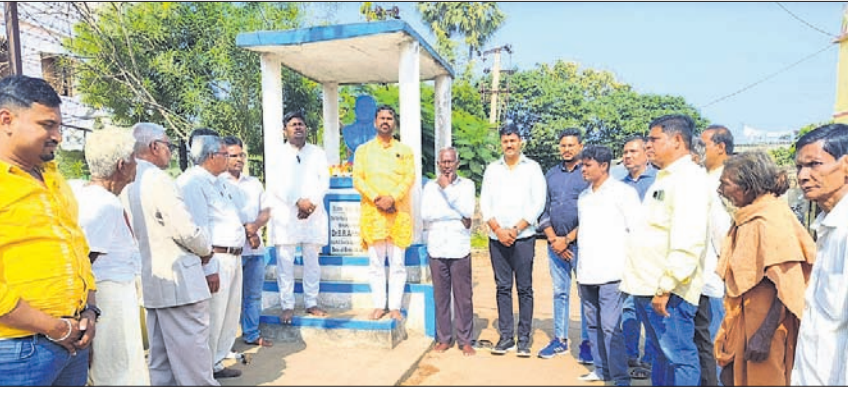
ବାବା ସାହେବଙ୍କୁ ଶ୍ରଦ୍ଧାଞ୍ଜଳି ଅର୍ପଣ କରାଯାଇଛି।