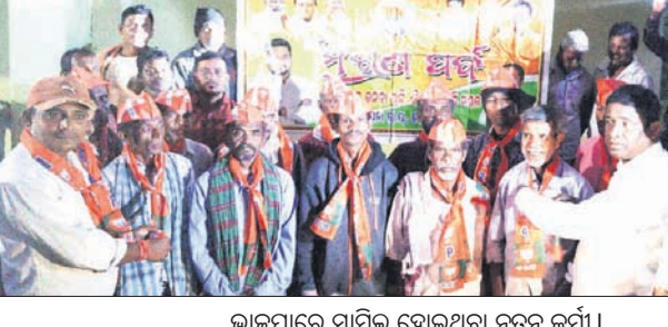
ଭାଜପାରେ ସାମିଲ ହୋଇଥିବା ନୂତନ କର୍ମୀ।