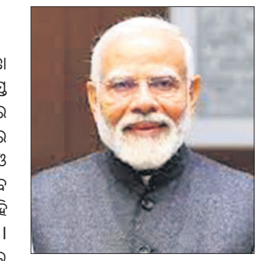
ପ୍ରଧାନମନ୍ତ୍ରୀ ନରେନ୍ଦ୍ର ମୋଦି।

ପ୍ରଧାନମନ୍ତ୍ରୀ ନରେନ୍ଦ୍ର ମୋଦି ଆସନ୍ତା ୨୯ରୁ ୩ ଦିନିଆ ଓଡ଼ିଶା ଗସ୍ତ କାର୍ଯ୍ୟକ୍ରମରେ ଆସୁଛନ୍ତି। ଏଠାରେ ୪୮ଦଣ୍ଡା ଆସନ୍ତା ପ୍ରଧାନମନ୍ତ୍ରୀ ଉଭୟ ଦଳୀୟ ଓ ସରକାରୀ କାର୍ଯ୍ୟକ୍ରମ ସମାପ୍ତ କରିବେ ବୋଲି ଜଣାପଡ଼ିଛି।