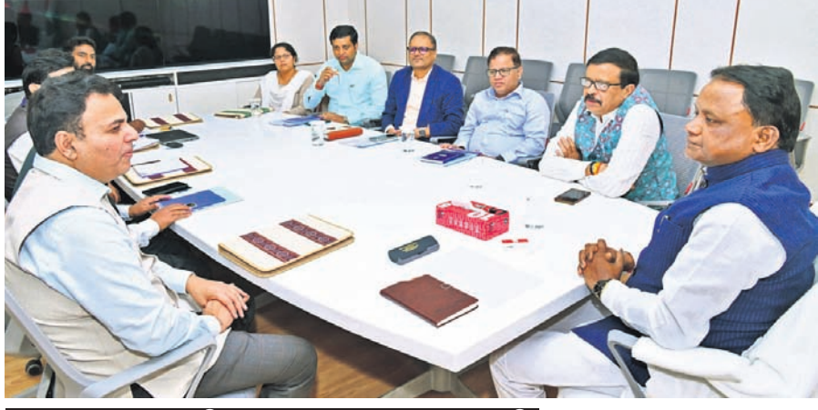
ମୁଖ୍ୟମନ୍ତ୍ରୀଙ୍କୁ ଭେଟିଲେ ବାତ୍ୟା 'ଦାନା' କ୍ଷୟକ୍ଷତି ଆକଳନ ପାଇଁ ଆସିଥିବା କେନ୍ଦ୍ରୀୟ ଟିମ୍