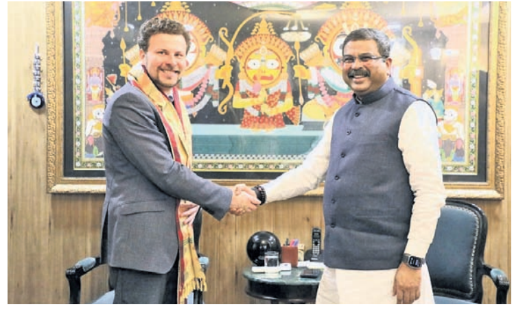
ଭୁବନେଶ୍ୱର, ୨୬.୧୧ (ସୁନିର୍ଦ୍ଧାରିତ) କେନ୍ଦ୍ରମନ୍ତ୍ରୀ ଧର୍ମେନ୍ଦ୍ର ପ୍ରଧାନ ମଙ୍ଗଳବାର ମାଲଡୋଭାର ଶିକ୍ଷା ଏବଂ ଗବେଷଣା ମନ୍ତ୍ରୀ ଡା. ପର୍ଯ୍ୟନ୍ତ ଏବଂ ରାଷ୍ଟ୍ରପତି ଆନା ଟରାନଙ୍କୁ ସାକ୍ଷାତ ଆଲୋଚନା କରିଛନ୍ତି।

ଏହି ଆଲୋଚନା କାଳରେ ଉଭୟ ଦେଶର ଉଚ୍ଚ ଶିକ୍ଷାନୁଷ୍ଠାନଗୁଡ଼ିକ ମଧ୍ୟରେ ଶୈକ୍ଷିକ ଏବଂ ଗବେଷଣା ସହଯୋଗକୁ ସୁରମ କରିବା ଉପରେ ଫଳପ୍ରସ୍ତ ଆଲୋଚନା ହୋଇଛି। ବିଠିକ ସମୟରେ ଧର୍ମେନ୍ଦ୍ର ଜାତୀୟ ଶିକ୍ଷାନୀତି ଉପରେ ଚର୍ଚ୍ଚା କରିବା ସହ ଭାରତର ଶିକ୍ଷାକୁ ଅନ୍ତର୍ଜାତୀୟକରଣ ପାଇଁ ହେଉଥିବା ଉଦ୍ୟମ ସମ୍ପର୍କରେ ସୁଚନା ଦେଇଛନ୍ତି। ବିଶ୍ୱର ଶ୍ରେଷ୍ଠ ବିଶ୍ୱବିଦ୍ୟାଳୟଗୁଡ଼ିକ ପାଇଁ ଭାରତ ନୂଆ ଠିକଣା ହୋଇଛି। ମାଲଡୋଭା ଓ ଭାରତର ଛାତ୍ରାଛାତ୍ର, ଅଧ୍ୟାପକ, ଗବେଷକ, ଉତ୍ସାହ ଏବଂ କର୍ମଚାରୀଙ୍କ ପାଇଁ ନୂତନ ସୁଯୋଗ ଅନୁଷ୍ଠାନ କରିବା ପାଇଁ ସହଯୋଗ ଓ ବୃତ୍ତିକାଳ ପ୍ରଦାନ କରିବାକୁ ମଙ୍ଗଳ ପ୍ରଦାନ କରିଛନ୍ତି।