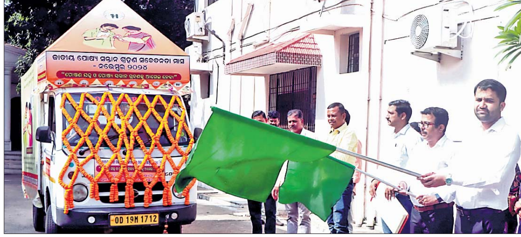
ଅନୁଗୋଳ, ୨୬।୧୧ (ମାନସ ବିଶ୍ୱାଳ)

ଅନୁଗୋଳ ଜିଲ୍ଲାପାଳଙ୍କ ଅଧିକାରୀଙ୍କ ପରିସରରେ ଯୋଷ୍ୟ ସଜ୍ଜାନ ସଚେତନତା ମାସ ପାଳନ ଅବସରରେ ଯୋଷ୍ୟ ସଜ୍ଜାନ ସଚେତନତା ରଥର ମଙ୍ଗଳାବାର ଶୁଭାରମ୍ଭ କରାଯାଇଛି। ଅଧ୍ୟକ୍ଷ ଶିଶୁ ଯୋଷ୍ୟ ସଜ୍ଜାନ ଭାବେ ଆପଣେଇବା ଏବଂ ଏପରି ମହତ କାର୍ଯ୍ୟରେ ଜନସାଧାରଣଙ୍କ ସହଯୋଗ