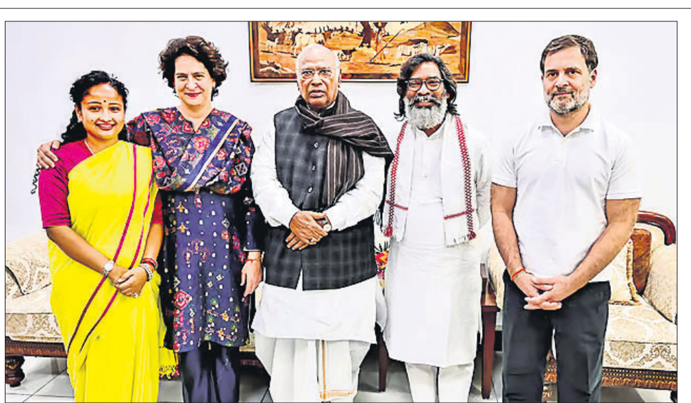
ଝାଡ଼ଖଣ୍ଡ ମୁଖ୍ୟମନ୍ତ୍ରୀ ଭାବେ ଗୁରୁତାର ଶପଥ ନେବାକୁ ଯାଉଥିବା ହେମନ୍ତ ସୋରେନ୍ ଏବଂ ସ୍ତ୍ରୀ ତଥା ଜ୍ୟେମ୍‌ଏମ୍ ନେତ୍ରୀ କଳ୍ପନା ସୋରେନ୍ ମଞ୍ଜୁରୀରେ ଲୋକ ସଭାର ବିରୋଧୀ ଦଳ ନେତା ରାହୁଲ ଗାନ୍ଧୀ, କଂଗ୍ରେସ ଅଧ୍ୟକ୍ଷ ମଲ୍ଲିକାର୍ଜୁନ ଖର୍ଚେ ଏବଂ ପ୍ରିୟଙ୍କା ଗାନ୍ଧୀଙ୍କୁ ଭେଟୁଛନ୍ତି।