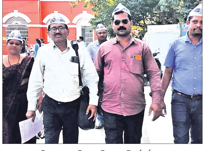
ଦାବିପତ୍ର ପ୍ରଦାନ କରିବାକୁ ଆସିଥିବା ଏଏପି କର୍ମକର୍ତ୍ତାମାନେ।

ଅନୁଗୋଳ, ୨୬।୧୧ (ମାନସ ବିଶ୍ୱାଳ): ଅନୁଗୋଳ ଜିଲ୍ଲା ଆମ୍ ଆଦମୀ ପାର୍ଟି (ଏଏପି) ପକ୍ଷରୁ ବିଦ୍ୟୁତ୍ ଦେୟ ବୃଦ୍ଧି ଓ ବନଭିତ୍ତିକ ଜନସ୍ୱାସ୍ଥ୍ୟ ବିରୋଧୀ ନୀତିକୁ ବିରୋଧ କରି ମଙ୍ଗଳାବାର ମୁଖ୍ୟମନ୍ତ୍ରୀଙ୍କ ଉଦ୍ଦେଶ୍ୟରେ ଏକ ଦାବିପତ୍ର ଜିଲ୍ଲାପାଳଙ୍କୁ ପ୍ରଦାନ କରାଯାଇଛି। ଏଥିରେ ଦର୍ଶାଯାଇଛି, ଗତ ନିର୍ବାଚନରେ ଭାଜପାର ଛୁଟି ନେତାମାନେ ନିର୍ବାଚନ ପ୍ରକାରରେ ପ୍ରତି ଘରକୁ ୩୦୦ ଯୁନିଟ୍ ଦେଇଥିଲେ। ବିଜୁ ଦେବୀକୁ ପ୍ରତିଷ୍ଠିତ ହୋଇଥିଲେ। କିନ୍ତୁ ସରକାର ଗଠନର ୬ ମାସ ବିତି ଯାଇଥିଲେ ମଧ୍ୟ ଭାଜପା ସରକାର ପ୍ରତିଷ୍ଠିତ ପୁରଣ କରିବା ପରିବର୍ତ୍ତେ କମ୍ପାନୀ ଦ୍ୱାରା ସ୍ମାର୍ଟ ମିଟର ବସାଇ ଅତିରିକ୍ତ ୬ ହଜାର ଟଙ୍କା ଆଦାୟ ଯୋଜନା କରୁଛି। ସ୍ମାର୍ଟ ମିଟରରେ ପ୍ରିପେଡ ବିଶ୍ୱମ୍ପ ଥିବାରୁ ଗରିବ ଓ ମଧ୍ୟବିତ୍ତ ଉପଭୋକ୍ତାମାନେ ଠିକ୍ ସମୟରେ ବିଦ୍ୟୁତ୍ ଦେୟ ଦେଇପାରିବେ ନାହିଁ। ଫଳରେ ଲାଲନ କର୍ତ୍ତୃ ସମ୍ପୂର୍ଣ୍ଣ ଅନୁଗୋଳ ହୋଇ ବହୁ ଅସୁବିଧାରେ ପଡ଼ିବେ। ଆମ୍ ଆଦମୀ ପାର୍ଟି ସରକାର ଦିଲ୍ଲୀରେ ୨୦୦ ଯୁନିଟ୍ ଓ ପଞ୍ଜାବରେ ୩୦୦ ଯୁନିଟ୍ ବିଦ୍ୟୁତ୍ ଦେୟ ଛାଡ଼ି କରୁଥିବା ବେଳେ ବିଦ୍ୟୁତ୍ ବକଳା ରାଜ୍ୟ ଓଡ଼ିଶାରେ କାହିଁକି ଏହା