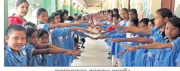
ଛାତ୍ରାଛାତ୍ରୀମାନେ ଶପଥପାଠ କରୁଛନ୍ତି।