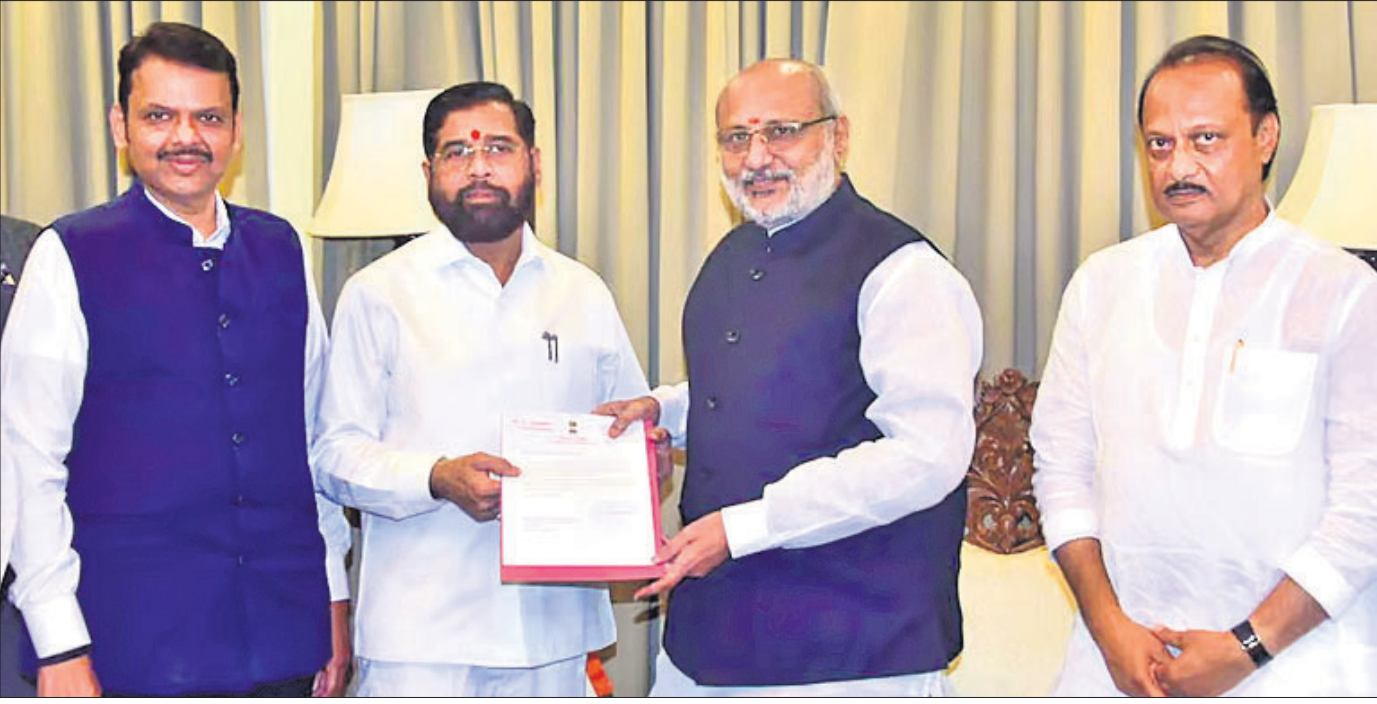
ରାଜ୍ୟପାଳ ସି.ପି. ରାଧାକୃଷ୍ଣନ ମହାରାଷ୍ଟ୍ର ମୁଖ୍ୟମନ୍ତ୍ରୀ ଏକନାଥ ଶିନ୍ଦେଙ୍କଠାରୁ ଇସ୍ତଫାପତ୍ର ଗ୍ରହଣ କରୁଛନ୍ତି। ନିକଟରେ ଭାଜପା ନେତା ଦେବେନ୍ଦ୍ର ଫଡ଼ନବିସ୍ ଏବଂ ଏନ୍‌ସିପି ନେତା ଅଜିତ ପାଞ୍ଜାର ଉପସ୍ଥିତ ଅଛନ୍ତି।