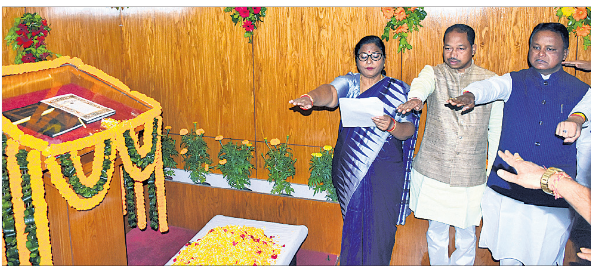
ବିଧାନସଭା ପରିସରରେ ସମ୍ବିଧାନ ଦିବସ ଅବସରରେ ଓଡ଼ିଶା ବିଧାନସଭା ବାଚସ୍ପତି ସୁରମା ପାଢ଼ୀ, ଉପ ବାଚସ୍ପତି ଭବାନୀ ଶଙ୍କର ଭୋଇ ଏବଂ ମୁଖ୍ୟମନ୍ତ୍ରୀ ମୋହନ ଚରଣ ମାଝୀ ଶପଥପଠା କରୁଛନ୍ତି।