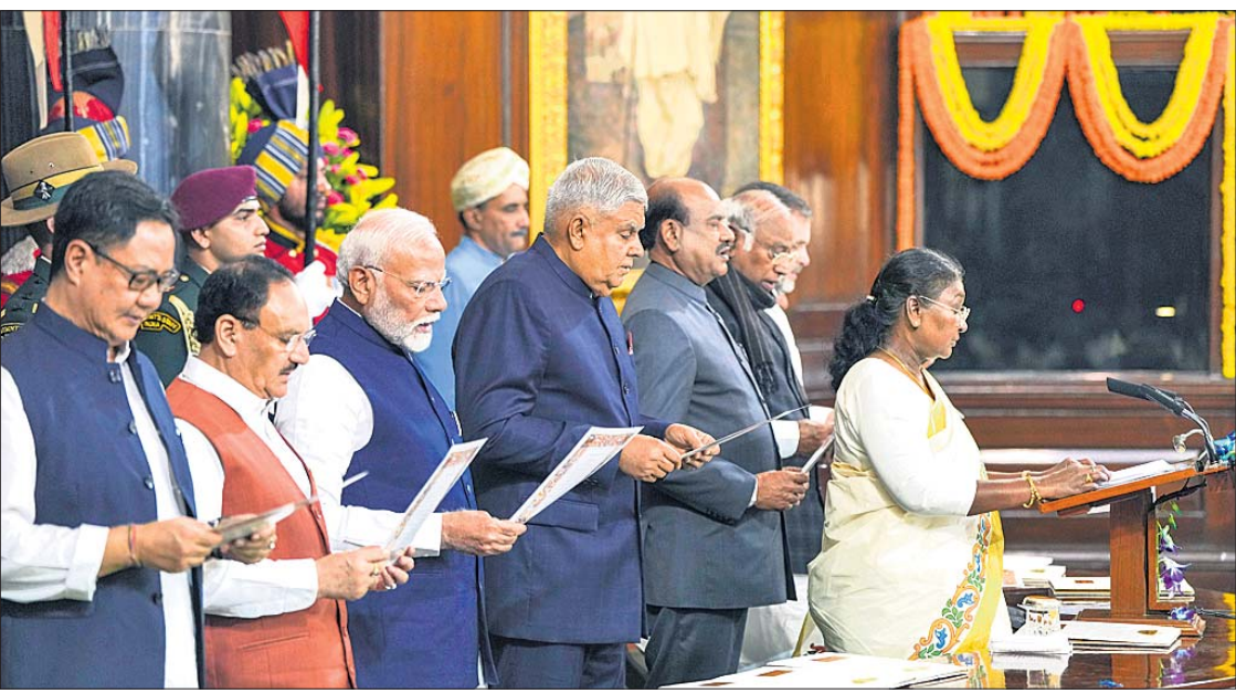
ପାଇଁମେଣ୍ଟର ସେଣ୍ଟ୍ରାଲ ହଲ୍ରେ ମଙ୍ଗଳବାର ସମିଧାନ ବିବେଚନା ପାଇଁ ଅବସରରେ ରାଷ୍ଟ୍ରପତି ଦ୍ରୌପଦୀ ମୁର୍ମୁ, ଉପରାଷ୍ଟ୍ରପତି ଜଗଦିପା ଧନକର, ପ୍ରଧାନମନ୍ତ୍ରୀ ନରେନ୍ଦ୍ର ମୋଦି, ଲୋକ ସଭା ବାଚସ୍ପତି ଓମ୍ ବିଲା, ରାଜ୍ୟ ସଭାରେ ବିରୋଧୀ ଦଳ ନେତା ମଲ୍ଲିକାର୍ଜୁନ ଖାରଣ ଓ ଲୋକ ସଭାର ବିରୋଧୀ ଦଳ ନେତା ରାହୁଲ ଘାଷ୍ଟି, କେନ୍ଦ୍ର ମନ୍ତ୍ରୀ ଡେ.ପି. ନକ୍ସା ଏବଂ କିରେନ୍ ରିଜ୍ଜୁ ସମିଧାନର ମୁଖ୍ୟବନ୍ଧ ପାଠ କରୁଛନ୍ତି।

ଅଭିନେତା କାର୍ତ୍ତିକ ଆର୍ଯ୍ୟଙ୍କ 'ଭୁଲ୍ ଭୁଲେୟା ଗ' ଚଳଚ୍ଚିତ୍ର ବିଶ୍ୱବ୍ୟାପୀ ୪୦୮.୫୨ କୋଟି ବକ୍ସର ରୋଜଗାର କରିସାରିଛି।