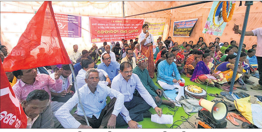
ଜିଲ୍ଲାପାଳଙ୍କ ଅଫିସ୍ ସମ୍ମୁଖରେ ଗଣଧାରଣା ଦିଆଯାଇଛି।

କେନ୍ଦ୍ର ସରକାରଙ୍କ ଜନବିରୋଧୀ ନୀତି ବିରୋଧରେ ମଞ୍ଜୁରୀର ଭବାନୀପାଟଣା ଜିଲ୍ଲାପାଳଙ୍କ ଅଫିସ୍ ସମ୍ମୁଖରେ ଜିଲ୍ଲାର ବିଭିନ୍ନ ସଙ୍ଗଠନ ପକ୍ଷରୁ ଗଣଧାରଣା ଦିଆଯାଇଛି। କକାହାଡ଼ି ଜିଲ୍ଲା କେନ୍ଦ୍ରୀୟ ଟ୍ରେଡ଼ ୟୁନିଅନ, ସ୍ୱାଧୀନ ଫେଡେରେଶନର ମିଳିତ ମଞ୍ଚ ଓ ସଂଯୁକ୍ତ କିଷାନ ମୋର୍ଚ୍ଚା, ମା' ମାଟି ମାଲି ପୁରୁଷା ମଞ୍ଚ ପକ୍ଷରୁ ୨୬ ଦିନୀ ଦାବିପତ୍ର ରାଷ୍ଟ୍ରପତିଙ୍କ ଉଦ୍ଦେଶ୍ୟରେ ଜିଲ୍ଲାପାଳଙ୍କୁ ପ୍ରଦାନ କରାଯାଇଛି। ଦରବୁକ୍ତି ରୋକିବା, କୃଷିଜାତୀୟ ବ୍ୟବସାୟ ଉପରେ ଜିଏସ୍‌ଟି ପ୍ରତ୍ୟାହାର, ମାଗଣା ଶିକ୍ଷା, ସମସ୍ତ ଆଦିବାସୀ ଓ ଜଙ୍ଗଲ ଅଧିବାସୀଙ୍କୁ ଜଙ୍ଗଲ ଜମିର ଅଧିକାର ପ୍ରଦାନ, ଲଘୁ ବନଜାତ ବ୍ୟବସାୟ ଠିକ୍ ମୂଲ୍ୟ ପ୍ରଦାନ କରିବା ଆଦି ଦାବି କରାଯାଇଛି। ସେହିପରି କକାହାଡ଼ି