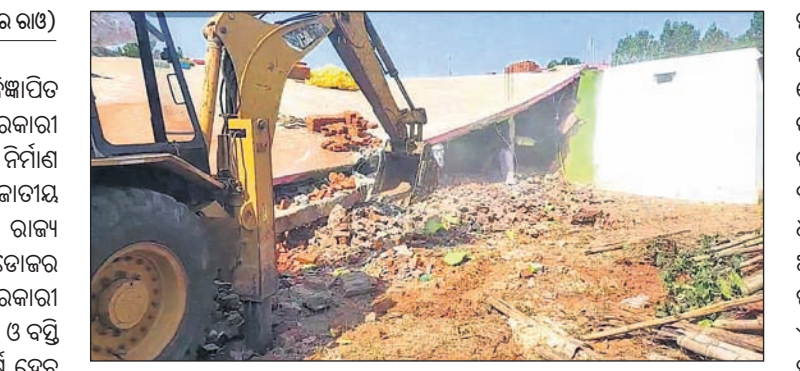
ବୁଲଡୋଜର ଦ୍ୱାରା ବେଆଇନ ଗୃହ ଓ ଡାବା ଭଙ୍ଗାଯାଇଛି ।

କୋରାପୁଟ ଜିଲ୍ଲା କୋଟପାଡ଼ ବିଜ୍ଞାପିତ ପରିଷଦ ଅଞ୍ଚଳ ୩ ସ୍ଥାନର ସରକାରୀ ଜମିରେ ବେଆଇନ ଭାବେ ନିର୍ମାଣ ହୋଇଥିବା ବାସଗୃହ ଓ ଜାତୀୟ ରାଜପଥ ପାର୍ଶ୍ୱର ଡାବାକୁ ରାଜ୍ୟ ସରକାରଙ୍କ ପକ୍ଷରୁ ବୁଲଡୋଜର ବୁଲାଇ ଭଙ୍ଗାଯାଇଛି । ସରକାରୀ ଜାଗାଗୁଡ଼ିକୁ ବେଆଇନ ଅଭିଆର ଓ ବସ୍ତି ସ୍ଥାପନା କରି ଲୋକେ ଦୀର୍ଘ ବର୍ଷ ହେବ ରହିଆସୁଛନ୍ତି । ସହରାଞ୍ଚଳର ଅନେକ ସ୍ଥାନରେ ସରକାରୀ ଜାଗାଗୁଡ଼ିକରେ ବଡ଼ ବଡ଼ କୋଠା ନିର୍ମାଣ ହୋଇଛି । ବର୍ତ୍ତମାନ ଉପଜିଲ୍ଲାପାଳଙ୍କ ନିର୍ଦ୍ଦେଶ କ୍ରମେ ବେଆଇନ ଅଭିଆର କରିଥିବା ସରକାରୀ ଜାଗାଗୁଡ଼ିକ ଖାଲି କରିବାକୁ ରାଜ୍ୟର ସମସ୍ତ ତହସିଲଦାରମାନଙ୍କୁ ନିର୍ଦ୍ଦେଶ ଦିଆଯାଇଛି । ସହରଠାରୁ ୧ କି.ମି. ଦୂର ବ୍ରାମଣ ଦେବୀ ନିକଟସ୍ଥ ଜାତୀୟ ରାଜପଥ ପାର୍ଶ୍ୱରେ ଥିବା ଏକ ବେଆଇନ ଡାବାକୁ ସ୍ଥାନୀୟ ତହସିଲଦାର, ବିଡିଓ ଏବଂ ମାଜିଷ୍ଟ୍ରେଟ ଦାୟିତ୍ୱରେ ଥିବା