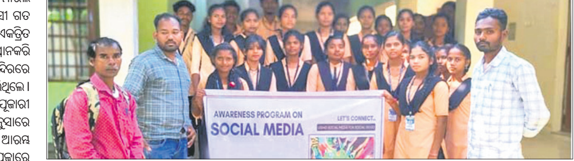
ସଚେତନତା କାର୍ଯ୍ୟକ୍ରମରେ ସାମାଜିକ କଲେଜ ଛାତ୍ରାଛାତ୍ରୀ ଓ ଅନ୍ୟମାନେ ।

ପଢ଼ିଆ, ୨୦୧୧ (ଭାସ୍କର ରାଓ) ପଢ଼ିଆ ମହାବିଦ୍ୟାଳୟରେ ଶ୍ରୀମଙ୍ଗଳ ସଂଗଠନ ଓ ମହିଳା ଶ୍ରୀମଙ୍ଗଳ ସଂଗଠନ ତରଫରୁ ଛାତ୍ରାଛାତ୍ରୀଙ୍କୁ ନେଇ ସାମାଜିକ ଗଣମାଧ୍ୟମ ଉପକାରଣ ଓ ସଂବନ୍ଧସହାୟକ ଉପରେ ଏକ ସଚେତନତା କାର୍ଯ୍ୟକ୍ରମ ଅନୁଷ୍ଠିତ ହୋଇଯାଇଛି । ଏଥିରେ ଶତାଧିକ