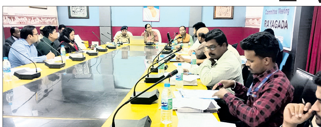
ବୈଠକରେ ଜିଲାପାଳ, ଏସ୍ପି, ପରିବହନ ଅଧିକାରୀ ଏବଂ ଅନ୍ୟମାନେ ଆଲୋଚନା କରୁଛନ୍ତି ।