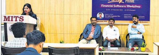
କାର୍ଯ୍ୟକ୍ରମରେ ଉପସ୍ଥିତ ଅତିଥି ।