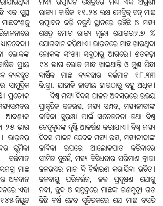
ଦିନରେ ବିଶ୍ୱର ପ୍ରଥମ ମଧ୍ୟ ଉତ୍ପାଦନକାରୀ ଦେଶ ହେବାର ଉଦ୍ୟମ ଜାରିରଖିଛି । ସେହିପରି ଓଡ଼ିଶା ମଧ୍ୟ ଉତ୍ପାଦନ କ୍ଷେତ୍ରରେ ମଧ୍ୟ ଏକ ଅଗ୍ରଣୀ ରାଜ୍ୟ । ବାର୍ଷିକ ୧୧.୨୪ ଲକ୍ଷ ମେଟ୍ରିକ୍ ଟନ୍ ମାଛ ଉତ୍ପାଦନ କରି ତତୁଥ ସ୍ଥାନରେ ରହିଛି ଓ ମଧ୍ୟ କ୍ଷେତ୍ର ମୋଟ ରାଜ୍ୟ ମୂଲ୍ୟ ଯୋଗର ୨.୭ % ଯୋଗଦାନ କରିଥାଏ । ଭାରତରେ ମାଛ ଖାଉଥିବା ଲୋକଙ୍କ ସଂଖ୍ୟା ସବୁଠାରୁ ଆଗରେ । ଶତକଡ଼ା ୯୪ ଭାଗ ଲୋକ ମାଛ ଖାଇଥାନ୍ତି ଓ ମୁଖ୍ୟ ପିଛା ବାର୍ଷିକ ମାଛ ବ୍ୟବହାର ବର୍ତ୍ତମାନ ୧୮.୩୩ କି.ଗ୍ରା. ଯାହାକି ଜାତୀୟ ହାରଠାରୁ ବହୁ ଅଧିକ । ବିଶ୍ୱ ମଧ୍ୟ ଦିବସ ପାଳନ ଅବସରରେ ଉଚ୍ଚମ ପ୍ରାକୃତିକ ଜଳଭଣ୍ଡ, ମଧ୍ୟ ସମ୍ପଦ, ମଧ୍ୟମାଣ୍ଡଳ ଜୀବିକା ସୁରକ୍ଷା ପାଇଁ ସଚେତନତା ତଥା ବିଶ୍ୱ ନେତୃତ୍ୱରୁଦ୍ଧି ଆକର୍ଷଣ