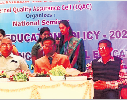
ପାଠଚକ୍ରରେ ଉପସ୍ଥିତ ଅତିଥି ଓ ଛାତ୍ରାଛାତ୍ରୀ ।