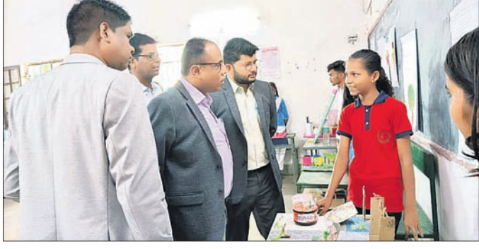
ଅତିଥିମାନେ ପ୍ରକଳ୍ପ ରୁଚି ଦେଖୁଛନ୍ତି ।