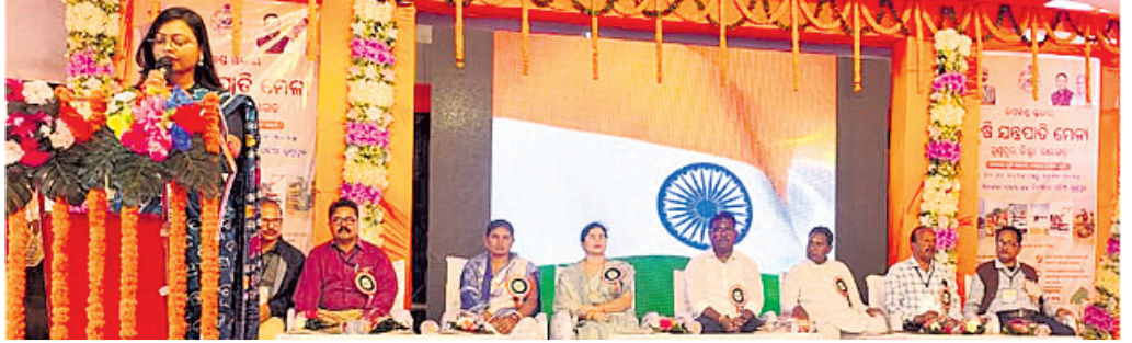
କାର୍ଯ୍ୟକ୍ରମରେ ଉପସ୍ଥିତ ଅତିଥି ।