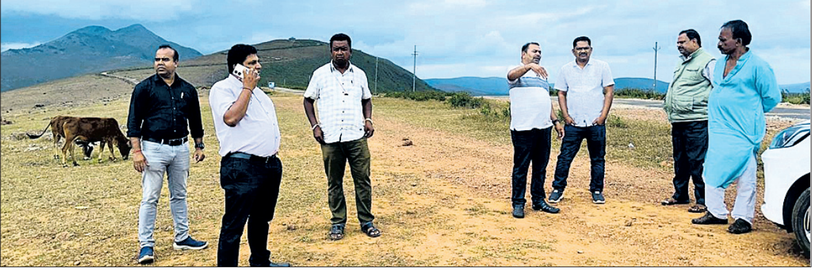
ବିଡିଓ ଏବଂ ଅନ୍ୟମାନେ ପରବ ଉଦ୍‌ଘାଟନା ନେଇ ଦେଖିବାରେ ଲାଗି ବିକ୍ଟର କରୁଛନ୍ତି ।

ପଞ୍ଚାଳି, ୨୦।୧୧ (ଶରତ ଧଳ) କୋରାପୁଟ ଜିଲ୍ଲା ପଞ୍ଚାଳି ବ୍ଲକ୍ ପ୍ରଶାସନ ପକ୍ଷରୁ ଜାତୀୟସ୍ତରୀୟ ଅଭିବ୍ୟାସୀ ମହୋତ୍ସବ ପରବ ପ୍ରସ୍ତୁତି ଅନ୍ତିମ ପର୍ଯ୍ୟାୟରେ ପହଞ୍ଚିଛି । ଅତିଥିମାନଙ୍କ ଦ୍ୱାରା ବୁକ୍ସରୀୟ ଉଦ୍‌ଘାଟନା ହେବା ପାଇଁ ପଦକ୍ଷେପ ଗ୍ରହଣ କରାଯାଇଛି ।