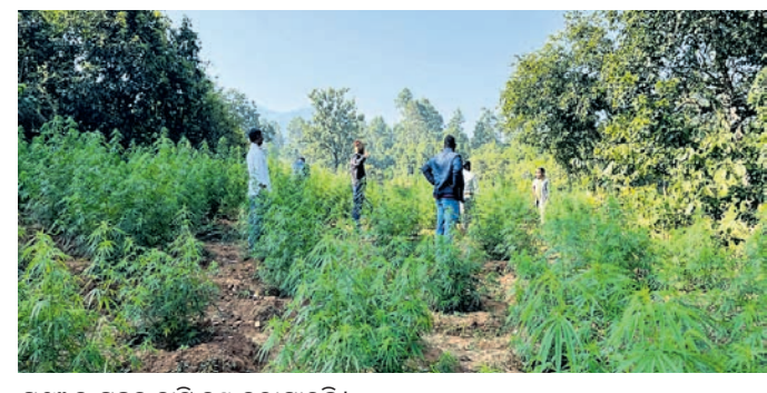
ଗଞ୍ଜେଇ ଗଛକୁ କାଟି ନଷ୍ଟ କରାଯାଇଛି ।

ମାଲକାନଗିରି ଜିଲ୍ଲା ଅବକାରୀ ବିଭାଗ ତରଫରୁ ମାଥିଲି ଥାନା ଅନ୍ତର୍ଗତ ମାତୃକାପଦର ପଞ୍ଚାୟତ ଶୁକ୍ରିପୁଟ ଗ୍ରାମ ନିକଟ ଜଙ୍ଗଲରେ ବୁଧବାର ଚଢ଼ାଇ କରାଯାଇ ପ୍ରାୟ ୨୪ ଏକର ଜମିରେ ଗଞ୍ଜେଇ ଗଛ କାଟି ନଷ୍ଟ କରାଯାଇଛି । ପ୍ରାୟ ୩୬୫ଟି ଗଛ ନଷ୍ଟ କରାଯାଇଥିବା ବେଳେ ଏହାର ଆର୍ଥିକାନ୍ତକ ପୂର୍ଣ୍ଣ ପ୍ରାୟ ୬୦ ଲକ୍ଷ ଟଙ୍କା ହେବ ବୋଲି ଅବକାରୀ ବିଭାଗ ପକ୍ଷରୁ ସୂଚନା ଦିଆଯାଇଛି । ଏ ନେଇ ମାଥିଲି ଅବକାରୀ ଥାନାରେ ଏକ ମାମଲା ରୁଜୁ କରାଯାଇ