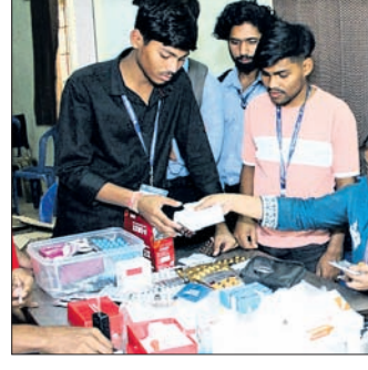
ସ୍ୱାସ୍ଥ୍ୟ ଶିବିରରେ ଶ୍ରେଷ୍ଠ ଦିଆଯାଇଛି ।