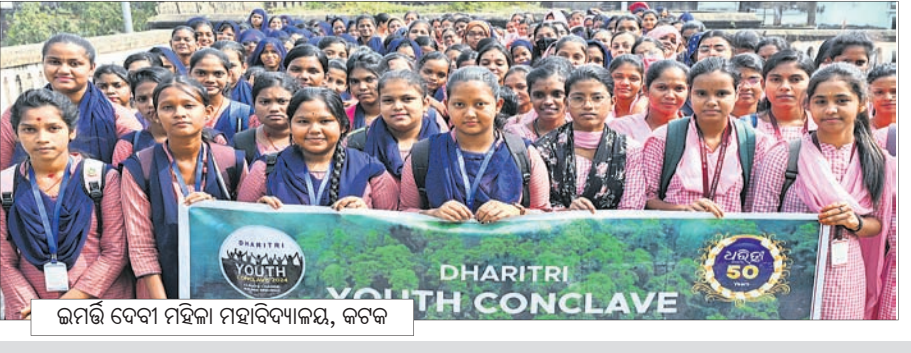
ଇମର୍ସିଭି ଦେବୀ ମହିଳା ମହାବିଦ୍ୟାଳୟ, କଟକ