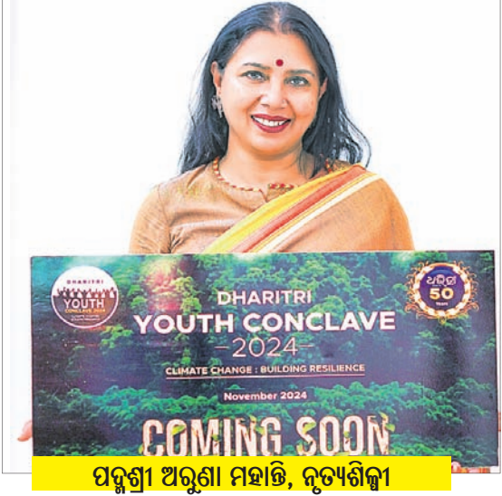
ପଦ୍ମଶ୍ରୀ ଅରୁଣା ମିଶ୍ର, ନୃତ୍ୟଶିଳ୍ପୀ