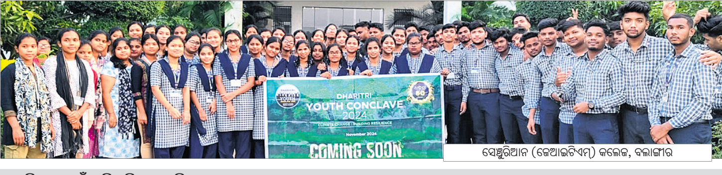
ସେଣ୍ଟ୍ରିଆନ (ଜେଆଇଟିଏମ୍) କଲେଜ, ବଲାଙ୍ଗୀର