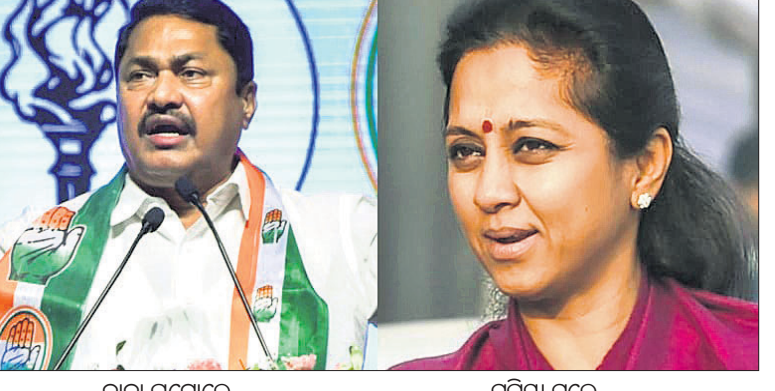
ନାନା ପଟ୍ଟନାୟକ, ସୁପ୍ରିୟା ସୁଲେ

ମହାରାଷ୍ଟ୍ର ନିର୍ବାଚନ ମତଦାନ ମଧ୍ୟରେ ବିଚ୍ଛେଦନକୁ ନେଇ ଭାଜପା ଟାର୍ଗେଟ କରିବା ପଛରେ ବିଚ୍ଛେଦନକୁ ଅଧିକ ଧ୍ୟାନ ଦେବା ପାଇଁ ଭାଜପା ପକ୍ଷରୁ ପ୍ରଚାର ପାରିବାକୁ ଚାହୁଁଛନ୍ତି । ମହାରାଷ୍ଟ୍ର ନିର୍ବାଚନକୁ ପ୍ରଭାବିତ କରିବା ଉଦ୍ଦେଶ୍ୟରେ ବିଚ୍ଛେଦନକୁ ଅଧିକ ଧ୍ୟାନ ଦେବା ପାଇଁ ଭାଜପା ପକ୍ଷରୁ ପ୍ରଚାର ପାରିବାକୁ ଚାହୁଁଛନ୍ତି । ମହାରାଷ୍ଟ୍ର ନିର୍ବାଚନକୁ ପ୍ରଭାବିତ କରିବା ଉଦ୍ଦେଶ୍ୟରେ ବିଚ୍ଛେଦନକୁ ଅଧିକ ଧ୍ୟାନ ଦେବା ପାଇଁ ଭାଜପା ପକ୍ଷରୁ ପ୍ରଚାର ପାରିବାକୁ ଚାହୁଁଛନ୍ତି ।