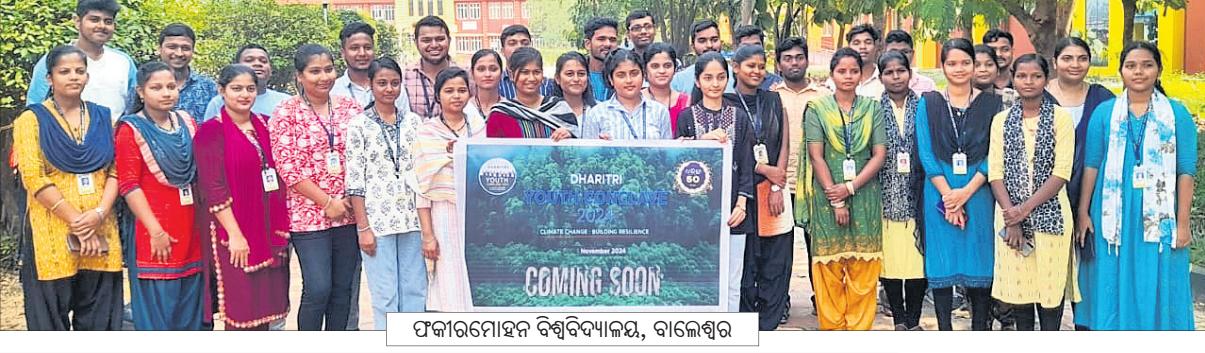
ପଟ୍ଟନାୟକ ବିଶ୍ୱବିଦ୍ୟାଳୟ, ବାଲେଶ୍ୱର