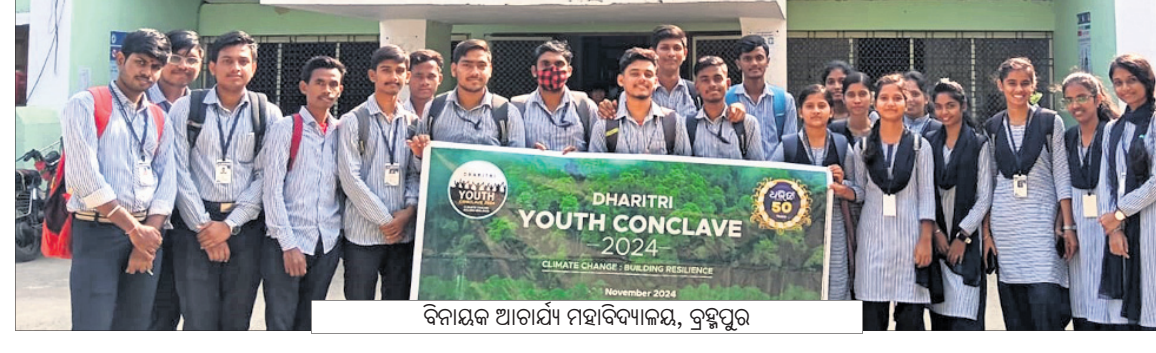
ବିନାୟକ ଆଚାର୍ଯ୍ୟ ମହାବିଦ୍ୟାଳୟ, ବ୍ରହ୍ମପୁର