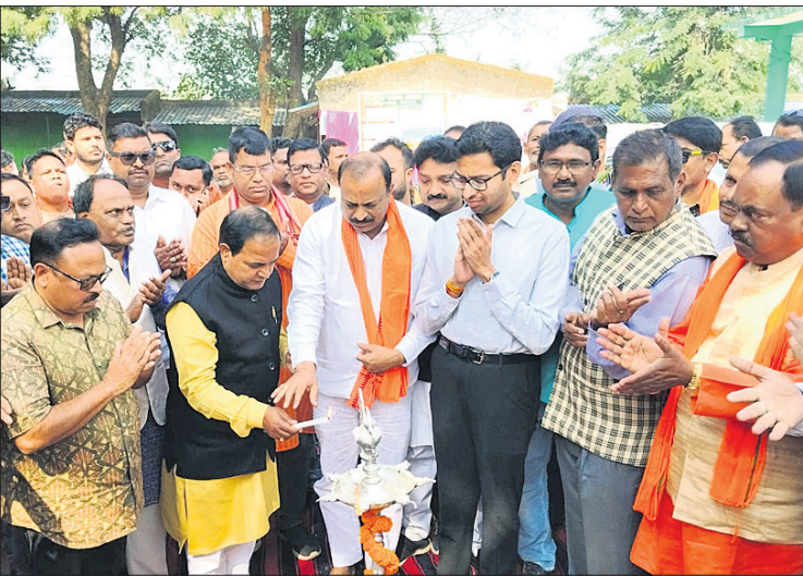
ବରଗଡ଼ ଆର୍ଏସ୍‌ସି ଅଧୀନ କଳାପାଣି ମଣ୍ଡିରେ ଯୋଗାଣ ମନ୍ତ୍ରୀ ଧାନ ସଂଗ୍ରହର ଶୁଭାରମ୍ଭ କରୁଛନ୍ତି।