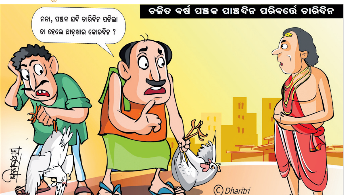
ଚଳିତ ବର୍ଷ ପଞ୍ଚକ ପାଞ୍ଚଦିନ ପରିବର୍ତ୍ତେ ଚାରିଦିନ