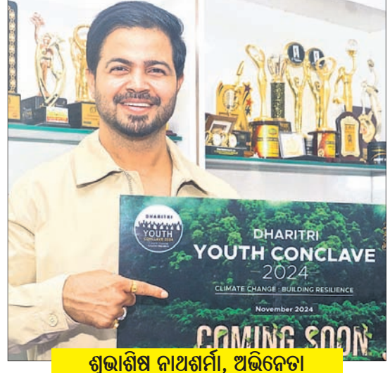
ଶୁଭାଶିଷ ନାଥଶର୍ମା, ଅଭିନେତା