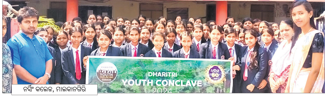
ନିଷିଂ କଲେଜ, ମାଲକାନଗିରି