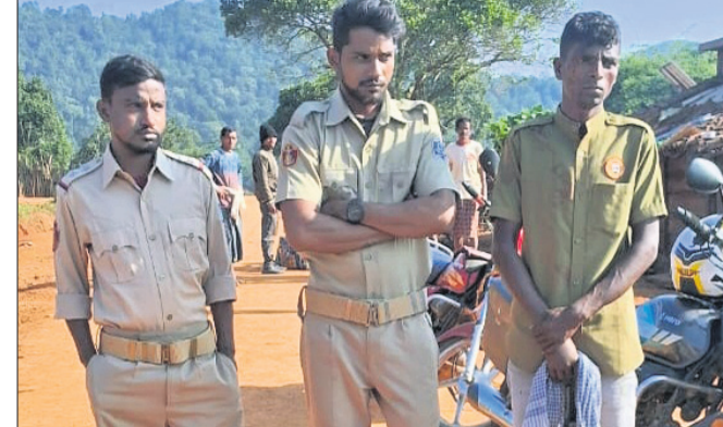
ପୋଲିସ ବେଶରେ ଆସିଥିବା ୩ ଦୁର୍ଭିକ୍ଷ।

ପରିବାର ସଦସ୍ୟଙ୍କୁ ଧମକ ଦେଇଥିଲେ। ପରେ ସେମାନେ ଘରେ ବାହୁଡ଼େ ଥିବା ୨ ଲକ୍ଷ ୪୦ ହଜାର ଟୁପି ଲୋନ ଟଙ୍କା ଲୁଟି ନେଇଥିବା ଚିପା ଅଭିଯୋଗ କରାଯାଇଛି।