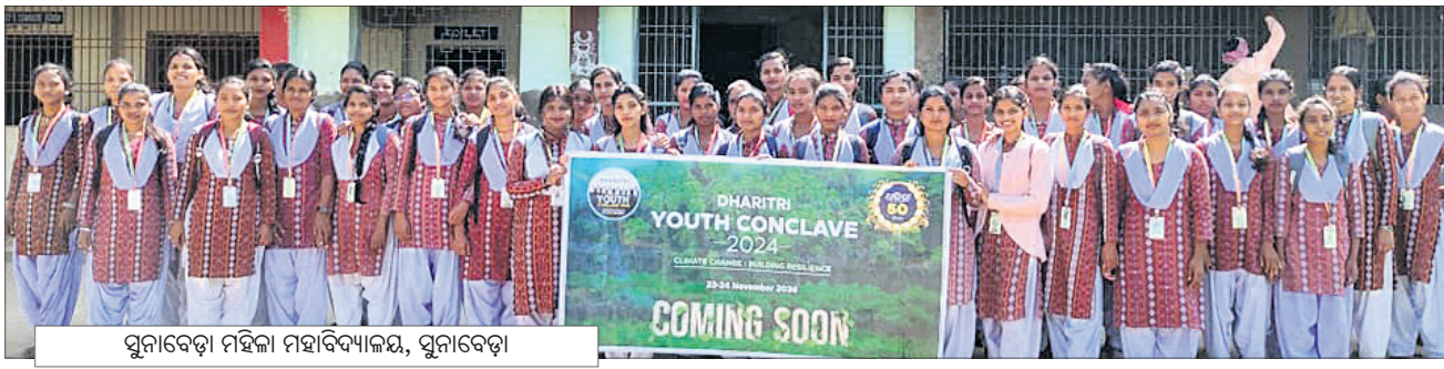
ପୁନାବେଡ଼ା ମହିଳା ମହାବିଦ୍ୟାଳୟ, ପୁନାବେଡ଼ା