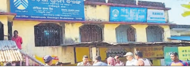
ଖପରାପଦା ଛକରେ ଥିବା ଓଡ଼ିଶା ଗ୍ରାମ୍ୟ ବ୍ୟାଙ୍କ।

ବାଲେଶ୍ୱର ଜିଲ୍ଲା ବାଲିଆପାଳ ଥାନା ଅଧୀନ ଖପରାପଦା ଛକରେ ଥିବା ଓଡ଼ିଶା ଗ୍ରାମ୍ୟ ବ୍ୟାଙ୍କରୁ ଚୋରି ଘଟିଥିବା ଜଣାପଡ଼ିଛି।