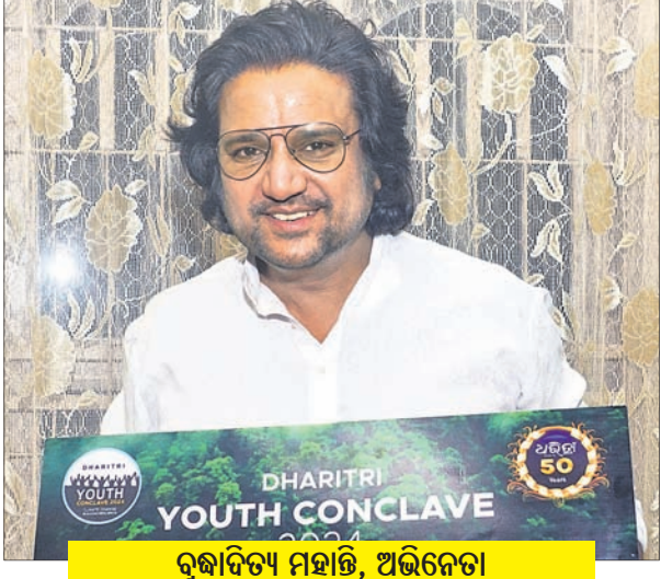
ରୁଚାଦିତ୍ୟ ମହାନ୍ତି, ଅଭିନେତା