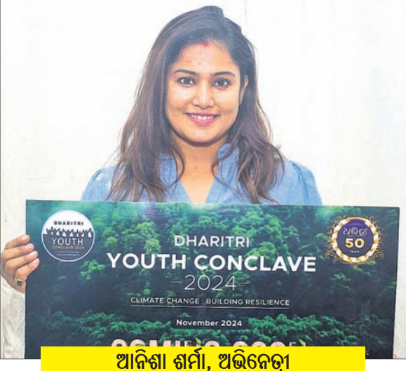
ଆଦିଶା ଶର୍ମା, ଅଭିନେତ୍ରୀ