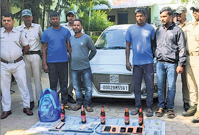
ଗିରଫ ୪ ଅଭିଯୁକ୍ତ ଓ ଜବତ ସାମଗ୍ରୀ।

କେନ୍ଦ୍ରଝର ଗାଉଁ ଅନ୍ତର୍ଗତ ପବିତ୍ରା ଗ୍ରାମ ନିକଟ ଜଙ୍ଗଲରେ ଚୋରି ଘଟଣାରେ ଉଦ୍ଧାର କରାଯାଇଥିବା ଚୋରମାନଙ୍କୁ ଗିରଫ କରାଯାଇଛି।