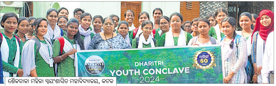
ଶୈଳବାଳା ମହିଳା ସ୍ୱୟଂଶାସିତ ମହାବିଦ୍ୟାଳୟ, କଟକ