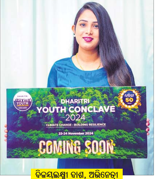
ବିଜୟଲକ୍ଷ୍ମୀ ଦାଶ, ଅଭିନେତ୍ରୀ