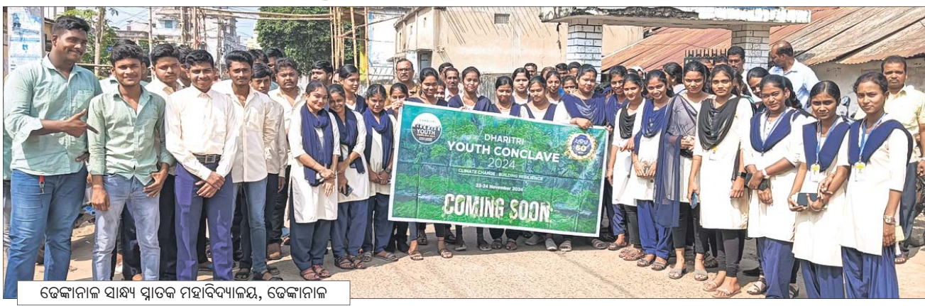
ଡେକାନାଲ ସାକ୍ଷ୍ୟ ସ୍ମାରକ ମହାବିଦ୍ୟାଳୟ, ଡେକାନାଲ