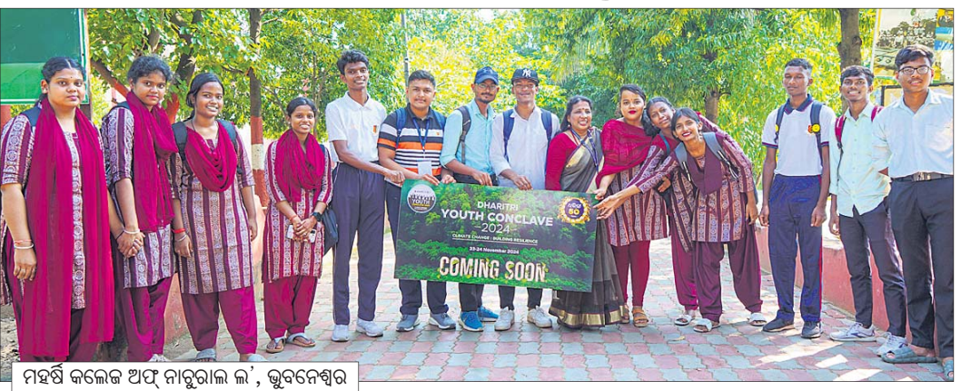
ମହର୍ଷି କଲେଜ ଅଫ୍ ନାଟୁରାଲ୍ ଇଂ, ଭୁବନେଶ୍ଵର