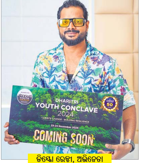
ଡିସ୍କୋ ରେଝୀ, ଅଭିନେତା