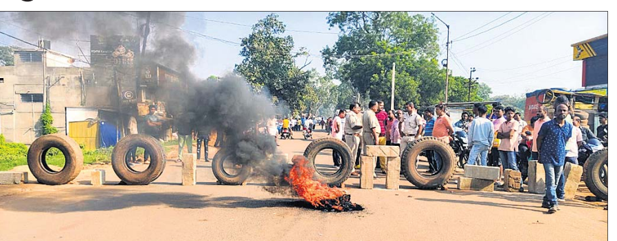
ଗାୟାର ଜାଲି ଲୋକେ ରାତ୍ରୀ ଅବରୋଧ କରିଛନ୍ତି।

ଚମ୍ପୁଆ/କେନ୍ଦୁଝର, ୨୧୧ (ନଭେଶ୍ଵର ଦାସ/ ନରେଶ ଚନ୍ଦ୍ର ପଟ୍ଟନାୟକ)