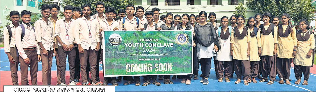
ରାୟଗଡ଼ା ସ୍ଵୟଂଶାସିତ ମହାବିଦ୍ୟାଳୟ, ରାୟଗଡ଼ା