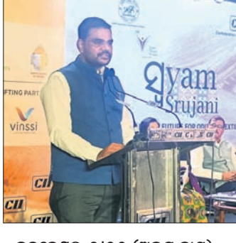
ଭୁବନେଶ୍ୱର, ୨୧୧୧ (ଅଭୟ ଦାଶ)

କନଫେରେନ୍ସରେ ଅଧିକାରୀ ଉପସ୍ଥିତ (ସିଆଇଆଇ)ର ଓଡ଼ିଶା ଶାଖା ପକ୍ଷରୁ ସିଆଇଆଇ ସ୍ୱୟଂ ସ୍ୱଚ୍ଛତା-ଓଡ଼ିଶାରେ ବୟନ ଶିଳ୍ପ ଓ ହସ୍ତଶିଳ୍ପ ପାଇଁ ଏକ ଗୁରୁତ୍ୱପୂର୍ଣ୍ଣ ଭବିଷ୍ୟତ ନାମରେ ଏକ ପ୍ରଭାବଶାଳୀ କାର୍ଯ୍ୟକ୍ରମ ମଙ୍ଗଳବାର ଭୁବନେଶ୍ୱରରେ ଅନୁଷ୍ଠିତ ହୋଇଯାଇଛି। ଏହି କାର୍ଯ୍ୟକ୍ରମରେ ଓଡ଼ିଶାର ବୟନଶିଳ୍ପ ଓ ହସ୍ତଶିଳ୍ପର ସମ୍ପୂର୍ଣ୍ଣ ଐତିହାସିକ ପ୍ରାକ୍ତନ କରାଯାଇଥିଲା, ଯେଉଁଥିରେ ରାଜ୍ୟର ପଣ୍ୟ ପରିବହନ ଓ ବୁଣାକାରମାନଙ୍କ ପାଇଁ ଗୁରୁତ୍ୱପୂର୍ଣ୍ଣ ଅଭ୍ୟାସ ଏବଂ ସମ୍ପ୍ରଦାନ ଉପରେ ବେଶ୍ ଗୁରୁତ୍ୱ ଦିଆଯାଇଥିଲା। ଏହି ଅବସରରେ ମନ୍ତ୍ରୀ ସମ୍ପଦ ଚନ୍ଦ୍ର