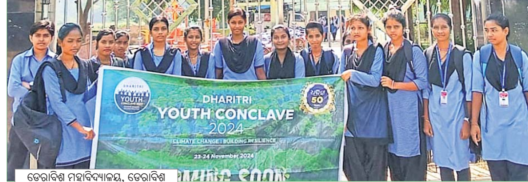
ଡେରାବିଶ ମହାବିଦ୍ୟାଳୟ, ଡେରାବିଶ