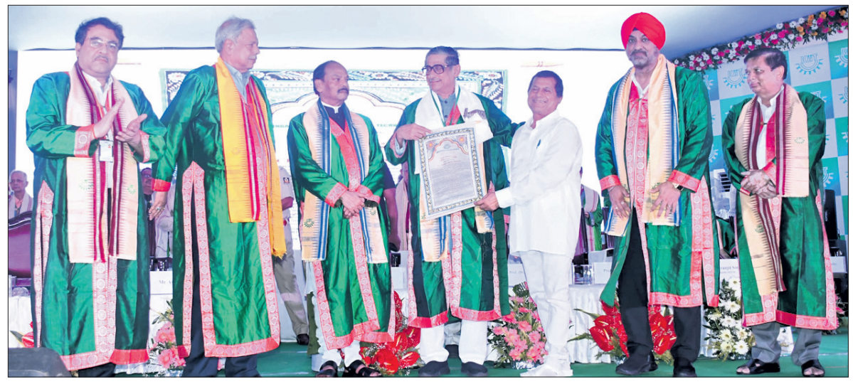
ବିଶ୍ୱ ଆଧ୍ୟାତ୍ମିକ ଚିନ୍ତକ ଡ. ଚନ୍ଦ୍ରଭାନ୍ୁ ଶତପଥୀଙ୍କୁ ତତ୍କାଳୀନ ପ୍ରଧାନ ମନ୍ତ୍ରୀମାନଙ୍କ ଦ୍ୱାରା 'ଧର୍ଯ୍ୟ' ପୁରସ୍କାର ପ୍ରଦାନ କରାଯାଇଛି ।