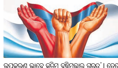
ଅନ୍ତର୍ଜାତୀୟ ଗଣତନ୍ତ୍ର ଦିବସ ଆଦି

ଉତ୍ତମ ଶାସନ ପାଇଁ କୃତ୍ରିମ ବୁଦ୍ଧିମତ୍ତର ଗୁରୁତ୍ୱ ବୃଦ୍ଧି ପାଇଛି ।