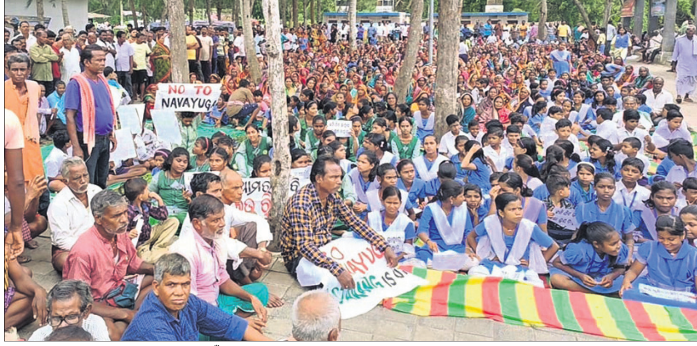
ପାରଳାହିଁନିଆ ପାଠାରେ ଭିତାମାଟି ପୁରୁଣା ସଙ୍ଗଠନ ପକ୍ଷରୁ ଆୟୋଜିତ ଜନସମାବେଶ ।