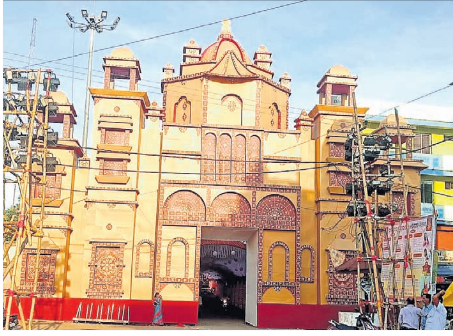
ଗଣେଶ ମେଳାରେ ନିର୍ମିତ ତୋରଣ।

ଦେବଗଡ଼ର ଗଣେଶ ମେଳା ଜିଲ୍ଲାବାସୀଙ୍କ ଗଣପର୍ବ ଆଖ୍ୟା ପାଇ ସାରିଛି। ସେହିପରି ବର୍ତ୍ତମାନ କଟକରୁ କାରିଗର ଆସି ଗଣେଶ ମୂର୍ତ୍ତି ସହ ଅନ୍ୟାନ୍ୟ ପାର୍ଶ୍ୱ ଦେବଦେବୀ ତଥା କଳାକୃତ୍ତିମାନ ସୁନ୍ଦର ସାଜସଜ୍ଜା କରିଆସୁଛନ୍ତି। ସେ ସମୟରେ ପେଟ୍ରୋମାଲ୍ ଲାଇଟରେ ଆଲୋକିତ କରୁଥିବା ପୂଜା ବର୍ତ୍ତମାନ ୧୦ ଲକ୍ଷରୁ ଊର୍ଦ୍ଧ୍ୱ ଟଙ୍କାରେ ସହର ଆଲୋକିତ