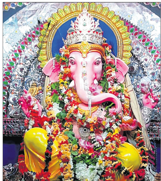
ମଣ୍ଡପରେ ପୂଜାପାଠଛଡ଼ି ଗଣେଶ।