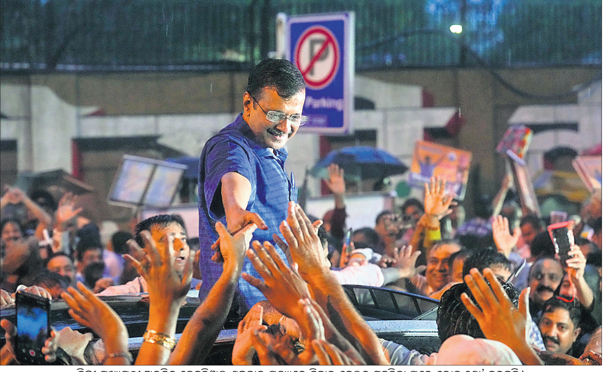
ଦିଲ୍ଲୀ ମୁଖ୍ୟମନ୍ତ୍ରୀ ଅରବିନ୍ଦ କେନ୍ଦ୍ରିତ୍ୱାଳ ଶୁକ୍ରବାର ସନ୍ଧ୍ୟାରେ ତିହାର କେଲରୁ ମୁକୁଲିବା ପରେ ରୋଡ୍ ଶୋ' କରୁଛନ୍ତି।

ପାଇଥିବାବେଳେ ଶୁକ୍ରବାର କେନ୍ଦ୍ରୀୟ ତଦନ୍ତ ବ୍ୟୁରୋ (ସିବିଆଇ) ମାମଲାରେ ସର୍ବୋଚ୍ଚ ଅଦାଲତ ତାଙ୍କୁ ଜାମିନ ଦେଇଛନ୍ତି। ଏଥିପ୍ରତି ସେ ତିହାର କେଲରୁ ମୁକ୍ତ ହୋଇଛନ୍ତି। ପୁକୁଲିବା ପରେ ନିଜ ପ୍ରଥମ ପ୍ରତିଦ୍ୱିତ୍ୟରେ କେନ୍ଦ୍ରିତ୍ୱାଳ ନିଜକୁ ନିର୍ଦ୍ଦୋଷ ଦର୍ଶାଇ କହିଛନ୍ତି, ଭାରତକୁ ଦୁର୍ବଳ କରିବାକୁ ଉଦ୍ୟମ ତଳାଇଥିବା ଦେଶବିରୋଧୀ ଚରୁକ ବିରୋଧରେ ତାଙ୍କ ଲଢ଼େଇ କାରି ରହିବ। ଅକାରଣେ ଉଦ୍‌ଘୋଷଣାକାରୀ ଭାବେ ଏତେ ଦିନ କେଲରେ ରଖାଯିବା ଦ୍ୱାରା ତାଙ୍କର ସଂକଳ୍ପ ଆହୁରି ସ୍ୱଚ୍ଛ ହୋଇଛି। ସୁପ୍ରିମକୋର୍ଟଙ୍କ ଜାମିନ ପରେ ଭାଜପାର ମିଛ ଧରାପଡ଼ିଯାଇଛି। ସିବିଆଇ-ଭିତ୍ତି ଭାଜପାର ଶୁଆ ଓ ଶାରୀ ବୋଲି ଆସ୍ ସମାଲୋଚନା କରିଛି। ୨୦୨୩ ଅକ୍ଟୋବରରେ ଅବକାରୀ ଦୁର୍ଗତି ମାମଲାରେ ଇତି ପକ୍ଷରୁ କେନ୍ଦ୍ରିତ୍ୱାଳଙ୍କୁ ପ୍ରଥମ ସମନ କରାଯାଇଥିଲା। ୬ ଥର ସମନ ସତ୍ତ୍ୱେ ସେ ଏହାକୁ କେନ୍ଦ୍ର ଷଡ଼ଯନ୍ତ୍ର ଦର୍ଶାଇ ପ୍ରବର୍ତ୍ତନ ନିର୍ଦ୍ଦେଶାଳୟରେ ହାଜର ହୋଇ ନ ଥିଲେ। ୨୦୨୪ ମାର୍ଚ୍ଚ ୧୬ରେ ଦିଲ୍ଲୀର ଏକ ସେସନ୍ସ କୋର୍ଟ ତାଙ୍କୁ ଜାମିନ ଦେଇଥିଲେ। ମାର୍ଚ୍ଚ ୨୧ରେ କେନ୍ଦ୍ରିତ୍ୱାଳ ଇତି ସମନକୁ ହାଇକୋର୍ଟରେ ଚ୍ୟାଲେଞ୍ଜ କରିଥିଲେ। ହାଇକୋର୍ଟ ତାଙ୍କୁ ପୁରୁଣା ଦେବାକୁ ମନା କରିବାରୁ ସେ ସୁପ୍ରିମକୋର୍ଟଙ୍କ ଦ୍ୱାରକୁ ହୋଇଥିଲେ। ଲଗାତର ୯ ଥର ସମନ ନିସ୍ୱ କରିବା ପରେ ସେହି ଦିନ ଇତି ତାଙ୍କୁ ଗିରଫ କରିଥିଲା। ଫ୍ଲୋପ୍‌ସା-୪