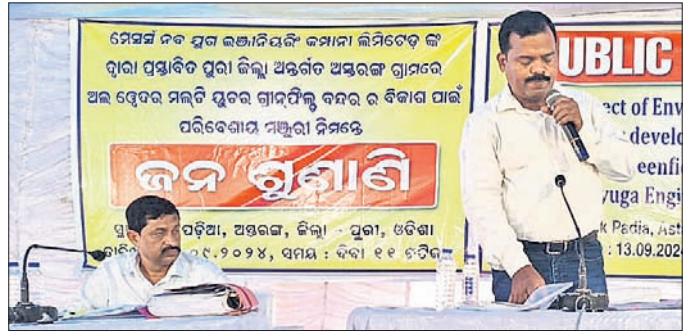
ପ୍ରଶାସନ ତରଫରୁ ଆୟୋଜିତ ଜନଶୁଣାଣି ।