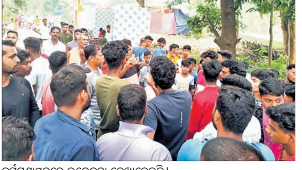
ଦୁର୍ଘଟଣାସ୍ଥଳରେ ଉଭେଜନା ଦେଖାଦେଇଛି।