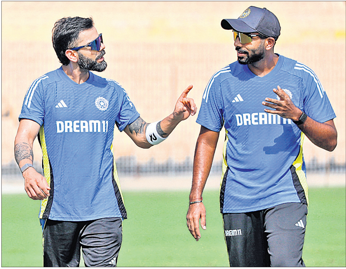
ଚେନାଇରେ ଶୁକ୍ରବାର ଭାରତୀୟ ଦଳର ଅଭ୍ୟାସ ସେସନରେ ଅଧିନାୟକ ରୋହିତ ଶର୍ମା, ବିରାଟ କୋହଲି ଓ ଯଶପ୍ରୀତ ବୁମ୍ରା ।