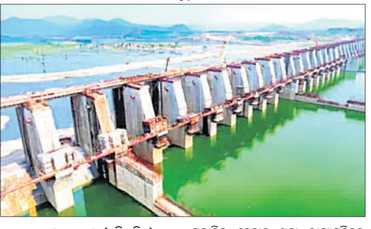
ଭୁବନେଶ୍ୱର, ୧୦୧୮ (ସୁନିର୍ଦ୍ଦିଷ୍ଟ)

ସରକାରକୁ ଚାଲିଗଲା ପରେ ଏବେ ବିଜେଡିର ନିଏ ଲାଗିଛି । ଗତ ୨୪ ବର୍ଷ ଧରି ପୋଲାଭରମ୍ ପ୍ରକଳ୍ପ ପାଇଁ କୌଣସି ପଦକ୍ଷେପ ନ ନେଇ କୁମ୍ଭକର୍ତ୍ତା ନିନ୍ଦାରେ ବିଜେଡି ସରକାର ଶୋଇଥିଲା । ଏବେ ଚର୍ଚ୍ଚାରେ ରହିବା ପାଇଁ ଅଥଥା ରାଜନୀତି କରୁଛି । ପ୍ରକଳ୍ପ ଅକ୍ଷୟ ଗସ୍ତକରି ସେଠାକାର ଲୋକଙ୍କୁ ଭୟଭୀତ କରି ସରକାରକୁ ବିରୋଧ କରିବାକୁ ପ୍ରୟାସ ଚଳାଇଛି । ପୋଲାଭରମ୍ ପ୍ରକଳ୍ପକୁ ନେଇ ନିଜର ଭାବବ୍ୟାକ୍ତ କରିବାକୁ ଚାହୁଁଥିବା ବିରୋଧୀଙ୍କ ଆଶା କେବେ ପୂରଣ ହେବ ନାହିଁ । ବିଜେଡି ଏବେ ନିଜର ଦୋଷ ଲୁଚାଇବା ପାଇଁ ହାନି ମନୁ ନିଆଁ ପକାଇବା ପାଇଁ ଚାହୁଁ ଚାହୁଁନି । ଭାଜପା ରାଜ୍ୟ କାର୍ଯ୍ୟାଳୟରେ ପ୍ରକଳ୍ପକୁ ବନ୍ଦ କରିବା ପାଇଁ ଏକ ପଦକ୍ଷେପ ନେଇଛନ୍ତି । ପ୍ରକଳ୍ପକୁ ବନ୍ଦ କରିବା ପାଇଁ ଏକ ପଦକ୍ଷେପ ନେଇଛନ୍ତି । ପ୍ରକଳ୍ପକୁ ବନ୍ଦ କରିବା ପାଇଁ ଏକ ପଦକ୍ଷେପ ନେଇଛନ୍ତି ।