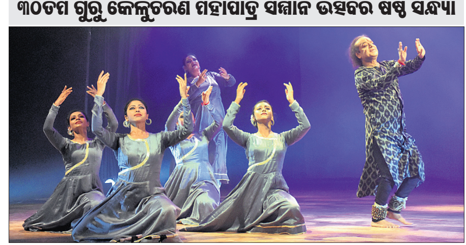
ଉତ୍ସବରେ କଳାକାରଙ୍କ ଦ୍ୱାରା କଥକ ନୃତ୍ୟରେ ‘ମୁନସ୍କୃକ୍’ ପରିବେଷଣ ।

ଭୁବନେଶ୍ୱର - ଭୁବନେଶ୍ୱରର ମହାପାତ୍ର ଓଡ଼ିଶା ନୃତ୍ୟବୀ ସର୍ବ ଶ୍ରୀ ଶ୍ରୀ ବିଶ୍ୱବିଦ୍ୟାଳୟ ଦ୍ୱାରା ଆୟୋଜିତ ୩୦ତମ ଭୁବନେଶ୍ୱର ମହାପାତ୍ର ସମ୍ମାନ ଉତ୍ସବର ମଙ୍ଗଳାକାରୀ ଥିବା ଶୁଭ ସନ୍ଧ୍ୟା । ଚନ୍ଦ୍ର ପର୍ଯ୍ୟନ୍ତ ଆୟୋଜିତ ଏହି ଉତ୍ସବରେ ବିଶିଷ୍ଟ କଥକ ନୃତ୍ୟ ପ୍ରଦର୍ଶନୀ ଜ୍ୟୋତ୍ସ୍ନା ଜାତୀୟ ଓ ତାଙ୍କ ନୃତ୍ୟାଲୋଚନା ଉପାଦାନ ସେକ୍ସର ଫର୍ ତ୍ୟାଗ ପକ୍ଷରୁ କଥକ ନୃତ୍ୟରେ ‘ମୁନସ୍କୃକ୍’ ପରିବେଷିତ ହୋଇଥିଲା । ‘ମୁନସ୍କୃକ୍’ ଭୁବନେଶ୍ୱର ଆୟୋଜନ କରାଯାଇଥିବା ଗୁଣା ନୈର୍ଦ୍ଦେଶିତ ଓ ନୃତ୍ୟ ସଂଗୃହୀତ ହେବା ସହିତ ଜୟନ୍ତୀ ନାମରେ ଏକ ସଂଗ୍ରହଣା ଏବଂ ଅନନ୍ତ ଦାସଗୁପ୍ତାଙ୍କ ଦଳପ, ଦିଗୁର ଗାଲୁଲୁଲୁଲୁ ଦ୍ୱାରା ବର୍ଣ୍ଣିତ ଏହି ପ୍ରସ୍ତୁତିର ମଣିଷ ଓ ଚନ୍ଦ୍ରର କାହାଣୀକୁ ଦର୍ଶାଇଥିଲା । ଏହି କାହାଣୀରେ ଜଣେ ନିଃସଙ୍ଗ ବ୍ୟକ୍ତି ଏବଂ ତାଙ୍କ ବନ୍ଧୁ ଚନ୍ଦ୍ରଙ୍କ ମଧ୍ୟରେ ଏକ ଚିନ୍ତନଶୀଳ ଓ ଭାବପୂର୍ଣ୍ଣ ବାର୍ତ୍ତାଳାପକୁ ବର୍ଣ୍ଣନା କରାଯାଇଥିଲା । ଏହା କଥକର ଛନ୍ଦମୟ ଅନ୍ତର୍ଭୋଗ ବୈଶିଷ୍ଟ୍ୟ ସହିତ ନୃତ୍ୟ ସଂଯୋଜନା ଓ ଚିତ୍ତାକର୍ଷକ ସଙ୍ଗୀତରେ ପ୍ରସ୍ତୁତ ହୋଇଥିଲା ।