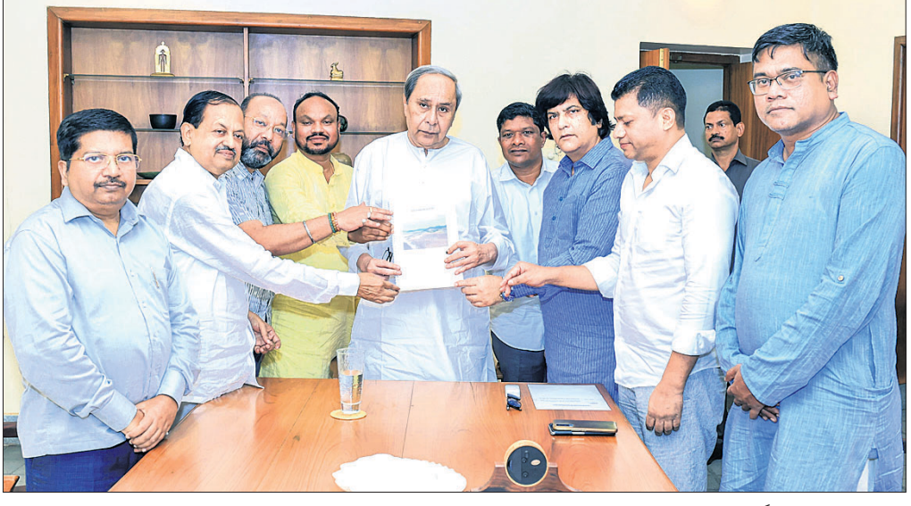
ନବୀନ ନିବାସରେ ବିଜେଡି ସଭାପତି ନବୀନ ପଟ୍ଟନାୟକଙ୍କୁ ଦଳର ପୋଲାଭରମ୍ ଟିମ୍ ସଦସ୍ୟମାନେ ରିପୋର୍ଟ ପ୍ରଦାନ କରୁଛନ୍ତି ।