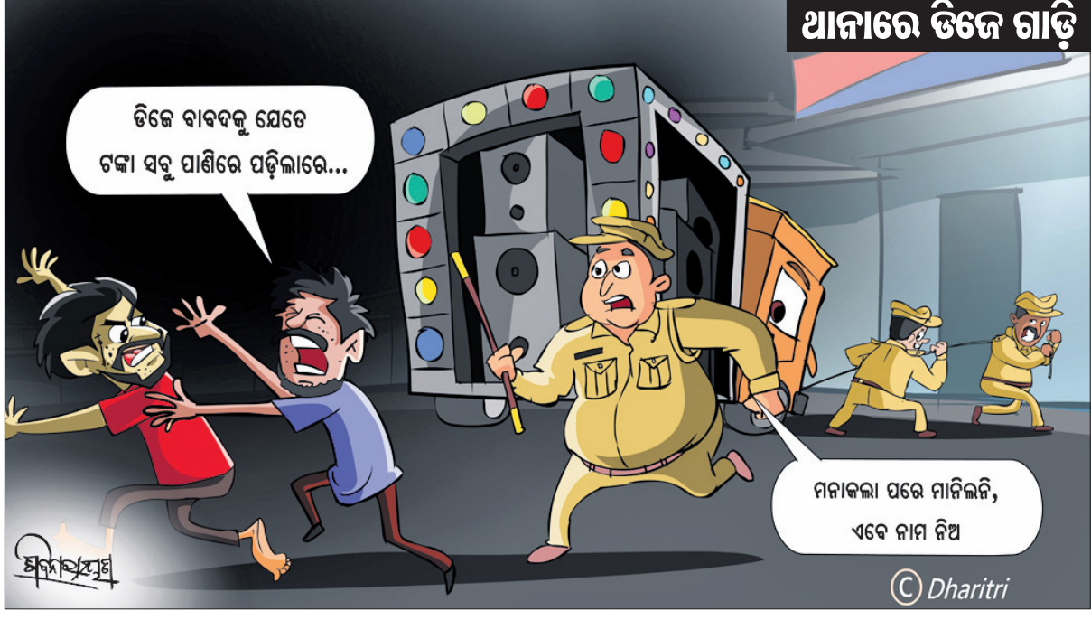
ଆନାରେ ଡିଜେ ଗାଡ଼ି