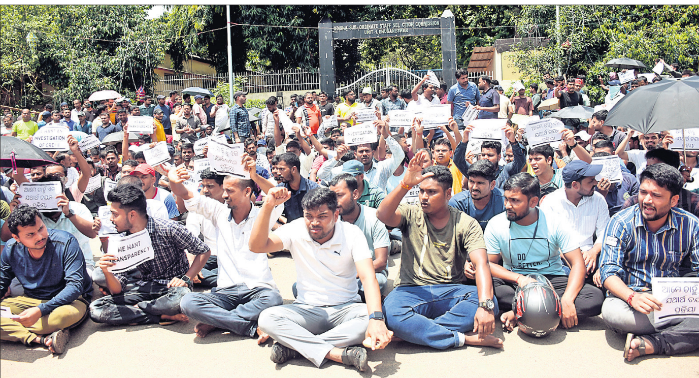
ଓଏସ୍‌ସ୍‌ସ୍‌ସ୍‌ସିରେ ନିଯୁକ୍ତି ବ୍ୟବସ୍ଥାରେ ଦୁର୍ନୀତିର ତଦନ୍ତ ଏବଂ ଅଫ୍‌ଲାଇନ୍‌ରେ ପରୀକ୍ଷା କରାଯିବା ଦାବି ନେଇ ଆଶାୟୀମାନେ ମଙ୍ଗଳବାର ଭୁବନେଶ୍ୱର ଯୁନିଟ୍-୧ ସ୍ଥିତ ଓଏସ୍‌ସ୍‌ସ୍‌ସ୍‌ସି କାର୍ଯ୍ୟାଳୟ ସମ୍ମୁଖରେ ବିକ୍ଷୋଭ ପ୍ରଦର୍ଶନ କରୁଛନ୍ତି।

ଅଭିନେତ୍ରୀ ତାପସୀ ପତ୍ତ୍ନୀ ଆଗାମୀ ଦିନରେ 'ଗାନ୍ଧାରୀ' ଫିଲ୍ମରେ ନଜରକୁ ଆସିବେ। ଏନେଇ ସେ ଇନ୍ଷ୍ଟାଗ୍ରାମରେ ସୂଚନା ଦେଇଛନ୍ତି।