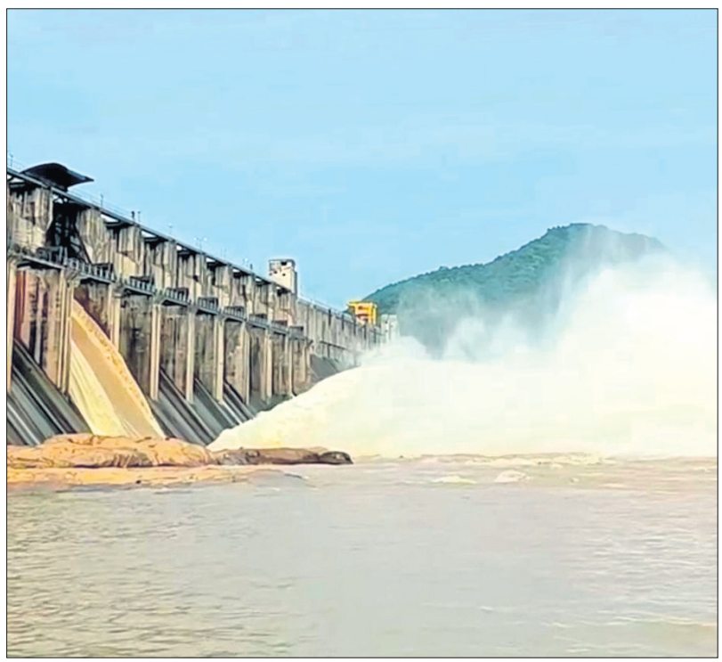
ରେଙ୍ଗାଳି ଡ୍ୟାମ୍‌ରୁ ବନ୍ୟା ଜଳ ନିଷାସନ କରାଯାଉଛି ।