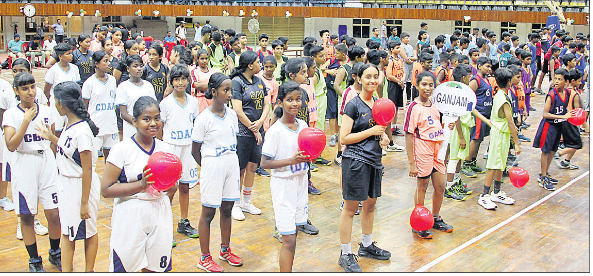
କଟକ ଜବାହରଲାଲ ନେହେରୁ ଇନ୍‌ଡୋର ସ୍ପୋର୍ଟସ୍‌ସେଣ୍ଟରରେ ଶୁକ୍ରବାର ସର୍ବକ୍ରମିୟର ବାସ୍ନେନିକ ରୂର୍ମାମେଣ୍ଟର ଉଦ୍ଘାଟନା ସମାବେଶରେ ଉପସ୍ଥିତ ଖେଳାଳିମାନେ।