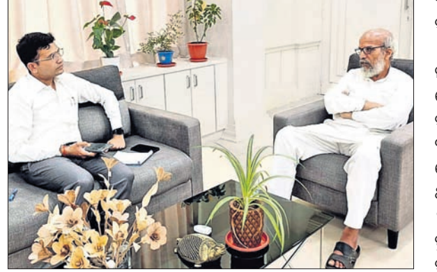
ଲିମାପାଳଙ୍କ ସହ ଆଲୋଚନାରେ ଏପି ସପ୍ଲାଇ।

ବାଲେଶ୍ୱର ଏକ ମହାନ୍ତ ଯାତ୍ରା ହେଉଥିବାରୁ ଏକ ହାଇଜେନିକ୍ ଫିଶ୍ ମାର୍କେଟର ଆବଶ୍ୟକତା ଅନୁଭବ କରି ଚଳୁଥିବା କେନ୍ଦ୍ରମନ୍ତ୍ରାଳୟ ଆଇଡିଏ ଅଫ୍ ଫିସ୍ ପ୍ରକଳ୍ପର ଗୁରୁତ୍ୱପୂର୍ଣ୍ଣ ଆରାଧନା କରିବାକୁ ଶିଳ୍ପାଳୟ (ଆଇପିଏ ମାଧ୍ୟମରେ) ପ୍ରଧାନମନ୍ତ୍ରୀଙ୍କ ଦ୍ୱାରା କରାଯାଇ ପାଇଁ ଗୁଜୁରୀ ଏପି ସପ୍ଲାଇ, ଲିମାପାଳ