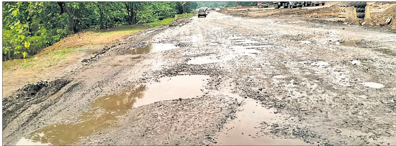
ବଇଣ୍ଡ, ୨୩୮୮ (ପରିଷ୍ଟିତ ସାହୁ)

ଅନୁଗୋଳ ଜିଲ୍ଲା ଶେଷପଦା ଥାନା କୋଶଳା ଗ୍ରାମରେ ସାମାନ୍ୟ ବରଷାକୁ ନେଇ ଭୁବନେଶ୍ୱର ୨ କଣ ଆହତ ହୋଇଥିବା ଅଭିଯୋଗ ହୋଇଛି। ପୋଲିସ ଜଣେ ଅଭିଯୁକ୍ତଙ୍କୁ ଗିରଫ କରି କୋର୍ଟୋଲାଣ କରିଛି।