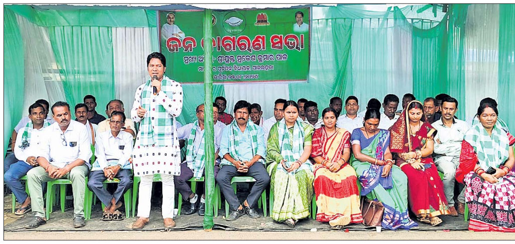
ଜନଜାଗରଣ ସଭାର ଉପସ୍ଥିତ ବିଜେଡି ନେତା ଓ କର୍ମୀ।