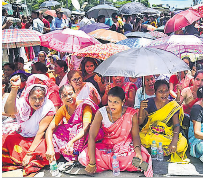
ନାବାଳିକାଙ୍କୁ ଗଣରକ୍ଷକଦ୍ୱାରା ପ୍ରତିବାଦରେ ଗୁଆହାଟୀରେ ମହିଳା ସଙ୍ଗଠନ ପକ୍ଷରୁ ରାସ୍ତାରେ ଗଣରକ୍ଷକଦ୍ୱାରା ଦିଆଯାଇଥିବା ଛାଡ଼ି ଦିଆଯାଇଛି।

ଆସାମର ନାଗାଓଁ ଜିଲ୍ଲାରେ ଜଣେ ୧୪ ବର୍ଷୀୟା ନାବାଳିକାଙ୍କୁ ୩ ଜଣ ଗଣରକ୍ଷକଦ୍ୱାରା ହତ୍ୟା କରାଯାଇଥିବା ବେଳେ ୪ ଜଣଙ୍କ ଅବସ୍ଥା ସଙ୍କଟାପନ୍ନ ରହିଛି।