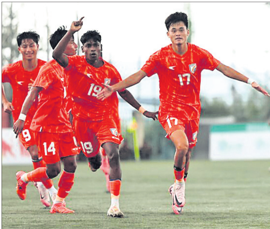
ଗୋଲ ଦେବାପରେ ଯାଥା ଖେଳାଳିଙ୍କ ସହ ଖୁସି ମନାଉଛନ୍ତି ମନକୁନିଆଙ୍କ କିପ୍‌ଗେଟ୍ (ଡାହାଣ)।