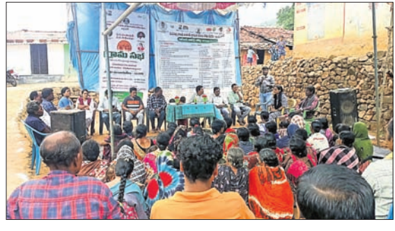
ପଟାଳିରେ ଉପସ୍ଥାପିତ ହେଉଥିବା ଆନ୍ଧ୍ର ଗ୍ରାମସଭା ସମୟରେ ଗ୍ରାମସଭା କମିଟି ସଭାପତିଙ୍କ ଦ୍ୱାରା ଗ୍ରାମସଭା କାର୍ଯ୍ୟକ୍ରମ ଉଦ୍ଘାଟନ କରାଯାଇଥିଲା ।

ପଟାଳି, ୨୩୮ (ଶରତ ଧଳ) କୋରାପୁଟ ଜିଲ୍ଲା ପଟାଳି ବ୍ଲକ୍‌ ଅଧୀନରେ ଥିବା କୋଟିଆ ପଞ୍ଚାୟତ ସୀମାନ୍ତ ଗ୍ରାମକୁ ଗ୍ରାମସଭା ଉଦ୍ଦେଶ୍ୟରେ ଆନ୍ଧ୍ରର ଗ୍ରାମସଭା କମିଟି ଯାଏ ।