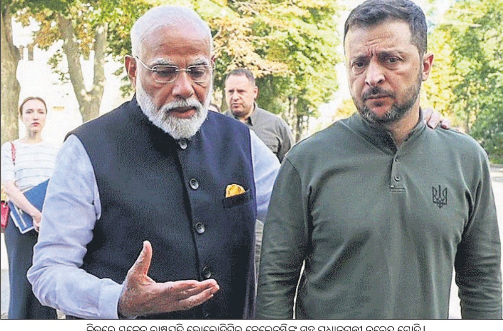
କିଭରେ ଯୁକ୍ତମୁଖ୍ୟଙ୍କୁ ରାଷ୍ଟ୍ରପତି ଭୋଲୋଡିନିର କେଲେନ୍ସ୍କିଙ୍କ ସହ ପ୍ରଧାନମନ୍ତ୍ରୀ ନରେନ୍ଦ୍ର ମୋଦି।

ରୁଷିଆ ସହ ଚାଲିଥିବା ଯୁଦ୍ଧର ଅବସାନ ପାଇଁ ଭାରତ ସହଯୋଗୀ ଆକ୍ରମଣୀୟ ହାତୀ ଆମକୁ ସମର୍ଥନ କରୁ ବୋଲି ଯୁକ୍ତମୁଖ୍ୟଙ୍କୁ ରାଷ୍ଟ୍ରପତି ଭୋଲୋଡିନିର କେଲେନ୍ସ୍କି କହିଛନ୍ତି।