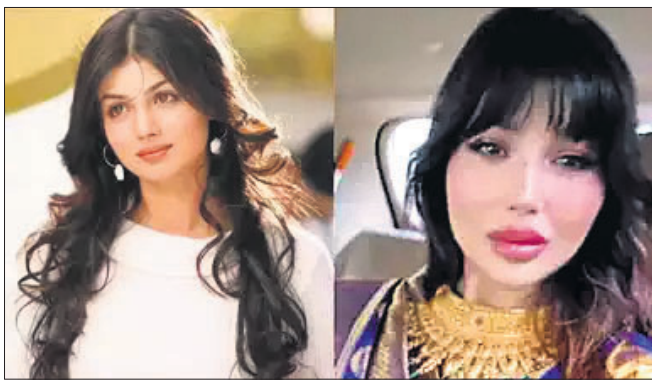
ଅନ୍ୟ ଜଣେ ଲେଖକ, ଆପଣ ନିଜ ରେହେରା ସହିତ କା'ଣ କରିଛନ୍ତି, ପ୍ରଶଂସକମାନେ ଲେଖିଛନ୍ତି, ପ୍ଲାଷ୍ଟିକ ସର୍ଜରୀର ଆବଶ୍ୟକତା ଆପଣ ବାଟି ତଳୁ ତଳୁ କମ୍ ରୁହୁଛି।

ନେଇ କହିଥିଲେ। ଆୟେଶା ଏସବୁକୁ ସହ୍ୟ କରି ନ ପାରି ୨୩ ଅଗଷ୍ଟରେ ନିଜ ଇନ୍ଦ୍ରକ୍ଷମା ଆକାଉଣ୍ଟ ଡିଲିଟ୍ କରିଦେଇଥିଲେ। ବଲିଉଡ୍ ସୁପରଷ୍ଟାର ସଲମାନ ଖାନ୍ଙ୍କ ଫିଲ୍ମ 'ଶାଖେତ' ଏବଂ ଅଜୟ ଦେବଗନଙ୍କ ଫିଲ୍ମ 'ଗାନ୍ଧୀଜୀ ଦି ଖଣ୍ଡର କାର୍'ରେ ଆୟେଶା ନିଜ ଅଭିନୟ ଯାହା ଦେଖାଇଥିଲେ। ୩୮ ବର୍ଷିଆ ଆୟେଶାଙ୍କ ଲୁକ୍ ବିଷୟରେ ଜଣେ ଯୁକ୍ତ୍ୟ ଲେଖକ, ଆପଣ ପ୍ଲାଷ୍ଟିକ ସର୍ଜରୀ କରିଛନ୍ତି କି? ନେଇ କହିଥିଲେ। ଆୟେଶା ଏସବୁକୁ ସହ୍ୟ କରି ନ ପାରି ୨୩ ଅଗଷ୍ଟରେ ନିଜ ଇନ୍ଦ୍ରକ୍ଷମା ଆକାଉଣ୍ଟ ଡିଲିଟ୍ କରିଦେଇଥିଲେ। ବଲିଉଡ୍ ସୁପରଷ୍ଟାର ସଲମାନ ଖାନ୍ଙ୍କ ଫିଲ୍ମ 'ଶାଖେତ' ଏବଂ ଅଜୟ ଦେବଗନଙ୍କ ଫିଲ୍ମ 'ଗାନ୍ଧୀଜୀ ଦି ଖଣ୍ଡର କାର୍'ରେ ଆୟେଶା ନିଜ ଅଭିନୟ ଯାହା ଦେଖାଇଥିଲେ। ୩୮ ବର୍ଷିଆ ଆୟେଶାଙ୍କ ଲୁକ୍ ବିଷୟରେ ଜଣେ ଯୁକ୍ତ୍ୟ ଲେଖକ, ଆପଣ ପ୍ଲାଷ୍ଟିକ ସର୍ଜରୀ କରିଛନ୍ତି କି? ନେଇ କହିଥିଲେ। ଆୟେଶା ଏସବୁକୁ ସହ୍ୟ କରି ନ ପାରି ୨୩ ଅଗଷ୍ଟରେ ନିଜ ଇନ୍ଦ୍ରକ୍ଷମା ଆକାଉଣ୍ଟ ଡିଲିଟ୍ କରିଦେଇଥିଲେ। ବଲିଉଡ୍ ସୁପରଷ୍ଟାର ସଲମାନ ଖାନ୍ଙ୍କ ଫିଲ୍ମ 'ଶାଖେତ' ଏବଂ ଅଜୟ ଦେବଗନଙ୍କ ଫିଲ୍ମ 'ଗାନ୍ଧୀଜୀ ଦି ଖଣ୍ଡର କାର୍'ରେ ଆୟେଶା ନିଜ ଅଭିନୟ ଯାହା ଦେଖାଇଥିଲେ।