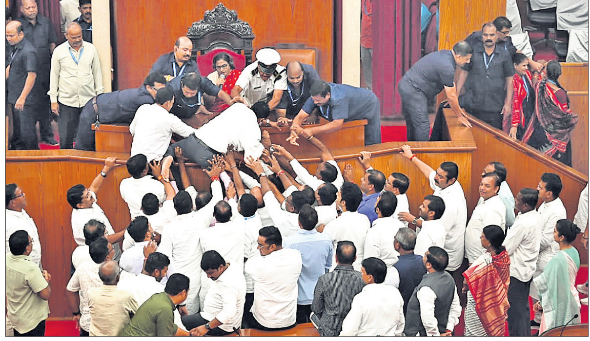
ଭୁବନେଶ୍ୱର, ୨୩୮ (ଅନିଲ ଦାସ)

ପାଇଁ ପୁଲଟେ ଯୋଗ୍ୟ କରିଛନ୍ତି। ପୂର୍ବ ନିର୍ଦ୍ଧାରିତ କାର୍ଯ୍ୟକ୍ରମ ଅନୁଯାୟୀ ପୂର୍ବରୁ ୧୦ଟି ୩୦ ମିନିଟ୍ରେ ବାଟସ୍ତର ଭୁବନେଶ୍ୱର ପାଠାଗାରୀୟ ସଭାକୁ ରୁକ୍ଷ କରାଯାଇଥିଲା। ପ୍ରଶ୍ନୋତ୍ତର କାର୍ଯ୍ୟକ୍ରମ ଆରମ୍ଭ ହେବା ପରେ ବିଭିନ୍ନ ଚିକିତ୍ସା ସେବା ପାଇଁ ଅନୁରୋଧ ଆଣିଥିଲେ। ଅବକାରୀ ନମ୍ବର