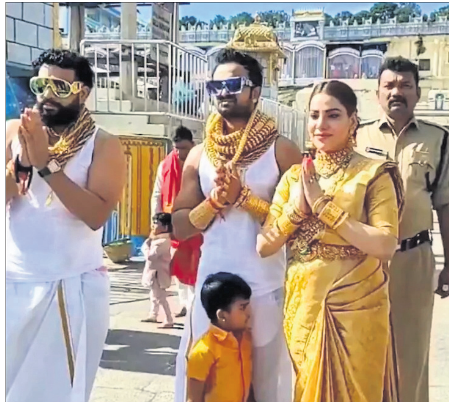
ପୁଣେରୁ ଆସିଥିବା ବୁଲ୍ ପୁରୁଷ ଓ ଜଣେ ମହିଳା ଶ୍ରଦ୍ଧାକୁ ୨୫ କେ.ଜି. ଓଜନର ସୁନା ଗହଣା ପିନ୍ଧି ଶୁକ୍ରବାର ଆନ୍ଧ୍ରପ୍ରଦେଶ ଡିଭିଜନରେ ଡିଲୁମାଲ ଭେଙ୍କଟେଶ୍ୱରଙ୍କ ଦର୍ଶନ କରୁଛନ୍ତି।

ନିଜ ପରିଚୟ ଲୁଚାଇ ଘରଭଡ଼ା ନେଇ ରହୁଥିଲେ ମଧ୍ୟ ପୋଲିସ୍ ଆସିବା ପୂର୍ବରୁ ଖୋଜାଉନାହିଁ। ତେବେ ସିମ୍‌କାର୍ଡ ରଖାକେତର ଗୁମର ପଦାକୁ ଆସିବା ପରେ କମିଶନରେଟ୍ ପୋଲିସ୍‌ର ଡିଭିଜନ ସୁରକ୍ଷାକୁ ନେଇ ପ୍ରଶ୍ନ ଉଠିଛି। ସିମ୍‌କାର୍ଡ ମିଳିଥିବା ବୁଲ୍ ଭଡ଼ାଘରର ମାଲିକ ଭଡ଼ାଟିଆଙ୍କ ତଥ୍ୟ ଆନକୁ ଦେଇ ନ ଥିଲେ ମଧ୍ୟ ପୋଲିସ୍ ଏହା ସେମାନଙ୍କ ଉପରେ ପଦକ୍ଷେପ ନେଇନାହିଁ। କମିଶନରେଟ୍ ପୋଲିସ୍‌ର ଏପରି ଆକ୍ରମଣ ପାଇଁ କେବଳ ଭୁବନେଶ୍ୱର କି ପୃଷ୍ଠା-୪