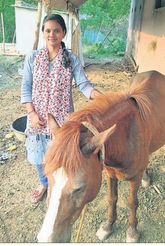
ପରିବାର ଲୋକଙ୍କ ପୁଅ ଯୋଡ଼ା 'ରାନୀ' ।

କରିଛି। ସାମାଜିକ ସେବା ଯାଇ କିଛି କିଛି। କାରଣ ଆମ ଦଳ ସମ୍ପୂର୍ଣ୍ଣ ମାଲିକାନା ସଦସ୍ୟ ମନୋରଞ୍ଜନ ଦ୍ୟାନ ସାମାଜିକ କହିଛନ୍ତି, ବିଭାଗୀୟ ପଦକ୍ଷେପ ସମ୍ପାନ ଦେବା ଶିଖାଯାଉଛି। ପୋଡ଼ିଯିବ ଉପରେ ଉଠି ବିଭାଗୀୟ ଦଳର ବିଧାୟକମାନେ ଯେଉଁପରି ଭାବେ ଆଚରଣ ପ୍ରଦର୍ଶନ କଲେ ତାହା ସ୍ୱର ନିୟମାୟ। ସତ୍ୟର ସାମାଜିକ ବିଭାଗୀୟ ଦୃଷ୍ଟି ୨୪ ବର୍ଷ ଧରି ସେମାନେ ଦୁର୍ଘଟଣାରେ ଉପସ୍ଥିତ ହେଉଥିଲେ। ଏବେ ପର୍ଯ୍ୟନ୍ତ ହେବା ଦେଖି ଆଲୋଚନାକୁ ଚିତ୍କଳା ବିଭାଗୀୟ ଦୃଷ୍ଟି ଦେବାକୁ ଦାବି କରିଥିଲେ। ବିଭାଗୀୟ ଚିତ୍କଳା ବିଭାଗୀୟ ରୁକ୍ଷ କେବେ ହେବ ବୋଲି ବିଭାଗୀୟ ସଦସ୍ୟ କେତେ ଜଣ ବିଭାଗୀୟ ଦୃଷ୍ଟି ଦେବାକୁ ଦାବି କରିଥିଲେ।