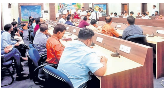
ଜନଶୁଣାଣିରେ ଜିଲାପାଳଙ୍କ ସହ ଅନ୍ୟ ପଦାଧିକାରୀ ।

ହୋଇଅଛି । ଏହି ଅଞ୍ଚଳ ଜନଗହଳପୂର୍ଣ୍ଣ ହୋଇଥିବା ବେଳେ ଯୁବ ଓ ଭର ବ୍ରିକ ପାଇଁ ବକ୍ଷା ଅଞ୍ଚଳରେ ବ୍ୟବସାୟମାନେ ବହୁ କ୍ଷତି ସହିବେ । ଏଥିସହ ହାଲୁକା, ପ୍ରାଥମିକ ବିଦ୍ୟାଳୟକୁ ଯିବା ଆସିବା ପାଇଁ ଛାତ୍ରଛାତ୍ରୀମାନେ ହଇରାଣ ହେବେ ।