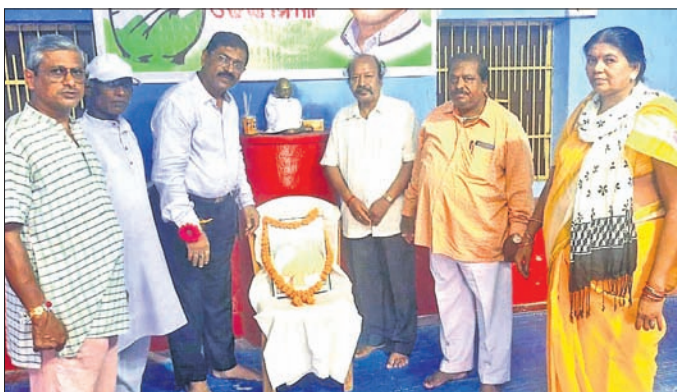
ଜୟନ୍ତୀ ପାଳଙ୍କ ଅବସରରେ କଂଗ୍ରେସ କର୍ମୀମାନେ ।

ଅରମ୍ଭ ହୋଇଥିଲା । ଦେଶରେ ଶାନ୍ତି ପ୍ରତିଷ୍ଠା ନିମନ୍ତେ ରାଜୀବ ଗାନ୍ଧୀ ଆସାମ, ମିଜୋରାମ, ପଞ୍ଜାବ, ଶ୍ରୀଲଙ୍କା ଶାନ୍ତି ପ୍ରସ୍ତାବ ଆଣିଥିଲେ । ରାଜୀବ ଗାନ୍ଧୀ ସବୁ ପତୋଶୀ ଗାନ୍ଧୀ ବିଶେଷ କରି ପାକିସ୍ତାନ ମଙ୍ଗଳବାର ପାକିସ୍ତାନ ହୋଇଯାଇଛି ।