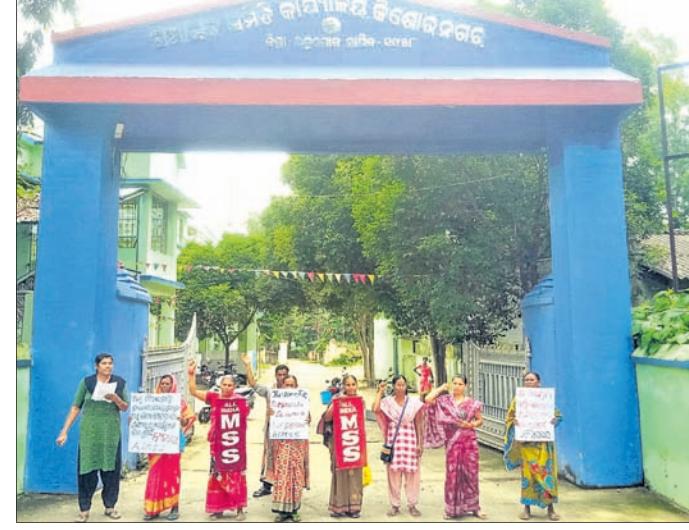
ଅଲ୍ ଲଭିଆ ମହିଳା ସଂସ୍କୃତିକ ସଂଗଠନର ସଭ୍ୟମାନେ ବିରୋଧ କରୁଛନ୍ତି ।

କୋଲକାତା ଆର.ଜି.କର ମେଡିକାଲ ଡାକ୍ତରୀ କ୍ଷତ୍ରୀଙ୍କୁ ବଳାହାର କରି ହତ୍ୟା କରିଥିବା ଅଭିଯୁକ୍ତଙ୍କୁ ଫାଶୀ ଦଣ୍ଡ ଦାବି ନେଇ ମଙ୍ଗଳବାର କିଶୋରନଗର ବୁକ୍ ଅଲ୍ ଲଭିଆ ମହିଳା ସଂସ୍କୃତିକ ସଂଗଠନ କିଶୋରନଗର ପକ୍ଷରୁ ବୁକ୍ ଘେରାଉ କରାଯାଇ ଆନ୍ଦୋଳନ କରାଯାଇଛି । ବୁକ୍ ସଭାରେ ପୁରୁ ପ୍ରଧାନ କ ଦେବତା ସମାପକ ସୂଚି ପ୍ରଧାନ, ମୁଖ୍ୟମନ୍ତ୍ରୀଙ୍କୁ ପ୍ରଦାନ କରାଯାଇଛି ।