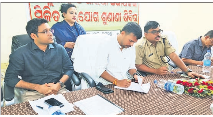
ଜନ ଅଭିଯୋଗ ଶୁଣାଣି ଶିବିରରେ କିଲପାଳ ଓ ସାପିକ ସହ ଅନ୍ୟ ଅଧିକାରୀମାନେ ।

ଦେଈାନାଲ ଅଫିସ୍, ପରଜଳା, ୨୦୮ (ଉତ୍ତମ ନାୟକ/ ନିରମାଳ୍ୟ ଦଳବେହେରା) ଦେଈାନାଲ କିଲ ପରଜଳା କୁଳ କାର୍ଯ୍ୟାଳୟ ପରିସରରେ ମଙ୍ଗଳବାର ପ୍ରଶାସନ ପକ୍ଷରୁ ମିଳିତ ଜନ ଅଭିଯୋଗ ଶୁଣାଣି ଶିବିର ଅନୁଷ୍ଠିତ ହୋଇଥିଲା । ଶିବିରରେ ମୋଟ ୧୫୯ଟି ଅଭିଯୋଗ ପତ୍ର ଗ୍ରହଣ କରାଯାଇଥିଲା । ତତ୍ପରେ ୨୧ଟି ସମାଧାନ କରାଯାଇଥିଲା । ମୁଖ୍ୟମନ୍ତ୍ରୀ ସହାୟତା