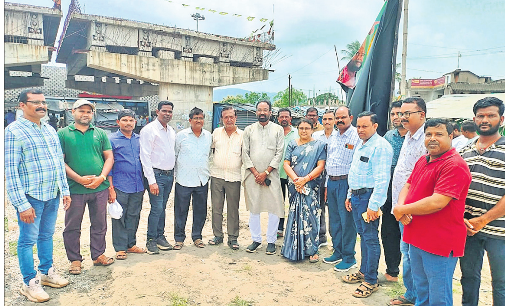
ଲୋକମାନଙ୍କ ଦାବି ନ ଶୁଣି ପୋଲିସ ଉପସ୍ଥିତରେ ବ୍ରିକ କାମ ଆରମ୍ଭକୁ ବିରୋଧ କରି ଅଞ୍ଚଳବାସୀ ବିରୋଧ କରୁଛନ୍ତି ।

ବକ୍ଷା, ୨୦୧୮ (ପରିକ୍ଷାତ ସାହୁ) ଅନୁଗୋଳ ଜିଲା କିଶୋରନଗର ବ୍ଲକ ୫୫ ନମ୍ବର କାତାୟ ରାଜପଥର ବକ୍ଷାଠାରେ ପାହାଚିଆ ବ୍ଲକ୍ ପ୍ରକଳ୍ପର ଉଦ୍ଦେଶ୍ୟରେ ପୋଲିସ ମୁତୟନ କରାଯାଇଥିବା ସମ୍ବନ୍ଧରେ ଲୋକମାନଙ୍କ ଦାବି ନ ଶୁଣି ପୋଲିସ ଉପସ୍ଥିତରେ ବ୍ରିକ କାମ ଆରମ୍ଭ କରିବାକୁ ବିରୋଧ କରୁଛନ୍ତି ।