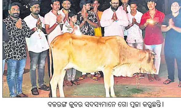
ବଜରଙ୍ଗ କୁବର ସଦସ୍ୟମାନେ ଗୋ ପୂଜା କରୁଛନ୍ତି ।

ସୂଚୀରୁ ରୂପେ ସମ୍ପାଦନ ହେବ ତା'ର ସମ୍ପୂର୍ଣ୍ଣ ଦାୟିତ୍ୱ ବହନ କରିବେ । ମେଡ୍ ପେଣ୍ଡାଲ ଉପକା ୧୨ ଫୁଟ ଓ ବିଦ୍ୟୁତ୍ ତାର ଉପକା ୧୫ ଫୁଟ ମଧ୍ୟରେ ସାମିତ ରଖିବା ପାଇଁ କୁହାଯାଇଥିଲା ।