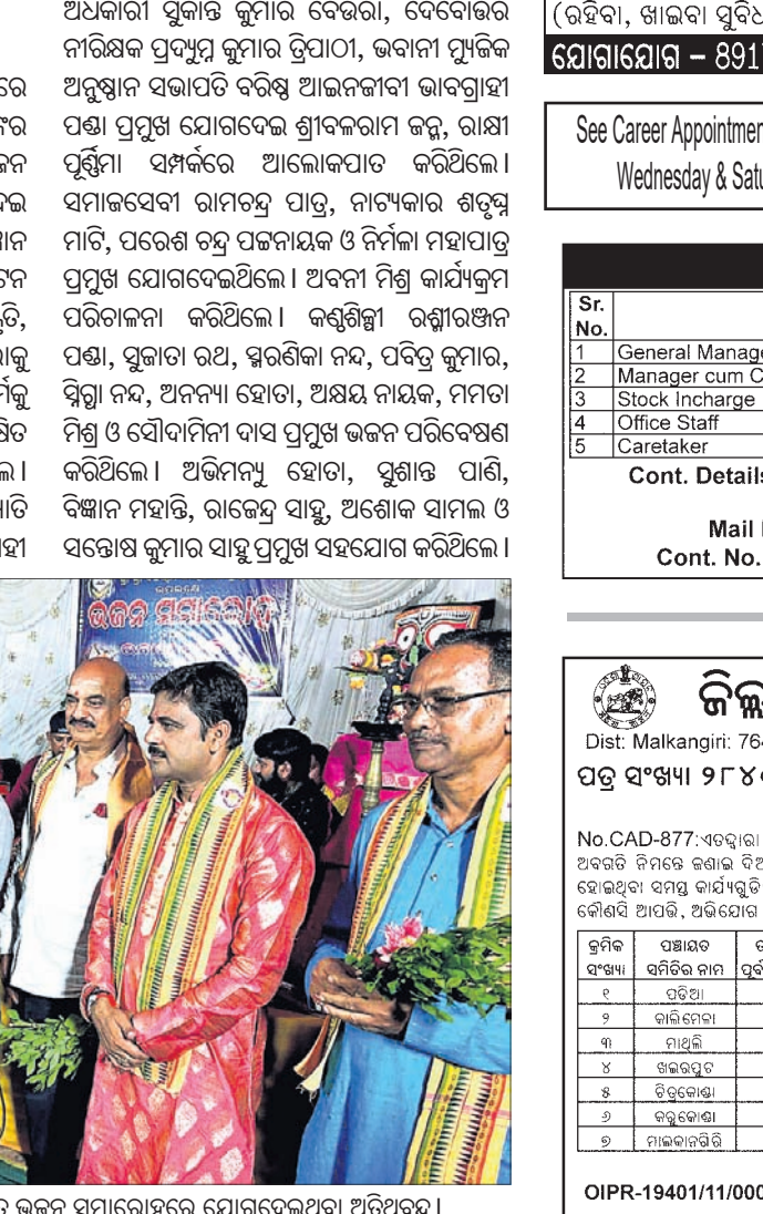
ଶ୍ରୀବଳରାମଙ୍କ ଜନ୍ମ ଉତ୍ସବରେ ଆୟୋଜିତ ଭଜନ ସମାରୋହରେ ଯୋଗଦେଇଥିବା ଅତିଥିବୃନ୍ଦ ।