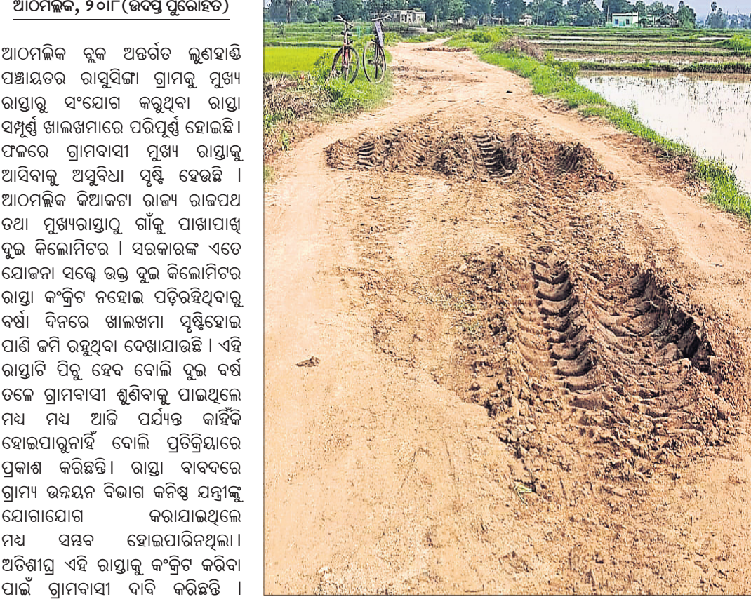
ଆଠନଳିକ, ୨୦୮ (ଉପସ୍ଥାପିତ କରାଯାଇଛି) ।

ଆଠନଳିକ ବୁକ୍ ଅନ୍ତର୍ଗତ ଭୃଗୁସାହି ପଞ୍ଚାୟତର ରାସ୍ତାକୁ ଗ୍ରାମକୁ ମୁଖ୍ୟ ରାସ୍ତାରୁ ସଂଯୋଗ କରୁଥିବା ରାସ୍ତା ସମ୍ପୂର୍ଣ୍ଣ ଖାଲଖମାରେ ପରିଣତ ହୋଇଛି । ଫଳରେ ଗ୍ରାମବାସୀ ମୁଖ୍ୟ ରାସ୍ତାକୁ ଆସିବାକୁ ଅସୁବିଧା ସୃଷ୍ଟି ହେଉଛି । ଆଠନଳିକ କିଆକଟା ରାଜ୍ୟ ରାଜପଥ ତଥା ମୁଖ୍ୟରାସ୍ତାକୁ ଗାଁକୁ ପାଖାପାଖି ବୁକ୍ କିଲୋମିଟର । ସରକାରଙ୍କ ଏବେ ଯୋଜନା ସହେ ଉନ୍ନତ ବୁକ୍ କିଲୋମିଟର ରାସ୍ତା କଂକ୍ରିଟ ନହୋଇ ପଡ଼ିଉଠିଥିବାରୁ ବର୍ଷା ଦିନରେ ଖାଲଖମା ସୃଷ୍ଟିହୋଇ ପାଣି ଜମି ରହିଥିବା ଦେଖାଯାଉଛି । ଏହି ରାସ୍ତାଟି ପିଚ୍ ହେବ ବୋଲି ବୁକ୍ ବର୍ଷ ତଳେ ଗ୍ରାମବାସୀ ଶୁଣିବାକୁ ପାଇଥିଲେ ମଧ୍ୟ ଅଧିକ ପର୍ଯ୍ୟନ୍ତ କାହିଁକି ହୋଇପାରୁନାହିଁ ବୋଲି ପ୍ରତିକୃତ୍ତିରେ ପ୍ରକାଶ କରିଛନ୍ତି । ରାସ୍ତା ବାବଦରେ ଗ୍ରାମ୍ୟ ଭରଣ ଦିବାନ କମିଷ୍ନି ଯନ୍ତ୍ରଣା ଯୋଗାଯୋଗ କରାଯାଇଥିଲେ ମଧ୍ୟ ସମୟ ହୋଇପାରିନଥିଲା । ଅତିଶୀଘ୍ର ଏହି ରାସ୍ତାକୁ କଂକ୍ରିଟ କରିବା ପାଇଁ ଗ୍ରାମବାସୀ ଦାବି କରିଛନ୍ତି ।