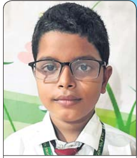
ସାଦ୍ୟାନ୍ତ ଶତପଥୀ କ୍ଲାସ୍-୨, ମଦର୍ସ ପବ୍ଲିକ୍ ସ୍କୁଲ, ପୁରୀ