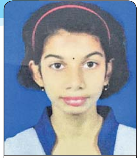
ଆଦ୍ୟାଶ୍ରୀ ରଥ କ୍ଲାସ୍-୨, ସରସ୍ୱତୀ ଶିଶୁ ବିଦ୍ୟାଳୟ, ଭଞ୍ଜନଗର, ଗଞ୍ଜାମ