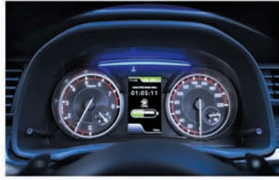
Multi-information Display (Dedicated CNG Fuel Gauge)