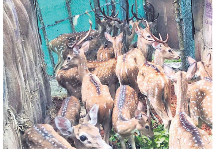
ସମ୍ବଲପୁର ତିଡ଼ିଆଖାନାକୁ ସ୍ଥାନାନ୍ତର ହେଉଥିବା ତିଡ଼ିଆ ହରିଶଙ୍କୁ

ସମ୍ବଲପୁର, ୧୬୭ (ପ୍ରମୋଦ ବହିବର) ସମ୍ବଲପୁର ପ୍ରାଣା ଉଦ୍ୟାନକୁ ମହାବଳ ବାଘ ଆଣିବା ପ୍ରସ୍ତାବ ଥିବାକୁ ସେଠାକୁ ତିନି ହରିଶଙ୍କୁ ଡେଇଁବାର ଅଭୟାଶୟରେ ଛାଡ଼ି ଦିଆଯାଇଛି।