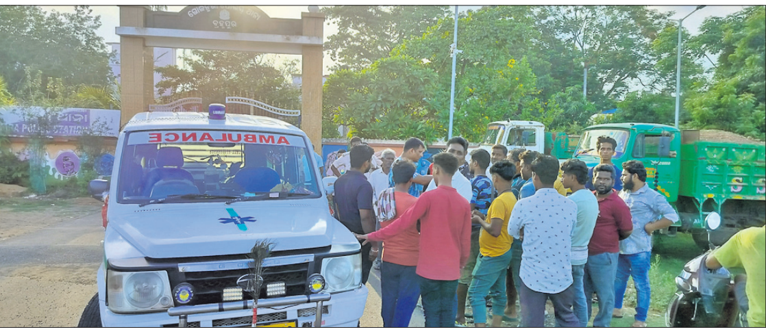
ଅଟକ ରଖି ନ ଥିବା କହିଲା ପୋଲିସ

ପୋଲିସ ଜିମା ଦିଆଯାଇଥିବା ଜଣେ ନବବଧୂ ହତ୍ୟା ଅଭିଯୁକ୍ତ ସ୍ୱାମୀ ଫାଣ୍ଡିରୁ ଚମ୍ପଟ ମାରିଥିବା ଅଭିଯୋଗ ହୋଇଛି। ତେବେ ପୋଲିସ ଏହାକୁ ଅସ୍ୱୀକାର କରିବା ସହ କାହାକୁ ଅଟକ ରଖି ଥିବା କହିଛି।