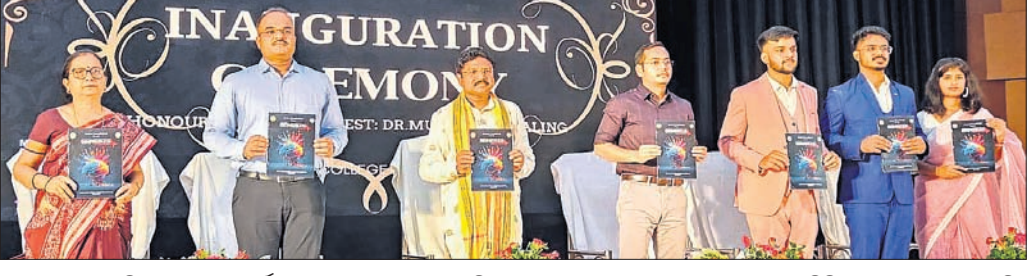
ଆମ ଭୋଜ ମେଡିକାଲ କଲେଜ ବାର୍ଷିକ ଉତ୍ସବ ସମାରୋହରେ ଅତିଥିମାନେ କଲେଜ ଛାତ୍ର ସଂସଦ ମୁଖପତ୍ର 'କେନିସିଂ'କୁ ଉନ୍ମୋଚନ କରୁଛନ୍ତି।