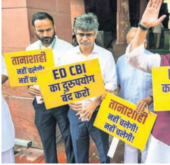
ପାର୍ଲିମେଣ୍ଟ ପରିସରରେ ବିକ୍ଷୋଭ କରୁଛନ୍ତି ଆସ୍ ଏମ୍‌ପି।

ରାଷ୍ଟ୍ରପତି ତ୍ରୌପଦୀ ମୁର୍ଦ୍ଦା ଗୁରୁବାର ଲୋକ ସଭା ଓ ରାଜ୍ୟ ସଭାରେ ମିଳିତ ଅଧିବେଶନକୁ ସମ୍ବୋଧିତ କରୁଥିବାବେଳେ ଆସ୍ ଏମ୍‌ପିମାନେ ରିପଦଦାରୀ ପ୍ରତିବାଦରେ ଏହାକୁ ବର୍ଜନ କରିଛନ୍ତି। ମନିଲଣ୍ଡର୍ ମାମଲାରେ ପ୍ରବର୍ତ୍ତନ ନିର୍ଦ୍ଦେଶାଳୟ (ଇଡି) ଦ୍ୱାରା ରିପଦ ହୋଇ ତିହାର କେଲରେ ଥିବା ଅରିବିଦ୍ କେକ୍ରିଓଲକୁ ଅବକାରୀ ଦୁର୍ଗତି