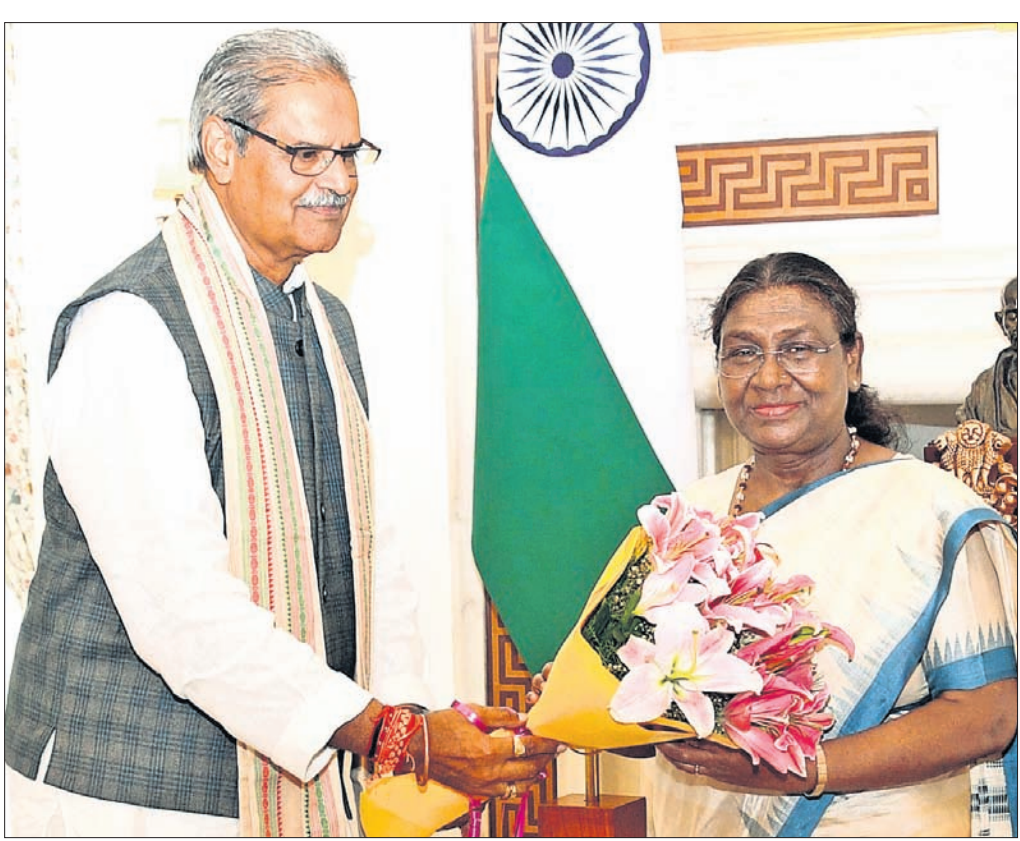
ନୂଆଦିଲ୍ଲୀଠାରେ ରାଷ୍ଟ୍ରପତି ତ୍ରିପାଦୀ ମୁର୍ମୁଙ୍କୁ ସାକ୍ଷାତ କରିଛନ୍ତି ଉପମୁଖ୍ୟମନ୍ତ୍ରୀ ଜନକ ବର୍ଦ୍ଧନ ସିଂହେଓ।