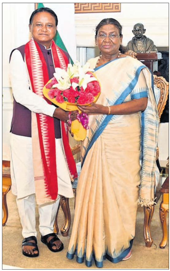
ନୂଆଦିଲ୍ଲୀରୁ ରାଷ୍ଟ୍ରପତି ଭବନରେ ରୁରୁବାର ରାଷ୍ଟ୍ରପତି ଦ୍ରୌପଦୀ ମୁର୍ମୁଙ୍କୁ ସାକ୍ଷାତ କରୁଛନ୍ତି ମୁଖ୍ୟମନ୍ତ୍ରୀ ମୋହନ ଚରଣ ମାଝୀ ।