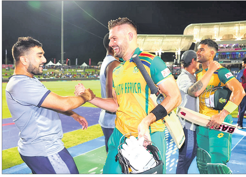
ମ୍ୟାଚ ପିନ୍ଧିଶୁଣି ଫେରୁଥିବା ଅଧିନାୟକ ଏତେନ ମାରକ୍ରମକ ଚାଟ୍ରାଜକ୍ ଶାମ୍ସି ଅଭିନନ୍ଦନ ଜଣାଉଛନ୍ତି।

ଆଇସିସି କ୍ରିକେଟ ବିଶ୍ୱକପ୍ରେ ସେମିଫାଇନାଲରେ ପରାଜୟ ଧାରା ଭାଙ୍ଗିଛି ଦକ୍ଷିଣ ଆଫ୍ରିକା। ଘାତକ ବୋଲିଂ କରି ଏହି ଦଳ ଗୁରୁବାର ଅନୁଷ୍ଠିତ ଚିତ୍ର ୨୦ କ୍ରିକେଟ ବିଶ୍ୱକପ୍ରେ ସେମିଫାଇନାଲରେ ଆଫଗାନିସ୍ତାନକୁ ୯ ରନରୁ ହରାଇ ପ୍ରଥମଥର ପାଇଁ କୌଣସି ଆଇସିସି ବିଶ୍ୱକପ୍ରେ ଫାଇନାଲରେ ପ୍ରବେଶ କରିଛି ଏହି ଆଫ୍ରିକୀୟ ଦଳ। ପୂର୍ବରୁ ୬ ଥର ବିଭିନ୍ନ ବିଶ୍ୱକପ୍ରେ ସେମିଫାଇନାଲ ଖେଳିବା ସତ୍ତ୍ୱେ ନିରାଶ ହୋଇଥିବା ଦକ୍ଷିଣ ଆଫ୍ରିକା ଏଥର ୮ମ ଉଦ୍ୟମରେ ଫାଇନାଲରେ ପ୍ରବେଶ କରି ଇତିହାସ ରଚିଛି। ଏହି ଦଳ ୬ ଥର ସେମିଫାଇନାଲରେ ସିଧାସଳଖ ପରାଜିତ ହୋଇଥିଲା। ୧୯୯୯ ବିଶ୍ୱକପ୍ରେ ଅଷ୍ଟ୍ରେଲିଆ-ଦକ୍ଷିଣ ଆଫ୍ରିକା ସେମିଫାଇନାଲ ଟାଇ ହୋଇଥିଲେ ହେଁ ସୁପର-୬ର ଉନ୍ନତ ଦଳଭାବେ ଅଷ୍ଟ୍ରେଲିଆ ଫାଇନାଲରେ ପ୍ରବେଶ କରିଥିଲା। ଏଥର କିନ୍ତୁ ଏହି ଧାରାରେ ପରିବର୍ତ୍ତନ ଆଣିଛି ଏତେନ ମାରକ୍ରମକ ଦଳ। ସମ୍ପୂର୍ଣ୍ଣ ଏକପାଖିଆଭାବେ ଶେଷ ହୋଇଥିବା ମ୍ୟାଚରେ ଆଫଗାନିସ୍ତାନ ୧୧.୫ ଓଭରରେ ୫୬ ରନରେ ଅଲଆଉଟ ହୋଇଥିବାବେଳେ ଦକ୍ଷିଣ ଆଫ୍ରିକା ୮.୫ ଓଭରରେ ୧ ରନକେତ ହରାଇ ୬୦ ରନ ସଂଗ୍ରହ କରି ନେଇଥିଲା। ୩ଟି ରନକେତ ନେଇ ଆଫଗାନିସ୍ତାନର ବ୍ୟାଟିଂ ମେଡୁଲକୁ ଭାଙ୍ଗିଥିବା ଦକ୍ଷିଣ ଆଫ୍ରିକାର ମାର୍କୋ କାନସେନ ପ୍ଲେୟର ଅଫ୍ ଦି ମ୍ୟାଚ ବିବେଚିତ ହୋଇଥିଲେ।