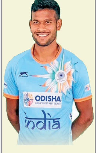
ଭାରତୀୟ ହକିର ପ୍ରାୟୋଜକ ହେବ ଆମରି ଓଡ଼ିଶା ପୁଣି ନବୀନଙ୍କ ପରି ମୋହନ ସର୍କାର ସମର୍ଥନ ଦେବେ ମଣି ଗୋଟି ଗୋଟି ଯାଆ। ଗଣ ଦେଶ ବିଦେଶରେ ସବୁଠି ମହକେ ଓଡ଼ିଆ, ଓଡ଼ିଶା ପାଣି। -ସୁବାସ ଚନ୍ଦ୍ର ପ୍ରଧାନ