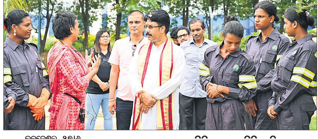
ଭୁବନେଶ୍ୱର, ୨୭।୬ (ବନ୍ଦନା ସେଠୀ)