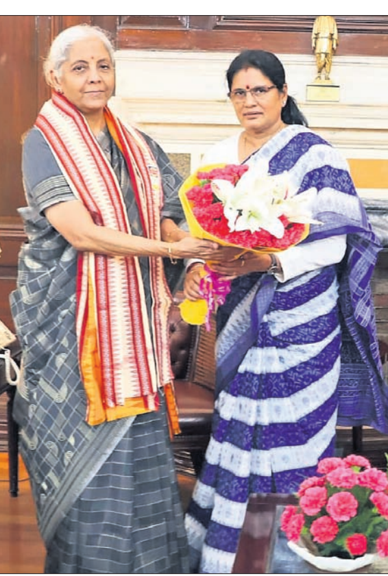
ନୂଆଦିଲ୍ଲୀଠାରେ ଅର୍ଥମନ୍ତ୍ରୀ ନିର୍ମଳା ସାତାରାମଶଙ୍କୁ ସାକ୍ଷାତ କରିଛନ୍ତି ଉପମୁଖ୍ୟମନ୍ତ୍ରୀ ପ୍ରଭାତୀ ପରିଡ଼ା।