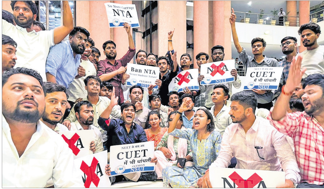
ନୂଆଦିଲ୍ଲୀସ୍ଥିତ ଏନ୍‌ଟିଏ କାର୍ଯ୍ୟାଳୟରେ ଗୁରୁବାର କଂଗ୍ରେସ ଛାତ୍ରଶାଖା ଏନ୍‌ଏସ୍‌ୟୁଆଇ କର୍ମକର୍ମୀ ପ୍ରବେଶ କରି ବିକ୍ଷୋଭ ପ୍ରଦର୍ଶନ କରୁଛନ୍ତି।

ନୂଆଦିଲ୍ଲୀ, ୨୭/୬ ମେ' ୫ରେ ଅନୁଷ୍ଠିତ ଏନ୍‌ଇଇଟି-ୟୁଜି ପରୀକ୍ଷାରେ ଦୁର୍ଗତି ଯୋଗୁ ପ୍ରାୟ ୨୪ ଲକ୍ଷ ପିଲାଙ୍କ ଭବିଷ୍ୟତ ଅନ୍ଧକାର ଭିତରକୁ