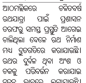
ନାୟକ, ଗଜେନ୍ଦ୍ର ସେଠା, ଧ୍ରୁବ ପାଣ୍ଡେ, ରୁକୁଣାପାଣି ପାଣ୍ଡେ, ବସନ୍ତ ମହାକୁଟ ପ୍ରମୁଖ ରଥ କାର୍ଯ୍ୟରେ ଜୋର୍ସୋରରେ

ଲାଗିଛି। ସେହିପରି ଭାବେ ରଥ ଚକରେ ନୂତନ ଭାବେ ଖମ୍ବ ଲାଗାଯାଇଥିବା ଦେଖାଯାଇଛି।