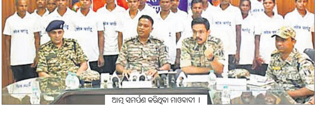
ଆତ୍ମ ସମର୍ପଣ କରିଥିବା ମାଓବାଦୀ ।

ଜିଲ୍ଲାର ମାଓବାଦୀ ସଙ୍ଗଠନରେ ସାମିଲ ଥିବା ବେଳେ ବିଭିନ୍ନ ହିଂସାକାଣ୍ଡରେ ମଧ୍ୟ ଜଡିତଥିଲେ। ପୋଲିସ ଜିଲ୍ଲାର ବିଭିନ୍ନ ସ୍ଥାନରେ କମ୍ପାଣି ବସାଇବା ଘରକୁ ଫେରିଆସି ଅଭିଯାନରେ ଆକୃଷ୍ଟ ହୋଇ ଗୁରୁବାର ଦାନ୍ତେଓଡ଼ା ପୋଲିସ ନିକଟରେ ୫ ପୁରୁଷଙ୍କ ଗୋଷ୍ଠିତକ ସହ ୧୭ ମାଓବାଦୀ ଆତ୍ମସମର୍ପଣ କରିଛନ୍ତି। ଏହି ୧୭ ଜଣ ଦାନ୍ତେଓଡ଼ା