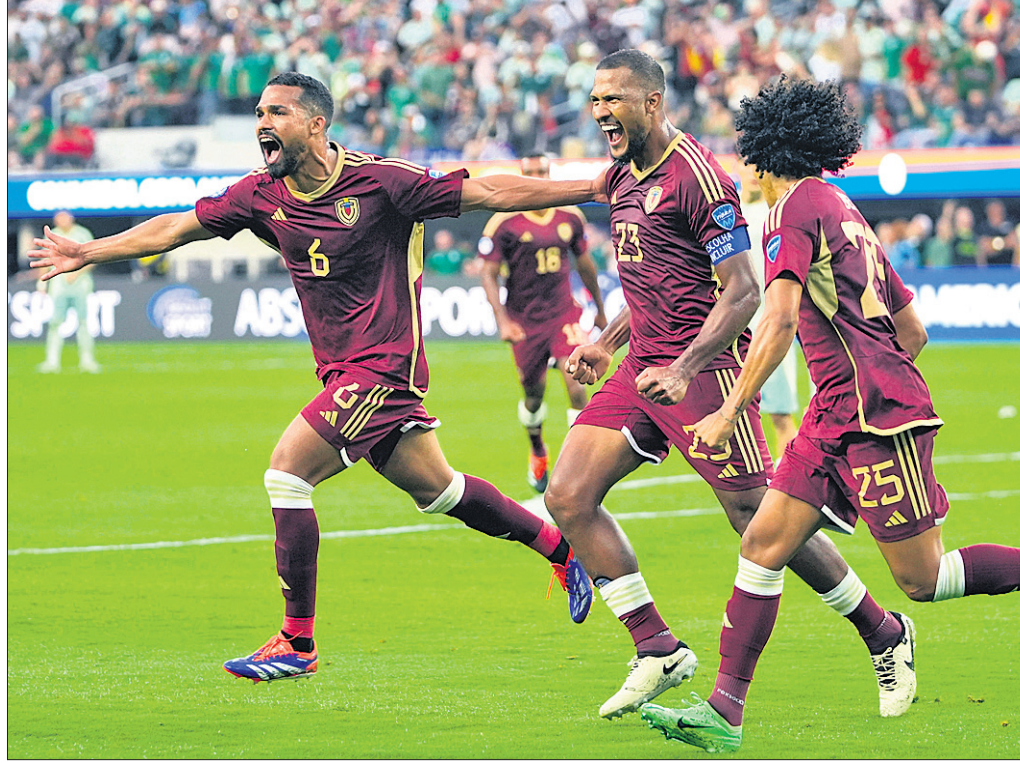
ମ୍ୟାଚ ଜିତିବା ପରେ ଭେନେଜୁଏଲା ଖେଳାଳିଙ୍କ ଆନନ୍ଦ ଉତ୍ସାହ।