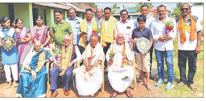
କାର୍ଯ୍ୟକ୍ରମରେ ଅତିଥିକ ଗଣଗଣେ କୃତା ଛାତ୍ରଛାତ୍ରୀମାନେ।