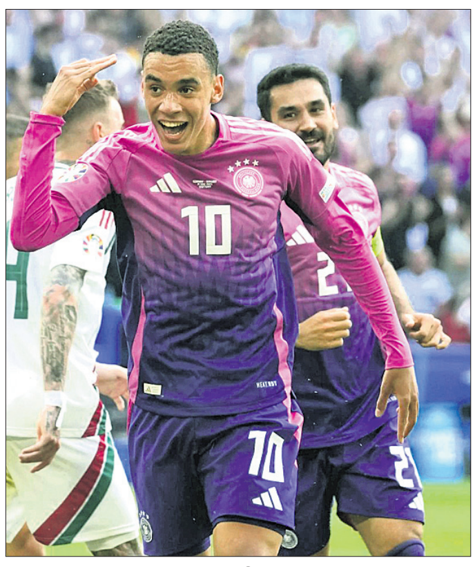
ଗୋଲ୍ ଷ୍ଟୋର ପରେ ଉଲ୍‌ସିଡ ଜର୍ମାନ ପୂର୍ବୀକର।

ଭସେଲଡର୍ଟ୍, ୨୦୧୬ (ପି.ଟି.) ଜର୍ମାନୀରେ ଅନୁଷ୍ଠିତ ସୁପର କପ୍ ଫୁଟବଲ ୨୦୨୪ରେ ଗୁରୁବାର ଜର୍ମାନୀ ବିଜୟୀ ହୋଇଥିବା ବେଳେ ଷ୍ଟରଲିଣ୍ଡା, ସୁଇଜରଲ୍ୟାଣ୍ଡ, ସ୍ଲୋଭେନିଆ ଓ ସର୍ବିୟା ପ୍ରମୁଖ ବାକିଥିଲା। ଆୟୋଜକ ଜର୍ମାନୀ ବୁଧବାର ରାତିରେ ଅନୁଷ୍ଠିତ ମ୍ୟାଚ୍‌ରେ ହଙ୍ଗେରୀକୁ ୨-୦ରେ ପରାସ୍ତ କରିଥିଲା। ସ୍ଲୋଭେନିଆ ୧-୧