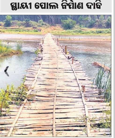
ପଞ୍ଚାୟତବାସୀ ନିର୍ଭର କରୁଥିବା ବାଉଁଶପୋଲ।

ଚଞ୍ଚୁଆ, ୨୦୧୬ (ମହେଶ୍ୱର ଦାସ) କେନ୍ଦୁଝର ଜିଲ୍ଲା ଚଞ୍ଚୁଆ ବ୍ଲକ୍ ଅନ୍ତର୍ଗତ କରଖିଆ ପଞ୍ଚାୟତର କାର୍ଯ୍ୟକ୍ରମରେ ବୈତରଣୀ ନଦୀ ଉପରେ ନିର୍ମାଣ ହୋଇଥିବା ଅସ୍ଥାୟୀ ବାଉଁଶପୋଲ ୨ ଜିଲ୍ଲାକୁ ଯୋଡ଼ୁଛି।