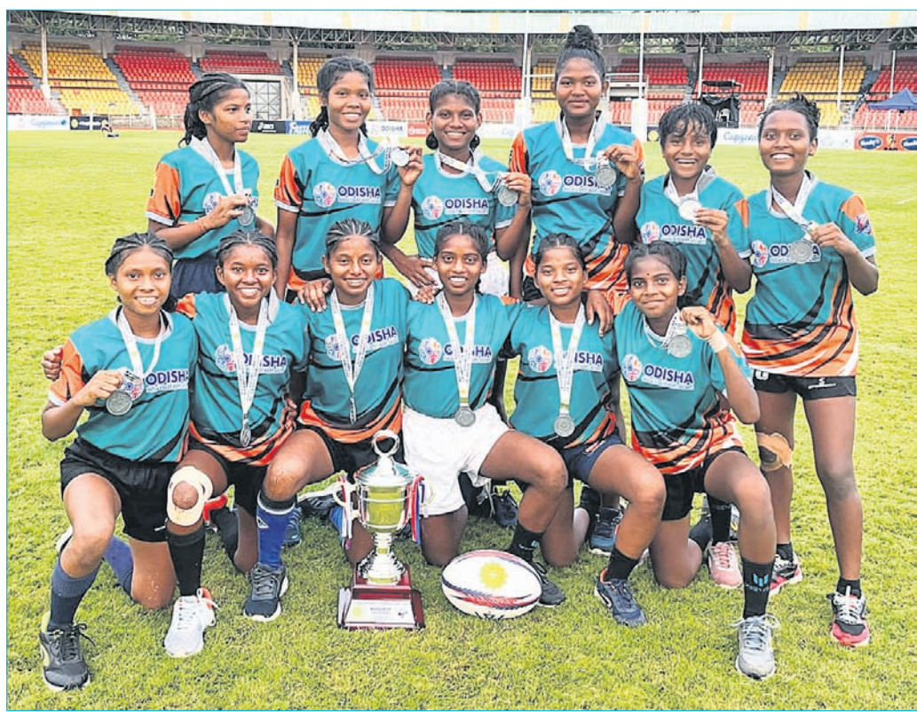
ପୁଣେରେ ଅନୁଷ୍ଠିତ ୧୮ ବର୍ଷରୁ କମ୍ ଜାତୀୟ ମହିଳା ରଗ୍ବୀରେ ରନର୍ ଅପ୍ ଓଡ଼ିଶା ଦଳ। ପାଇନାଲରେ ଓଡ଼ିଶା ୦-୧ରେ ବିହାର ନିକଟରୁ ହାରିଥିଲା।

ଘ୍ୟାରିସ୍ ଅଲିମ୍ପିକ୍ସ ପାଇଁ ଗୁରୁବାର ଭାରତୀୟ ସାମ୍ଭାବ୍ୟ ହକି ଦଳ ଘୋଷଣା କରାଯାଇଛି। ୨୭ ଜଣିଆ ଦଳକୁ ସ୍ତମ୍ଭକର ଦିଲ୍ ପ୍ରାଚୀ ଏକମାତ୍ର ଖେଳାଳି ଭାବରେ ବାଦ ପଡିଛି। ବେଙ୍ଗାଲୁରୁ ସାଲ୍ ସେଣ୍ଟରରେ ଜୁନ୍ ୨୧ରୁ ଆରମ୍ଭ ହେବାରୁ ଥିବା ହକି କ୍ୟାମ୍ପ କୁଳାଜ ୮ ଯାଏ ଚାଲିବ। ଅଲିମ୍ପିକ୍ସ ପାଇଁ ଭାରତ କଣ୍ଠସାଧକ ଗ୍ରୁପ୍ ବିରେ ସ୍ଥାନ ପାଇଛି। ଭାରତ ସହିତ ବେଲଜିୟମ, ଆର୍ଜେଣ୍ଟିନା, ନ୍ୟୁଜିଲାଣ୍ଡ, ଅଷ୍ଟ୍ରେଲିଆ ଓ ଆୟର୍ଲ୍ୟାଣ୍ଡ ଏହି ଗ୍ରୁପରେ ସ୍ଥାନ ପାଇଛନ୍ତି। ଭାରତୀୟ ଦଳ ଏଫଆଇଏଚ୍ ପ୍ରୋ ଲିଗ୍ ଖେଳି ସାରି ପ୍ରତ୍ୟାବର୍ତ୍ତନ କରିଛି। ଭାରତ ୧୬ ମ୍ୟାଚ୍ ଖେଳି ୨୪ ପଏଣ୍ଟ୍ ସହ ଚତୁର୍ଥ ସ୍ଥାନରେ ରହିଛି।