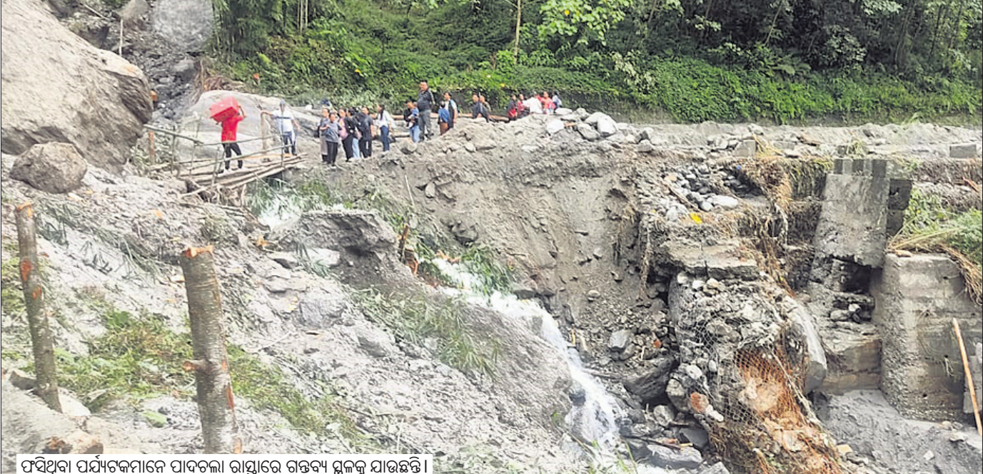
ଏଥିପାଇଁ ପର୍ଯ୍ୟଟକମାନେ ପାଦଚଳା ରାସ୍ତାରେ ଗତବ୍ୟ ସ୍ଥଳକୁ ଯାଉଛନ୍ତି।

କେନ୍ଦୁଝର, ୨୦୧୬ (ନରେଶ ଚନ୍ଦ୍ର ପଟ୍ଟନାୟକ) ଦୀର୍ଘ ପ୍ରାୟ ୮ ଦିନ ଧରି ଆସାମର ବିଭିନ୍ନ ସ୍ଥାନରେ ପ୍ରାକୃତିକ ବିପର୍ଯ୍ୟୟ କାରଣରୁ ଭୂସ୍ଖଳନ ହୋଇ ଗମନାଗମନ ବନ୍ଦ ହୋଇଯାଇଥିଲା।