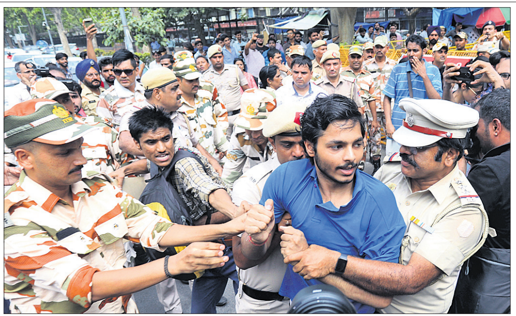
ନୂଆଦିଲ୍ଲୀସ୍ଥିତ ଶିକ୍ଷା ମନ୍ତ୍ରଣାଳୟ ଆଗରେ ଗୁରୁବାର ବିକ୍ଷୋଭରତ ଛାତ୍ରଙ୍କୁ ପୋଲିସ୍ ଉଠାଇନେଇଛି।

ଡାକ୍ତରୀ ପାଠ୍ୟକ୍ରମ ପାଇଁ ଉଦ୍ଦିଷ୍ଟ ପ୍ରବେଶିକା ପରୀକ୍ଷା ଏନ୍‌ଇଟି-ୟୁଜି ୨୦୨୪ ଆୟୋଜନରେ ଦୁର୍ନୀତି ଓ ଅନିୟମିତତା ଯୋଗୁ ୨୪ ଲକ୍ଷ ଛାତ୍ରଛାତ୍ରଣୀଙ୍କୁ ଭବିଷ୍ୟତ ଅନ୍ଧକାର ଭିତରକୁ ଠେଲି ହୋଇଯାଇଛି। ତେଣୁ ଉକ୍ତ ପରୀକ୍ଷାକୁ ସମ୍ପୂର୍ଣ୍ଣ ରଦ୍ଦକରି ଅଦାଲତଙ୍କ ତତ୍ପରଦର୍ଶନରେ ଏହାର ତଦନ୍ତ କରାଯାଇ ବୋଲି ସୁପ୍ରିମକୋର୍ଟର ଏକାଧିକ ପିଟିଶନ ଦାଖଲ ହୋଇଛି। ସୁପ୍ରିମକୋର୍ଟ ଗୁରୁବାର କେନ୍ଦ୍ର ସରକାର ଏବଂ ପରୀକ୍ଷା ଆୟୋଜକ ନ୍ୟାଶନାଲ ଟେଷ୍ଟିଂ ଏଜେନ୍ସି (ଏନ୍‌ଟିଏ)କୁ ଏହା ଉପରେ ଜବାବ ମାଗିଛନ୍ତି। ଏଥିସହ ବିଭିନ୍ନ ହାଇକୋର୍ଟରେ ଦାଲଖ ହୋଇଥିବା ଏ ସମ୍ପର୍କିତ ପିଟିଶନଗୁଡ଼ିକର ଶୁଣାଣି ଉପରେ ମଧ୍ୟ ଶୀର୍ଷ ଅଦାଲତ ସ୍ଥଗିତାବେଶ ଜାରି କରିଛନ୍ତି। ତେବେ ଇତିମଧ୍ୟରେ କାଉନ୍ସେଲିଂ ପ୍ରକ୍ରିୟା ଜାରି ରହିବ ବୋଲି ସୁଇଚ୍‌କଣିଆ ଖଣ୍ଡପୀଠ ସ୍ପଷ୍ଟ କରିଛନ୍ତି। ଦେଶର ସରକାରୀ ଏବଂ ଘରୋଇ ଅନୁଷ୍ଠାନଗୁଡ଼ିକରେ ଏମିତିଏସ୍, ଡିଟିଏସ୍, ଆୟୁଷ ଓ ଅନ୍ୟ ସମ୍ପର୍କିତ ପାଠ୍ୟକ୍ରମରେ ନାମଲେଖା ପାଇଁ ନ୍ୟାଶନାଲ ଏଲିଜବିଲିଟି-କମ୍-ଏଣ୍ଟ୍ରୀ (ଏନ୍‌ଇଟି-ୟୁଜି) ପ୍ରବେଶିକା ପରୀକ୍ଷା ଗତ ମେ ୪ରେ ଅନୁଷ୍ଠିତ ହୋଇଥିଲା।