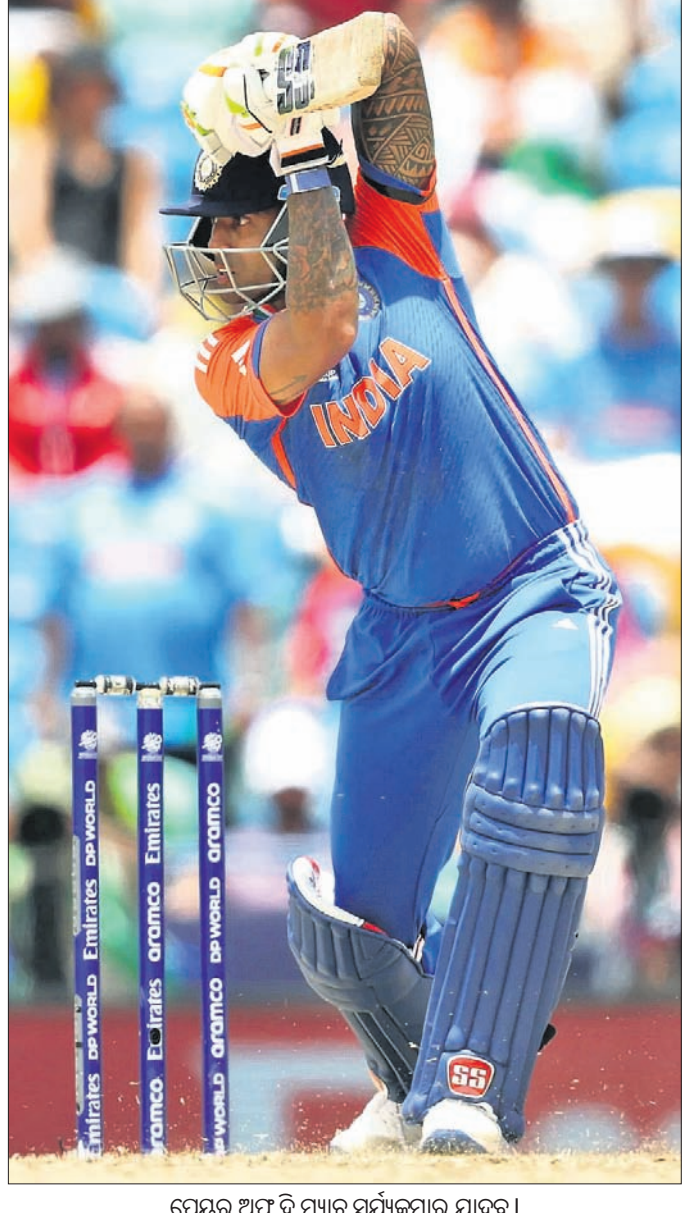
ପ୍ଲେୟର୍ ଅଫ ଦି ମ୍ୟାଚ୍ ସୂର୍ଯ୍ୟକୁମାର ଯାଦବ।

ସୂର୍ଯ୍ୟକୁମାର ଯାଦବଙ୍କ ଅର୍ଦ୍ଧଶତକ ଓ ଯଶପ୍ରୀତ୍ କୁମାରଙ୍କ ଘାଟକ ବୋଲିଂ ବଳରେ ଆଫଗାନିସ୍ତାନ ବିପକ୍ଷ ଡି୨୦ ବିଶ୍ୱକପ ସୁପର-୮ ମ୍ୟାଚକୁ ୪୭ ରନ୍ରେ ଜିତି ନେଇଛି ଭାରତ। ଭାରତ ୨୦ ଓଭରରେ ୮ ରନକେଟ ହରାଇ ୧୮୧ ରନ୍ ସ୍କୋର କରିଥିଲା। ଜବାବରେ ଆଫଗାନିସ୍ତାନ ୨୦ ଓଭରରେ ସମସ୍ତ ରନକେଟ ହରାଇ ୧୩୪ ରନ୍ କରିଥିଲା।