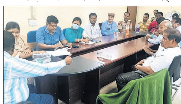
ବୈଠକରେ ଉପସ୍ଥିତ ପ୍ରଶାସନିକ ଅଧିକାରୀମାନେ।

ଓଡ଼ିଶା, ୨୦୧୭(ପରିଷ୍ଟିତ ନାୟକ) କମିଟି, ହିନ୍ଦୋଳ ରୋଡ ବଜାର ପରିଚାଳନା କମିଟି, ସାଧୁ, ଜଳ ଓ ପରିମଳ, ବିଦ୍ୟୁତ୍, ଅଗ୍ନିଶମ, ସେବାକୁ ଥିବା ଉପଖଣ୍ଡ ନିମନ୍ତେ ଗୁରୁବାର ଓଡ଼ିଶା ଚଳାଣି କାର୍ଯ୍ୟକ୍ରମରେ ଏକ ପ୍ରସ୍ତୁତି ବୈଠକ ଅନୁଷ୍ଠିତ ହୋଇଯାଇଛି। ଓଡ଼ିଶା ଚଳାଣି କାର୍ଯ୍ୟକ୍ରମରେ ଏକ ପ୍ରସ୍ତୁତି ବୈଠକ ଅନୁଷ୍ଠିତ ହୋଇଯାଇଛି। ଓଡ଼ିଶା ଚଳାଣି କାର୍ଯ୍ୟକ୍ରମରେ ଏକ ପ୍ରସ୍ତୁତି ବୈଠକ ଅନୁଷ୍ଠିତ ହୋଇଯାଇଛି।