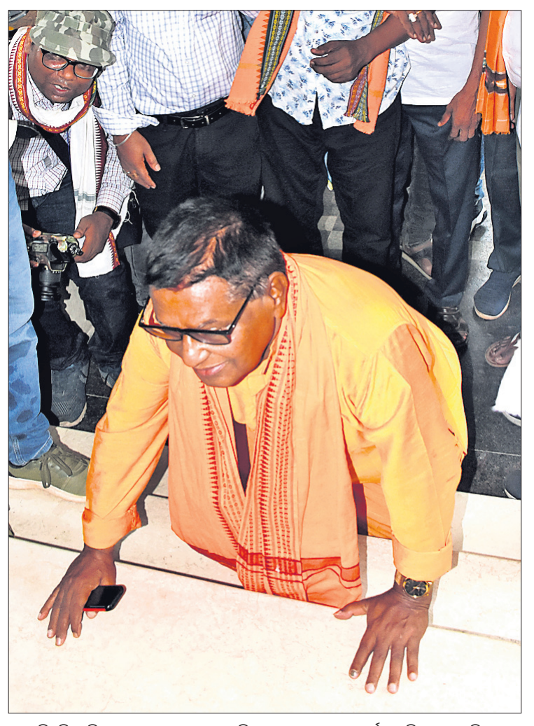
ସମ୍ବୁଦ୍ଧିଆ ବିଧାୟକ ପଦ୍ମଲୋଚନ ପଣ୍ଡା ବିଧାନସଭାକୁ ପ୍ରବେଶ ପୂର୍ବରୁ ମୁଣ୍ଡିଆ ମାରୁଛନ୍ତି।