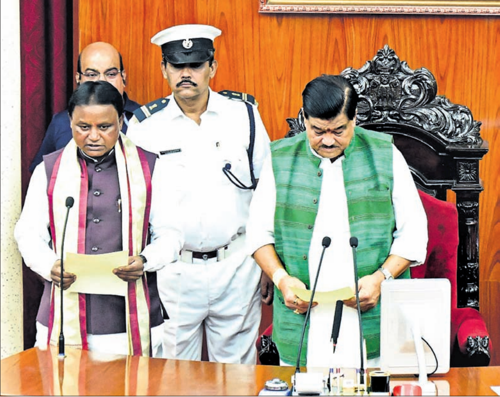
ମୁଖ୍ୟମନ୍ତ୍ରୀ ମୋହନ ଚରଣ ମାଝୀଙ୍କୁ ଶପଥ ପାଠ କରାଇଛନ୍ତି କାମଚଳା ବାଟସ୍ମୃତି ରଶେନ୍ଦ୍ର ପ୍ରତାପ ସ୍ୱାଇଁ।