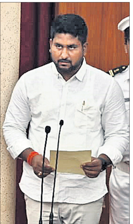
ଉଚ୍ଚଶିକ୍ଷାମନ୍ତ୍ରୀ ସୂର୍ଯ୍ୟବଂଶୀ ସୁରଜ