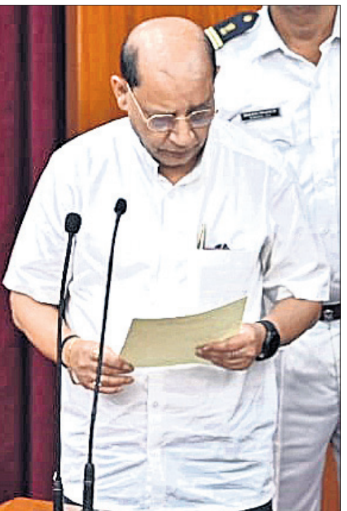
ରେଡ଼ାଖୋଳ ବିଧାୟକ ପ୍ରସନ୍ନ ଆଚାର୍ଯ୍ୟ