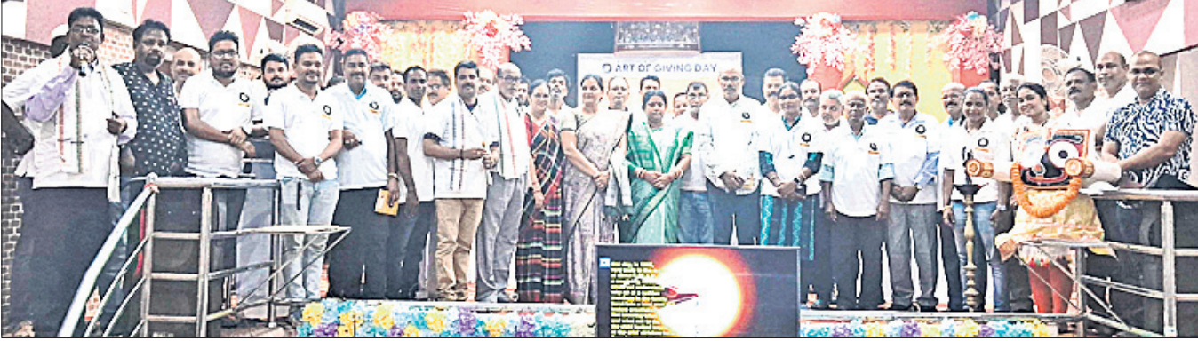
ଆର୍ଟ ଅଫ୍ ଗିଫ୍ ଦିବସ ପାଳନ ଅବସରରେ ଅତିଥି ଓ ଶୁଭେଚ୍ଛୁମାନେ ।

ଦେଈାନାଳ, ୧୭।୬(ରତନ ନାୟକ) ଗୋପବନ୍ଧୁ ଗାନ୍ଧୀ ହଲଠାରେ ଯୋମବାର ଆର୍ଟ ଅଫ୍ ଗିଫ୍ ଦିବସ ପାଳିତ ହୋଇଯାଇଛି । ମୁଖ୍ୟ ଅତିଥି ଭାବେ ପୌରାଧିକାରୀ ଉପସଭା ପାତ୍ର ଯୋଗଦେଇ କାର୍ଯ୍ୟକ୍ରମକୁ ଉଦ୍‌ଘାଟନ କରିବା ସହ କହିଲେ ଯେ, ଦେବୀରେ ଆନନ୍ଦ ଥାଏ । କିନ୍ତୁ