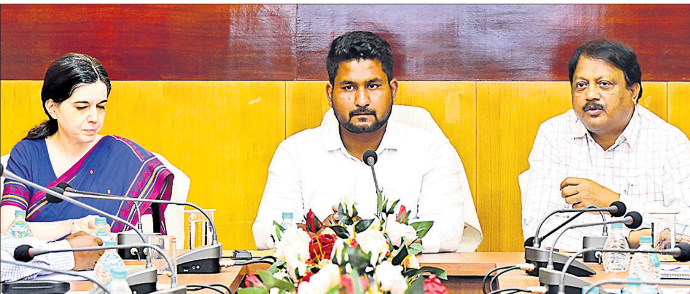
ଓଡ଼ିଆ ଭାଷା, ସାହିତ୍ୟ ଓ ସଂସ୍କୃତି ବିଭାଗ ଅଧିକାରୀଙ୍କ ସହ ମନ୍ତ୍ରୀ ସୂର୍ଯ୍ୟକାନ୍ତ ସୁରଜ (ମଝି)।