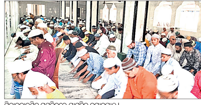
ମିନାବଜାରସ୍ଥିତ ମସଜିଦ୍ରେ ସାମୁହିକ ନମାଜପାଠ ।

ସହରସ୍ଥିତ ବୃତ୍ତିଆନାଳୀଠାରେ ଥିବା ମସଜିଦ୍ରେ ସକାଳୁ ୮ଟା, ମିନାବଜାର ସ୍ଥିତ ମସଜିଦ୍ରେ ସକାଳୁ ସାଢ଼େ ୮ଟା ଓ କାଞ୍ଚନବଜାରସ୍ଥିତ ମସଜିଦ୍ରେ ସକାଳୁ ୯ଟାରେ ସାମୁହିକ ନମାଜ ପାଠ ହୋଇଥିଲା । ସେବା, ସମର୍ପଣ ଓ ପରସ୍ପରକୁ ଆତ୍ମତର୍କ ଶୁଭେଚ୍ଛା ଜଣାଇଥିବା ଦେଖାଯାଇଥିଲା ।