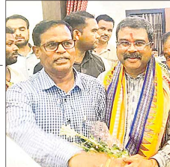
କେନ୍ଦ୍ର ଶିକ୍ଷାମନ୍ତ୍ରୀଙ୍କୁ ଓକିଲ ସଂଘ କର୍ମକର୍ତ୍ତାମାନେ ଭେଟୁଛନ୍ତି।