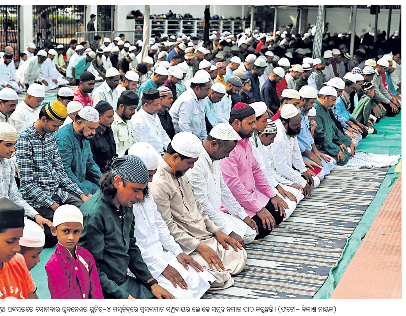
ଭବ-ଭବ-କୂହା ଅବସରରେ ସୋନପୁର ଭୁବନେଶ୍ୱର ଯୁବ-୪ ମସିହାରେ ମୁସଲମାନ ସମ୍ପ୍ରଦାୟର ଲୋକେ ସମୂହ ନମାଜ ପାଠ କରୁଛନ୍ତି।