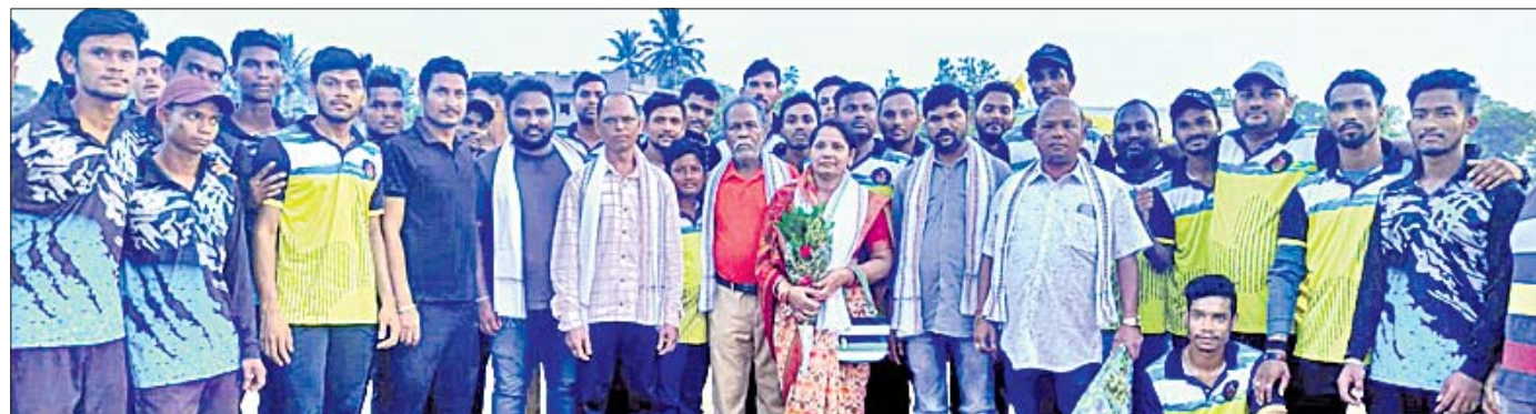
ଗିରାଈ ପ୍ରିମିୟର ଲିଗ୍ କ୍ରିକେଟ ଉଦ୍‌ଯାପନ କାର୍ଯ୍ୟକ୍ରମରେ ଅତିଥି ଓ ଖେଳାଳିମାନେ।

ଅନୁଗୋଳ, ୧୭୬୬ ଅନୁଗୋଳ ଜିଲ୍ଲା ନାଲକୋନଗର ଅନ୍ତର୍ଗତ ଗିରାଈ ଗ୍ରାମ ପଡ଼ିଆରେ ତୃତୀୟ ଗିରାଈ ପ୍ରିମିୟର ଲିଗ୍ କ୍ରିକେଟ ଉଦ୍‌ଯାପିତ ହୋଇଯାଇଛି। ଏହି ଲିଗ୍‌ରେ ମୋଟ ୫ଟି ଟିମ୍ ପୁନଃ ଖରିୟର୍, ଗିରାଈ ପାଠ୍ୟ, ବରଜଙ୍ଗା ଖରିୟର୍, ଲଳାଜିତି ଲଳେଭେନ, ପ୍ରେକ୍ଷ୍ୟ କ୍ଲବ୍ ଅଂଶଗ୍ରହଣ କରିଥିଲେ। ବରଜଙ୍ଗା ଖରିୟର୍ ଓ ଗିରାଈ ପାଠ୍ୟ ମଧ୍ୟରେ ପ୍ରଥମ ମ୍ୟାଚ ଖେଳାଯାଇଥିଲା। ବରଜଙ୍ଗା ଖରିୟର୍ ପ୍ରଥମେ ବ୍ୟାଟ୍