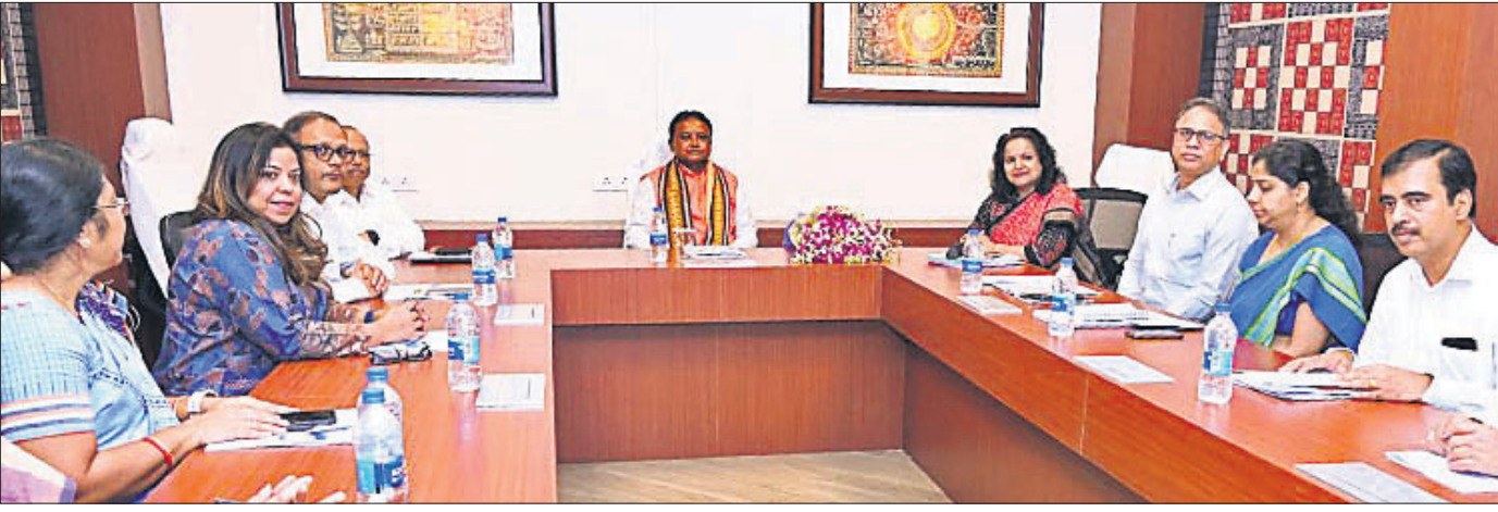
ଜଳ ସମ୍ପଦ ବିଭାଗ ଅଧିକାରୀଙ୍କ ସହ ମୁଖ୍ୟମନ୍ତ୍ରୀ ମୋହନ ଚରଣ ମାଝୀ ଆଲୋଚନା କରୁଛନ୍ତି।