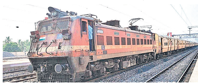
ଝେଣନାଳ, ୧୭.୬ (ରତନ ନାୟକ)