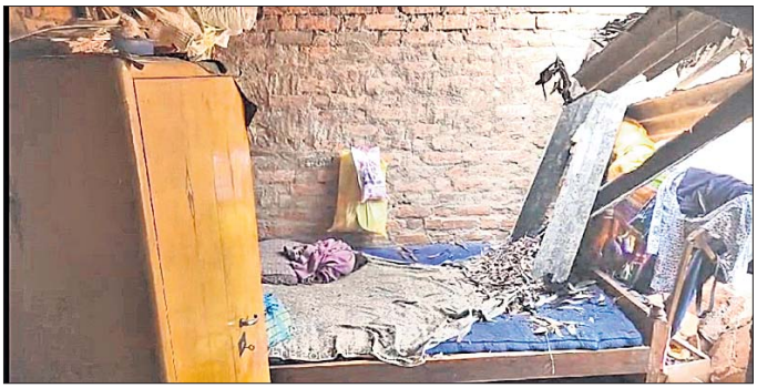
ଛେଡ଼ିପଦା, ୧୭୬୬ (ଅତିକ ଧଳ)