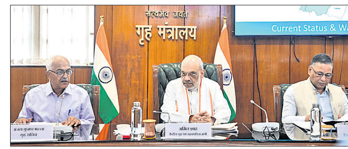
ସ୍ୱରାଷ୍ଟ୍ରମନ୍ତ୍ରୀ ଅମିତ ଶାହା ମଣିପୁର ସୁରକ୍ଷା ସ୍ଥିତିର ସମୀକ୍ଷା କରୁଛନ୍ତି।