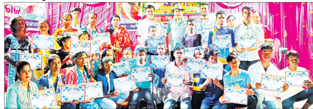
ରଜ ଉତ୍ସବରେ ସାମିଲ ନିତା ନୃତ୍ୟାଙ୍ଗନାର କଳାକାରମାନେ ।

ଦେଈାନାଳ, ୧୭।୬(ରତନ ନାୟକ) ଦେଈାନାଳ ମହର୍ଷି ଦୟାନନ୍ଦ ସର୍ଭିସ ମିଶନ ଶିଶୁଗୃହଠାରେ ନୃତ୍ୟ ଅନୁଷ୍ଠାନ ମହୋତ୍ସବ ମହା ସମାରୋହରେ ପାଳନ କରାଯାଇଛି । ପ୍ରାରମ୍ଭରେ ଶିଶୁ ଗୃହ ଅନୁଷ୍ଠାନର ଛାତ୍ରାଛାତ୍ରମାନଙ୍କ ସହ ନିତା ନୃତ୍ୟାଙ୍ଗନା ଅନୁଷ୍ଠାନର ଛାତ୍ରାଛାତ୍ରମାନେ ମିଶି ବହୁ ସୁନ୍ଦର ଭାବରେ ରଜ ଉତ୍ସବ ପାଳନ କରିଥିଲେ ଏବଂ ବୋଲି