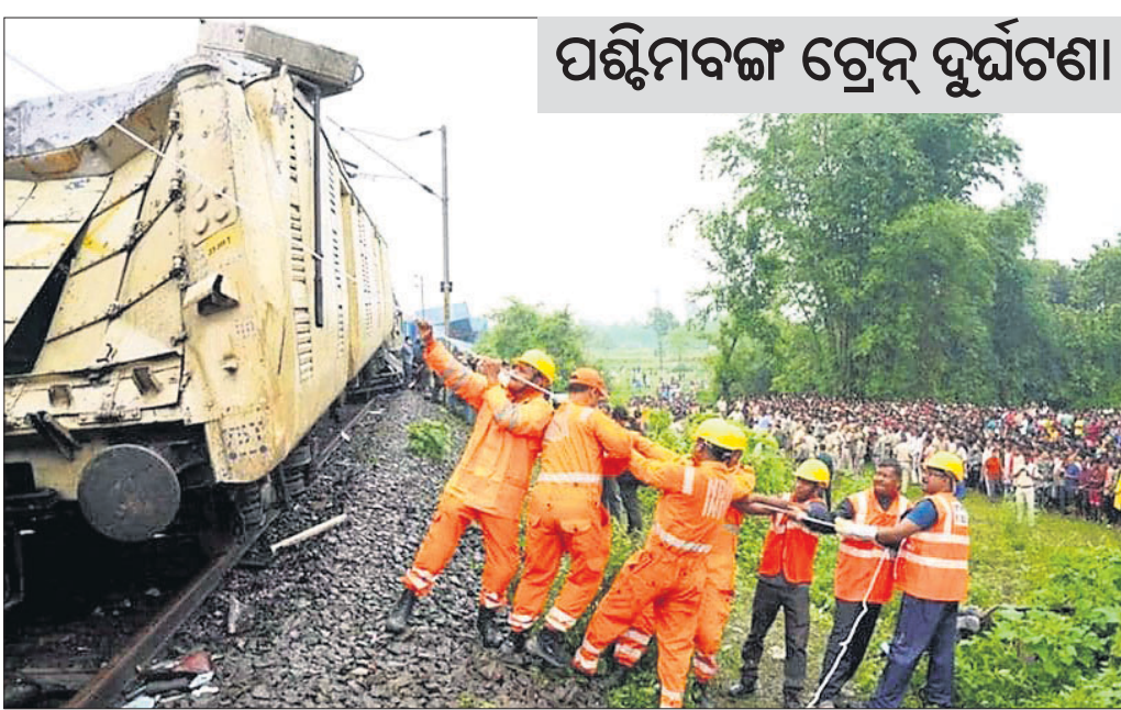
ପଶ୍ଚିମବଙ୍ଗ ଟ୍ରେନ୍ ଦୁର୍ଘଟଣା

ପଶ୍ଚିମବଙ୍ଗ ଟ୍ରେନ୍ ଦୁର୍ଘଟଣାକୁ ନେଇ କଂଗ୍ରେସ ସମେତ ବିରୋଧୀ ଦଳଗୁଡ଼ିକ କେନ୍ଦ୍ର ସରକାର ଏବଂ ରେଳମନ୍ତ୍ରୀ ଅଶ୍ୱିନୀ ଦେବୁଙ୍କୁ ଚାର୍ଜେଟ କରିଛନ୍ତି। ରେଳ ମନ୍ତ୍ରଣାଳୟର ଅତ୍ୟନ୍ତ କୁପରିଚାଳନା କାରଣରୁ ପଶ୍ଚିମବଙ୍ଗରେ ଟ୍ରେନ୍ ଦୁର୍ଘଟଣା ଘଟି ଏତେସଂଖ୍ୟାରେ ଲୋକଙ୍କ ଜୀବନ ଗଲା। ଏଥିପାଇଁ କଂଗ୍ରେସ ଅଧ୍ୟକ୍ଷ ମିଲିକାର୍ଜୁନ ଖାର୍ଜେଟ ଏବଂ ପୂର୍ବତନ ଅଧ୍ୟକ୍ଷ ରାହୁଲ ଗାନ୍ଧୀ ଯୋଗଦାନ ନରେନ୍ଦ୍ର ମୋଦି ସରକାରଙ୍କୁ ନିନ୍ଦା କରିଛନ୍ତି। ମାନବୀୟ ତ୍ରୁଟିରୁ ୧୫ ଜଣଙ୍କ ମୃତ୍ୟୁ ଘଟିବା ସହ ୫୦ ଜଣ ଆହତ ହୋଇଛନ୍ତି, ଯାହାକି ଅତ୍ୟନ୍ତ ଦୁଃଖଦାୟକ ବୋଲି ଖାର୍ଜେଟ କହିଛନ୍ତି। ଦୁର୍ଘଟଣା ସ୍ଥଳର ଦୃଶ୍ୟ ହୁଏତ ବିଚାରକ ଖାର୍ଜେଟ ମୃତକମାନଙ୍କ ପରିବାର ସଦସ୍ୟଙ୍କୁ ସାହୁକା ଜଣାଇବା ସହ ଆହତମାନଙ୍କ ଆଶୁ ଆରୋଗ୍ୟ କାମନା କରିଛନ୍ତି। ସେମାନଙ୍କୁ ତୁରନ୍ତ ସମ୍ପୂର୍ଣ୍ଣ ଷ୍ଟିପେଣ୍ଡ ଯୋଗାଇଦେବାକୁ କଂଗ୍ରେସ ଅଧ୍ୟକ୍ଷ ଦାବି କରିଛନ୍ତି। ସେହିପରି ରାହୁଲ କହିଛନ୍ତି, ମୋଦି ସରକାରଙ୍କ କୁପରିଚାଳନା ଏବଂ ଅବହେଳା ପାଇଁ ଗତ ୧୦ ବର୍ଷରେ ଟ୍ରେନ୍ ଦୁର୍ଘଟଣା ବଢ଼ିଛି ଓ ଅନେକ ଲୋକଙ୍କ ଜୀବନ ଯାଇଛି। ଆଜିର ଦୁର୍ଘଟଣା ଉଚ୍ଚ ବାସ୍ତବତାର ଅନ୍ୟତମ ଉଦାହରଣ। ଏହିସବୁ ଦୁର୍ଘଟଣା ପାଇଁ ମୋଦି ସରକାର ନିଜକୁ ଦାୟୀ କରନ୍ତୁ ବୋଲି ରାହୁଲ ଦାବି କରିଛନ୍ତି। ସରକାର କେବଳ ନିର୍ବାଚନରେ ଆଗ୍ରହ ରଖୁଛନ୍ତି। କେମିତି ନିର୍ବାଚନରେ ହାକିଂ ଓ କାଳିଆତି କରାଯିବ ତାହା ସେମାନେ ଚିନ୍ତା କରୁଥିବାବେଳେ ଟ୍ରେନ୍ ଯାତ୍ରା ଓ ରେଳ କର୍ମଚାରୀଙ୍କ ପ୍ରତି