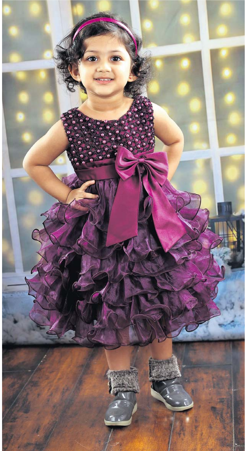
ଦିତାଣ୍ଡୀ ସ୍ଵାଇଁ ୪ ବର୍ଷ/ଭୁବନେଶ୍ଵର