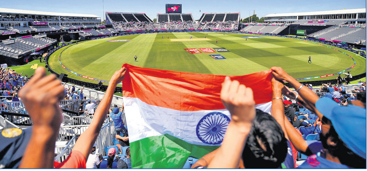
ଭାରତ-ଆୟର୍ଲାଣ୍ଡ ମ୍ୟାଚ ପାଇଁ ପ୍ରସ୍ତୁତ ଲ୍ୟୁୟିସ୍ କର ନାସାଉ କାଉଣ୍ଟି ଗ୍ରାଉଣ୍ଡ।

ଲ୍ୟୁୟିସ୍, ୪୧୭ ଚଳିତ ଚିନ୍ତା ଇଣ୍ଡିଆର ଅଭିଯାନ ଗୋଟିଏ ଗୋଟିଏ ପଦକ୍ଷେପ ଆରମ୍ଭ ହେବା ପରେ ପ୍ରଥମ ପ୍ରତିଦ୍ୱନ୍ଦ୍ୱୀ ହେଉଛି ଆୟର୍ଲାଣ୍ଡ। ଚିନ୍ତା କମିନେଶନ ସକାଡ଼ିଂ ଭାରତର ପ୍ରଥମ ଲକ୍ଷ୍ୟ ହେବ। ବିରାଟ କୋହଲି ଓ ରୋହିତ ଶର୍ମାଙ୍କ ପରି ଖେଳାଳି ବିଶ୍ୱକପ ଗ୍ରୁପ୍ ଧରି ସାରିଛନ୍ତି। ଯଶପ୍ରୀତ୍ କୁମ୍ଭାରା ଓ ରବୀନ୍ଦ୍ର ଜାଡେଜାଙ୍କ ସମେତ ଅନ୍ୟ ସମସ୍ତ ଖେଳାଳି ଏଥପାଇଁ ବ୍ୟଗ୍ର ଅଛନ୍ତି। ଭାରତୀୟ କ୍ରିକେଟ ଦଳ ୧୯୮୨ ଓ ୮୬ ଫିଫା ବିଶ୍ୱକପରେ ବ୍ରାଜିଲ ଦଳ ଭଳି ଦଶା ଭୋଗିବାକୁ କେବେ ଚାହେଁ ନାହିଁ। ସେତେବେଳେ ସୋକ୍ରାଟେସ, ଜିକୋ, କାରୋକା, ଫାଲକାଓ ଓ ଆଲେମେକ ପରି ତାରକା ଖେଳାଳି