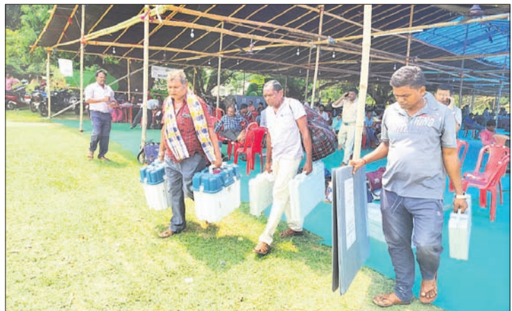
ନବନିର୍ବାଚନ କେନ୍ଦ୍ର ଅଭିଯୋଗ ଯାଉଥିବା ପୋଲିଂ ଅଧିକାରୀମାନେ ।

ମୟୂରଭଞ୍ଜ ଲୋକସଭା କ୍ଷେତ୍ର ସମେତ ୭ ବିଧାନସଭା ଓ ବାଲେଶ୍ୱର ଲୋକସଭା ଆସନ ଅନ୍ତର୍ଗତ ବଡ଼ସାହି ବିଧାନସଭା ନିର୍ବାଚନମଣ୍ଡଳୀରେ ଆସନ୍ତା ୧ ତାରିଖରେ ଭୋଟ ଗ୍ରହଣ ଅନୁଷ୍ଠିତ ହେବ । ଏବେକ ପ୍ରଶାସନ ପକ୍ଷରୁ ସମସ୍ତ ପ୍ରକୃତି ଶେଷ ପର୍ଯ୍ୟାୟରେ ପହଞ୍ଚିଛି । ଗୁରୁବାର ବାରିପଦା ତକଟପୁରସ୍ଥିତ ଏମ୍ପିସି ସ୍ୱୟଂଶାସିତ ମହାବିଦ୍ୟାଳୟରେ ହୋଇଥିବା ଉଚ୍ଚିତ୍ସା ଆବେଦନ କେନ୍ଦ୍ରକୁ ପୋଲିଂ ଅଧିକାରୀମାନେ ଜିଲାର ବିଭିନ୍ନ ସ୍ଥାନରେ ହୋଇଥିବା ନବନିର୍ବାଚନ କେନ୍ଦ୍ରକୁ ଯାଇଛନ୍ତି । ଜିଲା ପ୍ରଶାସନ ପକ୍ଷରୁ ଏଥିପାଇଁ ବ୍ୟାପକ ବ୍ୟବସ୍ଥା କରାଯାଇଥିବା ବେଳେ ଗ୍ରାମ୍ୟ ପ୍ରାଥମିକ ସ୍ତରରେ ରଖି ଆବେଦନ କେନ୍ଦ୍ରରେ ଆବଶ୍ୟକ ପରିମାଣରେ ଅଣ୍ଡା ପାମାୟ ଜଳ ମଧ୍ୟ ବ୍ୟବସ୍ଥା କରାଯାଇଛି । ରାଜ୍ୟ ପୋଲିଂ ଏବଂ କେନ୍ଦ୍ରୀୟ ନିର୍ବାଚନ ପୋଲିଂ ପକ୍ଷରୁ କଡ଼ା ସୁରକ୍ଷା ବ୍ୟବସ୍ଥା ଗ୍ରହଣ କରାଯାଇଛି ।