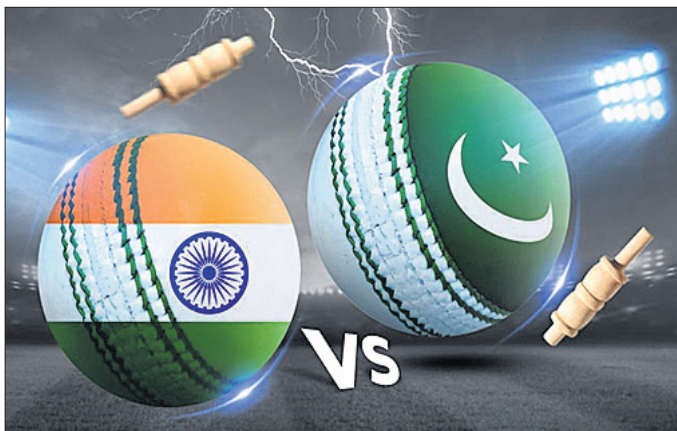
ଚରମରୁ ଏପ୍ରକାର ଧମକ ମିଳିଛି। ବିଶେଷ କରି ଲୁଚି ରହିବା ଧମକ ଦେଖିବା ପରେ ଖେଳାଯିବାର କାର୍ଯ୍ୟକ୍ରମ ରହିଛି।

ଭୁବନେଶ୍ୱର, ୩୦.୫.୨୪ (ପି.ଟି.) ଆତଙ୍କବାଦୀ ଆକ୍ରମଣ ଧମକ ଯୋଗୁ ଗୁଜରାଟ ନାସାଲ କାଉଣ୍ଡିରେ ଲୁଚି ରହିବା ଓ ପାକିସ୍ତାନ ମଧ୍ୟରେ ଖେଳାଯିବାକୁ ଥିବା ଚିନ୍ତା କ୍ରମେ ବିଶ୍ୱକପ୍ ପାଇଁ ଅଭୂତପୂର୍ବ ସୁରକ୍ଷା ବ୍ୟବସ୍ଥା ଗ୍ରହଣ କରାଯାଇଛି। ଗୁଜରାଟ ଗଭର୍ଣ୍ଣର କ୍ୟାଥୁ ହେଉଛି ଏ ବିଷୟରେ ସୁରକ୍ଷା ଦେବାକୁ ନାସାଲ କାଉଣ୍ଡିରେ ଲଜେନସାଫ୍ଟ୍ୱେର ପାଇଁ ଷ୍ଟାଡ଼ିୟମରେ ଚୁକ୍ତିନାମା ଗଠନ କରାଯାଇଛି। ତତ୍ପରେ ଭାରତର ତିନୋଟି ମ୍ୟାଚ ଯାମିଲ। ଭାରତୀୟ ଦଳ ଲୁଚି ରହିବା ଧମକ ଦେଖିବା ପରେ ଖେଳାଯିବାର କାର୍ଯ୍ୟକ୍ରମ ରହିଛି। ତତ୍ପରେ ଭାରତର ତିନୋଟି ମ୍ୟାଚ ଯାମିଲ। ଭାରତୀୟ ଦଳ ଲୁଚି ରହିବା ଧମକ ଦେଖିବା ପରେ ଖେଳାଯିବାର କାର୍ଯ୍ୟକ୍ରମ ରହିଛି। ତତ୍ପରେ ଭାରତର ତିନୋଟି ମ୍ୟାଚ ଯାମିଲ। ଭାରତୀୟ ଦଳ ଲୁଚି ରହିବା ଧମକ ଦେଖିବା ପରେ ଖେଳାଯିବାର କାର୍ଯ୍ୟକ୍ରମ ରହିଛି।