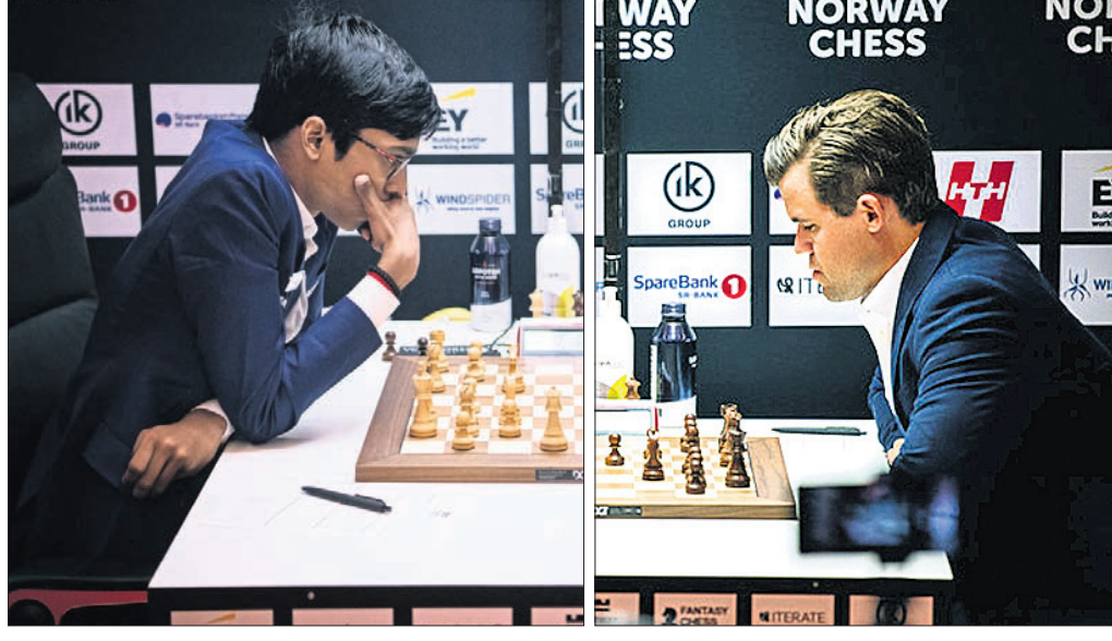
ଆର. ପ୍ରଜ୍ଞାନନ୍ଦ ଓ ମ୍ୟାଗ୍ନସ୍ କାର୍ଲସେନ।

ଭୁବନେଶ୍ୱର (ନରସିଂହ, ୩୦.୫.୨୪) (ପି.ଟି.) ବିଶ୍ୱକପ୍ ନିମନ୍ତେ ଖେଳାଳି ମ୍ୟାଗ୍ନସ୍ କାର୍ଲସେନଙ୍କ ବିପକ୍ଷରେ ନିଜର ପ୍ରଥମ ସଫଳତା ପ୍ରାପ୍ତ କରିଛନ୍ତି। କୋହଲିଙ୍କୁ ୫୫ ରନରେ ଆଉଟ କରିଛନ୍ତି। ରୋହିତଙ୍କୁ ୫୫ ରନରେ ଆଉଟ କରିଛନ୍ତି। କୋହଲିଙ୍କୁ ୫୫ ରନରେ ଆଉଟ କରିଛନ୍ତି।