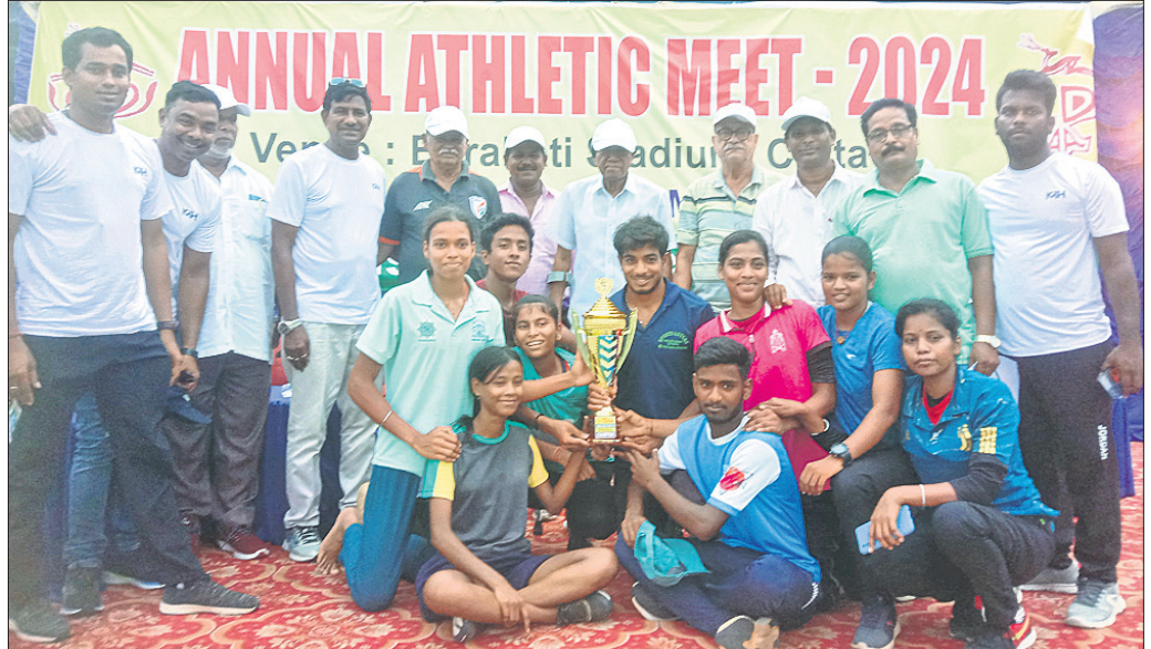
ଅତିଥିଙ୍କଠାରୁ ପୁରସ୍କାର ଗ୍ରହଣ ଅବସରରେ ଚାମ୍ପିୟନ ପିବି ଆଥଲେଟିକ କୋର୍ଟ ସେଣ୍ଟର ଆଥଲେଟ୍ ।

ଭୁବନେଶ୍ୱର, ୩୦୫୫ (ତପନ ସ୍ୱାଇଁ) ବାରବାଟୀ ସ୍ଥାପିତ ଓ ସତ୍ୟବ୍ରତ ସ୍ଥାପିତମାନେ କଟକ ଜିଲ୍ଲା ବାର୍ଷିକ ଆଥଲେଟିକ୍ ମିଟ୍ ଗୁରୁବାର ଶେଷ ହୋଇଛି । ଏଥିରେ ମୋଟ ୪୪୫ ପଦକ୍ଷେପ ପାଇ ପିବି ଆଥଲେଟିକ କୋର୍ଟ ସେଣ୍ଟର ଚାମ୍ପିୟନ ହୋଇଛି । ଏହାକୁ ମିଶାଇ