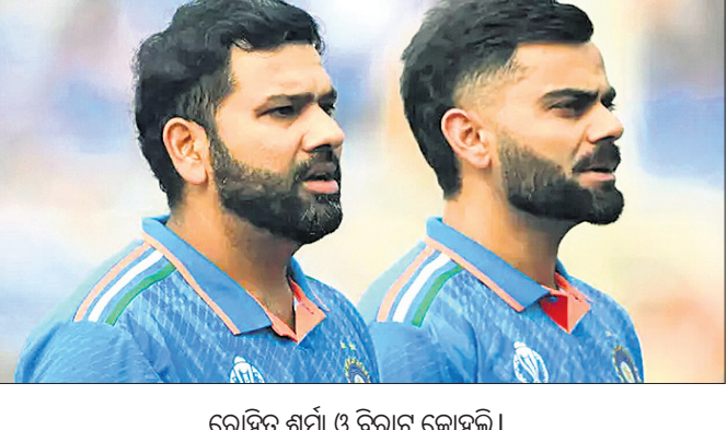
ରୋହିତ ଶର୍ମା ଓ ବିରାଟ କୋହଲି।

ବେଙ୍ଗାଳୁରୁ, ୩୦.୫.୨୪ (ପି.ଟି.) ଭାରତର ଦୁଇ ଷ୍ଟାଡ଼ିୟମ୍ କ୍ରମେ ଶେଷ କରିବାକୁ ଚାହଁନ୍ତେ। ରୋହିତ ୨୦୦୭ ଚିନ୍ତା କ୍ରମେ ବିରାଟ ୨୦୧୧ ବିଶ୍ୱକପ୍ ବିଜୟୀ ଦଳରେ ଥିଲେ। ଏହି ଦୁଇ ଖେଳାଳିଙ୍କ ବିରାଟ ୧୭ ବର୍ଷରେ ଭାରତୀୟ କ୍ରମେ ବିରାଟ ବିଜୟ ଉପଲକ୍ଷ୍ୟ ପାଇଁ ଭାରତୀୟ ଚିନ୍ତା କ୍ରମେ ବିରାଟ ବିଜୟ ଉପଲକ୍ଷ୍ୟ ପାଇଁ ପ୍ରଶଂସା ଓ ସମ୍ମାନ କରିଥାନ୍ତି। କୋହଲି ଜଣେ ପରିପୂର୍ଣ୍ଣ କ୍ରମେ ବିରାଟ ବିଜୟ ଉପଲକ୍ଷ୍ୟ ପାଇଁ ଶେଷ କରିବାକୁ ଚାହଁନ୍ତେ। ରୋହିତ ୨୦୦୭ ଚିନ୍ତା କ୍ରମେ ବିରାଟ ବିଜୟ ଉପଲକ୍ଷ୍ୟ ପାଇଁ ପ୍ରଶଂସା ଓ ସମ୍ମାନ କରିଥାନ୍ତି। କୋହଲି ଜଣେ ପରିପୂର୍ଣ୍ଣ କ୍ରମେ ବିରାଟ ବିଜୟ ଉପଲକ୍ଷ୍ୟ ପାଇଁ ଶେଷ କରିବାକୁ ଚାହଁନ୍ତେ।