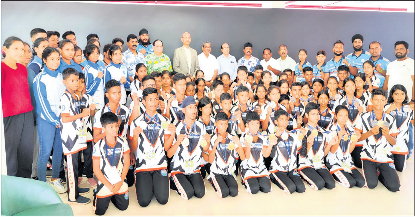
ପୁଣେରେ ଅନୁଷ୍ଠିତ ଚିଲ୍ଡ୍ରେନ୍ ଓ କ୍ୟାଡେଟ୍ କିକ୍‌ବକ୍ସିଂ ଚାମ୍ପିୟନଶିପ୍ରେ ପଦକ ବିଜୟୀ ଓଡ଼ିଶା ପ୍ରତିଯୋଗୀମାନେ ରାଜ୍ୟ କ୍ରୀଡ଼ା ବିଭାଗର ଅଧିକାରୀଙ୍କ ସହଯୋଗରେ ।