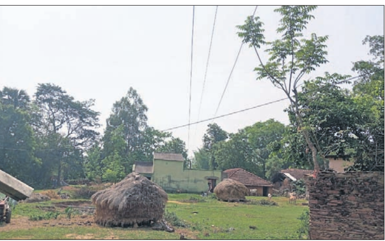
ବାସଗୃହ ଉପର ଦେଇ ଯାଇଥିବା ୧୧ କେଜି ବିଦ୍ୟୁତ୍ ତାର ।