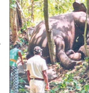
ଜଙ୍ଗଲରେ ପଡିଥିବା ହାତୀ ମୃତଦେହ। ଡେବେ ହାତୀ ମୃତ୍ୟୁ ସମ୍ପର୍କରେ ଖବର ପାଇ ଉତ୍ତର ବନଖଣ୍ଡର ଏସିଏଫ, ବିଶ୍ୱନାଥପୁର

ଲାଞ୍ଜିଗଡ଼, ୩୦.୫ (ରମେଶ ଚନ୍ଦ୍ର ନାୟକ) କଳାହାଣ୍ଡି ଜିଲ୍ଲା ଲାଞ୍ଜିଗଡ଼ ବ୍ଲକ୍ ସୀମାନ୍ତ ଉତ୍ତର ବନଖଣ୍ଡ ନଳା ରେଞ୍ଜ କର୍ମୀ ସେକ୍ସନ୍ କୁଟିମସ୍ତ୍ରା ବିଟ୍ ଅଞ୍ଚଳରେ କୁଟିମସ୍ତ୍ରା ଜଙ୍ଗଲରେ ଏକ ଦନ୍ତାହାତୀର ମୃତଦେହକୁ ବନ ବିଭାଗ ଗୁରୁବାର ଠାବ କରିଛି। ଡେବେ ସପ୍ତାହେ ହେବ ହାତୀର ମୃତ୍ୟୁ ହୋଇଥିବା ଅନୁମାନ କରାଯାଇଛି। ପରକ୍ଷେପ ଘଟଣା ସମ୍ବନ୍ଧରେ ମୃତ୍ୟୁ ଘଟିଥିବା ବନ ବିଭାଗ ସମ୍ବନ୍ଧରେ କୁଟିମସ୍ତ୍ରା ଅନ୍ୟପକ୍ଷେ ଶିକାରୀଙ୍କ ଚାଲି କିମ୍ବା ବିଦ୍ୟୁତ୍ ଆଘାତରେ ହାତୀର ମୃତ୍ୟୁ ହୋଇଥାଇପାରେ ବୋଲି ସାଧାରଣରେ ଆଲୋଚନା ହେଉଛି।