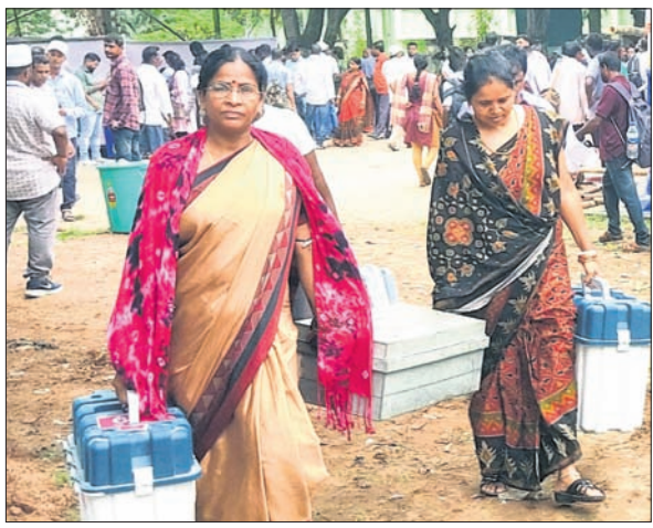
ଭଦ୍ରକ ସହ ରୁଥ୍ ବାସୁଦେବପୁର ପୋଲିଂ ଦଳ।