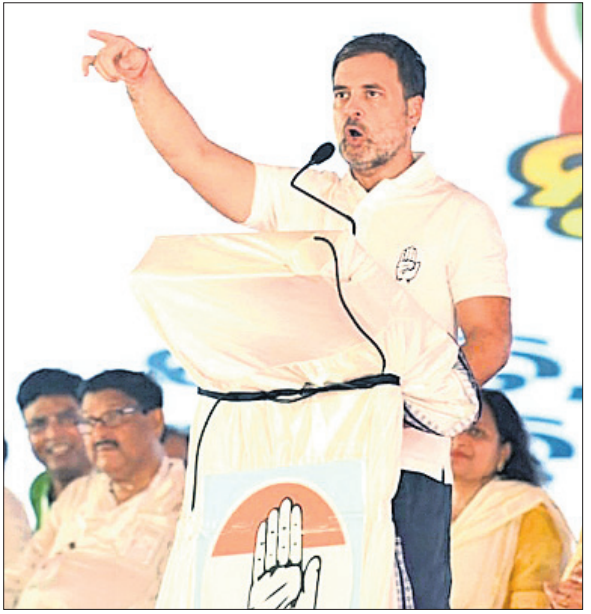
ରାଜାଗାଲ ମଇଦାନରେ ଗୁରୁବାର ନିର୍ବାଚନୀ ସଭାରେ କଂଗ୍ରେସ ନେତା ରାହୁଲ ଗାନ୍ଧୀ।

ଓଡ଼ିଶାରେ ଭାଜପା ଓ ବିଜେଡିର ଭିତ୍ତି ବୁଝାମଣାରେ ମିଳିତ ସରକାର ଚାଲିଛି। ଉପରେ ପରସ୍ପର ବିରୋଧରେ କହୁଛନ୍ତି, କିନ୍ତୁ ଭିତରେ ସମ୍ପର୍କ ଅତି ନିବଡ଼ ବୋଲି କଂଗ୍ରେସ ନେତା ରାହୁଲ ଗାନ୍ଧୀ କହିଛନ୍ତି। ଭଦ୍ରକ ସଂସଦୀୟ କ୍ଷେତ୍ର ରାଜାଗାଲର ମଇଦାନରେ ଗୁରୁବାର ପୂର୍ବାହ୍ନରେ କଂଗ୍ରେସ ପକ୍ଷରୁ ଆୟୋଜିତ ନିର୍ବାଚନୀ ସଭାରେ ଯୋଗଦେଇ ସେ ଏହା କହିଛନ୍ତି। ଭାଜପା - ବିଜେଡି ବିରୋଧରେ ରାହୁଲ ବର୍ଷିବା ସହ କହିଛନ୍ତି, କେନ୍ଦ୍ରର ଭାଜପା ସରକାର ସମିଧାନ ପାଇଁ ବିପଦ। ସମିଧାନକୁ ନଷ୍ଟ କରିବା ଲାଗି ଏହି ସରକାର ସବୁବେଳେ