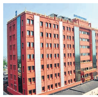
କଟକ, ୩୦୫ (କାର୍ତ୍ତିକ ସାହୁ)

ଯୁବନଗଡ଼ ଜିଲ୍ଲା ରାଜଗଙ୍ଗପୁର ଥାନା ଅନ୍ତର୍ଗତ ରାମବାହାଲର ସମ୍ପ୍ରଦାୟ ମିଞ୍ଜ ହତ୍ୟା ଘଟଣାରେ ସ୍ଥାନୀୟ ପୋଲିସ ମାମଲା ରୁଜୁ କରୁନାହିଁ। ଏହି ଘଟଣାକୁ ୮ ମାସ ବିଚିଯାଇଥିଲେ ମଧ୍ୟ ପୋଲିସ କିଛି ପଦକ୍ଷେପ ଗ୍ରହଣ କରୁନାହିଁ। ତେଣୁ ଏହି ଘଟଣାରେ ହତ୍ୟା ମାମଲା ରୁଜୁ କରାଯିବା ସହ କ୍ରାଇମ୍‌ଟ୍ରାଷ୍ଟି ମାମଲାର ରୁଧିବାର ସକାଳେ ଘରୁ ଏକ ସ୍ତୁତି ନେଇ ବାହାରକୁ ବୁଲିବାକୁ ଯାଇଥିଲେ। ଦୀର୍ଘ ସମୟ ଧରି ଘରକୁ ନ ଫେରିବାରୁ ପରିବାର ଲୋକେ ଖୋଜାଖୋଜି କରିଥିଲେ ସୁଦ୍ଧା ତାଙ୍କର ସନ୍ଧାନ ପାଇ ନ ଥିଲେ। ଗୁରୁବାର ବାଲଗିରିଆ ଗାଁ ନିକଟରେ ଥିବା ଜଙ୍ଗଲରେ ତାଙ୍କ ମୃତଦେହ ଝୁଲନ୍ତା ଅବସ୍ଥାରେ ଥିବା ଗ୍ରାମବାସୀ ଦେଖିବାକୁ ପାଇଥିଲେ। ଖବରପାଇ ପୋଲିସ ଘଟଣାସ୍ଥଳରେ ପହଞ୍ଚି ମୃତଦେହ ଜବତ କରି ବ୍ୟବଚ୍ଛେଦ ପାଇଁ ପରଜଙ୍ଗ ଗୋଷ୍ଠୀ ସ୍ୱାସ୍ଥ୍ୟକେନ୍ଦ୍ର ପଠାଇଛି। ତାଙ୍କ ଆହତତ୍ୟାରେ କାରଣ ଜଣାପଡି ନାହିଁ।