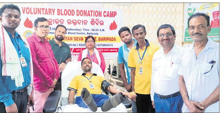
ଶିବିରରେ ଜଣେ ରକ୍ତଦାତା ରକ୍ତଦାନ କରୁଛନ୍ତି ।

ସ୍ଥାନୀୟ ଓଡ଼ିଶା ରକ୍ତ କେନ୍ଦ୍ର ବାରିପଦା ପରିସରରେ ନାରାୟଣ ସେବା ଟ୍ରଷ୍ଟ ଆନୁକୁଲ୍ୟରେ ଏକ ସ୍ୱେଚ୍ଛାକୃତ ରକ୍ତଦାନ ଶିବିର ଅନୁଷ୍ଠିତ ହୋଇଯାଇଛି । ୮ ଜଣ ପ୍ରଶଂସା କରିଥିଲେ । ତ. ନୀଲେଶ