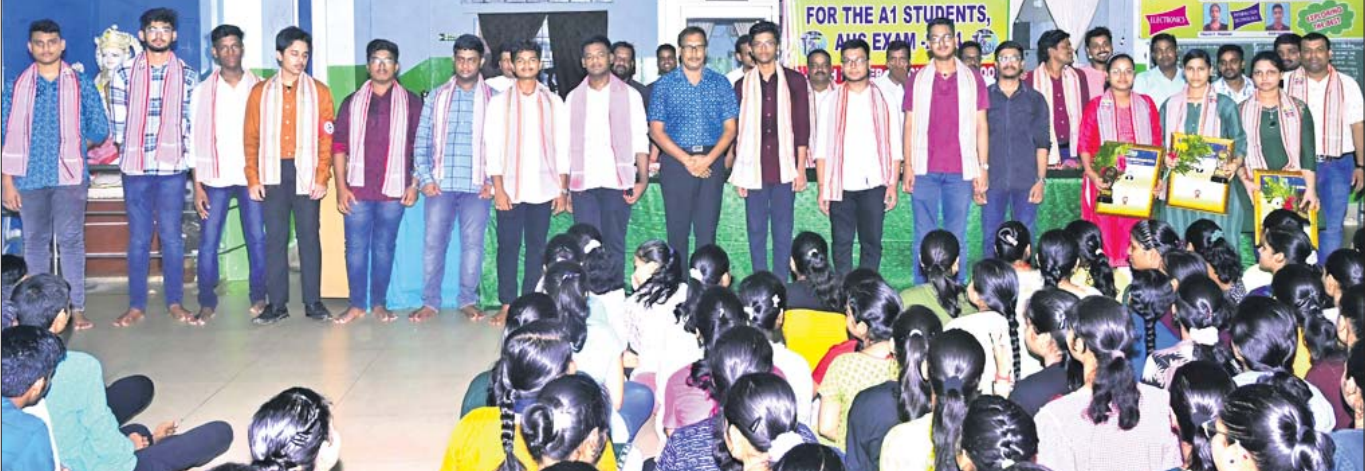
ଇ-ଟେକ୍ କଲେଜ ପକ୍ଷରୁ ମେଧାବୀ ଛାତ୍ରାଛାତ୍ରଙ୍କୁ ସମ୍ବର୍ଦ୍ଧନା ଦିଆଯାଇଛି।

ଦେଢ଼ାମାଳ, ୩୦୫ (ରଚନ ନାୟକ) ରାଜ୍ୟର ଅନ୍ୟତମ ଶିକ୍ଷାନୁଷ୍ଠାନ ଦେଢ଼ାମାଳ ମଙ୍ଗଳପୁରସ୍ଥିତ ଇ-ଟେକ୍ ଉଚ୍ଚ ମାଧ୍ୟମିକ ବିଦ୍ୟାଳୟ ପକ୍ଷରୁ ଗୁରୁବାର ଆୟୋଜିତ ଉତ୍ସବରେ ମେଧାବୀଙ୍କୁ ସମ୍ବର୍ଦ୍ଧନା ପ୍ରଦାନ କରାଯାଇଛି। ଅନୁଷ୍ଠାନର ଅଧ୍ୟକ୍ଷ ଡ.