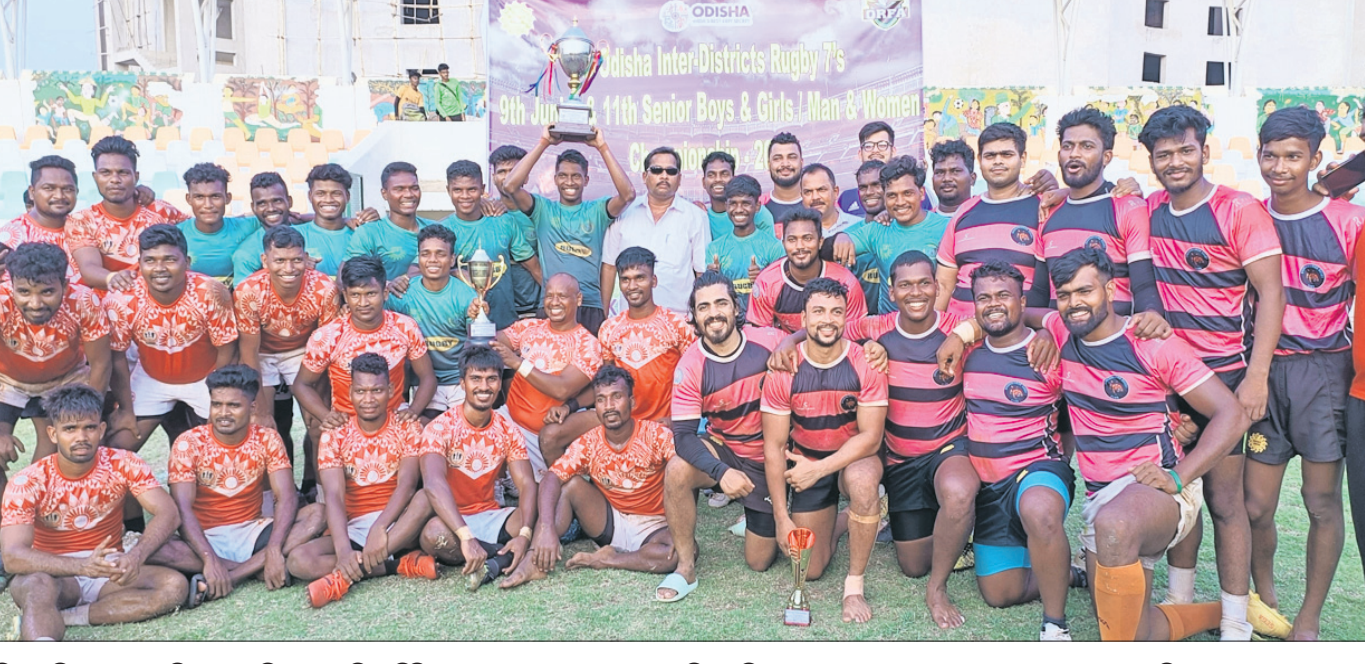
କିଙ୍ଗ୍ ଷ୍ଟାଡ଼ିୟମରେ ଅନୁଷ୍ଠିତ ଆନ୍ତର୍ଜାତୀୟ ସିନିୟର ପୁରୁଷ ରଗ୍ବୀ ଟ୍ରଫିରେ ପ୍ରଥମ ସ୍ଥାନ ହାସଲ କରିଥିବା ଭୁବନେଶ୍ୱର ଦଳ।

ବିଭାଗରେ ପ୍ରଜ୍ଞାନନ୍ଦଙ୍କ ଉତ୍ତମ ପ୍ରଦର୍ଶନ ଯୋଗୁଁ ସେ ଶୀର୍ଷରେ ପ୍ରଜ୍ଞାନନ୍ଦ ହୋଇଛନ୍ତି। କୋହଲିଙ୍କୁ ୫୫ ରନରେ ଆଉଟ କରିଛନ୍ତି। ରୋହିତଙ୍କୁ ୫୫ ରନରେ ଆଉଟ କରିଛନ୍ତି। କୋହଲିଙ୍କୁ ୫୫ ରନରେ ଆଉଟ କରିଛନ୍ତି।