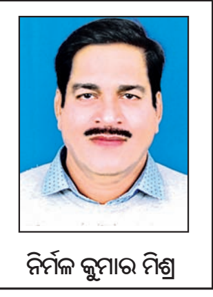
ନିର୍ମଳ କୁମାର ମିଶ୍ର

ରଶିଖ ଦତ୍ତ ସଲାନ: ଜାମ୍ମୁ ଓ କଶ୍ମୀରରୁ ଆସୁଥିବା ଏହି ୨୪ ବର୍ଷୀୟ ରଶିଖ ଦତ୍ତ ସଲାନ ଆଇପିଏଲ୍ ୨୦୨୪ରେ ଚମତ୍କାର ଥେପ୍ ବୋଲିଂ କରିଥିଲେ। ପୂର୍ବରୁ ମୁମ୍ବାଇ ପକ୍ଷରୁ ଆଇପିଏଲ୍ ଖେଳି ସାରିଥିଲେ ମଧ୍ୟ ଅଧିକ ସୁଯୋଗ ମିଳି ନ ଥିଲା। ଏପରିକି ଟୁର୍ନାମେଣ୍ଟ ଆରମ୍ଭରୁ ଦିଲ୍ଲୀ ସ୍ପିନିଂ କୁମାରଙ୍କୁ ସୁଯୋଗ ଦେଇଥିଲା। ତେବେ ଅଭିମ ୭ ମ୍ୟାଚ୍‌ରେ ରଶିଖଙ୍କୁ ଖେଳିବାର ସୁଯୋଗ ମିଳିଥିଲା। ଏଥିରେ ସେ ଚମତ୍କାର ଥେପ୍ ବୋଲିଂ ସହ ୯ ଉଇକେଟ ନେଇଥିଲେ। ବୁଲ୍‌ରାଟ ଓ ମୁମ୍ବାଇ ବିପକ୍ଷରେ ଗତି ଲେଖାଏ ଉଇକେଟ ମଧ୍ୟ ନେଇଥିଲେ।