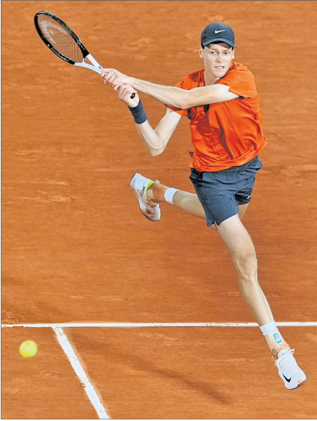
ରୋଲାଣ୍ଡ ଗାରୋସରେ ଚାଲିଥିବା ଫ୍ରେଣ୍ଡ୍ ଓପନ ପୁରୁଷ ସିଙ୍ଗଲ୍ ଟୁରାୟ ରାଉଣ୍ଡରେ ରିଚର୍ଡ ଶର୍ ଖେଳୁଛନ୍ତି ଜାଣିକ ସିନର ।