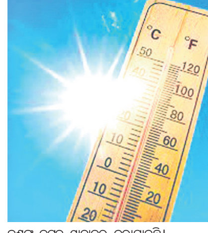
ଜଣାକୁ କଟକ ସ୍ଥାନାନ୍ତର କରାଯାଇଛି। ପ୍ରକାଶ ଯେ, ଗୁରୁବାର ଅନୁଗୋଳର ଚାପାପାତ୍ରା ୪୨.୩ ଡିଗ୍ରୀ ଥିଲା। ହେଲେ ଆର୍ଦ୍ରତା ୫୦ ଉପରେ ରହିଥିବାରୁ

ଅନୁଗୋଳ, ୩୦.୫ (ଅମିତ କୁମାର ସାମଲ) ଅନୁଗୋଳରେ ଚାଟି ବଢ଼ିବାରେ ଲାଗିଛି। ଗତ ୨ଦିନ ଧରି ଗଣ ଖରା ସାଙ୍ଗକୁ ତଦନ୍ତ କାରି ରହିଥିବା ସୂଚନା ମିଳିଛି। ଏ ସମ୍ପର୍କରେ ନଳା ରେଞ୍ଜର ଭାରତବନ୍ଧୁ ଶବରକୁ ପଚାରିବାକୁ ସେ କହିଲେ, ବିନେ ଅନୁମାନ କରାଯାଇଛି। ଅଂଶୁଘାତ ଆକ୍ରାନ୍ତ ଅନୁଗୋଳ ଜିଲ୍ଲା ମୁଖ୍ୟ ଚିକିତ୍ସାଳୟରେ ଭର୍ତ୍ତି କରାଯାଇଥିବା ସୂଚନା ମିଳିଛି। ସେମାନଙ୍କ ମଧ୍ୟରୁ ୩