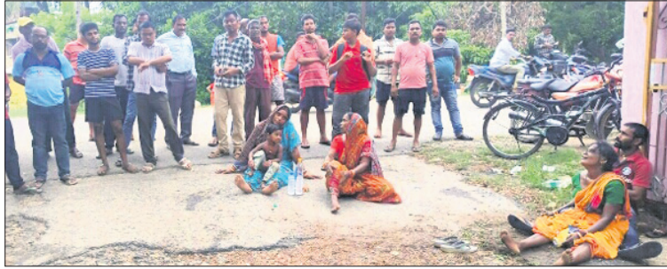
ଆନା ପାଟକ ଆଗରେ ମହିଳାଙ୍କ ସମ୍ପର୍କୀୟମାନେ ଧାରଣା ଦେଇଛନ୍ତି।