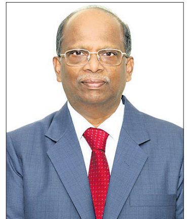
ଶ୍ରୀଧର ପାତ୍ର ଚକାର ବ୍ୟବସାୟ ସହ ୨,୦୭୦ କୋଟି ଚକାର ନିର୍ ମାତ୍ର ହାସଲ କରିଛି। ଏପରିକି ୨୦୨୩-୨୪ ଆର୍ଥିକ ବର୍ଷର ୪ର୍ଥ ଟ୍ରେନ୍ଦାପିକ ମଧ୍ୟରେ କମ୍ପାନୀ ନିର୍ ମାତ୍ର ୯୫୫ କୋଟି ସହ ୧୦୧୭ କୋଟି ଚକା ହୋଇଥିବାବେଳେ

ଦେଶର ପ୍ରମୁଖ ରାଷ୍ଟ୍ରୀୟ ଉତ୍ପାଦନ (ନବରତ୍ନ ଉତ୍ପାଦନ/କମ୍ପାନୀ) ତଥା କେନ୍ଦ୍ର ଖଣି ମନ୍ତ୍ରାଳୟ ଅଧୀନ ନ୍ୟାଶନାଲ ଆଇରିନିୟମ୍ କମ୍ପାନୀ ଲିମିଟେଡ୍ ବା ନାଲିକୋର ନିର୍ଦ୍ଦେଶକମଣ୍ଡଳୀ ବୈଦିକ ନିକଟରେ ଅନୁଷ୍ଠିତ ହୋଇଯାଇଛି। ଉକ୍ତ ବୈଦିକ କମ୍ପାନୀର କାରବାର ଓ ଆଗାମୀ କାର୍ଯ୍ୟକଳାପ ଆଦି ଉପରେ ବିଶ୍ୱାସୀ ଉପାଦାନ ହୋଇଥିବାବେଳେ ୨୦୨୩-୨୪ ଆର୍ଥିକ ବର୍ଷର ବାର୍ଷିକ ଓ ୪ର୍ଥ ଟ୍ରେନ୍ଦାପିକ ଫଳାଫଳ ମଧ୍ୟ ଘୋଷଣା କରାଯାଇଥିଲା। ଏପରିକି ସଫଳତାର ଧାରା ବଳାୟ ରଖିବା ସହ ୨୦୨୩-୨୪ ଆର୍ଥିକ ବର୍ଷରେ କମ୍ପାନୀ ଉତ୍ପାଦନ ଏବଂ ବିକ୍ରୟ କ୍ଷେତ୍ରରେ ସର୍ବକାଳୀନ ରେକର୍ଡ ହାସଲ କରିଛି। ଉଲ୍ଲେଖଯୋଗ୍ୟ, ୨୦୨୩-୨୪ ଆର୍ଥିକ ବର୍ଷରେ ନାଲିକୋ ମୋଟ ୧୩,୧୪୯ କୋଟି