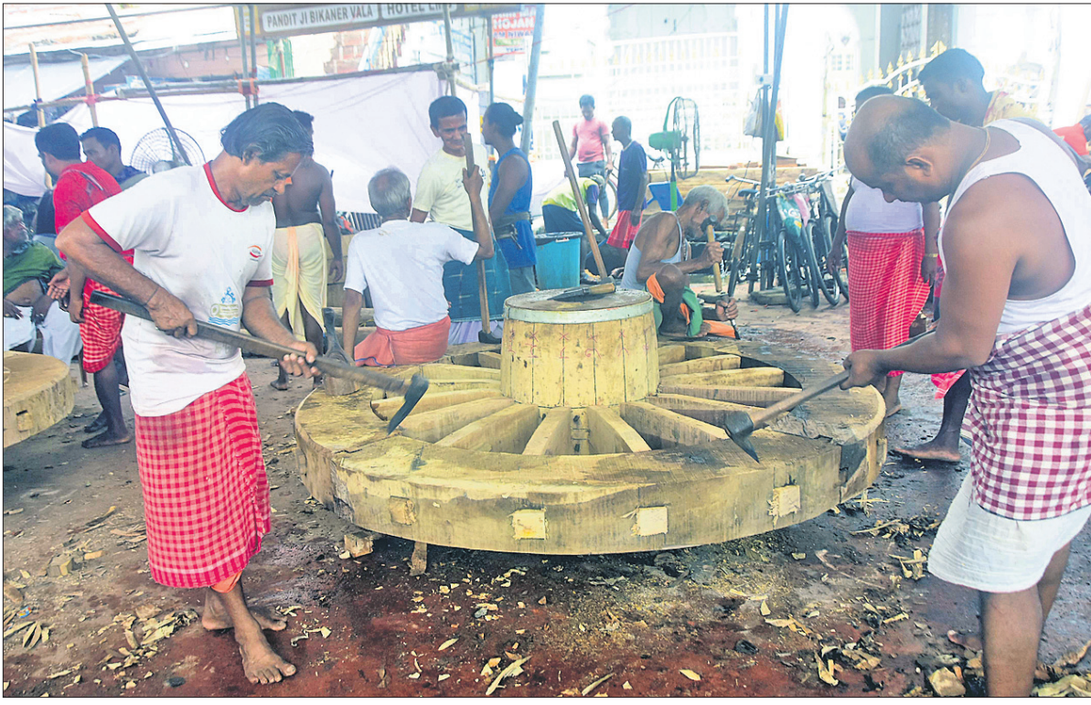
ସୋମବାର ରଥଖଣ୍ଡରେ ଭୋଜ ସେବକମାନେ ଚକ ନିର୍ମାଣ କରୁଛନ୍ତି ।