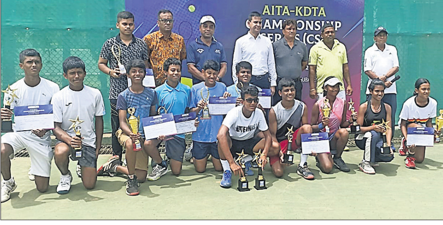
ଅଭିଭୂତ ସହ କୃତୀ ପ୍ରତିଯୋଗୀମାନେ।

ଦୁଇନେଶ୍ୱର, ୨୪୧୫ (ତପନ ସାଲ) କଲିଙ୍ଗ ଷ୍ଟାଡ଼ିୟମ ଟେନିସ କମ୍ପ୍ଲେକ୍ସରେ ଅନୁଷ୍ଠିତ ୧୪ ଓ ୧୬ ବର୍ଷରୁ କମ୍ ଚାମ୍ପିୟନଶିପ୍ ସିରିଜ (ସିଏସଏ) ଟେନିସ ଚ୍ୟୁମ୍ପିୟନଶିପରେ ଓଡ଼ିଶାର ଆହାର ମିଶ୍ରଣ ଡ୍ରିମ୍ସ୍ ହାସଲ କରିଛନ୍ତି। ସେ ୧୪ ଓ ୧୬ ବର୍ଷରୁ କମ୍ ଓଡ଼ିଶା ଏବଂ ୧୬ ବର୍ଷରୁ କମ୍ ଦେଶରେ ଚାମ୍ପିୟନ ହୋଇଛନ୍ତି। ୧୪ ବର୍ଷରୁ କମ୍ ବାଲକ ପାଇନାଲରେ ଟପ୍ ସିଡ୍ ଆହାର କର୍ମଚାରୀ ଇଶାୟା ଦେବଦାସ ୬-୩, ୬-୦ ସେଟ୍ରେ ହରାଇଛନ୍ତି। ସେହିପରି ୧୬ ବର୍ଷରୁ କମ୍ ସିଙ୍ଗଲ ପାଇନାଲରେ ସେ ଅଣସିଡ୍ରେ ଆନ୍ତ ପ୍ରଦେଶ କେ. ସୌରାଜ୍ୟ ୬-୩, ୬-୧ ସେଟ୍ରେ ପରାସ୍ତ କରିଛନ୍ତି। ଅନ୍ୟତମ ଓଡ଼ିଶା ଖେଳାଳି ସୁବ୍ରତ କର୍ମକାରୀଙ୍କୁ ସାଥୀକରି ଖେଳିଥିବା ଆହାର ୧୬ ବର୍ଷରୁ କମ୍ ବାଲକ ପାଇନାଲରେ ଅନେକ ସାଧୁ ଓ ଅର୍ଘ୍ୟମାନ ଆଚାର୍ଯ୍ୟଙ୍କୁ ୬-୦, ୬-୨ ସେଟ୍ରେ ହରାଇ ଡ୍ରିମ୍ସ୍ ପୁରଣ କରିଛନ୍ତି। ଅନ୍ୟପକ୍ଷରେ ଏସ୍ ବେସ୍ ଟେନିସ ଏକାଡେମୀରେ ଅଭ୍ୟାସ ନିଶ୍ଚଳକାଠୁ ପ୍ରଶିକ୍ଷଣ ନେଉଥିବା ଆହାର ୧୬ ବର୍ଷରୁ କମ୍ ବାଲିକା ବର୍ଗ ପାଇନାଲରେ ଚାମ୍ପିୟନ ହୋଇଛନ୍ତି। ୧୪ ବର୍ଷରୁ କମ୍ ୬-୧, ୬-୦ ସେଟ୍ରେ ହରାଇ ଚାମ୍ପିୟନ ହୋଇଛନ୍ତି। ଖୋର୍ଦ୍ଧା ଜିଲ୍ଲା ଟେନିସ ଆସୋସିଏସନ୍ (କେଡିଟିଏ) ଦ୍ୱାରା ପ୍ରଦତ୍ତ ପାଠ୍ୟ ପାଠ୍ୟ ପୁସ୍ତକ ଅଧିକାରୀଙ୍କୁ ଲାଭ କରିଥିବା ପ୍ରଦାନ କରିଥିଲେ। କେଡିଟିଏ ସମ୍ପାଦକ ଅଧିକାରୀଙ୍କୁ ଆହାର କଲିଙ୍ଗ ଷ୍ଟାଡ଼ିୟମରେ ଆସୋସିଏସନ୍ ଦ୍ୱାରା ଅନୁମୋଦିତ ତଥା ଚ୍ୟୁମ୍ପିୟନ ଚାମ୍ପିୟନ ହୋଇଛନ୍ତି। ଓଡ଼ିଶାର ଚାମ୍ପିୟନ ହୋଇଛନ୍ତି। ଓଡ଼ିଶାର ଚାମ୍ପିୟନ ହୋଇଛନ୍ତି। ଓଡ଼ିଶାର ଚାମ୍ପିୟନ ହୋଇଛନ୍ତି।