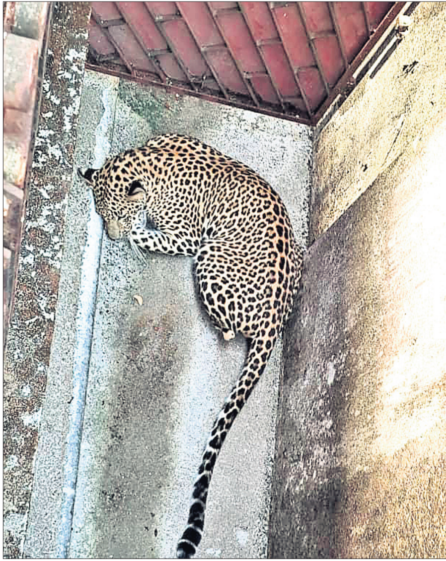
ଆତକ ପୃଷ୍ଠ କରିଥିବା କଲରାପତରିଆ ବାଘ।

ପ୍ରାକୃତ୍ତ୍ୱିକ ବଞ୍ଚାଣା କାରୁକର୍ମ ବନ୍ଦ ଦିଆଯାଇଛି