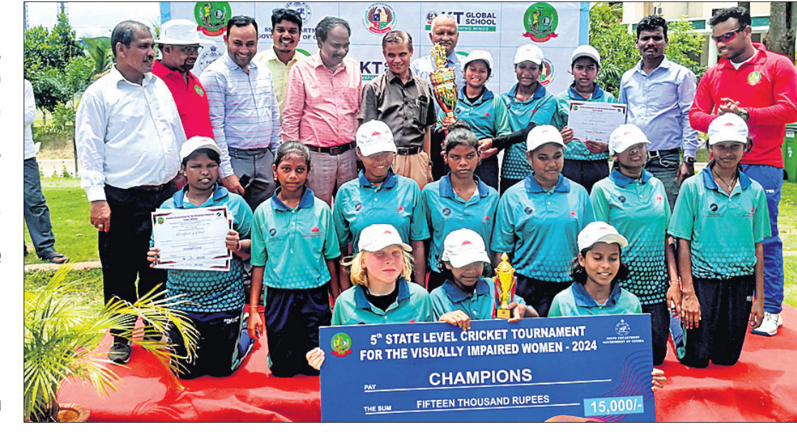
ଚାମ୍ପିୟନ ବାଲେଶ୍ୱର ଦଳର ଖେଳାଳିମାନେ ପୁରୁଷର ସହ ଅତିଥିକ ଗହଣରେ।

ସାମାଜିକ ପୁରୁଷ ଓ ଭିନ୍ନଶ୍ରମ ସମ୍ପ୍ରଦାୟର ବିଭାଗ ଏବଂ କେଟି ଗ୍ଲୋବାଲ ସ୍କୁଲର ମିଳିତ ସହଯୋଗରେ ରାଜ୍ୟ ଦୃଷ୍ଟିହୀନ କ୍ରିକେଟ ସଂଘ ଦ୍ୱାରା ଆୟୋଜିତ ୫ମ ରାଜ୍ୟ ସ୍ତରୀୟ ଦୃଷ୍ଟିହୀନ ମହିଳା କ୍ରିକେଟ ପ୍ରତିଯୋଗିତା ଶୁଭ୍ରାବର ଉଦ୍‌ଘାଟିତ ହୋଇଛି।