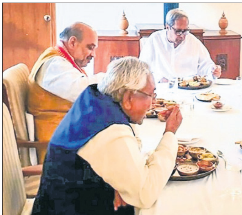
୨୦୨୦ ଫେବୃଆରୀ ୨୮ରେ ନବୀନ ନିବାସରେ ମୁଖ୍ୟମନ୍ତ୍ରୀ ନବୀନ ପଟ୍ଟନାୟକଙ୍କ ସହ ସ୍ୱରାଷ୍ଟ୍ର ମନ୍ତ୍ରୀ ଅମିତ ଶାହା ଭୋଜନ କରୁଛନ୍ତି। ନିକଟରେ ବିହାର ମୁଖ୍ୟମନ୍ତ୍ରୀ ନୀତୀଶ କୁମାର । ଇଣ୍ଡିଆନ କୋନାଲ କାଉନ୍ସିଲ (ଇକେଡ଼ିସି)ର ୨୪ତମ ବୈଠକରେ ଯୋଗଦେବା ପାଇଁ ଶାହା ଭୁବନେଶ୍ୱର ଆସିଥିବାବେଳେ ନବୀନ ସେମାନଙ୍କୁ ଆପ୍ୟାୟିତ କରିଥିଲେ।

ମାତ୍ର ମୋଦି ଓଡ଼ିଶାର ଅଦିବାସୀ ଔଷ୍ଣ ପ୍ରୋପାଗା ପୂର୍ଣ୍ଣକୁ ରାଷ୍ଟ୍ରପତି କରି ଓଡ଼ିଶାର ମହିଳାଙ୍କ ସମ୍ମାନକୁ ବୃଦ୍ଧି କରିଛନ୍ତି। କି-୨୦ ସମ୍ମିଳନୀରେ ସାରା ବିଶ୍ୱର ନେତାଙ୍କୁ ଗୋଟିଏ ସ୍ଥାନରେ ସ୍ୱାଗତ କରିଥିଲେ ମୋଦି। ତାଙ୍କ ପାଖରେ କୋଣାର୍କ ଚଳୁଥିବା-୧