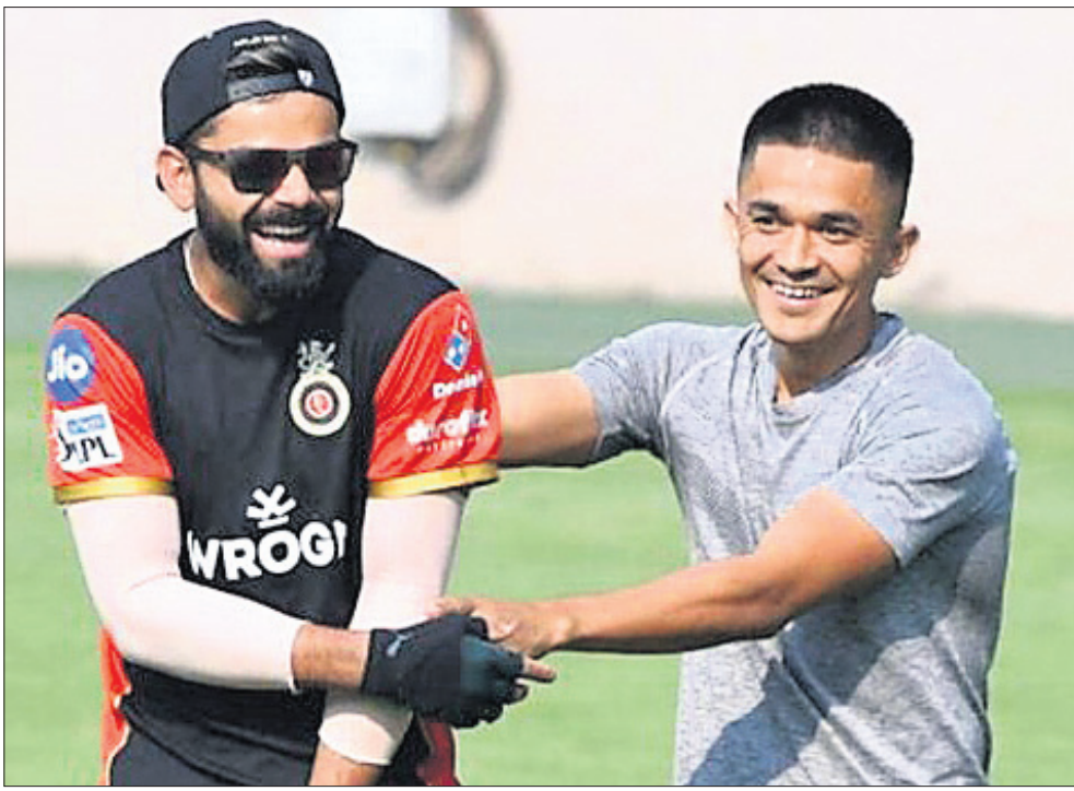
ଏକ ହାଲ୍‌ଜା ପୁରୁଷରେ ବିରାଟ କୋହଲିଙ୍କ ସହ ସୁନାମ ଛେତ୍ରୀ।

ଆଇକନିକ ଭାରତୀୟ ପୁରୁଷ ଅଧିନାୟକ ସୁନାମ ଛେତ୍ରୀ ଖେଳକୁ ଅବସର ନେବା ନିଷ୍ପତ୍ତି ନେବା ପୂର୍ବରୁ ସ୍ୱାମୀ ଚରାଟ କୋହଲିଙ୍କ ପରାମର୍ଶ ନେଇଥିଲେ।