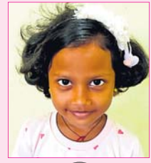
୧ ଦାସ୍ତମୟା ମାଝା କ୍ଲାସ- ୩, ସରସ୍ୱତୀ ଶିଶୁ ବିଦ୍ୟାଳୟ, ବେଲପଡ଼ା, ବଲାଙ୍ଗୀର