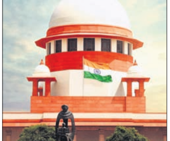
ସୂଚନାଯୋଗ୍ୟ, ପଣ୍ଡିତ ଦିଲ୍ଲୀର ଉତ୍ତମ ନଗରରେ ଏକ ନିର୍ବାଚନୀ ରାଲିକୁ ସମ୍ବୋଧନ କରି କେଜ୍‌ରିୱାଲ୍‌ କହିଥିଲେ, ଆପଣ ଭୋଟ ଦେଲେ ତାଙ୍କୁ ଆଉ କେଲ ଯିବାକୁ ପଡ଼ିବନି।

ନିର୍ବାଚନ ରାଲିରେ ଦିଲ୍ଲୀ ମୁଖ୍ୟମନ୍ତ୍ରୀ ଅରବିନ୍ଦ କେଜ୍‌ରିୱାଲ୍‌ଙ୍କ ମତ୍ତବ୍ୟ ବିରୋଧରେ ପ୍ରଦର୍ଶନ ନିର୍ଦ୍ଦେଶାଳୟ (ଇଡି) ସୁପ୍ରିମକୋର୍ଟରେ ପ୍ରତିବାଦ ଦାଏର କରିଥିଲା।