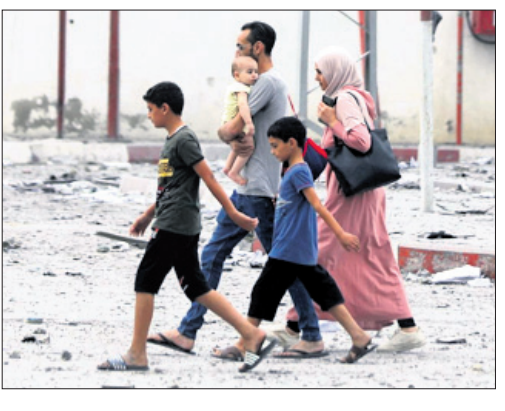
କିଛି ନିରାଶ୍ୟର ପ୍ରତିବାଦୀ

ଅଧିକତଃ ନିରାଶ୍ୟର ଅଧିକତଃ ପରିଚିତ ନିରାଶ୍ୟର ପ୍ରତିବାଦ ପ୍ରକାଶ କରିବା ପାଇଁ ଆମର ଉଦ୍ଦେଶ୍ୟ ଥିଲା। ନିରାଶ୍ୟର ଅଧିକତଃ ପରିଚିତ ନିରାଶ୍ୟର ପ୍ରତିବାଦ ପ୍ରକାଶ କରିବା ପାଇଁ ଆମର ଉଦ୍ଦେଶ୍ୟ ଥିଲା।