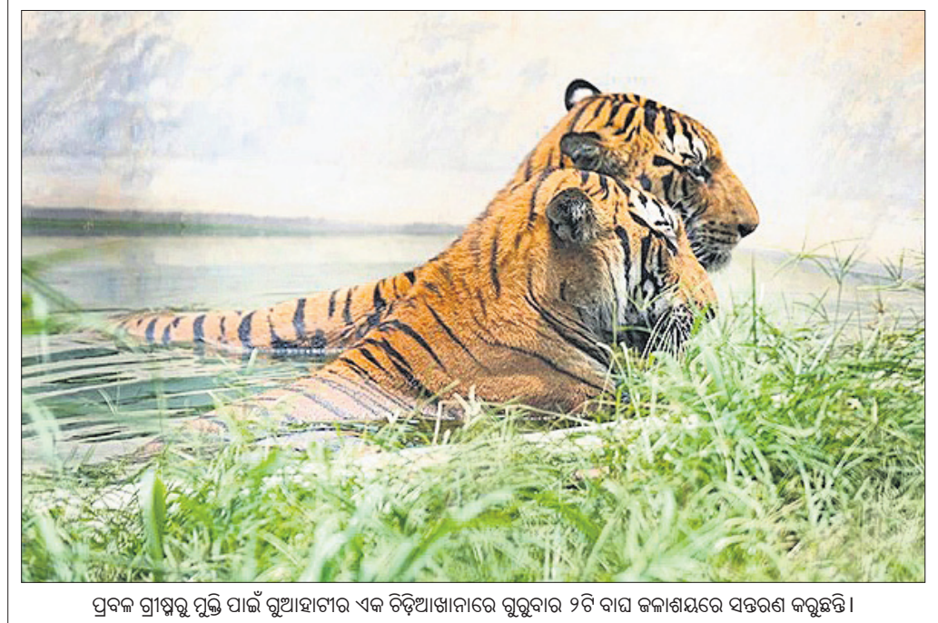
ପ୍ରବଳ ଗ୍ରୀଷ୍ମରୁ ପ୍ରତି ପାଇଁ ନୂଆହାଟୀର ଏକ ଚିଡ଼ିଆଖାନାରେ ରୁଜୁରୀର ୨ଟି ବାଘ ଜଳାଶୟରେ ସନ୍ତରଣ କରୁଛନ୍ତି।

ଗରାଧାନ ଯାତ୍ରା ୧୦ ତାରିଖରୁ ଆରମ୍ଭ ହୋଇଥିବାବେଳେ ଇତିମଧ୍ୟରେ ୧୧ ଜଣଙ୍କ ମୃତ୍ୟୁ ଘଟିଲାଣି। ୧୦ ତାରିଖରୁ ଯତ୍ନେନ୍ଦ୍ରା, ଗଙ୍ଗୋତ୍ରୀ ଓ କେଦାରନାଥ ଧାମକୁ ଯାତ୍ରୀ ଆଗମନ ଆରମ୍ଭ ହୋଇଥିଲା।