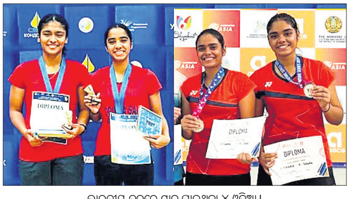
ଭାରତୀୟ ଦଳରେ ଗ୍ଲାନ ପାଇଥିବା ୪ ଓଡ଼ିଆ।

ଭୁବନେଶ୍ୱର, ୧୬୫ (ତପନ ସାହି) ବ୍ୟାଡ଼ମିଣ୍ଟନ ଓଡ଼ିଆ ଫେଡେରେଶନ ଆନୁକୂଲ୍ୟରେ ଅଷ୍ଟ୍ରେଲିଆର ଓପନ ଓଡ଼ିଆ ଚୁର ପୁଅର ୫୦୦ ଚୁରମେଣ୍ଟ କ୍ଲବ୍ ୧୧୭୧୭ ପର୍ଯ୍ୟନ୍ତ ଅନୁଷ୍ଠିତ ହେବ।