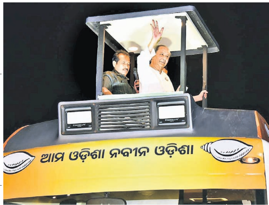
ଭୁବନେଶ୍ୱରରେ ବନ୍ଦୀୟ ପ୍ରାର୍ଥୀଙ୍କୁ ଜିତାଇବା ପାଇଁ ବିଜେଡି ସଭାପତି ନବୀନ ପଟ୍ଟନାୟକଙ୍କ ରୋଡ୍ ଶୋ'।

ଭୁବନେଶ୍ୱର, ୧୬।୫(ଅନିଲ ଦାସ) ପୃଷ୍ଠାମନ୍ତ୍ରୀ ନବୀନ ପଟ୍ଟନାୟକ ଭୁବନେଶ୍ୱରରେ ଏକ ବିଶାଳ ରୋଡ୍ ଶୋ' କରି ଶକ୍ତି ପ୍ରଦର୍ଶନ କରିଛନ୍ତି।