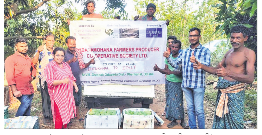
ଓଡ଼ାପଡ଼ା ବ୍ଲକ୍ ଓସୁପାଳ ଅଞ୍ଚଳରୁ ଆୟ ଦୁବାଇ, ଇଟାଲି ରପ୍ତାନି କରାଯାଇଛି।

ଗାଡ଼ାଣ୍ଡା ପାଠା ସୁନା ଦେଇଛନ୍ତି। ସେହିପରି ଉଚ୍ଚ ଅଞ୍ଚଳରୁ ଉତ୍ପାଦିତ ଅଜେ କୁଳଖିଲ ଲେଖାଏ କଲରା ଓ ଭେଣ୍ଡିକୁ ମଧ୍ୟ ଦୁବାଇ ପଠାଯାଇଛି।