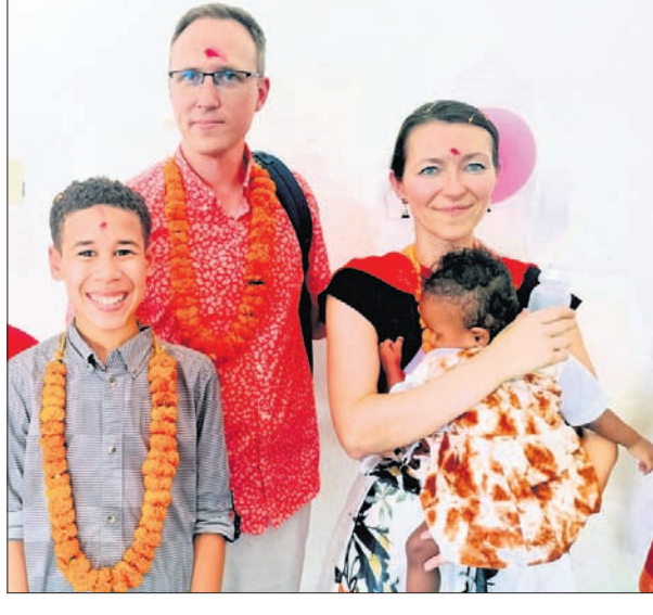
ବିଦେଶୀ ଦମ୍ପତି ଦିବ୍ୟାଙ୍ଗ ଶିଶୁକନ୍ୟାକୁ ନେଇଛନ୍ତି।

ଭବାନୀପାଟଣା, ୧୫:୫ (ଉତ୍ତମ କୁମାର ଦାଶ) ଭୁଇଁ ସନ୍ତାନ ଥାଇ ବି ଜଣେ ଦିବ୍ୟାଙ୍ଗ ଅନାଥ ଶିଶୁକୁ ନିଜର କରିଛନ୍ତି ଏକ ବିଦେଶୀ ଦମ୍ପତି।