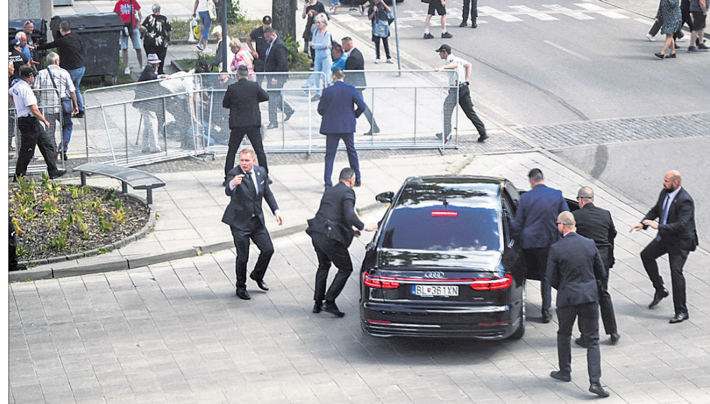
ସ୍ୱୋଭାକିଆର ପ୍ରଧାନମନ୍ତ୍ରୀ ରବର୍ଟ ପିକୋଙ୍କୁ ଆତତାୟୀକ ଭୂମିକା ଉପରେ ସୁରକ୍ଷା ଅଧିକାରୀମାନେ ତାଙ୍କ କାରୁକୁ କର୍ତ୍ତନ କରି ନେଉଛନ୍ତି।

ସ୍ୱେଡୋପାୟ ପାର୍ଲିମେଣ୍ଟ ନିର୍ବାଚନକୁ ୩ ସପ୍ତାହ ବାକି ଥିବାବେଳେ ରୁସ୍‌ବାର ସ୍ୱୋଭାକିଆର ପ୍ରଧାନମନ୍ତ୍ରୀ ରବର୍ଟ ପିକୋଙ୍କୁ ହତ୍ୟା ଉଦ୍ୟମ ହୋଇଛି।