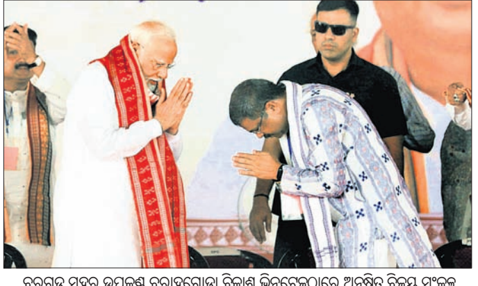
ବରଗଡ଼ ସହର ଉପକଣ୍ଠ ବରାହଗୋଡ଼ା ବିକାଶ ଭିନଟେଠାରେ ଅନୁଷ୍ଠିତ ବିଜୟ ସଂକଳ୍ପ ସମାବେଶରେ ପ୍ରଧାନମନ୍ତ୍ରୀ ନରେନ୍ଦ୍ର ମୋଦିଙ୍କୁ କେନ୍ଦ୍ରମନ୍ତ୍ରୀ ଧର୍ମେନ୍ଦ୍ର ପ୍ରଧାନ ସ୍ୱାଗତ କରୁଛନ୍ତି ।

ବରଗଡ଼ ସମାବେଶରେ ପ୍ରଧାନମନ୍ତ୍ରୀ ନରେନ୍ଦ୍ର ମୋଦି ଓଡ଼ିଶାର ଅବ୍ୟବସ୍ଥାକୁ ସମୀକ୍ଷା କରି ସରକାର ବଦଳାଇବାକୁ ନିବେଦନ କରିଛନ୍ତି । ସାତେ ୪ କୋଟି ଓଡ଼ିଆଙ୍କ ଅସ୍ମିତା ସୁରକ୍ଷା, ଲୋକଙ୍କ ପ୍ରତି ଥିବା ଆଶ୍ୱା ତଥା ଓଡ଼ିଆ ଲୋକଙ୍କ ବିକାଶର ଦାୟିତ୍ୱ ନେବା ପାଇଁ ସେ ଗ୍ୟାରେଣ୍ଟି ଦେଇଛନ୍ତି ବୋଲି କେନ୍ଦ୍ରମନ୍ତ୍ରୀ ଧର୍ମେନ୍ଦ୍ର ପ୍ରଧାନ କହିଛନ୍ତି ।