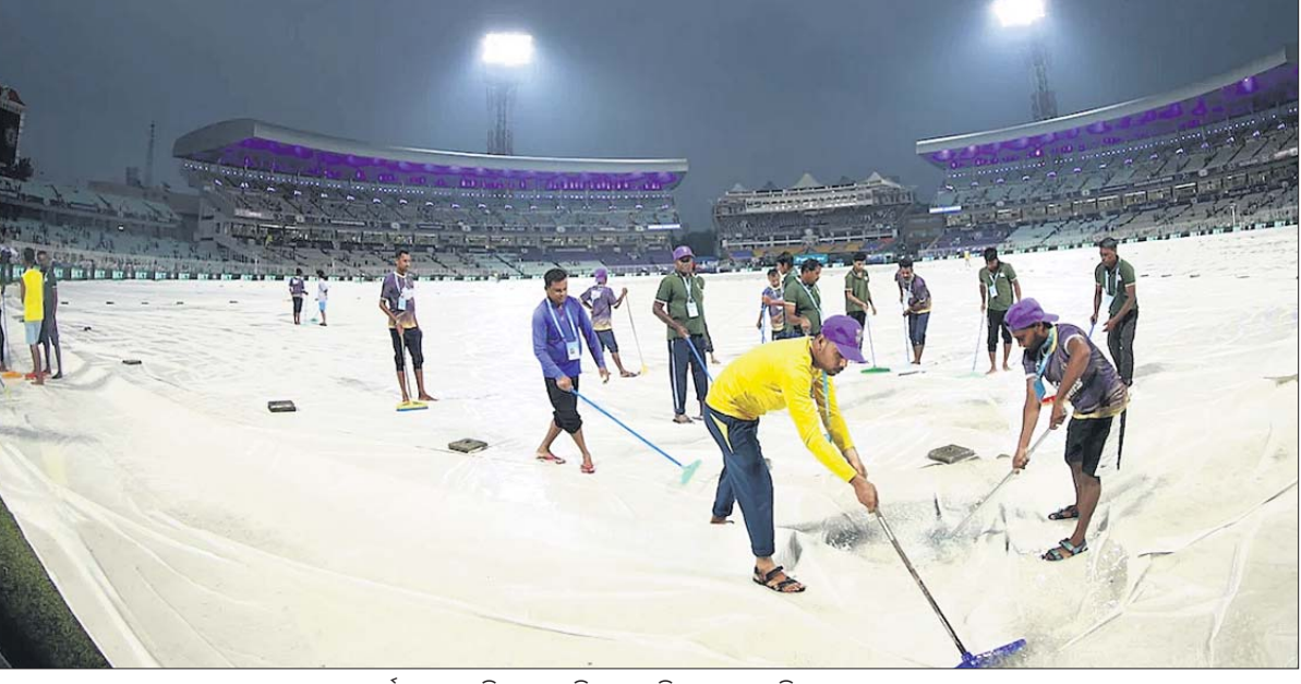
ବର୍ଷା ପରେ ପଡ଼ିଆରେ ଜମିଥିବା ପାଣି ସଫା କରୁଛନ୍ତି ଗ୍ରାଉଣ୍ଡ ଷ୍ଟାଫ୍।