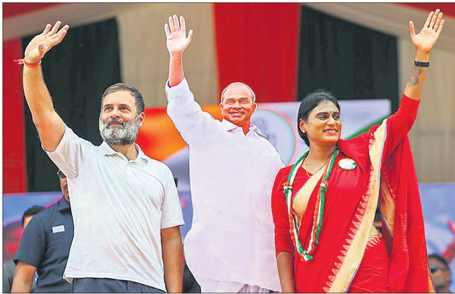
ଆନ୍ତର୍ପ୍ରଦେଶର କଂଗ୍ରେସରେ ଶନିବାର କଂଗ୍ରେସ ନେତା ରାହୁଲ ଗାନ୍ଧୀ ନେତ୍ରୀ ଡା.ଏସ୍. ଶର୍ମିଳାଙ୍କ ସହ ନିର୍ବାଚନ ପ୍ରଚାର କରୁଛନ୍ତି।