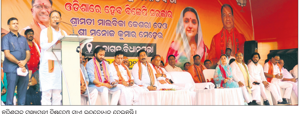
ଛତିଶଗଡ଼ ମୁଖ୍ୟମନ୍ତ୍ରୀ ବିଶ୍ୱଦେଓ ସାଏ ଉଦ୍ଦେଶ୍ୟରେ ସମାବେଶରେ ।