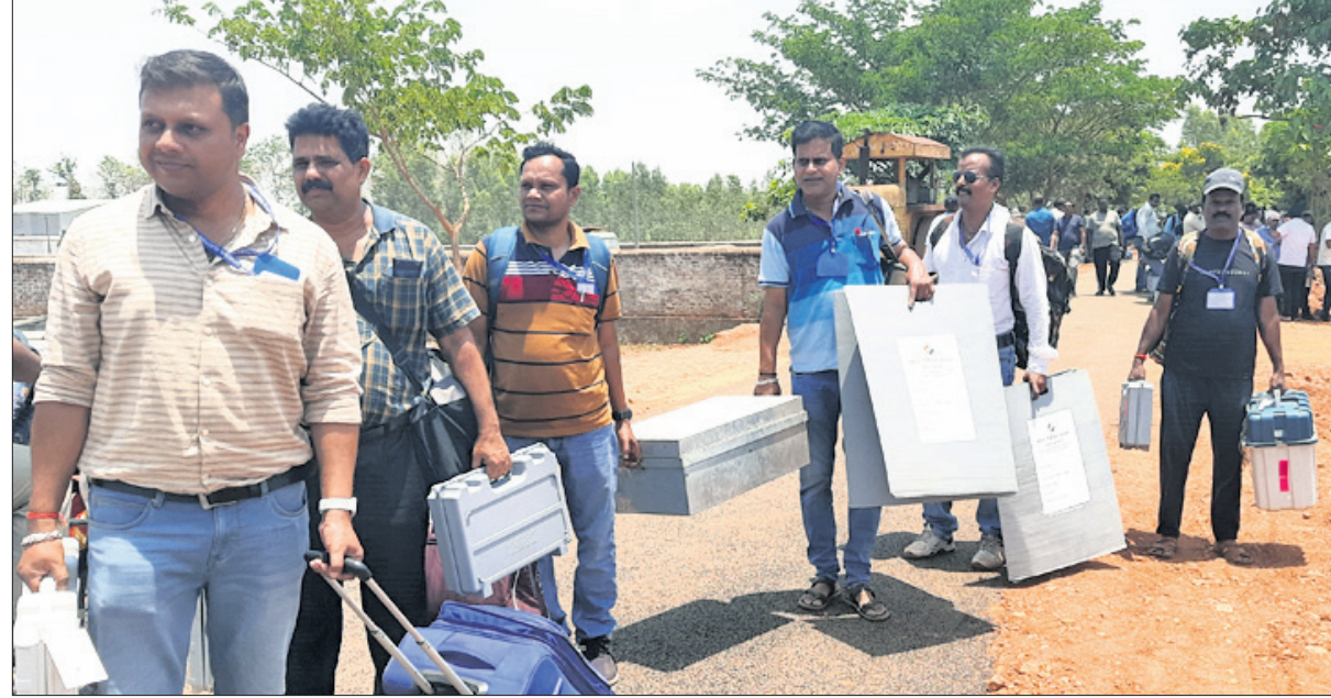
ଓଡ଼ିଶାରେ ପ୍ରଥମ ପର୍ଯ୍ୟାୟ ମତଦାନ ପାଇଁ ଶନିବାର ପୋଲିଂ ଅଧିକାରୀମାନେ ନବରଙ୍ଗପୁରରୁ ଝରିଗାଁ ଅଭିଯୁକ୍ତ ଯାଉଛନ୍ତି।