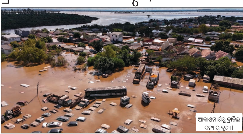
ଆକାଶମାର୍ଗରୁ ବ୍ରାଜିଲ ବନ୍ୟାର ଦୃଶ୍ୟ।

ବ୍ରାଜିଲର ରିଓ ଗ୍ରାଣ୍ଡେ ତୋ ସୁଲ ରାଜ୍ୟରେ ପ୍ରବଳ ବର୍ଷାକଳିତ ବନ୍ୟାରେ ଶନିବାର ସୁଦ୍ଧା ୧୩୬ ଜଣଙ୍କ ମୃତ୍ୟୁ ଘଟିଥିବାବେଳେ ଅନ୍ୟ ୧୨୫ ଜଣ ନିଖୋଜ ହୋଇଯାଇଛନ୍ତି। ସପ୍ତାହ ହେଲା ସେଠାରେ ବର୍ଷା ଲାଗିରହିଥିବାରୁ ବ୍ରାଜିଲର ଦକ୍ଷିଣ ଭାଗରେ ଥିବା ଏହି ରାଜ୍ୟର ବହୁ ସହର ବନ୍ୟାପୀଡ଼ି