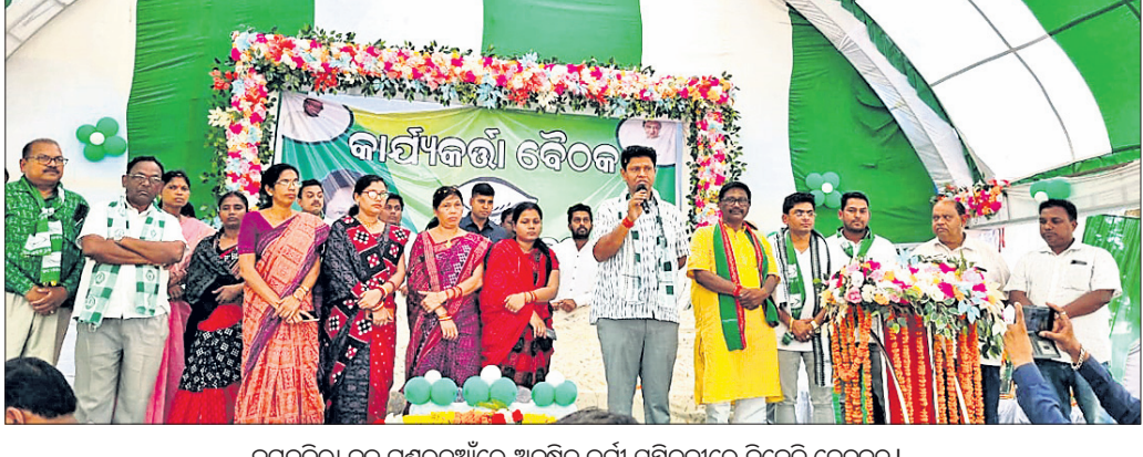
ଜମନକିରା ରୁକ୍ମ ଗୁଣ୍ଡରୁଆଁରେ ଅନୁଷ୍ଠିତ କର୍ମୀ ସମ୍ମିଳନୀରେ ବିଜେଡି ନେତୃତ୍ୱ ।