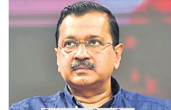
ଦିଲ୍ଲୀ ମୁଖ୍ୟମନ୍ତ୍ରୀ ଅରବିନ୍ଦ କେଜ୍‌ରିୱାଲ

ପ୍ରବର୍ତ୍ତନ ନିର୍ଦ୍ଦେଶାଳୟ(ଇଡି)ର କଡ଼ା ବିରୋଧ ସତ୍ତ୍ୱେ ଦିଲ୍ଲୀ ମୁଖ୍ୟମନ୍ତ୍ରୀ ତଥା ଆମ ଆଦମ୍ବା ପାର୍ଟି (ଆପ୍) ରାଷ୍ଟ୍ରୀୟ ଆବାହକ ଅରବିନ୍ଦ କେଜ୍‌ରିୱାଲ ଶୁଭକାରୀ ପୁସ୍ତିକାକୋର୍ଟକୁ ଜାମିନ ପାଇ ତିହାର କେଲେ ପୁଚ୍ଚ ହୋଇଛନ୍ତି। ଅବକାରୀ ନୀତି ଦୁର୍ନୀତି ମାମଲାରେ କେନ୍ଦ୍ରୀୟ ଏଜେଣ୍ଡି ଇଡି ତାଙ୍କୁ ମାର୍ଚ୍ଚ ୨୧ରେ ଗିରଫ କରିଥିଲା। କେଜ୍‌ରିୱାଲ ଏହି ଗିରଫଦାରିକୁ ବ୍ୟଲୋଞ୍ଚକରି ପୁସ୍ତିକାକୋର୍ଟଙ୍କ ଦ୍ୱାରସ୍ଥ ହୋଇଥିଲେ। ଦୁଇଜଣିଆ ଖଣ୍ଡପୀଠ ଗତ ମଙ୍ଗଳବାର ତାଙ୍କ ଜାମିନ ଆବେଦନର ରାୟ ସଂରକ୍ଷିତ ରଖିଥିଲେ। ତେବେ ଲୋକ ସଭା ନିର୍ବାଚନ ଦୃଷ୍ଟିରୁ ମୁଖ୍ୟମନ୍ତ୍ରୀଙ୍କୁ ଅନ୍ତରାଣ ଜାମିନ ପ୍ରଦାନ କରିବା ନେଇ ଅଦାଲତ ସଙ୍କେତ ଦେଇଥିଲେ। ଗୁରୁତାର ଇଡି ନିର୍ବାଚନ ପ୍ରଚାର ମୌଳିକ ଅଧିକାର ରୁହେଁ ବୋଲି ଯୁକ୍ତି ବାଦ୍ ଏକ ସତ୍ୟପାଠ ଦାଖଲ କରିଥିଲା। କିନ୍ତୁ ପୁସ୍ତିକାକୋର୍ଟ କେଜ୍‌ରିୱାଲଙ୍କ କୌଣସି ଆପରାଧକୁ ପୁଷ୍ଟଭୂମି ନ ଥିବା ଦର୍ଶାଇ ତାଙ୍କୁ ଜୁନ୍ ୧ ପର୍ଯ୍ୟନ୍ତ ସସର୍କ ଜାମିନ ପ୍ରଦାନ କରିଛନ୍ତି। ଗିରଫ ହେବାର ୫୦ ଦିନ ପରେ କେଲେ ପୁସ୍ତିକା କେଜ୍‌ରିୱାଲ କହିଛନ୍ତି, ଏକଛତ୍ରବାଦ ବିରୋଧୀ ଲଢ଼େଇକୁ ଆହୁରି ଶାଣିତ କରିବା କରୁନା ହୋଇପଡ଼ିଛି।