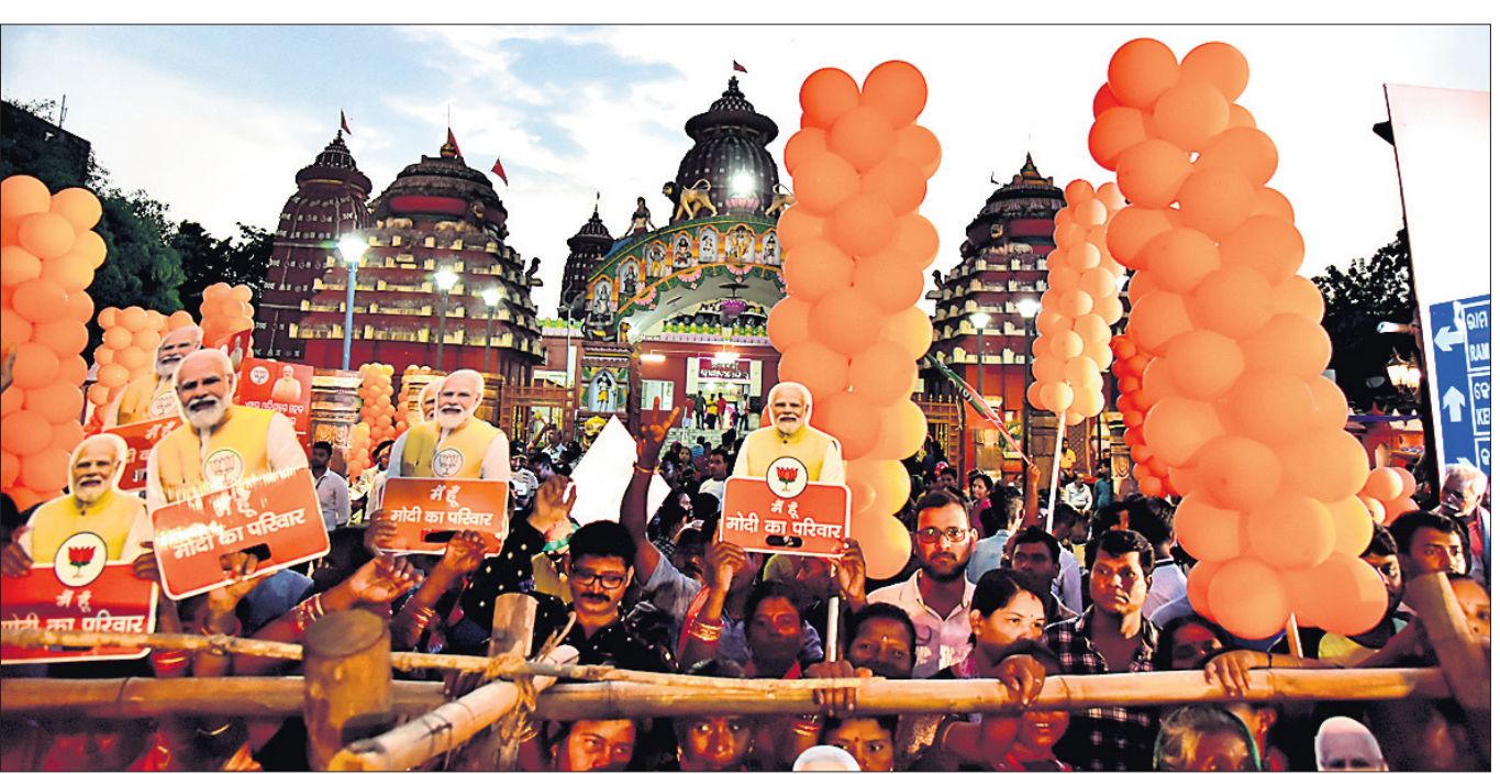
ପ୍ରଧାନମନ୍ତ୍ରୀଙ୍କ ରୋଡ୍ ଶୋ'କୁ ଦେଖିବା ଲାଗି ରାମ ମନ୍ଦିର ସମ୍ମୁଖରେ ଲୋକଙ୍କ ସମାଗମ।