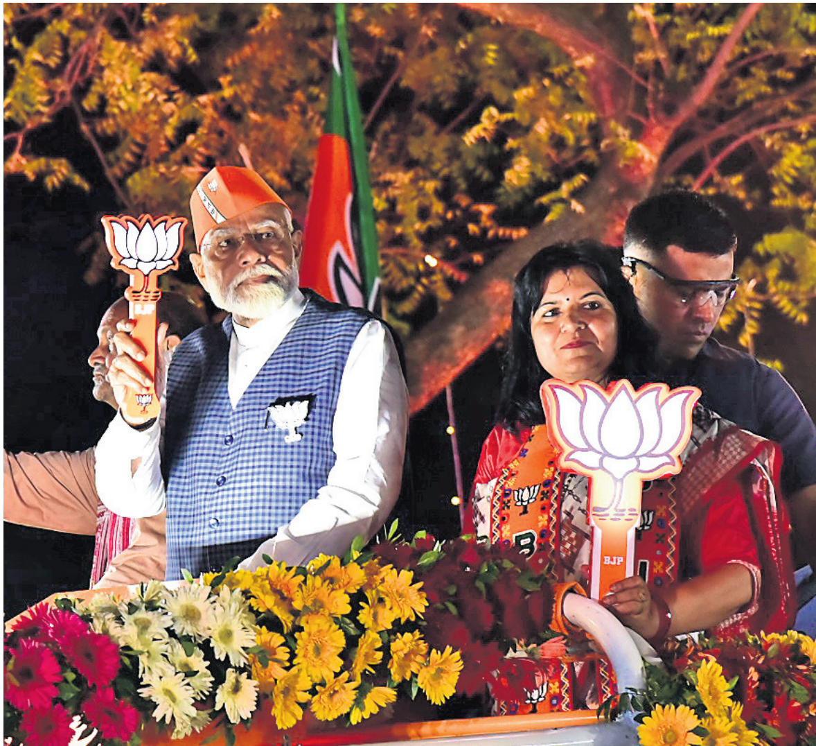
ପ୍ରଧାନମନ୍ତ୍ରୀ ନରେନ୍ଦ୍ର ମୋଦି ଶୁଭକାରୀ ରାତିରେ ଭୁବନେଶ୍ୱର ଜନପଥର ଭାଜପା କାର୍ଯ୍ୟାଳୟଠାରୁ ବାଣାବିହାର ପର୍ଯ୍ୟନ୍ତ ରୋଡ୍ ଶୋ' କରି ନିର୍ବାଚନ ପ୍ରଚାର କରୁଛନ୍ତି। ନିକଟରେ ଅଛନ୍ତି ଭୁବନେଶ୍ୱର ଲୋକ ସଭା ଭାଜପା ପ୍ରାର୍ଥୀ ଅପରାଜିତା ଷଡ଼ଙ୍ଗୀ ।

ଓଡ଼ିଶାରେ ଓଡ଼ିଆ ଅସିମିଲେସନ୍ ପ୍ରତି ବିପଦ ସୃଷ୍ଟି ହେଉଛି ବୋଲି ଏଠାରେ ରାଜା ମହାରାଜା ବେଳର ଛୁଟି ବଳବତ୍ତର ରହିଛି। ତେଣୁ ଲୋକେ ପରିବର୍ତ୍ତନ ଚାହୁଁଛନ୍ତି। ଚଳିତ ନିର୍ବାଚନରେ ଓଡ଼ିଶାରେ ଚର୍ଚ୍ଚିତ ପଏଣ୍ଟ ଆସିବ ବୋଲି ଶୁଭକାରୀ ପ୍ରଧାନମନ୍ତ୍ରୀ ନରେନ୍ଦ୍ର ମୋଦି ଭୁବନେଶ୍ୱରରେ ରୋଡ୍ ଶୋ' ବେଳେ ଏକ କାତୀୟ ଗଣମାଧ୍ୟମକୁ କହିଛନ୍ତି। ଓଡ଼ିଶାରେ ଏଥର ପଦ୍ମ ପୁଟିବା ରୋଡ୍ ଶୋ'ର ବିପୁଳ ଜନସମାଗମ ଏହାକୁ ପ୍ରମାଣିତ କରୁଛି ବୋଲି ପ୍ରଧାନମନ୍ତ୍ରୀ ଦୃଢ଼ାବଳୀ ପ୍ରକାଶ କରିଛନ୍ତି।