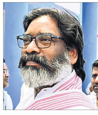
ହେମନ୍ତ ସୋରେନ୍ ନୂଆଦିଲ୍ଲୀ, ୧୦।୫

ଟି.ଆର୍. ବାଲୁ, କେଏମ୍‌ଏମ୍‌ର ମହୁଆ ମାଝି, ସିପିଆଇର ବିନୟ ବିଶ୍ୱମ୍ ପ୍ରମୁଖ ରହିଥିଲେ। ପ୍ରଧାନମନ୍ତ୍ରୀ ଓ ସ୍ୱରାଷ୍ଟ୍ର ମନ୍ତ୍ରୀଙ୍କ ବିରୋଧରେ କଂଗ୍ରେସ ସମେତ ବିଭିନ୍ନ ଦଳ ଅନେକ ଅଭିଯୋଗ କରିଥିଲେ ମଧ୍ୟ କୌଣସି କାର୍ଯ୍ୟାନୁଷ୍ଠାନ ହେଉ ନ ଥିବାରୁ ଆଶ୍ଚର୍ଯ୍ୟ ସମେତ ବିଭିନ୍ନ ପ୍ରସଙ୍ଗରେ ଇଣ୍ଡିଆ ବ୍ଲକ୍ ନେତାମାନେ ଇସିକୁ ଦୃଷ୍ଟି ଆକର୍ଷଣ କରିଥିଲେ।