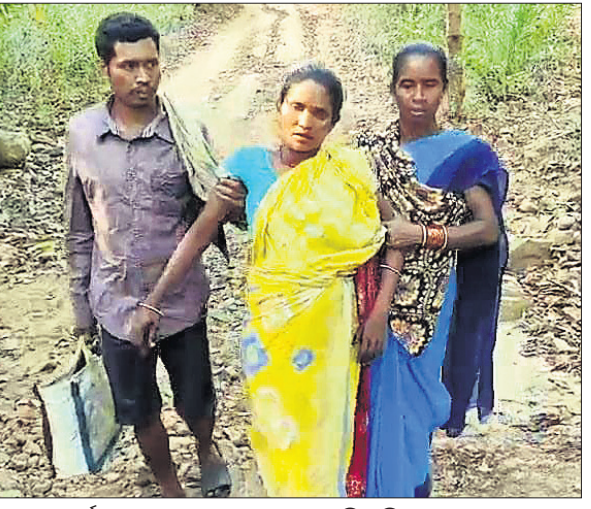
ଗର୍ଭବତୀଙ୍କୁ ଚଳାଇ ଚଳାଇ ନେଉଛନ୍ତି ପରିବାର ଲୋକେ। ଅଧାବାଟ ରୁଟାଙ୍ଗ ପର୍ଯ୍ୟନ୍ତ ଆସି ଅଟକି ରହିଥିଲା। ଫଳରେ ଅନ୍ୟ କିଛି ଉପାୟ ନ ଥିବାରୁ ପରିବାର ଲୋକେ ମାତେଙ୍କୁ ଚଳାଇ ଚଳାଇ ୪ କି.ମି. ରୁଟାଙ୍ଗ ପର୍ଯ୍ୟନ୍ତ ଆଣିଥିଲେ। ପରେ ସେଠାରୁ ଆସୁଥିବା ଯୋଗେ ତାଙ୍କୁ ଭବାନୀପାଟଣା ଜିଲ୍ଲା ମୁଖ୍ୟ ଚିକିତ୍ସାଳୟକୁ ନିଆଯାଇଥିଲା। ଫଳରେ ୧୦୮ ଆସୁଥିବା କର୍ମଚାରୀ ମହିଳାଙ୍କୁ ୨ କି.ମି. ଖଟିଆରେ ବୋହି ଆଣିଥିବା ସମୟରେ ବାଟରେ ପ୍ରସବ ହୋଇଥିଲା।

କଳାହାଣ୍ଡି ଜିଲ୍ଲାରେ ପୁଣି ଜନନୀ ମନ୍ତ୍ରଣାର ଏକ ଚିତ୍ର ସାମ୍ବଳାଣୀ ଆସିଛି। ରାସ୍ତା ନ ଥିବାରୁ ଗାଁକୁ ଆସୁଥିବା ଯାତ୍ରୀମାନଙ୍କୁ ନାହିଁ। ଫଳରେ ୪ କି.ମି. ଚାଲି ଚାଲି ଚାଲୁଥିବା ଗଲେ ଗର୍ଭବତୀ ମହିଳା। ଏଭଳି ଏକ ଅଭାବନୀୟ ଘଟଣା ଦେଖିବାକୁ ମିଳିଛି ଭବାନୀପାଟଣା ସଦର ବ୍ଲକ୍ ଚାଣ୍ଡେର ପଞ୍ଚାୟତ ପୋରଡ଼ାଗୁଡ଼ା ଗ୍ରାମରେ। ଗାଁର ଲିଟ୍ଟି ମାଟିକ ସ୍ତ୍ରୀ ମାତେ ମାଟିକ ଶୁକ୍ରବାର ସକାଳୁ ଗର୍ଭ ମନ୍ତ୍ରଣା ହେବାକୁ ଚାଲୁଥିବା ବେଳେ ନେବା ପାଇଁ ପରିବାର ଲୋକେ ବାହାରିଥିଲେ। ଏହି ସମୟରେ ସେମାନେ ଆସୁଥିବା ରାସ୍ତା ଫୋନ୍ କରିଥିଲେ। କିନ୍ତୁ ଗାଁକୁ ଯିବା ପାଇଁ ରାସ୍ତା ନ ଥିବାରୁ ଆସୁଥିବା