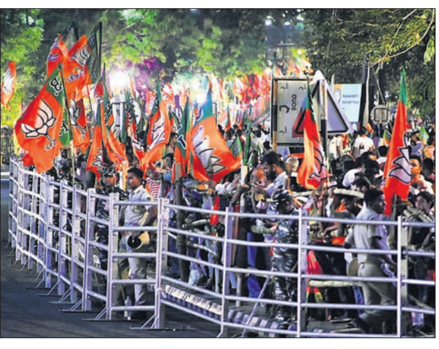
ରୁପାଳି ଛକ ବ୍ୟାରିକେଡ୍ ଭିତରେ ଭିଡ଼ ଏବଂ ମୋଦି ମୁଖା ପିଛାଏବା ଉଦ୍ଦେଶ୍ୟରେ କର୍ମୀ।