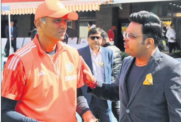
ରାହୁଲ ଭ୍ରାତୃ ଓ ଜୟ ଶାହା।

ପୂର୍ଣ୍ଣା, ୧୦୫ (ପି.ଟି.): ଆସନ୍ତା ମାସରେ ହେବାକୁଥିବା ଅନ୍ତର୍ଜାତୀୟ ଟି୨୦ କ୍ରିକେଟ ବିଶ୍ୱକପ୍ରେ ଭାରତୀୟ ଦଳର ମୁଖ୍ୟ କୋର୍ ପାଇଁ ରାହୁଲ ଭ୍ରାତୃଙ୍କ କାର୍ଯ୍ୟକାଳ ଶେଷ ହେବ। କିନ୍ତୁ ସେ ଏହି ପଦବୀରେ ପୁଣି ରହିବାକୁ ଚାହଁଲେ ଆବେଦନ କରିବାକୁ ପଡ଼ିବ ବୋଲି କହିଛନ୍ତି ଭାରତୀୟ କ୍ରିକେଟ କଣ୍ଟ୍ରୋଲ ବୋର୍ଡ (ବିସିଆଇ) ସାଧାରଣ ସମ୍ପାଦକ ଜୟ ଶାହା। ବିସିଆଇ ପ୍ରକୃତରେ ଭ୍ରାତୃ ଏବଂ ତାଙ୍କ ସପୋର୍ଟ ସ୍ୱାମ୍ୟ ଲାଗି ୨ ବର୍ଷ ପାଇଁ ରୁକ୍ତି କରିଥିଲେ। ଗତବର୍ଷ ନଭେମ୍ବରରେ ୫୦୦ଓର ବିଶିଷ୍ଟ ବିଶ୍ୱକପ୍ ଶେଷ ହେବା ପରେ ଏହି ମିଆଦକୁ ବୃଦ୍ଧି କରାଯାଇଥିଲା। ରୁହୁବାର ସ୍ଥାନୀୟ ବିସିଆଇ କାର୍ଯ୍ୟକ୍ରମରେ ଖବରଦାତାମାନଙ୍କ ସହ ଏକ ବାର୍ତ୍ତାକାପ ବେଳେ