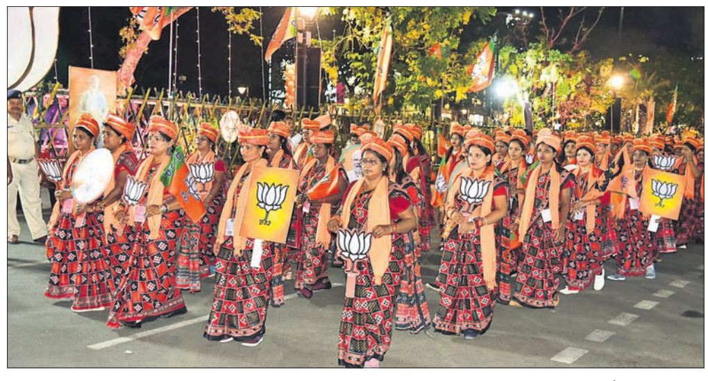
ମୋଦିଙ୍କ ରୋଡ୍ ଶୋ ରାତି ସମ୍ପୂର୍ଣ୍ଣରେ ସମାପ୍ତ ହେବା ପରେ ପରିଧାନ କରି ଯାଉଥିବା ଭାଙ୍ଗପା ନେତ୍ରୀ ଓ କର୍ମୀ।