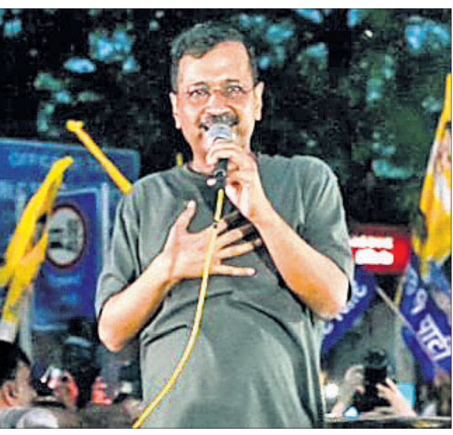
ତିହାର ଜେଲରୁ ବାହାରିବା ପରେ କେଜ୍‌ରିଓ୍ୱାଲ୍ ଦଳୀୟ କର୍ମୀ ଓ ସମର୍ଥକମାନଙ୍କୁ ସମ୍ବୋଧନ କରୁଛନ୍ତି।

ସୁପ୍ରିମକୋର୍ଟ ଶୁକ୍ରବାର ଅନ୍ତରାଣ ଜାମିନ ପ୍ରଦାନ କରିବାର କିଛି ଘଣ୍ଟା ପରେ ଦିଲ୍ଲୀ ମୁଖ୍ୟମନ୍ତ୍ରୀ ଅରବିନ୍ଦ କେଜ୍‌ରିଓ୍ୱାଲ୍ ତିହାର ଜେଲରୁ ମୁକ୍ତିଲାଭ କରିଛନ୍ତି। ସେ ଭଗବାନ ହନୁମାନଙ୍କୁ ଧନ୍ୟବାଦ ଜଣାଇବା ସହ ଏକଜୁତ୍ରବାଦ ବିରୋଧରେ ଲଢ଼େଇ ପାଇଁ ଜନସାଧାରଣଙ୍କ ସମର୍ଥନ ଲୋଡ଼ିଛନ୍ତି। ଲୋକ ସଭା ନିର୍ବାଚନରେ ପ୍ରଚାର ନିମନ୍ତେ କେଜ୍‌ରିଓ୍ୱାଲଙ୍କୁ ସର୍ବୋଚ୍ଚ ଅଦାଲତ କୁର୍ ୧ ପର୍ଯ୍ୟନ୍ତ ଅନ୍ତରାଣ ଜାମିନ ପ୍ରଦାନ କରିଛନ୍ତି। ଜେଲରେ ବାହାରିବା ବେଳେ ଆମ୍ ଆଦମ୍ନୀ ପାର୍ଟି ନେତା ଓ କର୍ମୀମାନେ ପୋଲିସ୍‌କୁ ସୂଚନା ଦିଆଯାଇଥିଲା। ଗୁଜରାଟ ସାଜବର ସେଲ୍ ପୋଲିସ୍ ଏହି ମାମଲାରେ ତଦନ୍ତ ଜାରି ରଖିଛି। ପୂର୍ତ୍ତାଯୋଗ୍ୟ, ଗତ ୬ ତାରିଖରେ ଗୁଜରାଟର ୨୫ ଲୋକ ସଭା ଆସନରେ ନିର୍ବାଚନ ଅନୁଷ୍ଠିତ ହୋଇଥିଲା।