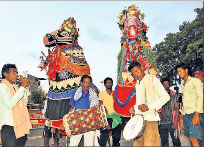
ଜନପଥର ବିଭିନ୍ନ ସ୍ଥାନରେ କଳାକାରମାନେ କଳା ପ୍ରଦର୍ଶନ କରି ପ୍ରଧାନମନ୍ତ୍ରୀ ମୋଦିଙ୍କୁ ସ୍ୱାଗତ କରୁଛନ୍ତି।