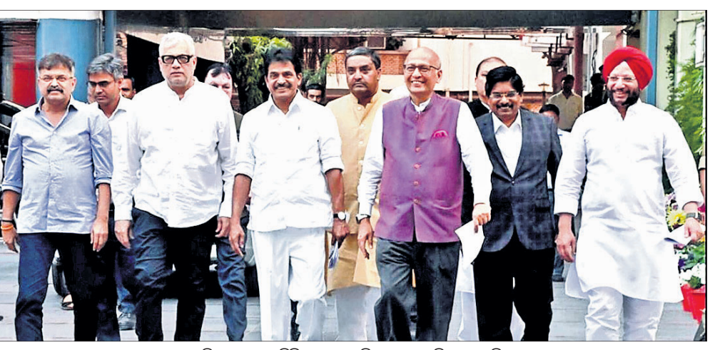
ଇଣ୍ଡିଆ ବ୍ଲକ୍ ପ୍ରତିନିଧିମାନେ ଇସିଆଇକୁ ଭେଟି ଫେରୁଛନ୍ତି।

ଇସିଆଇ ବ୍ଲକ୍ ନେତାମାନଙ୍କର ଏକ ପ୍ରତିନିଧି ଦଳ ଶୁକ୍ରବାର ନିର୍ବାଚନ କମିଶନଙ୍କ ସର୍ବୋଚ୍ଚ ଅଧିକାରୀମାନଙ୍କୁ ଭେଟି ମତଦାନ ହାର ତଥ୍ୟ ପ୍ରକାଶରେ ବିଳମ୍ବକୁ ନେଇ ତତ୍ତ୍ୱାବଳୀ କରିଛନ୍ତି। ନିର୍ବାଚନ ପ୍ରଚାର ବେଳେ ଶାସକ ଦଳକୁ ନେତାମାନେ ଆଦର୍ଶ ଆଚରଣ ବିଧି ଉଲ୍ଲଙ୍ଘନ କରୁଥିବାକୁ ସିପିଆଇ ବିରୋଧରେ କାର୍ଯ୍ୟାନୁଷ୍ଠାନ ପାଇଁ ସେମାନେ ଇସିକୁ ନିବେଦନ କରିଛନ୍ତି।