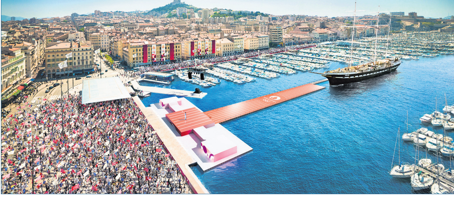
ପାର୍‌ସେଲ୍ ବନ୍ଦରରେ ଅଲିମ୍ପିକ୍ ମଣ୍ଡଳ ପହଞ୍ଚିବା ପରେ ଉପସ୍ଥିତ ଦର୍ଶକଙ୍କ ଆନନ୍ଦ ଉଭାୟ ।