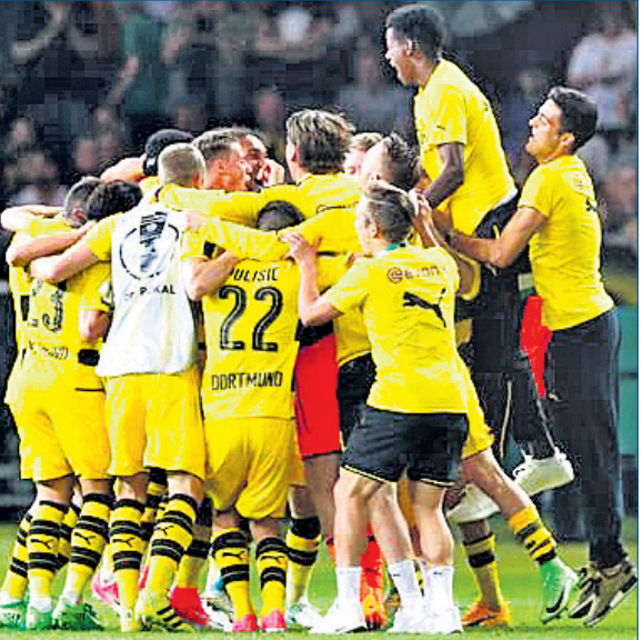
ବିଜୟ ପରେ ଉଲ୍ଲସିତ ବୋରୁସିଆ ଡର୍ଟମୁଣ୍ଡର ଖେଳାଳିମାନେ ।

ପ୍ୟାରିସ୍, ୮୫(ପି.ଟି.) ପ୍ୟାରିସ୍‌ରେ ଚଳିଥିବା ୨୦୨୪ର ପିଏସ୍‌ଜି ଲିଗ ଫାଇନାଲରେ ପ୍ରବେଶ କରିଛି ବୋରୁସିଆ ଡର୍ଟମୁଣ୍ଡ। ପ୍ରଥମ ଚରଣରେ ପିଏସ୍‌ଜି ୧-୦ରେ ଆଗୁଆ ଥିବା ଡର୍ଟମୁଣ୍ଡ ଦ୍ୱିତୀୟ ଚରଣରେ ମଧ୍ୟ ୧-୦ରେ ଜିତିବା ସହ ଆଗ୍ରେଗେଟ ୨-୦ରେ ବିଜୟ ହୋଇଥିଲା। ଫଳରେ ପିଏସ୍‌ଜି ପାଇଁ ଚାମ୍ପିୟନ୍‌ସ ଲିଗ ଫାଇନାଲରେ ଉପସ୍ଥାପିତ ହେବେ।