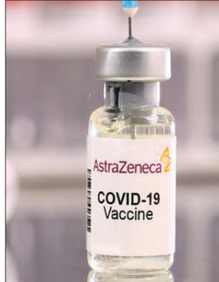
ପ୍ରତ୍ୟାହତ କରାଯାଇଥିବା କମ୍ପାନୀ କହିଛି। ବଜାରରେ ଦରକାରଠାରୁ ଅଧିକ

ବ୍ରିଟେନ୍ ପାର୍ଟୀ କମ୍ପାନୀ ଆସ୍ତ୍ରାଜେନେକା ନିଜର କରୋନା ଭାଙ୍ଗିବକୁ ବିଶ୍ୱ ବଜାରରୁ ଫେରାଇବା ପ୍ରକ୍ରିୟା ଆରମ୍ଭ କରିଛି। ଆସ୍ତ୍ରାଜେନେକା ସ୍ୱେଚ୍ଛାକୃତ ଭାବେ ବୁଧବାର ଯୁରୋପୀୟ ସଂଘରୁ କରୋନା ଟିକା ପାଇଁ ନିଜ 'ମାକେଟିଂ ପ୍ରାଧିକାରଣ'କୁ ଫେରାଇଆଣିଛି। ସେହିପରି ଅନ୍ୟ ଦେଶରୁ ମଧ୍ୟ ଏହି ଭାଙ୍ଗିବ ପ୍ରତ୍ୟାହାର କରାଯିବ ବୋଲି କମ୍ପାନୀ ପକ୍ଷରୁ ସୂଚନା ଦିଆଯାଇଛି। ଏ ସମ୍ପର୍କରେ ଆସ୍ତ୍ରାଜେନେକା ନିଜ ସଫେଲ ରଖିଛି। ବ୍ୟବସାୟିକ କାରଣରୁ ଏହି କରୋନା ଟିକାକୁ ବିଶ୍ୱ ବଜାରରୁ