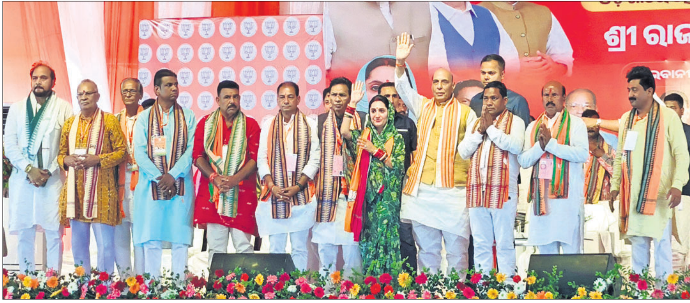
ବରିଷ୍ଠ ଭାଜପା ନେତା ତଥା ପ୍ରତିରକ୍ଷା ମନ୍ତ୍ରୀ ରାଜନାଥ ସିଂଙ୍କ ସହ ଭାଜପା ଲୋକ ସଭା ଓ ବିଧାନସଭା ପ୍ରାର୍ଥୀ।

ଓଡ଼ିଶାରେ ଭାଜପା ସରକାର ଆସିଲେ ରୁଚି ଆୟୁଷ୍ମାନ ସ୍ୱାସ୍ଥ୍ୟକାର୍ତ୍ତ ଲାଗୁ କରାଯିବ ବୋଲି ବରିଷ୍ଠ ଭାଜପା ନେତା ତଥା ପ୍ରତିରକ୍ଷା ମନ୍ତ୍ରୀ ରାଜନାଥ ସିଂ କହିଛନ୍ତି। ରୁଧିରୀ ଦିନିକିଆ କଳାହାଣ୍ଡି ଗସ୍ତରେ ଆସି ଦକ୍ଷିଣ ପ୍ରାଥୀଙ୍କ ପାଇଁ ନିର୍ବାଚନୀ ପ୍ରଚାର କରିବା ଅବସରରେ ସେ ଏହା କହିଛନ୍ତି। ରାଜନାଥ ଅପରାହ୍ଣ ୧ଟା ୧୫ରେ ଏକ ସ୍ୱତନ୍ତ୍ର ସମ୍ବଲପୁରରେ ଆସି ଭବାନୀପାଟଣା ସହରସ୍ଥିତ ରିଜର୍ଭ ପଡ଼ିଆରେ ପହଞ୍ଚିଥିଲେ। ସେଠାକୁ ସଫଳ ପଥରେ ଯାଇ ଲାଲ ବାହାଦୁର ଶାସ୍ତ୍ରୀ ସ୍ମୃତିଉପାରେ ଅନୁଷ୍ଠିତ ଭାଜପାର ବିଜୟ ସଂକଳ୍ପ ସମାବେଶରେ ଯୋଗଦେଇଥିଲେ। ଏହି ସମୟରେ ଦଳ ପକ୍ଷରୁ ତାଙ୍କୁ ବିପୁଳ ସ୍ୱାଗତ ସମର୍ଜନା ଦିଆଯାଇଥିଲା। ପ୍ରଭୁ ଜଗନାଥ ଓ ମା' ମାଣିକେଶ୍ୱରୀଙ୍କୁ ପ୍ରଣାମ କରି ରାଜନାଥ ନିଜର ଅଭିଭାଷଣ ଆରମ୍ଭ କରିଥିଲେ। ସେ କହିଥିଲେ ପ୍ରଥମଥର ସରକାର ଆସିଲେ, ଧନୀ ଗରିବ ସମସ୍ତଙ୍କୁ ଆୟୁଷ୍ମାନ ସ୍ୱାସ୍ଥ୍ୟକାର୍ତ୍ତ ମିଳିବ। ଆମେ ଯାହା କହୁ ତାହା କରୁ। ଏହା ଆମ ଚରିତ୍ର। ଆମେ ଅନୁରୋଧ ୩୦୦ ହଜାରକୁ କହିଥିଲୁ, ହଜାରକୁ। ରାମ ମନ୍ଦିର ନିର୍ମାଣ କରିବାକୁ କହିଥିଲୁ, କଲୁ। ଓଡ଼ିଶାବାସୀ ୫୦୦ବର୍ଷ କଂଗ୍ରେସ