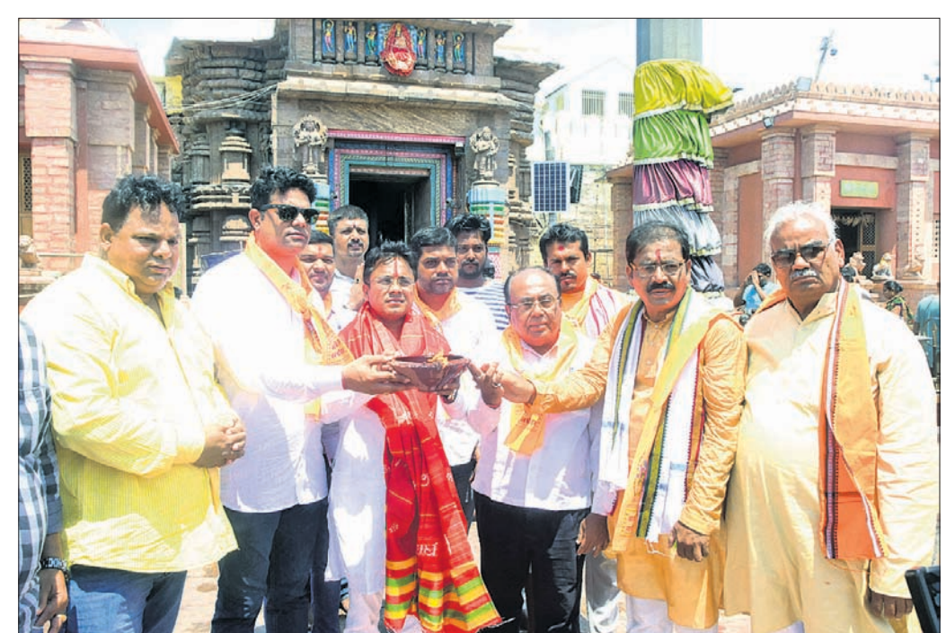
ଶ୍ରୀମନ୍ଦିର ସମ୍ମୁଖରେ ବାପଦାନ କରାଯାଇ ଅଭିଯାନର ଶୁଭାରମ୍ଭ କରାଯାଇଛି।