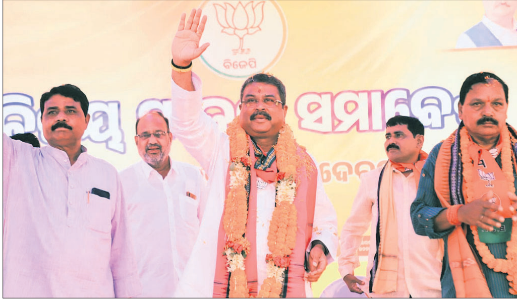
ଭାଜପାର ବିଜୟ ସଂକଳ୍ପ ସମାବେଶରେ କେନ୍ଦ୍ରମନ୍ତ୍ରୀ ତଥା ସମ୍ବଲପୁର ଲୋକ ସଭା ପ୍ରାର୍ଥୀ ଧର୍ମେନ୍ଦ୍ର ପ୍ରଧାନଙ୍କ ସହ ଅନ୍ୟମାନେ।

ରାଜ୍ୟରେ ଭାଜପା କ୍ଷମତାକୁ ଆସିଲେ ଧନୀର ସର୍ବନିମ୍ନ ୧୦୧୫ଟି ଧର୍ମେନ୍ଦ୍ର ହେବ। ପ୍ରତ୍ୟେକ ମହିଳାଙ୍କୁ ୫୦ ହଜାର ଟଙ୍କାର କୁପନ ଦିଆଯିବ। କେନ୍ଦ୍ରପତ୍ରର ମୂଲ୍ୟ ବୃଦ୍ଧି କରାଯାଇ ବିତା ପ୍ରତି ୨୯ଟା ମୂଲ୍ୟ ଧାର୍ଯ୍ୟ କରାଯିବ। ତୋକାଳି ଓ ବନ୍ଧନିମାଳକୁ ଅଧିକ ବୋନସ ଦିଆଯିବ। ରାଜ୍ୟର ସବୁ ଗରିବଙ୍କୁ ଘର ଦିଆଯିବ। ସୋଲାର ଏନର୍ଜୀ ମଧ୍ୟ ଯୋଗାଇ ଦିଆଯିବ। ରାଜ୍ୟରେ ଦେଶୀ ମଦ ସମ୍ପୂର୍ଣ୍ଣ ଭାବେ ନିଷିଦ୍ଧ କରାଯିବ। ଓଡ଼ିଶାକୁ ୨୯୯୯ ଟଙ୍କା ଆସି ପ୍ରଧାନମନ୍ତ୍ରୀ ନରେନ୍ଦ୍ର ମୋଦି ଦେଇଥିବା