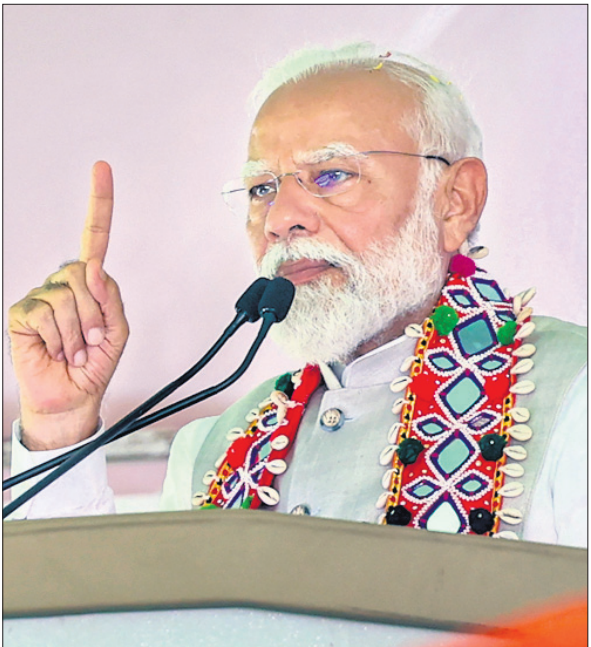
ସାଇଲେନ୍ସ ସାଥୀ ପରେ ମୋଦି ୨୦୧୭ ନଭେମ୍ବର ୮ରେ ନୋଡ୍‌ସଦା ଘୋଷଣା କରିଥିଲେ

ସୃଷ୍ଟିକାରୀ' ବୋଲି ଅଭିହିତ କରିବା ସହ ସେମାନଙ୍କ ପ୍ରତି କଂଗ୍ରେସର ସମାଲୋଚନାକୁ ବିକାଶ ବିରୋଧୀ ବୋଲି କହିଆସିଛନ୍ତି। ଏବେ ତୃତୀୟ ପର୍ଯ୍ୟାୟ ନିର୍ବାଚନ ପରେ ହୋଇ କଳାଧନ ସହ ବୁଦ୍ଧ ଶିଳ୍ପପତିଙ୍କୁ ଯୋଡ଼ି କହିବାକୁ ନେଇ ସୋସିଆଲ ମିଡ଼ିଆରେ ନାନା ପ୍ରତିକ୍ରିୟା ପ୍ରକାଶ ପାଇଛି। ମୋଦିଙ୍କ ପରିବର୍ତ୍ତିତ ସ୍ୱରକୁ ନେଇ କେନ୍ଦ୍ରୀୟ ମୋଦି କଳାଧନ ନିର୍ବାଚନରେ ପରାଜୟର ପରୋକ୍ଷ ସ୍ୱୀକାରୋକ୍ତି ରୂପେ ଅଭିହିତ କରିଛନ୍ତି। ଏଥିସହ ପ୍ରବର୍ତ୍ତନ ନିର୍ଦ୍ଦେଶକମ୍ଭ (ଇଡି) ଏବଂ କେନ୍ଦ୍ରୀୟ ତଦନ୍ତ ବ୍ୟୁରୋ (ସିବିଆଇ) ଆଉ ଆଉ ଏତେ କଳାଧନ କେଉଁଠି ଆସିଲା ବୋଲି ମଧ୍ୟ ସୋସିଆଲ ମିଡ଼ିଆରେ ଅନେକ ପ୍ରଶ୍ନ କରିଛନ୍ତି। ଏହାର ଉତ୍ତରରେ କେତେକଙ୍କ ମୁକ୍ତ କହିଛନ୍ତି, ବିପ୍ରାକରଣ ଜରିଆରେ କଳାଧନକୁ ରୋକାଯାଇ ପାରିନାହିଁ। ପୂର୍ବରୁ ଠୁ କଳାଧନକୁ