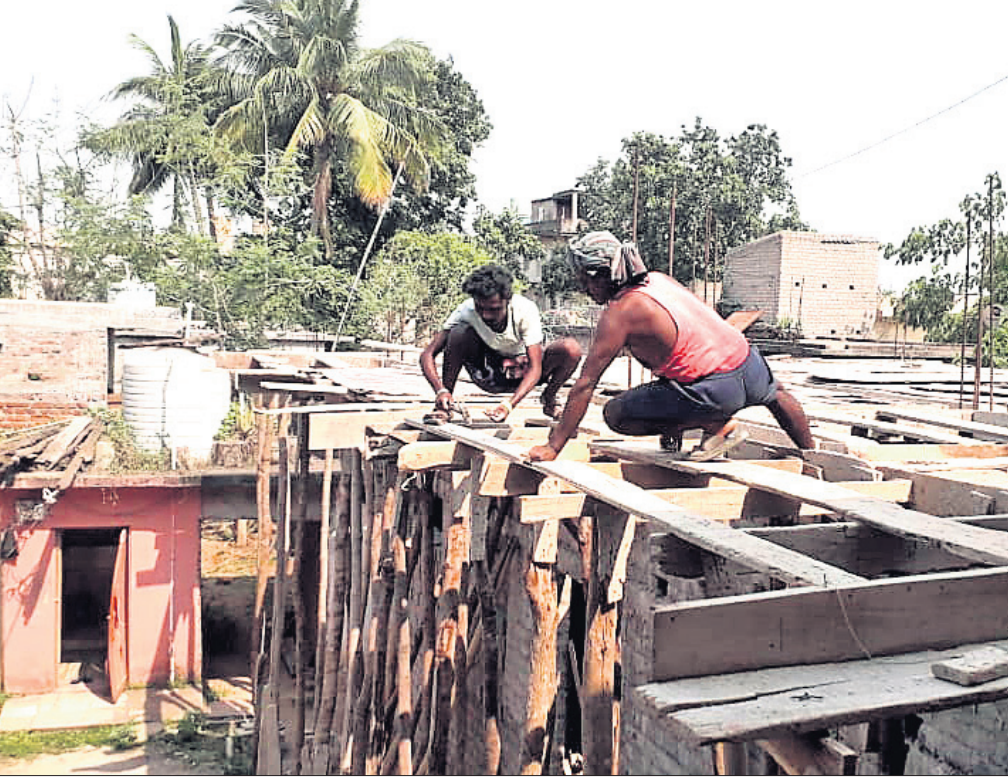
କାମାକ୍ଷାନଗର ଅଞ୍ଚଳରେ ପ୍ରଚଣ୍ଡ ଖରାକୁ ଖାତିର ନ କରି ଶନିବାର ସେଣ୍ଟ୍ କାମ କରୁଛନ୍ତି ୨ ଜଣ ଶ୍ରମିକ।