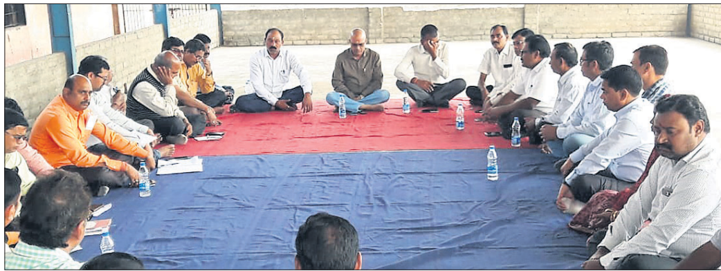
ବୈଠକରେ ଉପକିର୍ତ୍ତୀପାଳଙ୍କ ସମେତ ଶ୍ରମିକ ସଙ୍ଗଠନର କର୍ମକର୍ତ୍ତା ଓ ଅନ୍ୟମାନେ ।

ତାଳଚେର ଗୋପାଳପ୍ରସାଦସ୍ଥିତ ମା' ହିଜୁଳାଙ୍କ ଭବ୍ୟ ମନ୍ଦିର ନିର୍ମାଣ କାର୍ଯ୍ୟକୁ ଦ୍ୱରାଦିତ କରିବା ପାଇଁ ରବିବାର ମନ୍ଦିର ପରିସରରେ ଏକ ବୈଠକ ଅନୁଷ୍ଠିତ ହୋଇଯାଇଛି ।