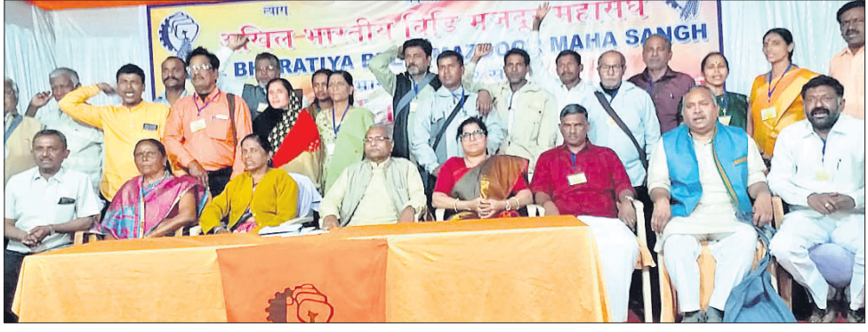
ବୈଠକରେ ଉପସ୍ଥିତ ଅତିଥିବୃନ୍ଦଙ୍କ ସମେତ ଅନ୍ୟମାନେ।