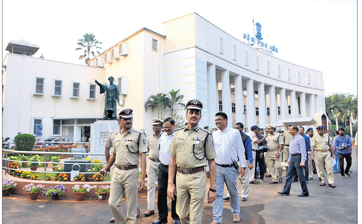
ବିଧାନସଭା ଅଧିବେଶନ ପୂର୍ବରୁ ରବିବାର ସୁରକ୍ଷା ବ୍ୟବସ୍ଥାକୁ ବୁଲି ଦେଖିଛନ୍ତି ଡିଜିପି ଆର୍.ପି. ଶର୍ମା ।

ଭୁବନେଶ୍ୱର, ୩୧୨ (ବୁଧବେଳା) ସୋମବାରଠାରୁ ଆରମ୍ଭ ହେଉଛି ବିଧାନସଭାର ବଜେଟ୍ ଅଧିବେଶନ । ଏଥିପାଇଁ ବିଧାନସଭାର ସୁରକ୍ଷା ବ୍ୟବସ୍ଥାକୁ କଡ଼ାକଡ଼ି କରାଯାଇଛି ।