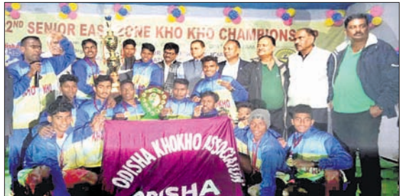
ଚାମ୍ପିୟନ ଓଡ଼ିଶା ମହିଳା ଓ ପୁରୁଷ ଦଳ ଟ୍ରଫି ସହ ଅତିଥିଙ୍କୁ ଗହଣାରେ ।