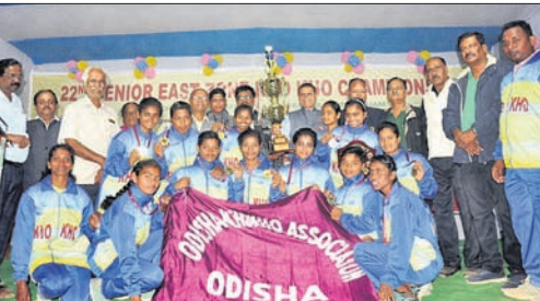
ଚାମ୍ପିୟନ ଓଡ଼ିଶା ମହିଳା ଓ ପୁରୁଷ ଦଳ ଟ୍ରଫି ସହ ଅତିଥିଙ୍କୁ ଗହଣାରେ ।

ଅଷ୍ଟ୍ରିଆ ପ୍ରଥମ ଚାମ୍ପିୟନସିପ: ୫୩୪/୫ (ପାଲି ଘୋଷଣା) । ଶ୍ରୀଲଙ୍କା ପ୍ରଥମ ଚାମ୍ପିୟନସିପ: ୨୧୫ । ଅଷ୍ଟ୍ରିଆ ଚାମ୍ପିୟନସିପରେ ଭଉଣ୍ଡ ଓଡ଼ିଶା ମହିଳା ଓ ପୁରୁଷ ଟିମ୍ ଚାମ୍ପିୟନ ହୋଇଛି । ରବିବାର ମହିଳା ବର୍ଗରେ ପୂର୍ଣ୍ଣାଞ୍ଜଳ ଖୋଷା ଚାମ୍ପିୟନସିପ ହୋଇଛି ।