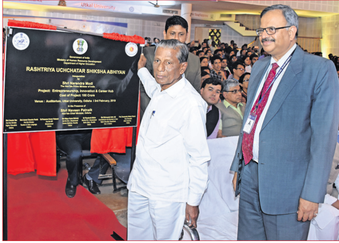
ଶିକ୍ଷାନୁଷ୍ଠାନ ଅବସରରେ ଉତ୍ତମ ବିଶ୍ୱବିଦ୍ୟାଳୟରେ ଆୟୋଜିତ କାର୍ଯ୍ୟକ୍ରମରେ ଉପସ୍ଥିତ ଉଚ୍ଚ ଶିକ୍ଷାମନ୍ତ୍ରୀ, ବିଶ୍ୱବିଦ୍ୟାଳୟ କୁଳପତି ଓ ଅନ୍ୟମାନେ ।