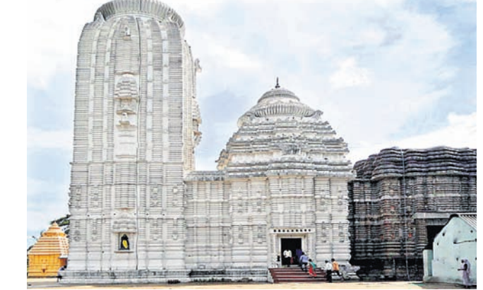
ଗଡ଼କୁଳଙ୍ଗରେ ଥିବା କୁଞ୍ଜବିହାରୀ ମନ୍ଦିର।