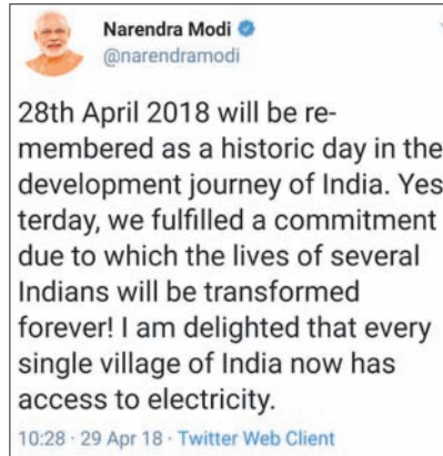
୯ ମାସ ତଳେ ପ୍ରଧାନମନ୍ତ୍ରୀ କରିଥିବା ଭୁବଳ।

ରଖାଯାଇଥିଲା, ଏବେ ସେହି ସମୟ ଅସଫଳତା ମାର୍ଚ୍ଚ ୨୦୧୯ ପର୍ଯ୍ୟନ୍ତ ବୃଦ୍ଧି କରିଦିଆଯାଇଛି ବୋଲି ଦାବି କରାଯାଇଛି। ହେଲେ ପାଲିମେଣ୍ଟରେ କିନ୍ତୁ ମିଛ ସଫଳତାର ଆହୁରି ଏକ ଦୃଶ୍ୟ ଦେଖିବାକୁ ମିଳିଛି। ୩୧ ଜାନୁଆରୀ ୨୦୧୯ରେ ପାଲିମେଣ୍ଟରେ ହୋଇଥିବା ମିଳିତ (ଉଭୟ ରାଜ୍ୟ ସଭା ଓ ଲୋକ ସଭା) ଅଧିବେଶନରେ ରାଷ୍ଟ୍ରପତି ରାମନାଥ କୋବିନ୍ଦ ନିଜ ଉଦ୍ଦେଶ୍ୟରେ ମଧ୍ୟ କହିଥିଲେ ଯେ, ଆମ ସରକାର ଦେଶର ପ୍ରତି ଗାଁ ଏବଂ ଘରେ ଘରେ ବିଦ୍ୟୁତ୍ ପହଞ୍ଚାଇ ସାରିଛନ୍ତି। ୨୦୧୪ରେ ୧୮