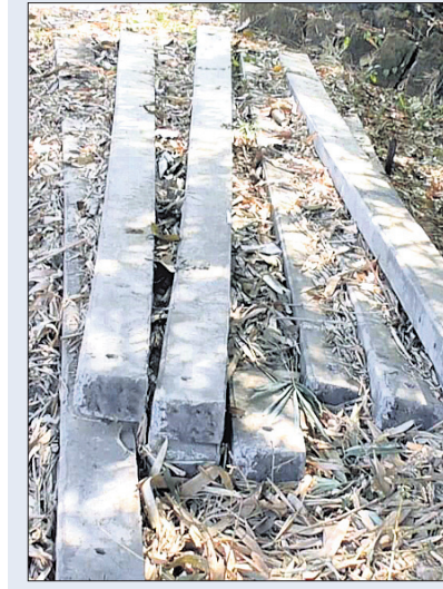
ଦେଶାନ୍ତଳ ଜିଲ୍ଲା କାମାକ୍ଷାନଗର ବ୍ଲକ୍ କାନପୁର ପଞ୍ଚାୟତର ସୁଧାକରଚଲ୍ଲୀ ଗ୍ରାମରେ ପଡ଼ିରହିଥିବା ବିଦ୍ୟୁତ୍ ଖୁଣ୍ଟ।