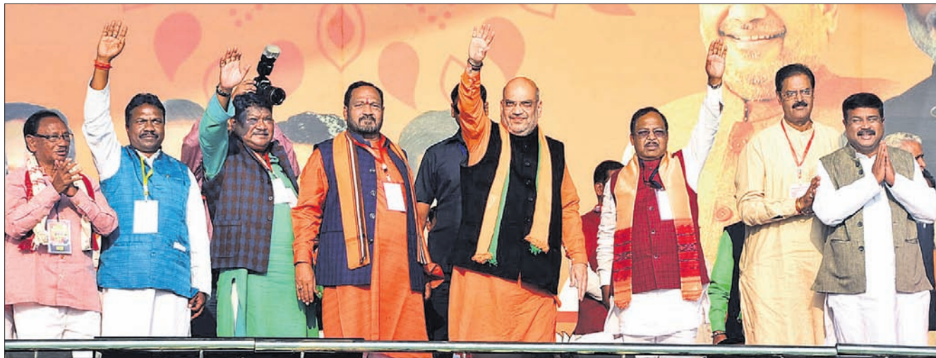
ପୁରୀ ତାଳବଣିଆଠାରେ ଭାଜପା ପକ୍ଷରୁ ଆୟୋଜିତ ଆଦିବାସୀ ଅଧିକାର ରାଲିରେ ଦକାୟ ରାଷ୍ଟ୍ରୀୟ ଅଧ୍ୟକ୍ଷ ଅମିତ୍ ଶାହ, କେନ୍ଦ୍ରମନ୍ତ୍ରୀ ଧର୍ମେନ୍ଦ୍ର ପ୍ରଧାନ, ଲୁହାଣ୍ଡ ଓରାମ୍ ଓ ଅନ୍ୟ ନେତୃବୃନ୍ଦ ।