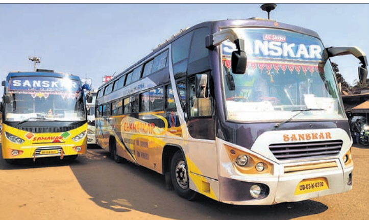
ବଡ଼ବିଲ ପୁରୁଣା ବସଷ୍ଟାଣ୍ଡରେ ଛିଡା ହୋଇଥିବା ଯାତ୍ରୀବାହୀ ବସ୍। ନିର୍ବାଚନ ସମୟରେ ପୋଲିସ୍, ନିର୍ବାଚନ କମିଶନର ସମ୍ପର୍କରେ ଯୋଗାଯୋଗ କରିବା ପାଇଁ ଚାଷୀମାନେ ଅଧିକାଂଶ ସମୟ ଗଠିତ ହୋଇଥିଲେ।

ବଡ଼ବିଲ, ୩।୨ (ସ.ପ୍ର.): କେନ୍ଦୁଝର ଜିଲା ପଞ୍ଚାୟତରେ ରବିବାର ରାଜ୍ୟ ସରକାରଙ୍କ ଚାଷୀ ସମାବେଶ କାର୍ଯ୍ୟକ୍ରମ ପାଇଁ କେତେକ ବସ୍ ଚାଷୀମାନଙ୍କ ଦ୍ୱାରା ରିକ୍ତଜିଗିନ ହୋଇଥିଲା।