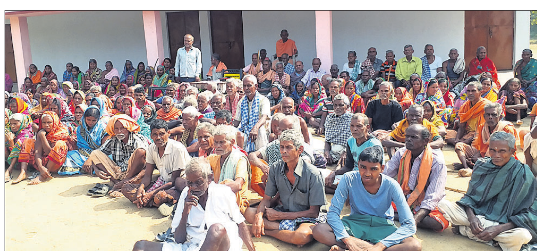
ବୟୋଜ୍ୟେଷ୍ଠ ହିତାଧିକାରୀଙ୍କ ବୈଠକ ।

ଭରା ପାଇଁ ଯାଉଛନ୍ତି ହିତାଧିକାରୀ । ହେଲେ ଘରେ ପହଞ୍ଚିବାକୁ ଗାଡ଼ି ଭଡ଼ାରେ ସରିଯାଉଛି ଟଙ୍କା । ଗାଁରୁ ପଞ୍ଚାୟତ କାର୍ଯ୍ୟାଳୟ ଦୂରତା ଅଧିକ ହୋଇଯାଉଥିବାରୁ ଅନେକେ କଷ୍ଟ କରି ଭରା ପାଇଁ ଯିବାକୁ ଇଚ୍ଛା ମଧ୍ୟ କରୁନାହାନ୍ତି । ଏପରି ସ୍ଥିତିରେ ଅନୁଗୋଳ କୁଳ ଲଙ୍କରବନ୍ଧ ପଞ୍ଚାୟତର ଶତାଧିକ ହିତାଧିକାରୀ ଭରା ସୁବିଧାରୁ ବଞ୍ଚିତ ହେଉଛନ୍ତି । ଏ ନେଇ ଅଧିକାରୀଙ୍କୁ ଚାପୁ ଅସନ୍ତୋଷ ପ୍ରକାଶ କରିବା ସହ ସେମାନଙ୍କୁ ଗାଁରେ କିମ୍ପା ନିକଟରେ ଭରା ଯୋଗାଇଦେବାକୁ ଦାବି କରିଛନ୍ତି ।