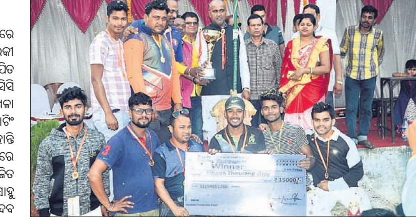
ଚାମ୍ପିୟନ ବଳ ଟ୍ରଫି ଓ ପୁରସ୍କାର ସହ ଅତିଥିଙ୍କ ଗହଣରେ।