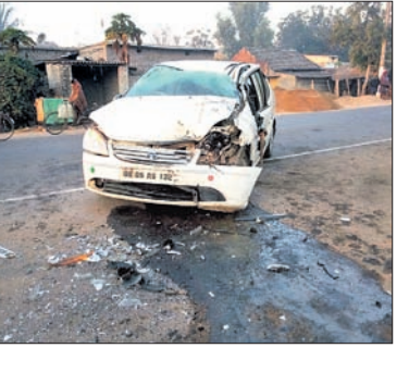
ପାଲଲହଡ଼ା, ୨୧୨ (ଡି.ଏ.ଏ.)

ଛେଡ଼ିପଦା ଆନା କୋଶଳା ଚନ୍ଦନନଗର ନିକଟରେ ଶନିବାର ସକାଳେ ଟ୍ରକ୍ ଧକ୍କା ଦେଇ ଏକ କାର ଦୁର୍ଘଟଣାଗ୍ରସ୍ତ ହୋଇଛି ।