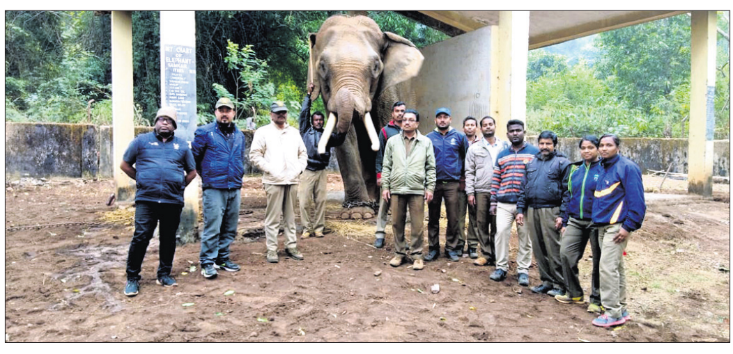
ମାହୁଡ଼ପାନଙ୍କ ସହିତ ରେଞ୍ଜ ଅଧିକାରୀ ଓ ବନକର୍ମଚାରୀ ।

ସାତକୋଶିଆ ବ୍ୟାଘ୍ର ପ୍ରକଳ୍ପର ସୁରକ୍ଷା ପାଇଁ ଶିମଳିପାଳ ଅଭୟାରଣ୍ୟରୁ ଆସିଥିବା ଟ୍ରକ୍ ମାହୁଡ଼ପାନଙ୍କ ଓ ରାଜକୁମାରଙ୍କୁ ଟ୍ରକ୍ ଜବତ କରାଯାଇଛି ।