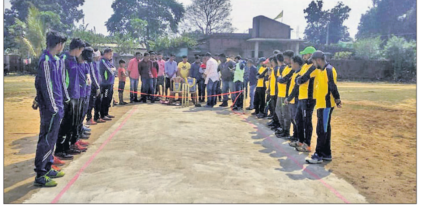
ଅତିଥି ପ୍ରତିଯୋଗୀଙ୍କୁ ଉଦ୍‌ଯାପନ କରୁଛନ୍ତି।

କିଶୋରନଗର ବ୍ଲକ ନାଟକ ପଞ୍ଚାୟତ ବଡ଼ ତଳିଆଣା ଗ୍ରାମ ଖେଳ ପଡ଼ିଆଠାରେ ମଙ୍ଗଳବାର ପ୍ରସନ୍ନ ଓ ଜ୍ଞାନେନ୍ଦ୍ର ମେମୋରିଆଲ କପ୍ କ୍ରିକେଟ୍ ତୁର୍ଣ୍ଣମେଣ୍ଟ ଉଦ୍‌ଯାପିତ ହୋଇଯାଇଛି।