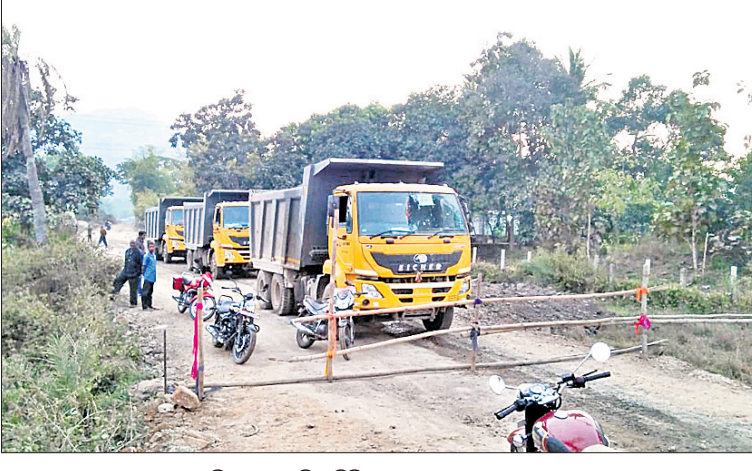
ରାସ୍ତା ଅବରୋଧ ଯୋଗୁ ଭାରିଯାନ ଅଟକି ରହିଛି। ଛେଉଁପଦା, ୨୯।୧(ସ.ପ୍ର.)

ରାସ୍ତା ଘରୋଇ ଜମିରେ ନିର୍ମାଣ ହୋଇଛି। ଏ ନେଇ ଜମି ମାଲିକମାନେ କ୍ଷତିପୂରଣ ଦାବି କରିଆସୁଥିଲେ ମଧ୍ୟ ପ୍ରଶାସନ ପଦକ୍ଷେପ ନେଉନାହିଁ। ଏହାର ପ୍ରତିବାଦରେ କ୍ଷତିଗ୍ରସ୍ତ ଗୋଦିନିଆରିରେ ଥିବା ଗାୟତ୍ରୀ କନଷ୍ଟ୍ରକ୍ସନ୍ କାର୍ଯ୍ୟାଳୟ ପୁଞ୍ଜ୍ୟରାସ୍ତାକୁ ମଙ୍ଗଳବାର ପୁଞ୍ଜ୍ୟରାସ୍ତାରେ ବନ୍ଦ କରିଛନ୍ତି। ଏ ନେଇ ବିଭାଗୀୟ କର୍ତ୍ତୃପକ୍ଷଙ୍କୁ ସୂଚନାଯୋଗ୍ୟ, ୫-୫୯- ଛାତ୍ରାଛାତ୍ରୀ କନଷ୍ଟ୍ରକ୍ସନ୍ ସମ୍ପ୍ରଦାୟ କାର୍ଯ୍ୟ ଗାୟତ୍ରୀ କନଷ୍ଟ୍ରକ୍ସନ୍ କର୍ମଚାରୀଙ୍କୁ ସମାପନ ଦିଆଯାଇଛି। ତେବେ କମ୍ପାନୀ କାର୍ଯ୍ୟାଳୟ ପୁଞ୍ଜ୍ୟ