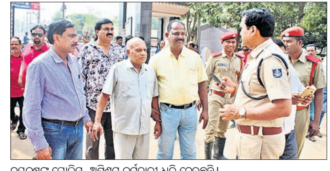
ଭୟଭୀତ ଲୋକ, ଅଗ୍ନିଶମ କର୍ମଚାରୀ ଧରି ନେଇଛନ୍ତି। ଭେଙ୍କାନାଳ ଅଫିସ, ୨୯।୧

ଭେଙ୍କାନାଳ ଜିଲ୍ଲାପାଳଙ୍କ କାର୍ଯ୍ୟାଳୟ ପରିସରରେ ମଙ୍ଗଳବାର ମଧ୍ୟାହ୍ନରେ କାମାକ୍ଷାନଗର ରୁକ୍ମ କମରପାପଟଣା ଗ୍ରାମର ଗ୍ରାହକ ମାଲିକ ଭୟଭୀତ ହୋଇଛନ୍ତି। (୨୯) ଦେହରେ କିରୋବିନ ଭାଲି ହୋଇ ଆତ୍ମହତ୍ତି ଉଦ୍ୟମ କରିଛନ୍ତି। ଠିକଣା ସମୟରେ ପୋଲିସ ଏବଂ ଅଗ୍ନିଶମ କର୍ମଚାରୀ ତାଙ୍କୁ ଉଦ୍ଧାର କରି ନେଇଥିଲେ। ୨୦୧୮ ନଭେମ୍ବର ୧୫ରେ ଭୁବନେଶ୍ୱରୀ ଆନା ପୋଲିସ