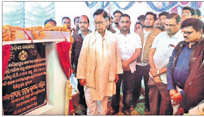
ମନ୍ତ୍ରୀ ରାସ୍ତାର ଶିଳାନିଧାସ କରୁଛନ୍ତି।