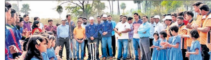
ଉଦ୍‌ଘାଟନୀ ଦିବସରେ ଅତିଥିଙ୍କ ସହିତ ଖେଳାଳିମାନେ ।