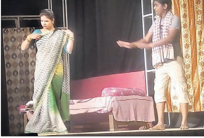
ନାଟକ ଅବସରର ଏକ ଦୃଶ୍ୟ।