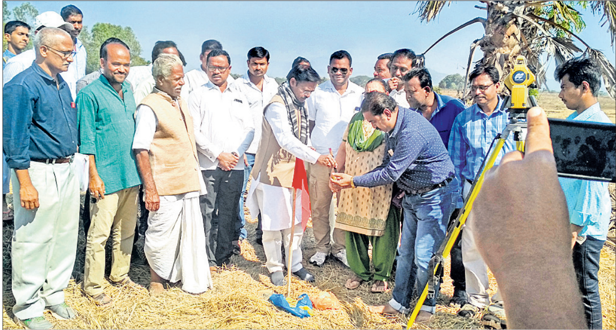
ଅଧିକାରୀମାନେ ରେଳ ପ୍ରକଳ୍ପ ସର୍ବେ କାର୍ଯ୍ୟର ଶୁଭାରମ୍ଭ କରୁଛନ୍ତି।