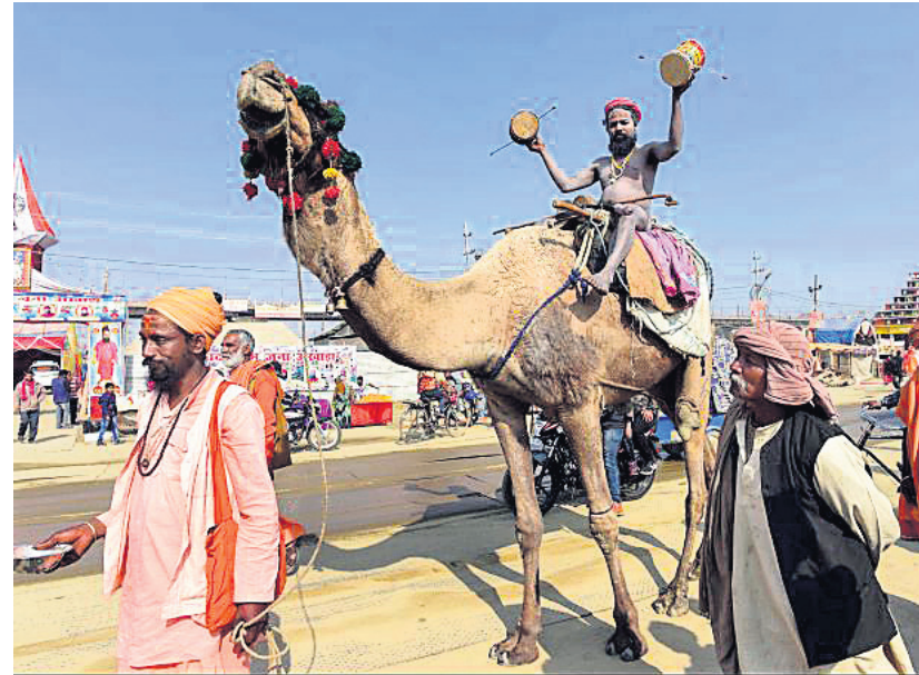
ପ୍ରମାଣର କୁମ୍ଭମେଳରେ ଜଣେ ନାରୀସାଧୁ ଓଡ଼ିଶାରେ ବସି ପରିଭ୍ରମଣ କରୁଛନ୍ତି।