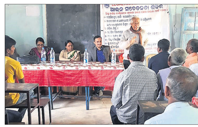
ସଚେତନତା ଶିବିରରେ ମଞ୍ଚାସୀନ ଅତିଥିମାନେ ।