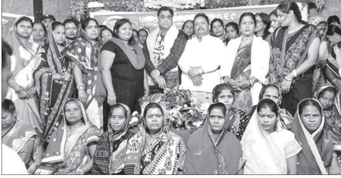
ବିଜେଡିରେ ସାମିଲ ହୋଇଥିବା ଏସ୍‌ଏସ୍‌ସି ସଦସ୍ୟମାନେ ।