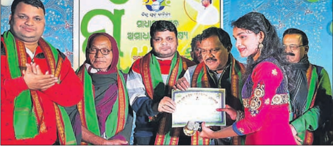
ଅତିଥି ଜଣେ କୃତା ପ୍ରତିଯୋଗୀଙ୍କୁ ପୁରସ୍କୃତ କରୁଛନ୍ତି ।