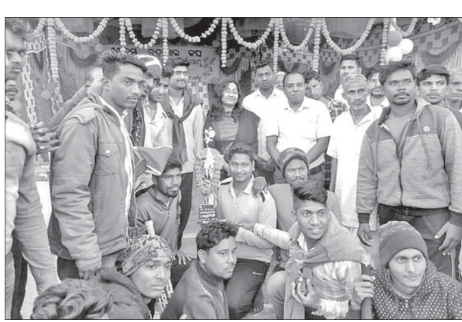
ଡ୍ରିମ୍ ସହ ଚାମ୍ପିୟନ ବଳ ।