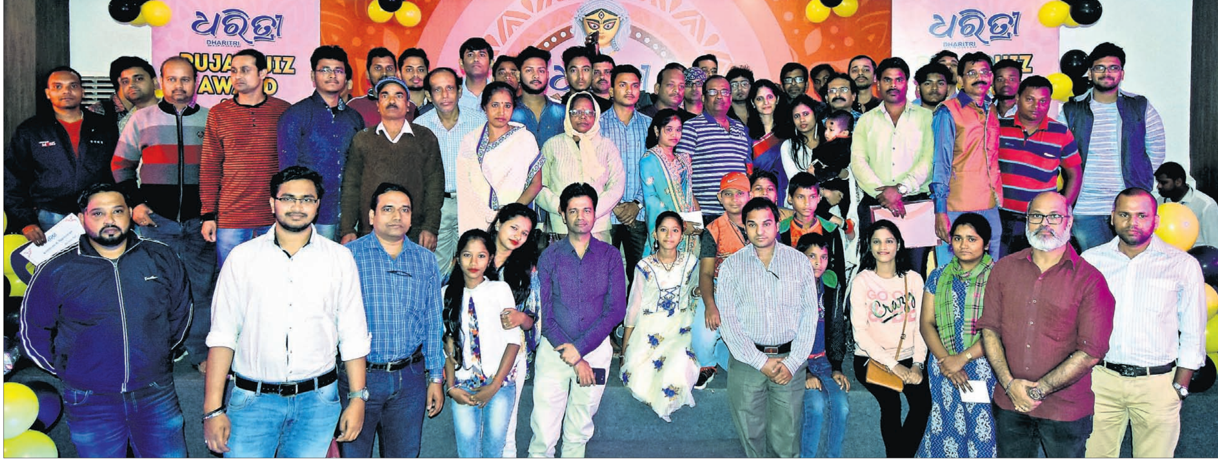
ଭୁବନେଶ୍ୱର ମାଷ୍ଟରକ୍ୟାଣ୍ଟିନସ୍ଥିତ ପ୍ରେସ୍ କ୍ଲବ୍ ଅଫ୍ ଓଡ଼ିଶା ପରିସରରେ ରବିବାର ଆୟୋଜିତ 'ଧରିତ୍ରୀ' ପୂଜା କୁଳଦ୍ୱୟ-୨୦୧୮ର ପୁରସ୍କାର ବିତରଣ ଉତ୍ସବରେ ତେଲି ଓନିଏରଙ୍କୁ ପୁରସ୍କୃତ ହୋଇଥିବା ପ୍ରତିଯୋଗୀ ଓ ଅନ୍ୟମାନେ।