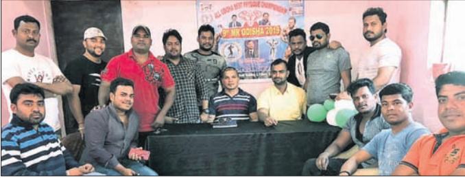
ଆୟୋଜିତ ପ୍ରସ୍ତୁତି ବୈଠକରେ ଆସୋସିଏଟର ସଭ୍ୟମାନେ ।