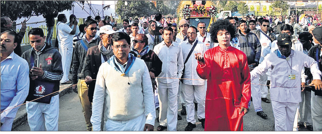
ଶୋଭାଯାତ୍ରା ବନ୍ଦୀ ପରିକ୍ରମା କରୁଛି ।