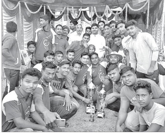
ଡ୍ରିମ୍ ସହ ଚାମ୍ପିୟନ ବଳର ଖେଳାଳି ।