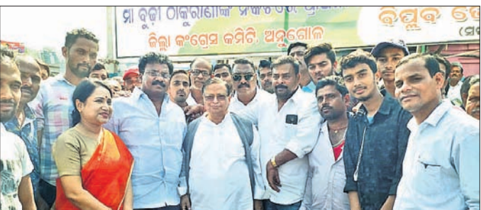
ପିସିସି ସଭାପତି ନିରଞ୍ଜନ ପଟ୍ଟନାୟକଙ୍କ ସହ ଦଳୀୟ କର୍ମକର୍ମୀମାନେ ।