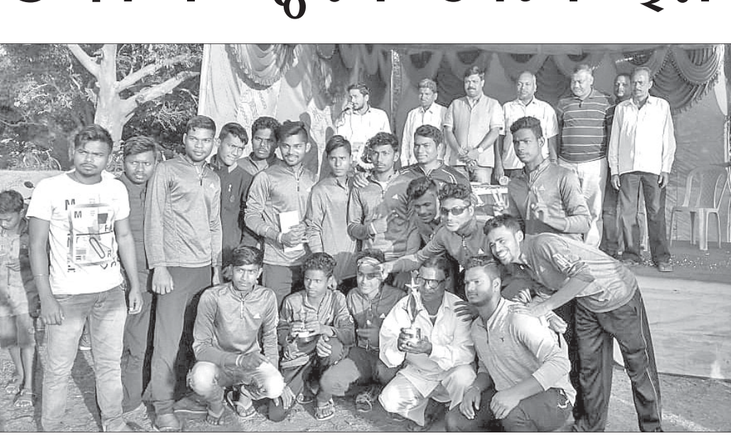
ଡ୍ରିମ୍ ସହ ଅତିଥିକ ଗହଣରେ ଚାମ୍ପିୟନ ବଳ ।