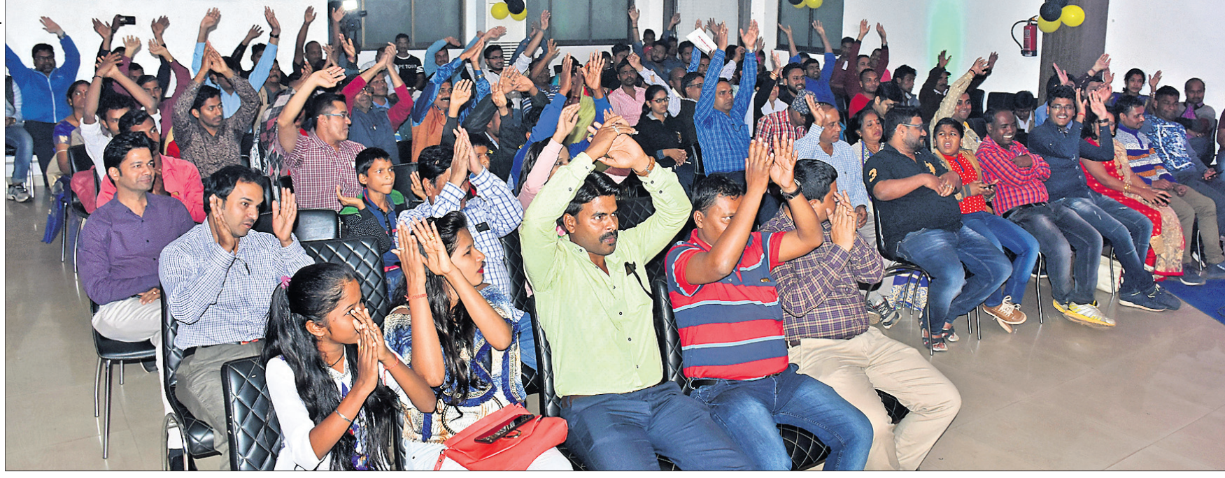
ପୁରସ୍କାର ବିତରଣ ଉତ୍ସବରେ ଉପସ୍ଥିତ ପାଠିକାପାଠକ, ବିଜେତା।