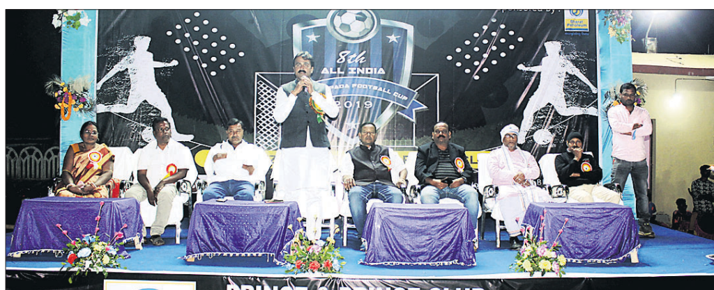
ରୁନିମେଶ୍ ଉଦ୍‌ଘାଟନା ଉତ୍ସବରେ ମଞ୍ଚାସୀନ ଅତିଥିମାନେ ।