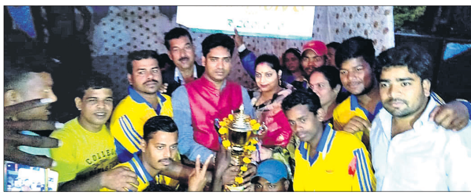
ଅତିଥିକ ରହଣରେ ଗୁଡ଼ି ସହ ଚାମ୍ପିୟନ ଦଳର ଖେଳାଳିମାନେ ।