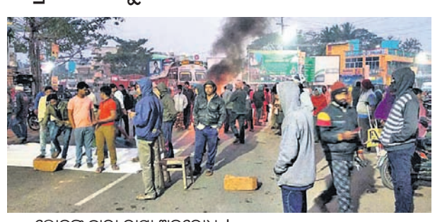
ଲୋକଙ୍କ ଦ୍ଵାରା ରାସ୍ତା ଅବରୋଧ।