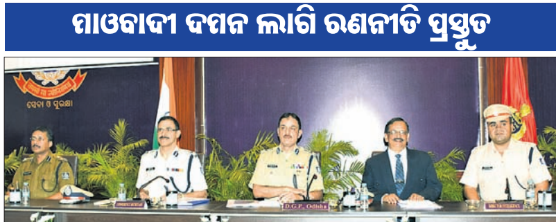
ମାଓବାଦୀ ଦମନ ଲାଗି ରଣନୀତି ପ୍ରସ୍ତୁତ