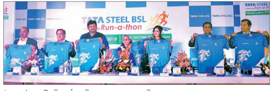
'ରନାଥନ୍' ଗଣଦୌଡ଼ ଟି-ସାର୍ଟକୁ ଅଭିଯାନରେ ଉନ୍ମୋଚନ କରୁଛନ୍ତି।