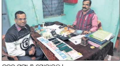
ଜବତ ଟଙ୍କା ଓ ମୋବାଇଲ ।

ତାଳଚେର, ୧୭।୧(ଡି.ପ୍ର.): ସେଣ୍ଟ୍ରାଲ କଲୋନା ଜଙ୍ଗଲରେ ଚାଲିଥିବା ଏକ କୁଆ ଆଞ୍ଚା ଉପରେ ବୁଧବାର ରାତିରେ ପୋଲିସ ଚଢ଼ାଉ କରିଛି । ଚଢ଼ାଉରେ ୫ ଜଣଙ୍କୁ ଗିରଫ କରାଯିବା ସହ ୧ଲକ୍ଷ ୮୪ ହଜାର ଟଙ୍କା, ୬ଟି ମୋବାଇଲ, ୧୫ ବାଇକ ଜବତ କରିଛି । ଗିରଫମାନେ ହେଲେ