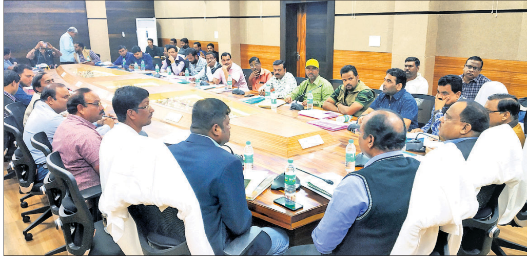
ଆୟୋଜିତ ଖବରଦାତା ସମ୍ମିଳନୀରେ ଜିଲାପାଳ କାର୍ଯ୍ୟକ୍ରମ ସମ୍ପର୍କରେ ସୂଚନା ଦେଇଛନ୍ତି।

ଅନୁଗୋଳ ଅଫିସ, ୧୦।୧ ଜିଲା ସଂସ୍କୃତି ପରିଷଦର ସପ୍ତମ ଜିଲା ମହୋତ୍ସବ ଆସନ୍ତା ୧୪ରୁ ୧୬ ତାରିଖ ଯାଏ ଅନୁଷ୍ଠିତ ହେବ। ଏହି ସମୟରେ ସ୍ଵାତିୟମ ପଡ଼ିଆରେ ପଲ୍ଲିଗ୍ରାମେଳା ■ ଆକର୍ଷଣ ସାଜିବ ଓଲିଭର୍ ନାଇଟ୍ ■ ପଲ୍ଲିଗ୍ରାମ ମେଳାରେ ଲାଗିବ ୮୦ ଝୁଲ ■ ଆୟୋଜିତ ହେବ ଯୋଗ, ପ୍ରାଣାୟାମ କାର୍ଯ୍ୟକ୍ରମ