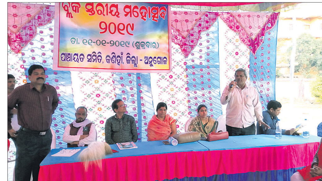
ବୁକ ମହୋତ୍ସବରେ ମଞ୍ଚାଧୀନ ଅତିଥିମାନେ।