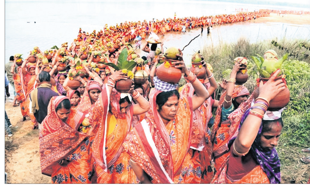
ମହିଳାମାନେ ବ୍ରାହ୍ମଣୀ ନଦୀରୁ କଳସ ଶୋଭାଯାତ୍ରାରେ ଆସୁଛନ୍ତି।

ଓଡ଼ାପଡ଼ା, ୧୧/୧୧(ଡି.ଏନ୍.ଏ.) ଡେକାନାଲ ଜିଲ୍ଲା ଓଡ଼ାପଡ଼ା ବ୍ଲକ୍ ନାଧରା ରାମଚଣ୍ଡୀ ପୀଠରେ ଶୁକ୍ରବାରଠାରୁ ଆରମ୍ଭ ହୋଇଛି ୨୩ତମ ବିଶ୍ୱଶାନ୍ତି ଶ୍ରୀବିଷ୍ଣୁ ମହାଯଜ୍ଞ। ଏହି କାର୍ଯ୍ୟକ୍ରମ ୧୪ ତାରିଖ ଯାଏ ଚାଲିବ। ଗୁରୁବାର ବିଧି ଅନୁଯାୟୀ ଅଳ୍ପରାଗୋପଣ କରାଯାଇଥିଲା। ଶୁକ୍ରବାର ମାଂଙ୍କ ନିକଟକୁ ଆସିଥିବା ଆଖାମାଳ ସ୍ୱପ୍ନେଶ୍ୱର ମନ୍ଦିରରେ ପହଞ୍ଚିବା ପରେ କଳସ ଯାତ୍ରା ଆରମ୍ଭ ହୋଇଥିଲା। ଏଥିରେ ସାମିଲ ହୋଇଥିଲେ ୩୦୦୮ ମହିଳା ଶ୍ରଦ୍ଧାଳୁ। ବ୍ରାହ୍ମଣୀ ନଦୀ ତଟରୁ ଉତ୍ତ କଳସ ଶୋଭାଯାତ୍ରା ବାହାରି ରାମଚଣ୍ଡୀ ପୀଠକୁ ଆସିଥିଲା। ସେଠାରେ ଶ୍ରଦ୍ଧାଧିକାରୀଙ୍କ ପରେ ଘଣ୍ଟପାଠ କରାଯାଇଥିଲା। ଶନିବାର ସୂର୍ଯ୍ୟପୂଜା, ଶନିଦେବଙ୍କ ଚୈକାନ୍ତପେକ, ଗୋପୂଜା, ବାହୁପୂଜା, ଚଣ୍ଡାପାଠ ଅନୁଷ୍ଠିତ ହେବ। ୧୩ ତାରିଖରେ ଶ୍ରୀ ଗୋକନକେଶ୍ୱର ମହାଦେବଙ୍କ ରୂପାଭିଷେକ କରାଯିବ। କାର୍ଯ୍ୟକ୍ରମ