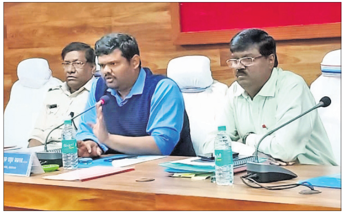
ବୈଠକରେ ଜିଲ୍ଲାପାଳଙ୍କ ସମେତ ଅନ୍ୟମାନେ।