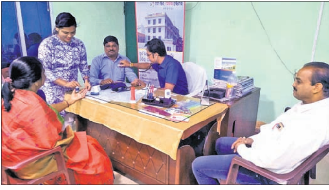
ଶିବିରରେ ଜଣେ ମହିଳାଙ୍କ ସ୍ୱାସ୍ଥ୍ୟପରୀକ୍ଷା କରାଯାଇଛି।