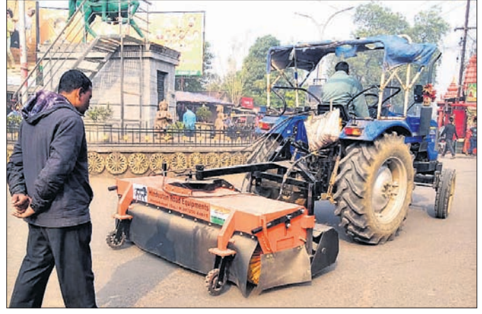
ଅନୁଗୋଳ ଅଫିସ, ୧୧୧୧

ଅନୁଗୋଳ ସହରରେ ପ୍ରଥମ ଥର ପାଇଁ ରାସ୍ତା ସଫେଇ କାର୍ଯ୍ୟ ମେଶିନ୍ ମାଧ୍ୟମରେ କରାଯାଇଛି। ଶୁକ୍ରବାର ପରାମ୍ପାମୂଳକ ଭାବେ ବସ୍ତୁକ୍ଷା ପାଖରୁ ବଜାରଛକ ପର୍ଯ୍ୟନ୍ତ ମେଶିନ୍ ଚଳାଯାଇଥିଲା। ସଫେଇ କାର୍ଯ୍ୟରେ ପ୍ରଥମଥର ପାଇଁ ମେଶିନ୍ ଲାଗାଯାଇଥିବା ନିର୍ବାହୀ ଅଧିକାରୀ ଶୁଭେନ୍ଦୁ କେନା ସୂଚନା ଦେଇଛନ୍ତି। ଏପରି କି କହିଛନ୍ତି, ସମସ୍ତେ ପର୍ଯ୍ୟଟ ପରାମ୍ପାମୂଳକ ଭାବେ ମେଶିନ୍ ସଫେଇ କାର୍ଯ୍ୟରେ ନିୟୋଜିତ ହେବ। ପରେ ଏହାକୁ ପୂର୍ଣ୍ଣ