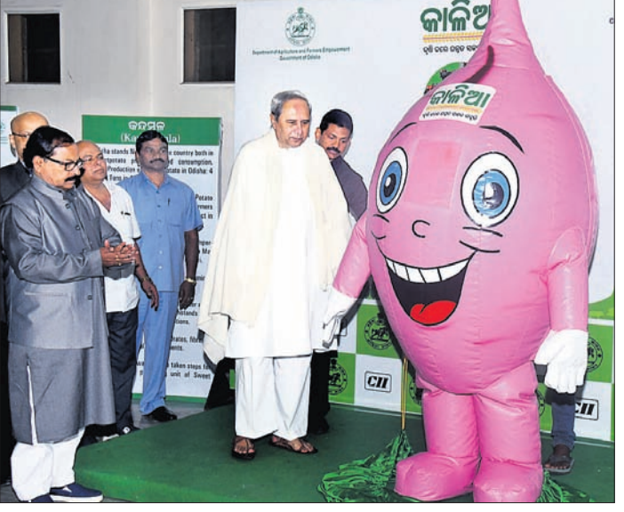
ସମ୍ବଲପୁରରେ 'କୃଷି-୨୦୧୯' ମାନ୍ୟତା ଉଦ୍ଘାଟନ କରୁଥିବା ମୁଖ୍ୟମନ୍ତ୍ରୀ ନବୀନ ପଟ୍ଟନାୟକ। ଫସଲ ଓ ଚାଷୀମାନଙ୍କୁ ଖାଦ୍ୟ ନିରାପତ୍ତା, କେନ୍ଦ୍ରୀୟ କର ଜାତୀୟ ଫସଲ ପୁଷ୍ଟି ଯୋଗାଣରେ ଏହା ବିଶେଷ ଗବେଷଣା କେନ୍ଦ୍ର (ସିଟିଆରଆଇ) ସହାୟକ ହୋଇପାରିବ। ଭୁବନେଶ୍ୱରସ୍ଥିତ

ମୁଖ୍ୟମନ୍ତ୍ରୀ ନବୀନ ପଟ୍ଟନାୟକ ଶୁକ୍ରବାର ସମ୍ବଲପୁରରେ 'କୃଷି-୨୦୧୯' ଲୋକାଭିମୁଖୀ ଉଦ୍ଘାଟନ କରିଛନ୍ତି। ଓଡ଼ିଶା କନ୍ୟାମୂଳ ଉତ୍ପାଦନରେ ପ୍ରଥମ ସ୍ଥାନ ଅଧିକାର କରିଛି। ଏଥିପାଇଁ କୃଷି-୨୦୧୯ରୁ ଚୟନ କରାଯାଇଛି। କନ୍ୟାମୂଳ ଜିନିଷ-ଏ'ରେ ପରିଚିତ। ଏହାକୁ ବିପର୍ଯ୍ୟୟ ପ୍ରଶମନ ଶକ୍ତି କୁହାଯାଇଥାଏ। ବାତ୍ୟା ଓ ମରୁଡ଼ି ସମୟରେ ଏହି ଶକ୍ତି ଉତ୍ପାଦନ ହୋଇଥାଏ। କନ୍ୟାମୂଳ ଏକ ଲାଭଜନକ ଫସଲ, ଯାହା କି ମହାପ୍ରଭୁ ଶ୍ରୀଜଗନ୍ନାଥଙ୍କ ସମସ୍ତ ଦେଖାରେ ବ୍ୟବହୃତ ହୁଏ। ସମଗ୍ର ଦେଶରେ କନ୍ୟାମୂଳ ଉତ୍ପାଦନରେ ଓଡ଼ିଶା ପ୍ରଥମ ସ୍ଥାନ ଅଧିକାର କରିଛି। ରାଜ୍ୟରେ ସମୁଦାୟ ୪୦,୪୦୯ ହେକ୍ଟର ଜମିରେ ଏହା ଚାଷ କରାଯାଏ। ସେଥିରୁ ମୋଟ ୩.୮୨ ଲକ୍ଷ ମେଟ୍ରିକ ଟନ୍ ଉତ୍ପାଦିତ ହୋଇଥାଏ। ଜିନିଷ-ଏ'ରେ ପରିଚିତ ଏହି ଫସଲର ୨ଟି କିସମ କଞ୍ଚନଗଡ଼ ଓ ବିଧାନକୋଷିତ ଭାଗରେ ଅତ୍ୟନ୍ତ ଆଦୃତ ଲାଭ କରିଛି। ଏହି ଫସଲ ଓ ଚାଷର ଆୟତନ ବୃଦ୍ଧି ପାଇଁ ଗେରୁ ନାମକ ଏକ ପ୍ରକଳ୍ପ ୨୦୧୬-୧୭ରୁ ରାଜ୍ୟରେ ଅନୁଷ୍ଠାନିତ ହେଉଛି। ଆଜି କେନ୍ଦ୍ର ଆନୁକୁଲ୍ୟରେ ଗଞ୍ଜାମ, ତେଜନାଳ, କୋରାପୁଟ ଓ ସୁନ୍ଦରଗଡ଼ ଜିଲ୍ଲାରେ କାର୍ଯ୍ୟ କରୁଛି। ଏହାଦ୍ୱାରା ୬ ହଜାର ଚାଷୀଙ୍କୁ ସହାୟତା ଯୋଗାଇ ଦିଆଯାଉଛି। ପ୍ରାକୃତିକ ବିପର୍ଯ୍ୟୟ ଯୋଗୁଁ କ୍ଷତିଗ୍ରସ୍ତ ହେଉଥିବା