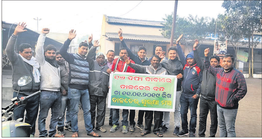
ତାଳଚେର ସୁରକ୍ଷା ମଞ୍ଚ ପକ୍ଷରୁ ଆନ୍ଦୋଳନ ଚାଲିଛି।