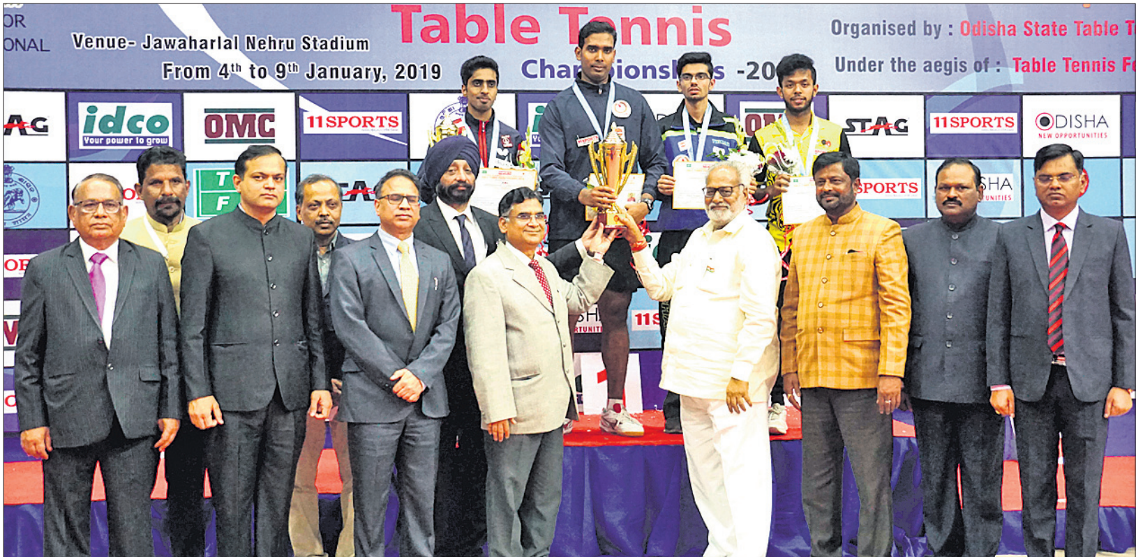
କଟକରେ ଅନୁଷ୍ଠିତ ଜାତୀୟ ଚେମ୍ପିୟନସ୍ ଟେନିସ୍ ଚାମ୍ପିୟନସ୍‌ସିପର ପୁରୁଷ ବିଭାଗ କୁଟା ପ୍ରତିଯୋଗୀଙ୍କୁ ଅତିଥି ପୁରସ୍କୃତ କରୁଛନ୍ତି।

- ଷ୍ଟିଫେନ କନିଙ୍ଗ୍‌ଟନ, ଭାରତୀୟ ପୁରୁଷ ଦଳର କୋଚ୍