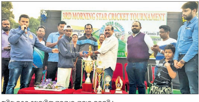
ଅତିଥି ଜଣେ ଖେଳାଳିଙ୍କୁ ପୁରସ୍କାର ପ୍ରଦାନ କରୁଛନ୍ତି।