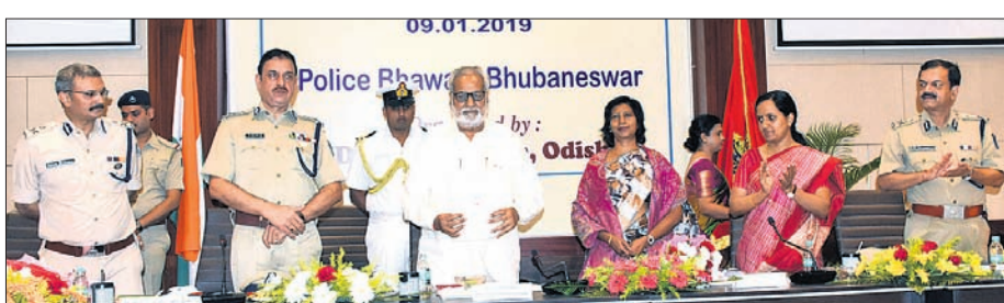
ପୋଲିସ ଭବନରେ ଆୟୋଜିତ ମାନବଚାଲଣ ସମ୍ପର୍କିତ ସମ୍ମିଳନୀରେ ରାଜ୍ୟପାଳ ପ୍ରଫେସର ଗଣେଶୀ ଲାଲ ଓ ଅନ୍ୟମାନେ।