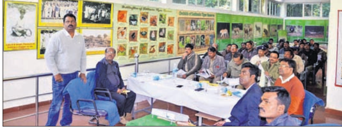
ଗଣନା ପାଇଁ ଅଧିକାରୀମାନେ କର୍ମଚାରୀଙ୍କୁ ତାଲିମ ପ୍ରଦାନ କରୁଛନ୍ତି ।