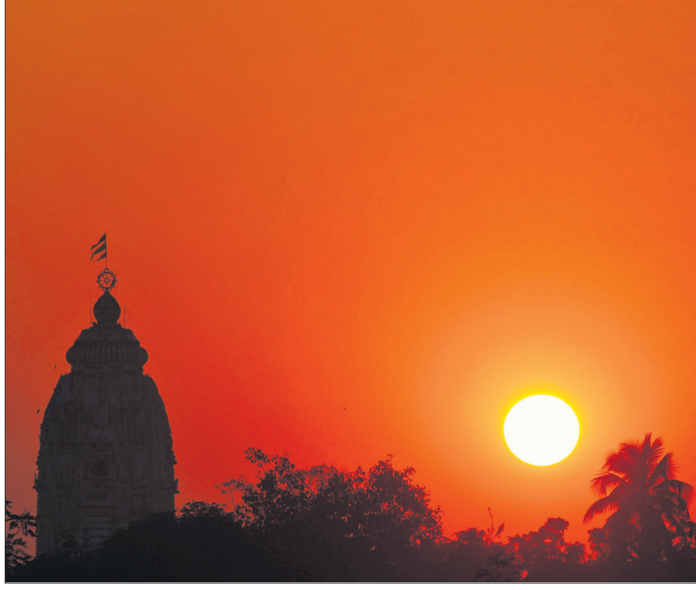
ଅନୁଗୋଳ ଶୈଳଶ୍ରୀକ୍ଷେତ୍ର ମନ୍ଦିର ନିକଟରୁ ବିବାହୀ ବର୍ଷର ଶେଷ ଅଧିବାସୀ ପୂର୍ଣ୍ଣିମା ।