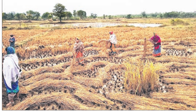
ଧାନବିଲରେ ପଡ଼ିଥିବା ଫସଲ ନଷ୍ଟ।

ଚାଷୀଙ୍କ ବର୍ଷକର ହାଡ଼ଭଙ୍ଗା ପରିଶ୍ରମକୁ ମାତ୍ର କେଳିଯାଏ। ମଧ୍ୟରେ ସ୍ୱାହା କରିଦେଇଛି ସାମୁଦ୍ରିକ ଝଡ଼ 'ପେଥାଇ'। ଫସଲ ଅମଳ ସମୟରେ ଲଗାଣ ବର୍ଷା ବୋହଲାଇ ଦେଇଛି ଚାଷୀଙ୍କ ମେତୁଦଣ୍ଡ। ଜମିରେ ବର୍ଷାପାଣି ଲହଡ଼ି ଭାଙ୍ଗୁଥିବାବେଳେ ଭିଜିଯାଇଥିବା ଧାନ ଦେଖି ହତାଶ ହୋଇପଡ଼ିଛନ୍ତି ଢେଙ୍କାନାଳ ଜିଲାର ଚାଷୀ।