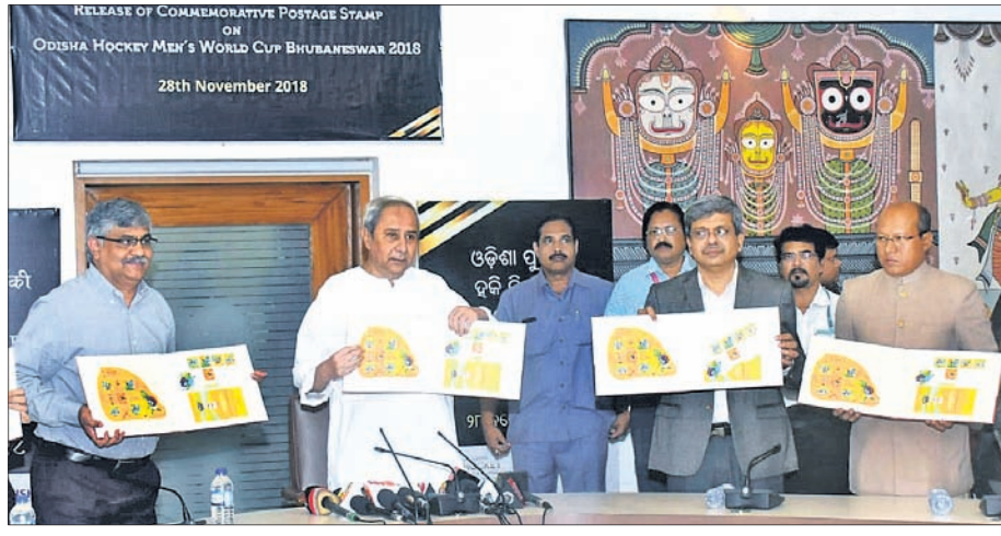
ରୁପବାର ସଚିବାଳୟରେ ମୁଖ୍ୟମନ୍ତ୍ରୀ ନବୀନ ପଟ୍ଟନାୟକ ଓ ବରିଷ୍ଠ ଅଧିକାରୀମାନେ ହକି ବିଶ୍ୱକପ ସ୍ମାରକୀ ସମ୍ବନ୍ଧରେ ଉନ୍ନୋତ୍ତର କରୁଛନ୍ତି।

ମୁଖ୍ୟମନ୍ତ୍ରୀ ନବୀନ ପଟ୍ଟନାୟକ କଲେ ଉନ୍ନୋତ୍ତର