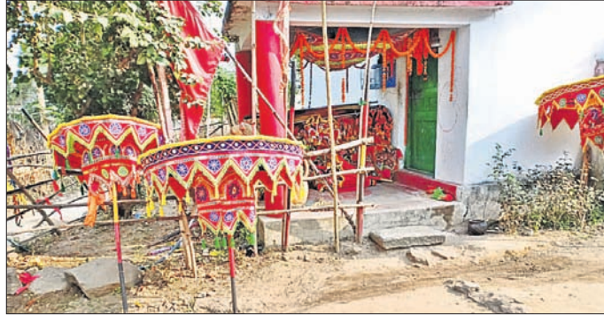
ଠାକୁରାଣୀଙ୍କର ଆଳମ ଘର ।

ବର୍ଷରପାଳ ବୃକ୍ଷ ଚୁକ୍‌ସାପାଳ ଓ ଗଡ଼ସମ୍ପା ଗ୍ରାମର ଅଧିକାରୀ ଦେବୀ ମା' ଲୋଭାଙ୍କ ପ୍ରତିଷ୍ଠା ଉତ୍ସବ ଯୋଗ୍ୟରେ ଉତ୍ସାହପୂର୍ଣ୍ଣ ଭାବରେ ପାଳନ ହେଉଛି । ଏହି ଯାତ୍ରା ଦେଖିବା ପାଇଁ ବହୁ ଶ୍ରଦ୍ଧାଳୁଙ୍କ ସମାଗମ ହୋଇଥିଲା ।