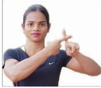
Dutee Chand Sports Personality