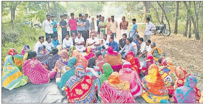
ବୈଠକରେ ଉପସ୍ଥିତ ଗ୍ରାମବାସୀ ଓ ବିଜେଡି ନେତାମାନେ ।

ବର୍ଷରପାଳ ବ୍ଲକ ଗୋଟମରା ଗ୍ରାମ ଗିରିଗୋବର୍ଦ୍ଧନ ନଗରସୋଲିକ ସମସ୍ୟା ବୁଝିଲେ କେଳାନାଳ-ଅନୁରାଗ ଏମ୍ପି ଚିଠିପାଠ ସମୟରେ ପଚାରି ବୁଝିଲେ ଏମ୍ପିଙ୍କ ପ୍ରତିନିଧି ପହଞ୍ଚିବା ପରେ ଗ୍ରାମବାସୀ ପୁଷ୍ଟଗୁରୁ ବେଜୁ ଚାକ୍ ବିପୁଳ ସମ୍ପର୍କରେ ଖାପନ କରିଥିଲେ । ଏହି ଅବସରରେ ସେ ଲୋକମାନଙ୍କ ବିଭିନ୍ନ ସମସ୍ୟା ସମ୍ପର୍କରେ ପଚାରି ବୁଝିବା ସହ ଗ୍ରାହାର ସମାଧାନ କିପରି କରାଯିବ ସେ ନେଇ ଆଲୋଚନା କରିଥିଲେ । ବିଶେଷକରି ନବୀନ ସରକାରଙ୍କ ଜନକଲ୍ୟାଣକାରୀ ଯୋଜନାଗୁଡ଼ିକର ସୁଫଳ ଠିକ୍ ଭାବେ ଲୋକମାନେ ପାଇଛନ୍ତି କି ନାହିଁ ତାହା ଉପରେ ଗୁରୁତ୍ୱ ଦେଇଥିଲେ । ବିଭାଗୀୟ ଅଧିକାରୀଙ୍କ ସହ ଯୋଗାଯୋଗ କରି ଲୋକମାନଙ୍କ