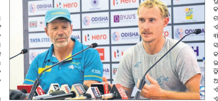
ଖବରଦାତା ସମ୍ମିଳନୀରେ ଅଷ୍ଟ୍ରେଲିଆ କୋଚ୍ ଓ ଅଧିନାୟକ ।

ହକି ବିଶ୍ୱକପ୍‌ରେ ଅଷ୍ଟ୍ରେଲିଆ ଇତିହାସ ସୃଷ୍ଟି କରିବା ଲକ୍ଷ୍ୟରେ ରହିଛି । ଗତ ଦୁଇଟି ସଂସ୍କରଣରେ ଅଷ୍ଟ୍ରେଲିଆ ଦମ୍ଭାବୀ ପ୍ରଦର୍ଶନ କରି ଚାଲିଗଲ ହାସଲ କରିଥିଲା । ଏଥର ମଧ୍ୟ ସେହି ସଫଳତାକୁ ଦୋହରାଇ ଅଷ୍ଟ୍ରେଲିଆ ବାକି ମାରିବା ଲକ୍ଷ୍ୟରେ ରହିଛି । ଏହା କରିପାରିଲେ ୨୦୨୦ ଅଲିମ୍ପିକ୍ସ ପର୍ଯ୍ୟନ୍ତ ଅଷ୍ଟ୍ରେଲିଆ ହକି ଦଳ ସେଠାକାର ସରକାରଙ୍କଠାରୁ ନିରବହନ ଭାବେ ପାଣି ହାସଲ କରିପାରିବ ।