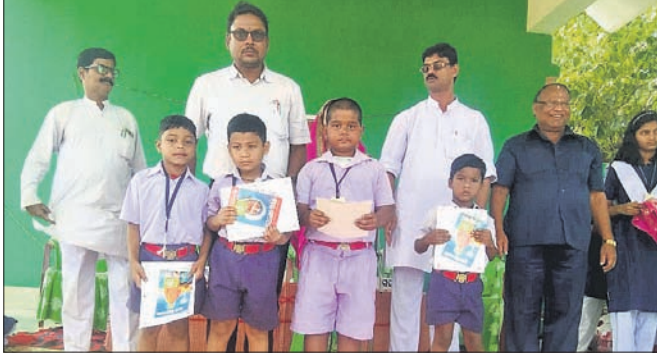
ବାର୍ଷିକ ଖେଳକୁଳ ସମାରୋହର କୃତୀ ପ୍ରତିଯୋଗୀମାନେ।

ଓଡ଼ାପଡ଼ା, ୨୮।୧୧(ଡି.ଏନ.ଏ.) ଦେଶାନ୍ତରାଳ ଜିଲ୍ଲା ଓଡ଼ାପଡ଼ା ବ୍ଲକ୍ ଅନ୍ତର୍ଗତ ସିନିନିକ ସରସ୍ୱତୀ ଶିଶୁ ବିଦ୍ୟାଳୟରେ ବାର୍ଷିକ ଖେଳକୁଳ ସମାରୋହ କରାଯାଇଛି।