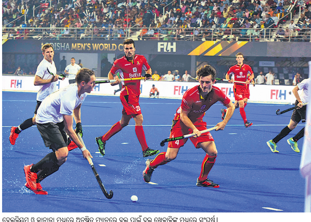
ବେଲଜିୟମ ଓ କାନାଡ଼ା ମଧ୍ୟରେ ଅନୁଷ୍ଠିତ ମ୍ୟାଚରେ ବଲ୍ ପାଇଁ ଦୁଇ ଖେଳାଳିଙ୍କ ମଧ୍ୟରେ ସଂଘର୍ଷ।

ଭୁବନେଶ୍ୱର, ୨୮।୧୧ (କ୍ରୀଡ଼ା ପ୍ରତିନିଧି) ଓଡ଼ିଶା କ୍ରୀଡ଼ା ଇତିହାସରେ ଯୋଡ଼ି ହୋଇଛି ନୂଆ ଫର୍ଯ୍ୟ। ମଙ୍ଗଳବାରର ଉଦ୍‌ଘାଟନା ସମାରୋହ ପରେ ବୁଧବାର ଆରମ୍ଭ ହୋଇଛି ହକି ମହାସର୍ବମ। ଭାରତରେ ଦୁତୀୟ ଏବଂ ଓଡ଼ିଶାରେ ପ୍ରଥମଥରପାଇଁ ଆୟୋଜନ ହେବାକୁ ଯାଉଥିବା ହକି ବିଶ୍ୱକପରେ ପ୍ରଥମ ବିଜୟ ସ୍ୱାପ୍ତ ଚାହୁଁଛି ଅନ୍ୟତମ ଚାଲଚଳ ଦାଦିଦାର ବେଲଜିୟମ। ପୁଲ୍ ସିଂ ଏହି ମ୍ୟାଚରେ କାନାଡ଼ାକୁ ୨-୧ ଗୋଲରେ ହରାଇ ଆଗକୁ ବଢ଼ିଛି ବେଲଜିୟମ। ଆକର୍ଷଣୀୟ ପ୍ରଦର୍ଶନ ପାଇଁ ବେଲଜିୟମର ୪ ନମ୍ବର ଖେଳାଳି ଭାନ୍ ଡୋରେନ ଆଥର୍ ଫ୍ରେୟର ଅଫ ଦି ମ୍ୟାଚ ବିବେଚିତ ହୋଇଥିଲେ। ଭାରତୀୟ ଦଳର ପୂର୍ବତନ ଅଧିନାୟକ ଧନରାଜ ପିଲ୍ଲେ ଅତିଥିଭାବେ ଯୋଗଦେଇ ତାଙ୍କୁ ୫୦,୦୦୦ଟଙ୍କାର ଚେକ୍ ପଦାନ କରାଯିବ।