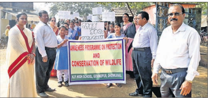
ଶୋଭାଯାତ୍ରାରେ କ୍ଷାତ୍ରାକ୍ଷାତ୍ରାଣ୍ଡୁ ଏବଂ ଶିକ୍ଷୟିତ୍ରୀଶିକ୍ଷକ।

ହାତରେ ପ୍ଲାକାର୍ଡ, ବ୍ୟାନର। ଯୋଗାନରେ ବନ୍ୟଜନ୍ତୁ ସଂରକ୍ଷଣ ବାର୍ତ୍ତା। ଶୋଭାଯାତ୍ରା ମାଧ୍ୟମରେ ଏପରି ସଚେତନତା ସୃଷ୍ଟି କରିଛନ୍ତି ଦେଶାନ୍ତରାଳ ସଦର ବ୍ଲକ୍ ଗୋବିନ୍ଦପୁର କେ.ପି.