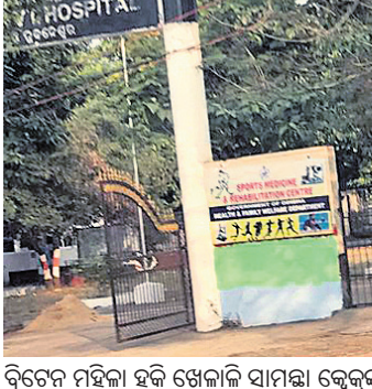
ବ୍ରୁନେନ ମହିଳା ହକି ଖେଳାଳି ସାମନ୍ତ କେନ୍ଦ୍ର ଚିତ୍ର କାନ୍ଧରେ ଅଟା ହୋଇଛି।

କେତେକ ଅଭିଜ୍ଞ ଖେଳାଳି ଅବସର ଗ୍ରହଣ କରିଛନ୍ତି, ତଥାପି ଆର୍ଜେଣ୍ଟିନା ଦଳ କିଛି ବେଶ୍ ସଜ୍ଜିତ ମନେହେଉଛି। ଅନ୍ୟପଟେ ସ୍ୱେନ୍ ବିଶ୍ୱ ର୍ୟାଙ୍କିଂର ଅଷ୍ଟମ ସ୍ଥାନରେ ରହିଛି। ହକି ବିଶ୍ୱକପର ପ୍ରଥମ ସଂଘରଣ ସ୍ୱେନ୍‌ରେ ହିଁ ଆୟୋଜନ ହୋଇଥିଲା। ପୁଣି ଏହି ଦଳ ବିଶ୍ୱକପରେ ୩ଥର ପୋଡ଼ିୟମ୍ ଫିନିଶ୍ କରି ନିଜକୁ ଏକ ବିଶ୍ୱପୁରାଣ ଦଳ ବୋଲି ପ୍ରମାଣିତ କରିଛି। ଇତିମଧ୍ୟରେ ସ୍ୱେନ୍ ଦଳ ସମୟ ଅନୁସାରେ ବିଭିନ୍ନ ପର୍ଯ୍ୟାୟ ଦେଇ ଗତି କରିବା ସହ ଯଥେଷ୍ଟ ଉନ୍ନତ କରିଛି। ବର୍ତ୍ତମାନ ଅଭିଜ୍ଞ ଓ ଯୁବ ଖେଳାଳିଙ୍କୁ ନେଇ ସ୍ୱେନ୍ ଦଳ ବେଶ୍ ସଜ୍ଜିତ ମନେହୁଏ। ସ୍ୱେନ୍ କ୍ୱାର୍ଟର ଫାଇନାଲକୁ ଉଠିବା ନିଶ୍ଚିତ ମନେହୁଏ। ଏଥିସହିତ ମେଡାଲ ରାଉଣ୍ଡରେ ମଧ୍ୟ ଏହି ଦଳ ପ୍ରଦେଶ କରିବାର ଯଥେଷ୍ଟ ସମ୍ଭାବନା ରହିଛି।