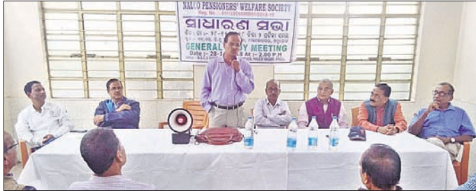
ବୈଠକରେ ଉପସ୍ଥିତ କର୍ମକର୍ତ୍ତା ଓ ସଦସ୍ୟମାନେ ।