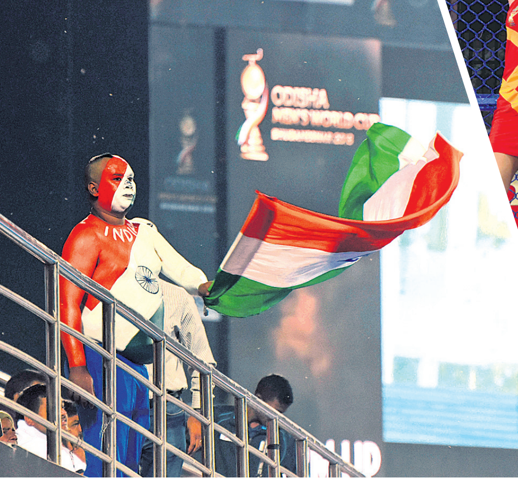
ଉଲ୍ଲସିତ ଭାରତୀୟ ପ୍ରଶଂସକ।

ଭୁବନେଶ୍ୱର, ୨୮।୧୧ (ସ୍ୱାସ୍ଥ୍ୟ ସ୍ୱରୋ) - ଗୁରୁବାର ଦ୍ୱିତୀୟ ମ୍ୟାଚରେ ପୁଲ୍ ସିଂର ଦ୍ୱିତୀୟ ଦଳ ନ୍ୟୁଜିଲାଣ୍ଡ ଓ ଫ୍ରାନ୍ସ ପରସ୍ପରକୁ ଭେଟିବେ। ନ୍ୟୁଜିଲାଣ୍ଡ ଆନ୍ତର୍ଜାତିକ ହକି ଫେଡେରେଶନ (ଏଫଆଇଏଚ୍) ର୍ୟାଙ୍କିଂରେ ନବମ ସ୍ଥାନରେ ରହିଛି। ଅନ୍ୟପଟେ ଫ୍ରାନ୍ସ ବିଶ୍ୱ ର୍ୟାଙ୍କିଂର ବିଂଶତମ ସ୍ଥାନରେ ରହିଛି। ୧୯୭୬ରେ ନ୍ୟୁଜିଲାଣ୍ଡ ଅଲିମ୍ପିକ୍ ସ୍ୱର୍ଣ୍ଣ ପଦକ ହାସଲ କରି ଇତିହାସ ସୃଷ୍ଟି କରିଥିଲା। ତେବେ ନ୍ୟୁଜିଲାଣ୍ଡ ଏହି ପ୍ରଦର୍ଶନକୁ ପରେ ଦୋହରାଇବାରେ ସକ୍ଷମ ହୋଇନାହିଁ। ଚଳିତ ବିଶ୍ୱକପରେ ନ୍ୟୁଜିଲାଣ୍ଡକୁ ଅଣ୍ଡରଡଗ୍ ବୋଲି ବିବେଚନା କରାଯାଉଛି। ପୂର୍ବର ବିଫଳତାକୁ ପଛରେ ପକାଇ ନୂଆ ଦଳ ଭାବେ ନ୍ୟୁଜିଲାଣ୍ଡ ଏହି ମେଗା ଇଭେଣ୍ଟରେ ନିଜର ଚମକ ଦେଖାଇବା ଲକ୍ଷ୍ୟରେ ରହିଛି। ଅପରପକ୍ଷରେ ଫ୍ରାନ୍ସ ପୁଲ୍ ସିଂରେ ସବୁଠାରୁ ଦୁର୍ବଳ ଦଳ ରୂପେ ପରିଗଣିତ ହେଉଛି। ହକିରେ ଫ୍ରାନ୍ସର ଇତିହାସ ସେତେଦୂର ବଳିଷ୍ଠ ନୁହେଁ। ତେବେ ବିଗତ କିଛିବର୍ଷ ମଧ୍ୟରେ ଫ୍ରାନ୍ସ ପ୍ରଦର୍ଶନରେ ଆଖିବୁଜି ଆଣି ଉନ୍ନତ ହୋଇଛି।