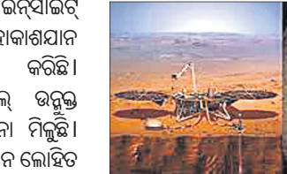
ଗବେଷଣା ସଂସ୍ଥା ପକ୍ଷରୁ କୁହାଯାଇଛି। ଉକ୍ତ ସେକ୍ଟ୍ରାଲ୍ ପ୍ରତ୍ୟେକ ଦିନ ଏହାର ବ୍ୟାଚେରି ରିପୋର୍ଟ କରିପାରିବ।

ଝିଣ୍ଟିଂଟନ୍: ସୋମବାର ମଙ୍ଗଳ ଗ୍ରହରେ ଇନ୍‌ସାଇଟ୍ ଅବତରଣ କରିବାପରେ ଉକ୍ତ ମହାକାଶଯାନ ପୃଥିବୀକୁ ସଙ୍କେତ ପଠାଇବା ଆରମ୍ଭ କରିଛି। ମଙ୍ଗଳରେ ଏହାର ସୋଲାର ପ୍ୟାନେଲ୍ ଉନ୍ମୁଳ୍ତ ରହି ସୂର୍ଯ୍ୟଲୋକ ସଂଗ୍ରହ କରୁଥିବା ସୂଚନା ମିଳୁଛି। ନାସାର ମାର୍ସ ଓଡ଼େସି ସେକ୍ଟ୍ରାଲ୍ ସର୍ବେକ୍ଷଣ ଲୋହିତ ଗ୍ରହକୁ ପରିକ୍ରମା କରୁଛି। ଏହା ପୃଥିବୀକୁ ସଙ୍କେତ ପ୍ରେରଣ କରୁଛି। ସୋମବାର ୮.୩୦ ଇଣ୍ଟର୍ଣ୍ଣାସ୍ତ୍ର ଚାଳନରେ ଏହି ସଙ୍କେତ ପୃଥିବୀକୁ ଆସିଥିବା ଆମେରିକାର ମହାକାଶ