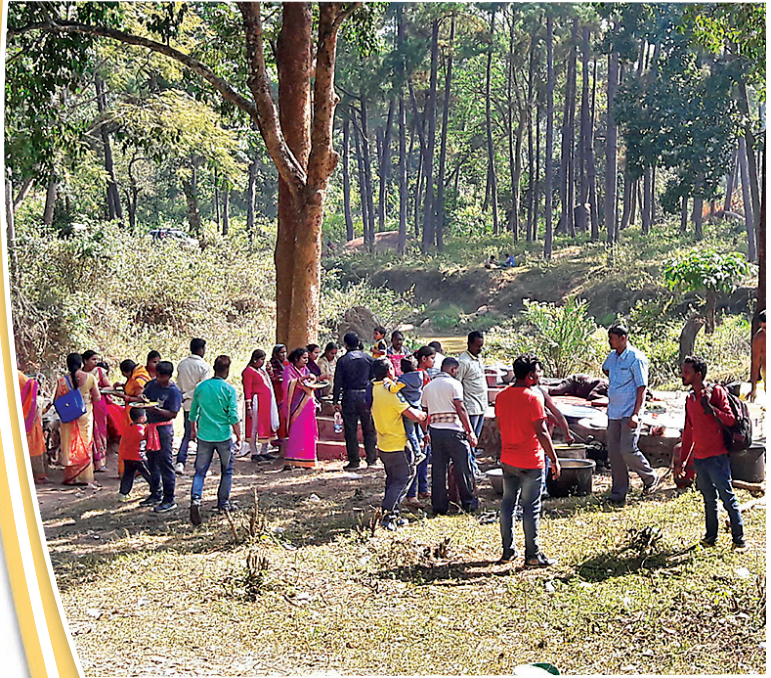
ପ୍ରସ୍ତୁତି: ଅରୁଣ କୁମାର ସାହୁ, ଦାରିଙ୍ଗବାଡ଼ି

ସେପେୟରରୁ ମାର୍ଚ୍ଚ ପର୍ଯ୍ୟନ୍ତ ପର୍ଯ୍ୟଟକଙ୍କ ଭିଡ଼ ଜମିଥାଏ। ତେବେ ପର୍ଯ୍ୟଟକ ଦାରିଙ୍ଗବାଡ଼ି ଆସିଲେ ସମସ୍ତ ପର୍ଯ୍ୟଟନ କେନ୍ଦ୍ରଗୁଡ଼ିକ ବୁଲିବା ସହ ଓଲଟିପାଇନ ବଣରେ ଭୋଜି କରି ଖାଇବା ସହ ମଜା ନିଅନ୍ତି। ବଡ଼ ବଡ଼ ପାଇନ ଗଛ ତଳେ ଯାନ ବାହନ ପାର୍କିଂ ବ୍ୟବସ୍ଥା ରହିଛି। ସେଠାରେ ହିଁ ବଣ ଭୋଜି କରିବା ସହ ନାଚ ଓ ଗୀତ ଆଦି କରି ବହୁତ ମଜା ଉଠାଉଥିବା ଜଣାପଡ଼ିଛି। ପାଇନ ବଣଟି ପ୍ରାୟ ୨ କି.ମି. ପର୍ଯ୍ୟନ୍ତ ଲମ୍ବିଛି। ବନ ବିଭାଗ ଦ୍ୱାରା ପରିଚାଳିତ ଏହି ପାଇନ ବଣ ଅତି ପୁରୁଣା ହୋଇଥିବା ବେଳେ ପାଇନ ଗଛର ସୌନ୍ଦର୍ଯ୍ୟ ଓ ଶାନ୍ତ ପରିବେଶ ପର୍ଯ୍ୟଟକଙ୍କୁ ଆକୃଷ୍ଟ କରୁଛି। ଦିନ ତମାମ୍ ସେଠାରେ ଥଣ୍ଡା ଲାଗିବା ସହ ବଣ ଭୋଜିର ବ୍ୟବସ୍ଥା ରହିଛି। ଉକ୍ତ ବଣ ମଧ୍ୟରେ ଏକାଥରେ ୫ ହଜାର ପର୍ଯ୍ୟନ୍ତ ପର୍ଯ୍ୟଟକ ଭିଡ଼ ଜମାଇଥିବା ନଜିର ରହିଛି। ପାଇନ ବଣକୁ ଲାଗି ଏକ ଝରଣା ପ୍ରବାହିତ ହେଉଛି। ଶାନ୍ତ ପରିବେଶ ସହ ଝରଣା ପାଣିର କୁହୁକୁହୁ ଶବ୍ଦ ପର୍ଯ୍ୟଟକଙ୍କୁ ଅଧିକ ଆକୃଷ୍ଟ କରିଥାଏ। ସେହିପରି ଯେଉଁ ନାଳ ପ୍ରବାହିତ ହେଉଛି ସେଠାରେ ଏକ ପଥର ଖସଡ଼ା ରହିଛି। ତାହା ମଧ୍ୟ ପର୍ଯ୍ୟଟକଙ୍କୁ ଆକୃଷ୍ଟ କରୁଛି। ଦାରିଙ୍ଗବାଡ଼ିରୁ ପୂର୍ବଦିଗର ରାସ୍ତାର ବ୍ରାହ୍ମଣାଗାଁ ଦେଇ ଗଜପତି ଯିବା ରାସ୍ତାର ୨ କି.ମି. ଯିବା ପରେ ରାସ୍ତାର ଉଭୟ ପାର୍ଶ୍ୱରେ ଏହି ପାଇନ ବଣ ପଡ଼ିଥାଏ।