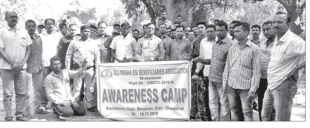
ବୈଠକରେ ଉପସ୍ଥିତ ବିଭିନ୍ନ କମ୍ପାନୀର କର୍ମଚାରୀମାନେ ।

କର୍ମଚାରୀ ଯୋଗଦେଇଥିଲେ । ଇଏସ୍ଆଇ ମେଡିକାଲରେ ଡାକ୍ତର ଅଭାବ, ଉଚ୍ଚତମାନର ଚିକିତ୍ସା ସୁବିଧା, ୨୪ ଘଣ୍ଟିଆ ସେବା, ଅତ୍ୟାବଶ୍ୟକ ଔଷଧ ମହତ୍ତ୍ୱପୂର୍ଣ୍ଣ ରଖିବା, କର୍ମଚାରୀ ଓଡ଼ିଆ ଭାଷାରେ ଚିକିତ୍ସା ପ୍ରଦାନ ଆଲୋଚନା କରାଯାଇଥିଲା ।