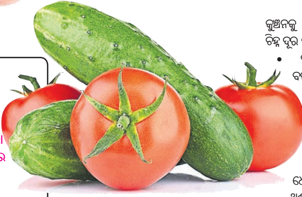
କୁଖିନକୁ ଦୂର କରିବା ସହିତ ଦାଗ, ଚିହ୍ନ ଦୂର କରିଥାଏ।

ସାଧାରଣତଃ ଶୀତଦିନେ ହୃତ ରୁଣ୍ଡ ଲାଗିଥାଏ। ହୃତାର ଚମକ ନଷ୍ଟ ହୋଇଥାଏ। ସୁନ୍ଦର ହୃତ ପାଇଁ ଅନେକ ବିନ୍ଦୁତିପାଲିର ବୌଦ୍ଧିକା ସହ ବହୁ ଚକା ମଧ୍ୟ ଖର୍ଚ୍ଚ କରିଥାନ୍ତି। କିନ୍ତୁ ଫଳ ବିପରୀତ ହୋଇଥାଏ। ଏହା ସାମୟିକ ଭାବେ ହୃତରେ ଚମକ ଦେଉଥିଲେ ମଧ୍ୟ ପରେ ବହୁତ କ୍ଷତି କରିଥାଏ। ଏଥିରେ ଚମକ ଆଣିବା ପାଇଁ ଆସନ୍ତୁ ଜାଣିବା ହୃତାର ଉପଚାର ବିଷୟରେ।