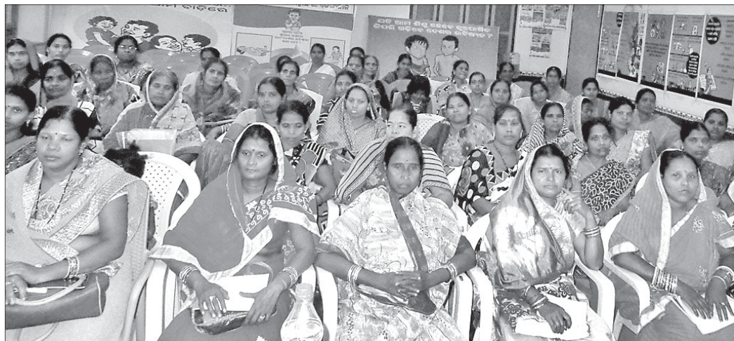
ସମ୍ମିଳନୀରେ ଉପସ୍ଥିତ ମହିଳା ପ୍ରତିନିଧିମାନେ ।

ରାଜ୍ୟର କୌଣସି ବ୍ୟକ୍ତି ଭୋକରେ ରହିବେ ନାହିଁ ନିରନ୍ତର ପୁଷ୍ଟିକର ଖାଦ୍ୟ ପାଇବେ । ଏପରି ମହତ୍ତ୍ୱ ଉଦ୍ଦେଶ୍ୟ ରଖି ଆରମ୍ଭ ହୋଇଛି ଖାଦ୍ୟସୁରକ୍ଷା ଯୋଜନା ।