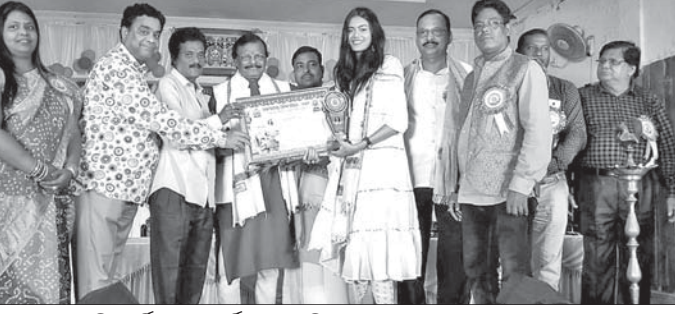
ଅତିଥିମାନେ ସଦା ପ୍ରିୟଦର୍ଶିନୀଙ୍କୁ ସମର୍ଥନ କରୁଛନ୍ତି ।

ଦେଶାନ୍ତର ସାଂସ୍କୃତିକ ଅନୁଷ୍ଠାନ ମାଲକୋମିଡିଆ ବାର୍ଷିକ ଉତ୍ସବ ସମାରୋହ ସମାପନ କରିଥିଲା ।