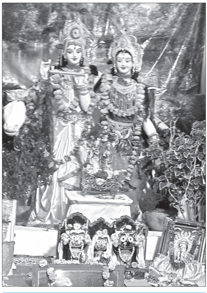
ଗ୍ରାମାଞ୍ଚଳକୁ ମାଡ଼ିଲାଣି ସହରୀ ଚଳଣିର ଝୁଲୁ ପ୍ରତିକୃତ ପରମ୍ପରାରେ ବାରି ହୋଇପାରୁଛି ଆଧୁନିକତାର ଛାପା ହେଲେ ଅନେକ ସ୍ଥାନରେ ଗ୍ରାମବାସୀଙ୍କ ନିଷ୍ଠାପର ଉଦ୍ୟମରେ ବଞ୍ଚୁଛି ପ୍ରାଚୀନ ଓଡ଼ିଆ ପରମ୍ପରା । କାନପୁରୀର ପ୍ରସିଦ୍ଧ ଶରତରାସ ମହୋତ୍ସବ ସେଥିରୁ ଗୋଟିଏ...

ଧର୍ମମାସ କାର୍ତ୍ତିକ । ଆଧ୍ୟାତ୍ମିକ ଦୃଷ୍ଟିକୋଣରୁ ଓଡ଼ିଶାର ପୁରପଲ୍ଲୀରେ ରହିଛି ଏହାର ସ୍ୱତନ୍ତ୍ରତା ।