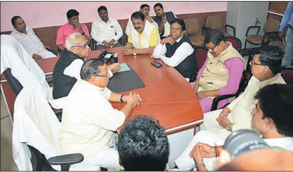
ଶାସକ ଦଳର ବୈଠକ