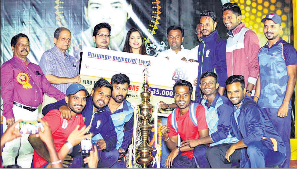
ଚାମ୍ପିୟନ ରାଜ୍ୟ ସୁତେଣୁ ଦଳର ଖେଳାଳିମାନେ ରୁପି ସହ ଅତିଥିଙ୍କ ଗହଣରେ ।