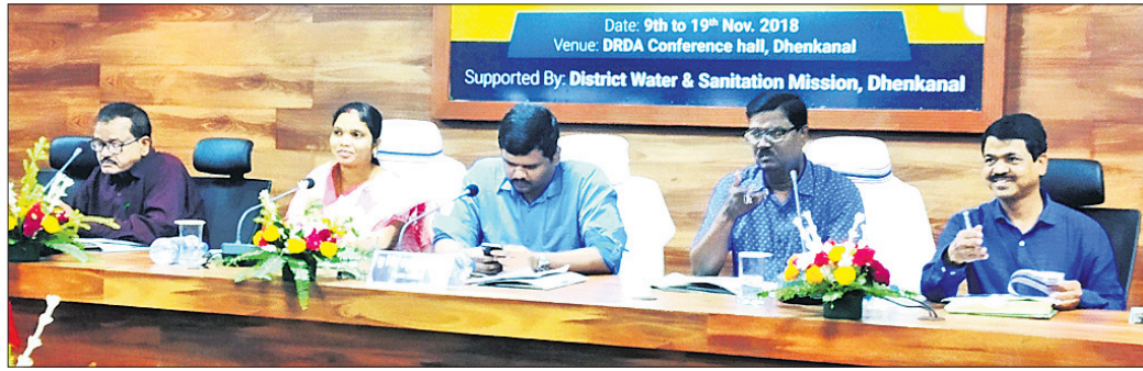
କାର୍ଯ୍ୟକ୍ରମରେ ମଞ୍ଚାସୀନ ଅତିଥିମାନେ।

ସ୍ୱଚ୍ଛ ଓଡ଼ିଶା ଓ ସ୍ୱଚ୍ଛ ଓଡ଼ିଶା କାର୍ଯ୍ୟକ୍ରମ ମାଧ୍ୟମରେ ବିଶ୍ୱ ପାଇଖାନା ଦିବସ ପାଇଁ ଉପଲକ୍ଷେ ଶୁକ୍ରବାର ଓଡ଼ିଶା ଆରମ୍ଭ ହୋଇଛି ୧୦ଦିନିଆ ପ୍ରଚାର ଅଭିଯାନ।