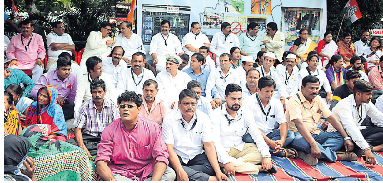
ଭୁବନେଶ୍ୱରରେ ଆରବିଆଇ କାର୍ଯ୍ୟକ୍ରମ ସମ୍ବନ୍ଧରେ ଶୁକ୍ରବାର କଂଗ୍ରେସର ନେତା ଓ କର୍ମୀଙ୍କ ଧାରଣା।

ବିପ୍ଳବୀକରଣର ଦୁଇବର୍ଷ ପୂର୍ତ୍ତି ହୋଇଛି। ପ୍ରଧାନମନ୍ତ୍ରୀ ନରେନ୍ଦ୍ର ମୋଦିଙ୍କ ଏହି ଘୋଷଣାର ଦୁଇବର୍ଷ ପୂର୍ତ୍ତି ଉପଲକ୍ଷେ ସରକାର ଓ ବିରୋଧୀ ଦଳଗୁଡ଼ିକ ପରସ୍ପରକୁ କାହାଡ଼ି ଫିଙ୍ଗିବା ଆରମ୍ଭ କରିଛନ୍ତି।