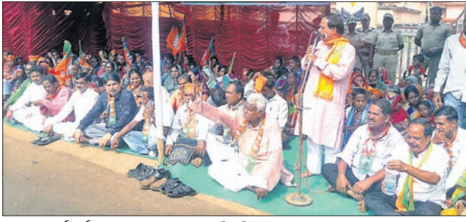
ଭାଜପା କର୍ମକର୍ତ୍ତାମାନେ ବୁକ୍ ଯୋରାଉ କରିଛନ୍ତି।