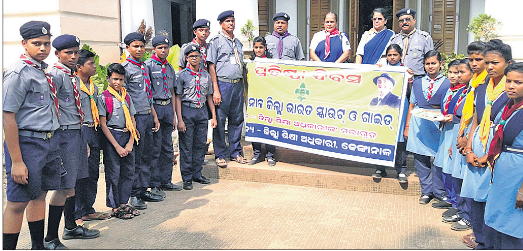
ସ୍କାଉଟ୍ ଏବଂ ଗାଇଡ୍ ଦିବସରେ ଏକାଠି ହୋଇଥିବା ଛାତ୍ରଛାତ୍ରୀ।

ଡେକାନାଲ ଜିଲା ଶିକ୍ଷା ଅଧିକାରୀଙ୍କ କାର୍ଯ୍ୟକ୍ରମରେ ଶୁକ୍ରବାର ଭାରତ ବ୍ୟବହାର ଲାଗି ପଠାଇଛି। ଏ ନେଇ ଅପମୃତ୍ୟୁ ମାମଲା (ନଂ. ୩୪/୧୮) ଗୁରୁ କରାଯାଇଛି।