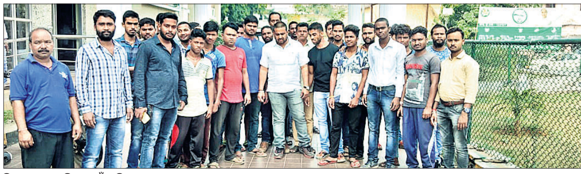
ଜିଲ୍ଲାପାଳଙ୍କୁ ଭେଟିବା ପାଇଁ ଆସିଥିବା ଗ୍ରାମବାସୀ।

ଅନୁଗୋଳ ଜିଲ୍ଲା ସୁକୁରସିଂହା ବଣିଆ ବାହାଳ ଦେଇ ପ୍ରବାହିତ ଲିଙ୍ଗରା ନଦୀ ପ୍ରଦୂଷିତ ହେଉଛି। ଏ ନେଇ ଲିଙ୍ଗରାଦେଓ ଗ୍ରାମବାସୀ ଶୁକ୍ରବାର ଜିଲ୍ଲାପାଳଙ୍କ ଠାରେ ଅଭିଯୋଗ କରିଛନ୍ତି। ସେମାନେ ଦର୍ଶାଇଛନ୍ତି ଯେ, ଆନନ୍ଦ ବଜାର ନିକଟରେ ଥିବା ଏକ ଘରୋଇ ନର୍ସିଂହୋମ ଅନେକ ସମୟରେ ନଦୀକୁ ଆବର୍ଜନା ପାଣି ଛାଡୁଛି। ଏଥିପାଇଁ ନଦୀପାଣି ଦୂଷିତ ହେଉଛି। ପାଣି ବ୍ୟବହାର କରି