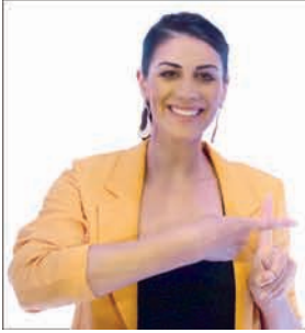
STEPHANIE RICE Swimmer - Olympic Medallist