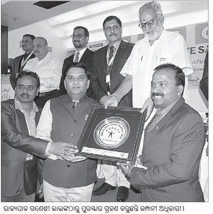
ରାଜ୍ୟପାଳ ଗଣେଶୀ ଲାଲଙ୍କଠାରୁ ପୁରସ୍କାର ଗ୍ରହଣ କରୁଛନ୍ତି କମ୍ପାନୀ ଅଧିକାରୀ।

ଟିଆରବି ଖଣିର ଡି.ଏମ.ଏ. (ଡି.ଏମ.ଏ.) ସୁରକ୍ଷା ସମ୍ପନ୍ନ ଭାବେ ପଦକ୍ଷେପ ନେଇଥିବାରୁ ରାଜ୍ୟ ସରକାର ତାଙ୍କୁ ପୁରସ୍କାର କରିଛନ୍ତି। ଟିଆରବି ଖଣିର ଡି.ଏମ.ଏ. (ଡି.ଏମ.ଏ.) ସୁରକ୍ଷା ସମ୍ପନ୍ନ ଭାବେ ପଦକ୍ଷେପ ନେଇଥିବାରୁ ରାଜ୍ୟ ସରକାର ତାଙ୍କୁ ପୁରସ୍କାର କରିଛନ୍ତି। ଟିଆରବି ଖଣିର ଡି.ଏମ.ଏ. (ଡି.ଏମ.ଏ.) ସୁରକ୍ଷା ସମ୍ପନ୍ନ ଭାବେ ପଦକ୍ଷେପ ନେଇଥିବାରୁ ରାଜ୍ୟ ସରକାର ତାଙ୍କୁ ପୁରସ୍କାର କରିଛନ୍ତି।