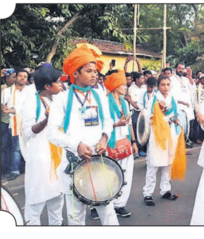
ମହାରାଷ୍ଟ୍ରର ଡୋଲକ ବାଦ୍ୟ ବଳ।