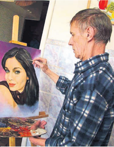
ପ୍ରସିଦ୍ଧ ଚିତ୍ରଶିଳ୍ପୀ ଲେନ୍ ଗୁନ୍ଦ୍ରେଙ୍କ ଦ୍ଵାରା କଳ୍ପାଣୀଙ୍କ ଫଟୋଚିତ୍ର ଅଙ୍କନ