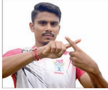
Govinda Poddar Sports Personality