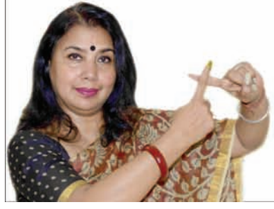
Padma Shri Aruna Mohanty Odissi Danseuse