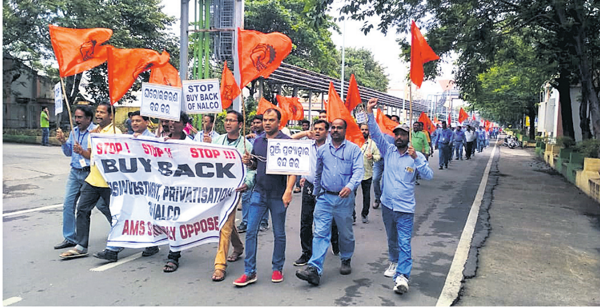
କର୍ମଚାରୀମାନେ ବିକ୍ଷୋଭ ପ୍ରଦର୍ଶନ ପାଇଁ ଶୋଭାଯାତ୍ରାରେ ଯାଉଛନ୍ତି।

କେନ୍ଦ୍ର ଅର୍ଥମନ୍ତ୍ରଣାଳୟର ନିଷ୍ପତ୍ତି ଅନୁଯାୟୀ ଗତ ୧୨ ତାରିଖରେ ଅନୁଗୋଳସ୍ଥିତ ନାଲ୍‌କୋ ବୋର୍ଡ ମିଟିଂରେ ବାଏବ୍ୟାକ୍ ମାଧ୍ୟମରେ ସରକାରଙ୍କ ୩.୪୮ ପ୍ରତିଶତ ଅଂଶଧନ ପ୍ରତ୍ୟାହାର ପାଇଁ ସ୍ଥିର କରାଯାଇଛି।