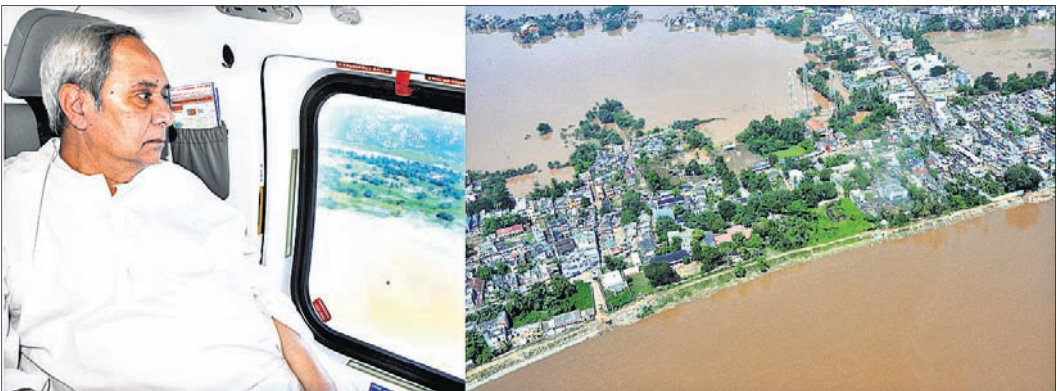
ମୁଖ୍ୟମନ୍ତ୍ରୀ ନବୀନ ପଟ୍ଟନାୟକ ଆକାଶମାର୍ଗରୁ ଗଞ୍ଜାମ ଜିଲ୍ଲାର ବନ୍ୟାଞ୍ଚଳ ପରିଦର୍ଶନ କରୁଛନ୍ତି।