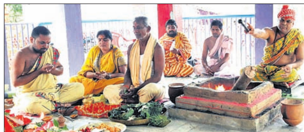
ମା'ଙ୍କ ପୂଜା କାର୍ଯ୍ୟ ଚାଲିଛି।

ଚଳଚ୍ଚେତର ଅଧିଷ୍ଠାତ୍ରୀ ଦେବୀ ମା' ହିଲୁଳାଙ୍କ ଗୋପାଳପ୍ରସାଦପୁତ୍ର ପୀଠରେ ଶାରଦୀୟ ନବରାତ୍ର ପୂଜା ପାଳନ କରାଯାଇଛି। ଗତ ୯ ତାରିଖରୁ ଆରମ୍ଭ ହୋଇଥିବା ଏହି ପୂଜା ବିଜୟାଦଶମୀ ଦିନ ସମାପନ ହେବ। ଆଶ୍ୱିନ ମାସ ଶୁକ୍ଳ ପ୍ରତିପଦା ତିଥିରେ ମା'ଙ୍କ ନବରାତ୍ର ପୂଜା ଅନୁଷ୍ଠିତ ହୋଇଥାଏ। ଦଶ ଦିନ ବ୍ୟାପୀ ଏହି ପୂଜାରେ ପ୍ରଥମ ଦିନସରେ ଶୈଳପୁତ୍ରୀ, ଦ୍ୱିତୀୟ