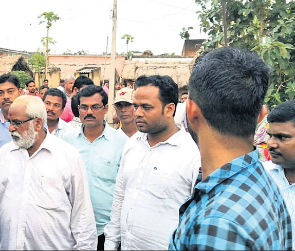
ଏମ୍‌ପିଙ୍କ ଜିଲ୍ଲା ପ୍ରତିନିଧିଙ୍କ ସହ ଏକ ଚିଠି ବାରଗୌଣିଆ ଗ୍ରାମର କ୍ଷତିଗ୍ରସ୍ତଙ୍କୁ ଭେଟୁଛନ୍ତି।

ଅନୁଗୋଳ ବୁକ୍ ବାରଗୌଣିଆ ପଞ୍ଚାୟତ ବାରଗୌଣିଆ ଗାଁରେ ଢେଙ୍କାନାଳ-ଅନୁଗୋଳ ଏମ୍‌ପି ତଥାଗତ ସତପଥୀଙ୍କ ଏକ ପ୍ରତିନିଧି ଦଳ ଶନିବାର ତିର୍ତ୍ତଲି ପ୍ରଭାବିତ ବର୍ଷା କ୍ଷତିଗ୍ରସ୍ତଙ୍କୁ ଭେଟି ସମସ୍ୟା ବୁଝିଛନ୍ତି।