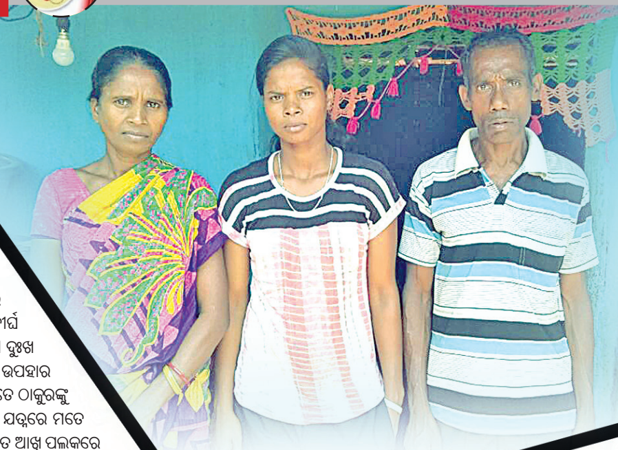
ମା' ବାପାଙ୍କ ସହ ରଣ୍ଡି

ପେଷି ହୋଇଛନ୍ତି ସିନା ମତେ କେବେ ଅଭାବ କ'ଣ ଜଣେଇ ଦେଇ ନାହାନ୍ତି। ପୂର୍ବରୁ ୨ପୁଅ ଓ ଗୋଟିଏ ଝିଅକୁ ହରାଇଥିଲେ ସେମାନେ।